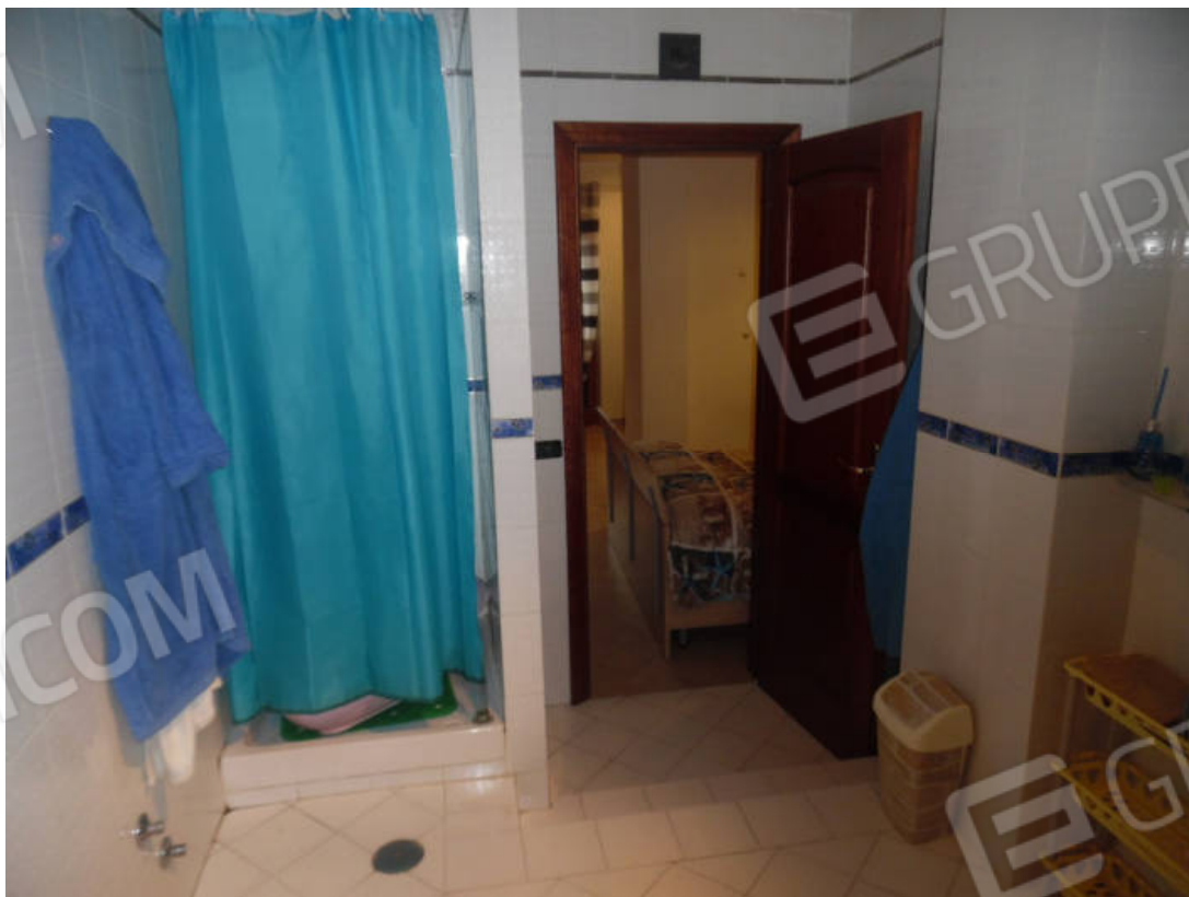
Foto 20: Vista del bagno di pertinenza esclusiva della camera da letto matrimoniale