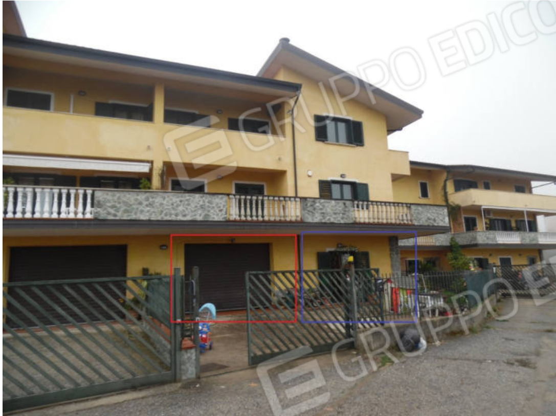
Foto 3: cancello d'ingresso alla corte comune ai sub 10 e 11 (in Blu il Lotto 1 ed in rosso il Lotto 2)