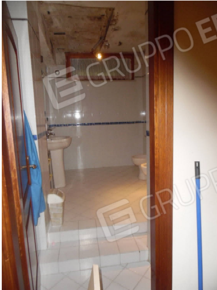
Foto 21: Vista del bagno di pertinenza esclusiva della camera da letto matrimoniale