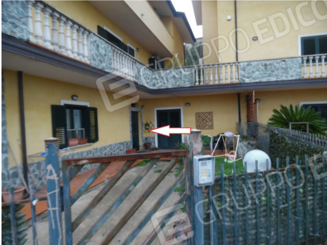
Foto 5: cancello pedonale d'ingresso alla corte comune ai sub 10 e 11 (vista del portone d'ingresso al vano scala)