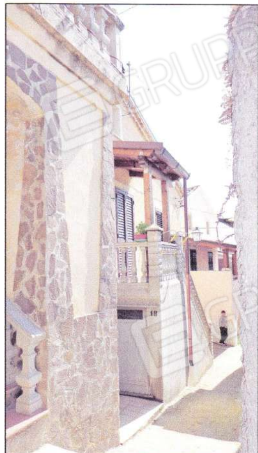
Vista dal retro della scala esterna e del sottoscala