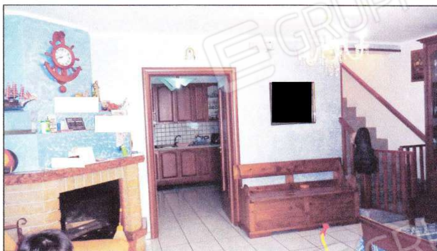
Vista del soggiorno al PT