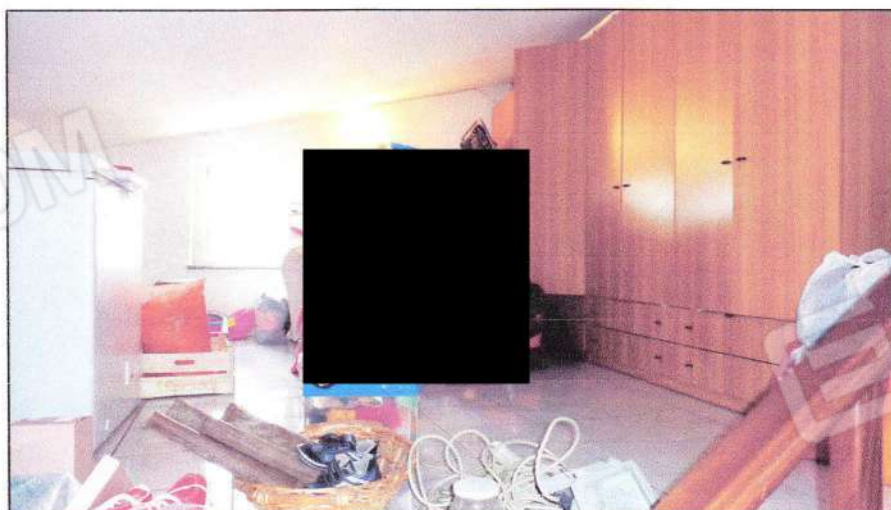
Vista del sottotetto al P2