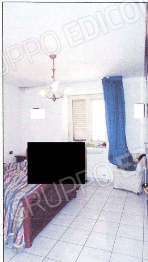
Vista della camera principale al P1