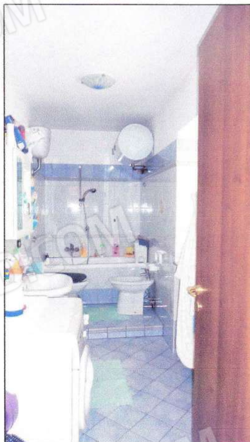
Vista del bagno al P1