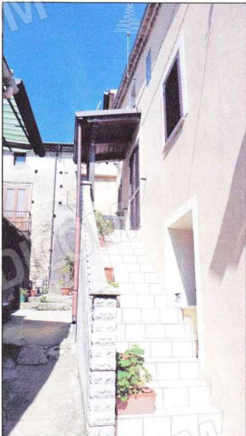
Lato sud-est: scala esterna con tettoia