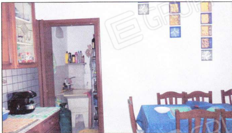
Vista della cucina e del vano ripostiglio-sottoscala al PT