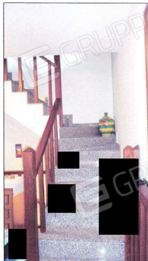
Vista della scala tra P1 e P2