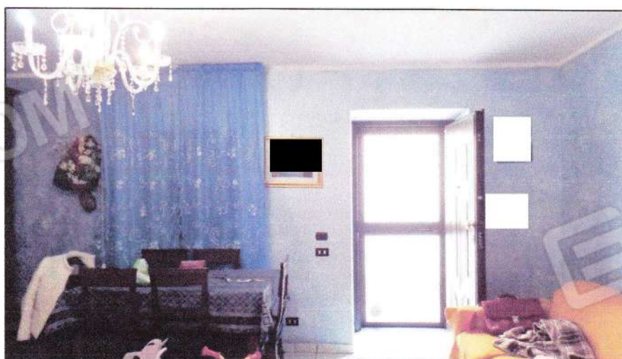
Vista del soggiorno al PT - controcampo