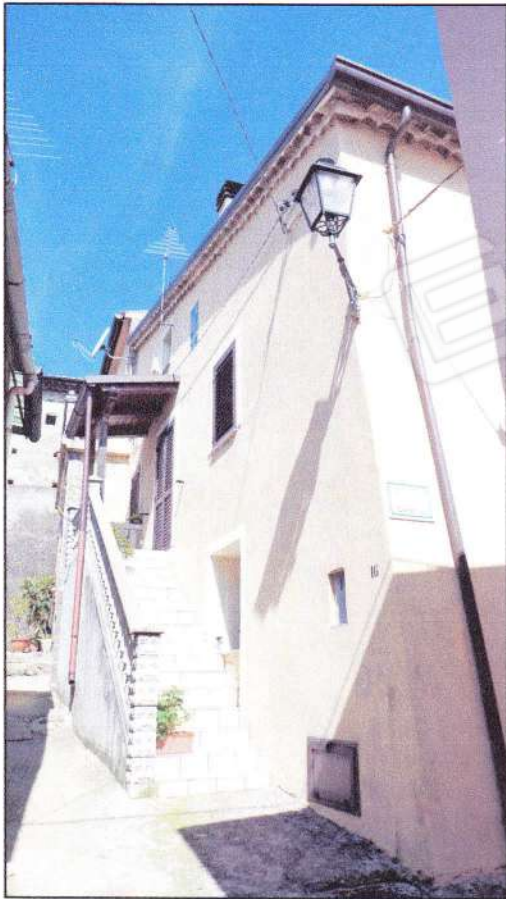
Angolo principale sud-est: scala esterna