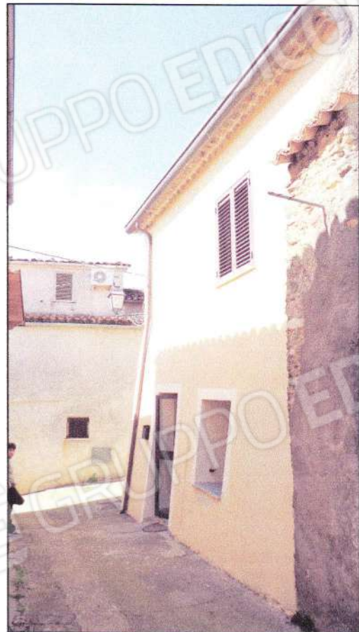
Ingresso principale - lato est (vico III via Caracciolo)