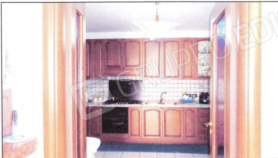
Vista della cucina al PT