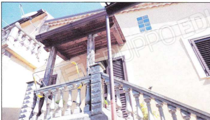
Vista dell'accesso esterno con terrazzino e tettoia