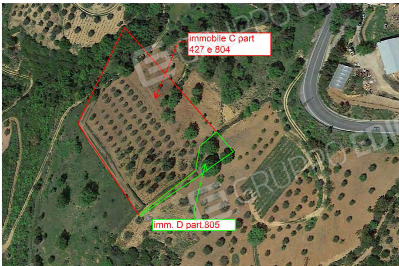
FOTO IMMOBILE C