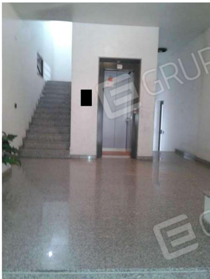
Accesso al locale cantina (foto n°6)