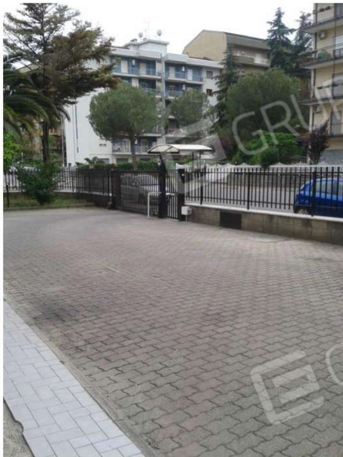
Ingresso condominio (foto n° 4)