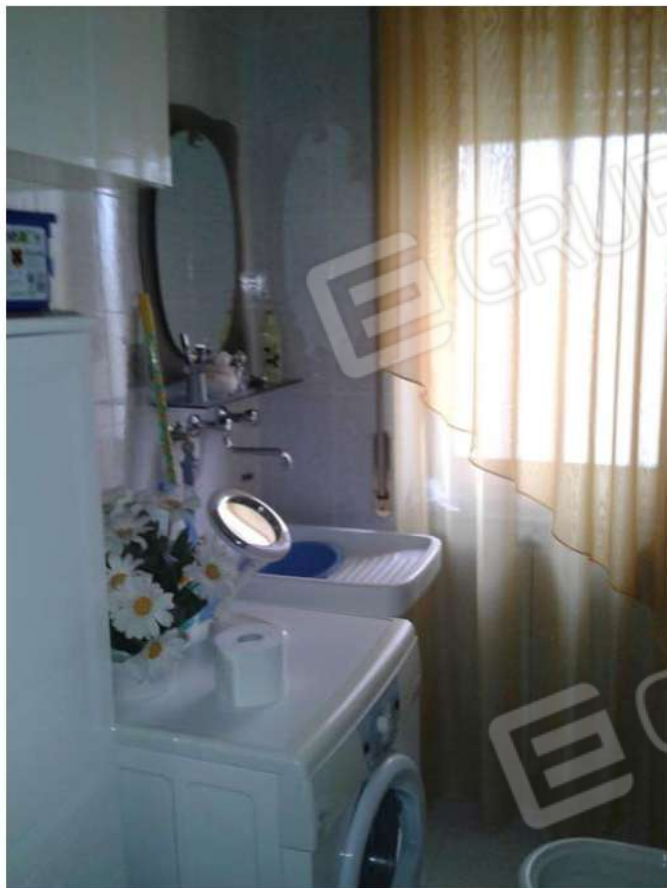
Bagno principale (foto n° 12)