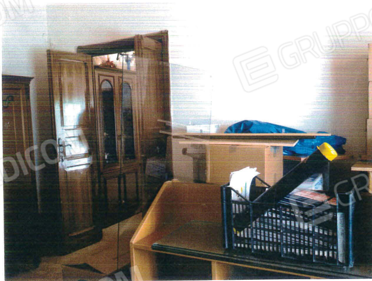
Interno ambienti piano S1