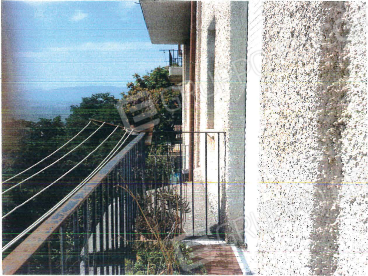
Particolare piano S1