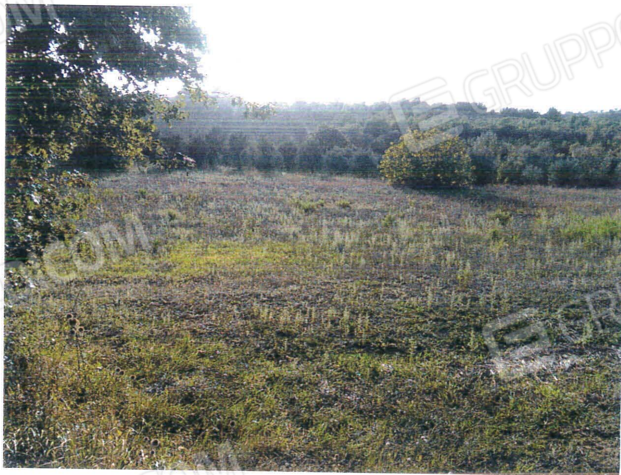
Terreni in località S. Onofrio