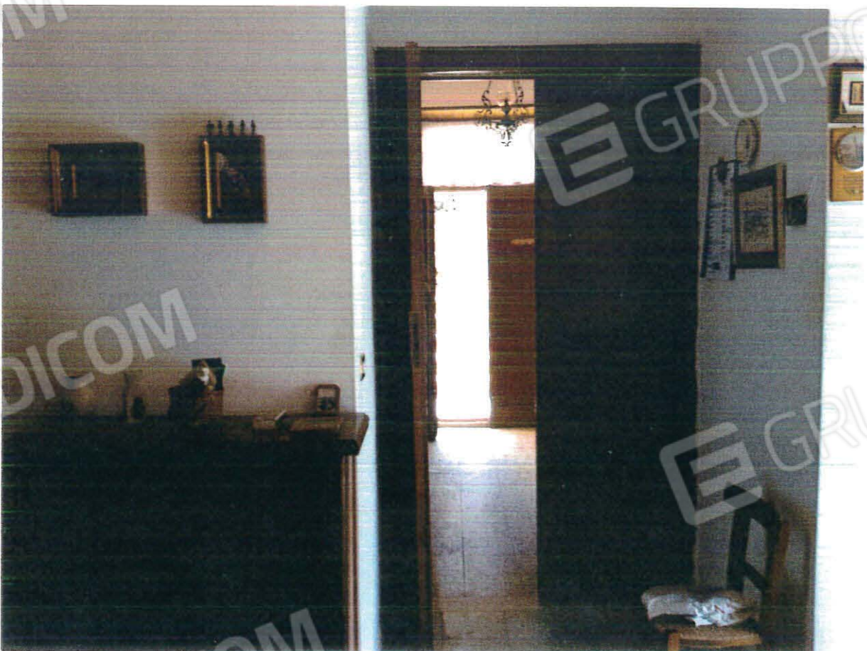
Ingresso piano S1