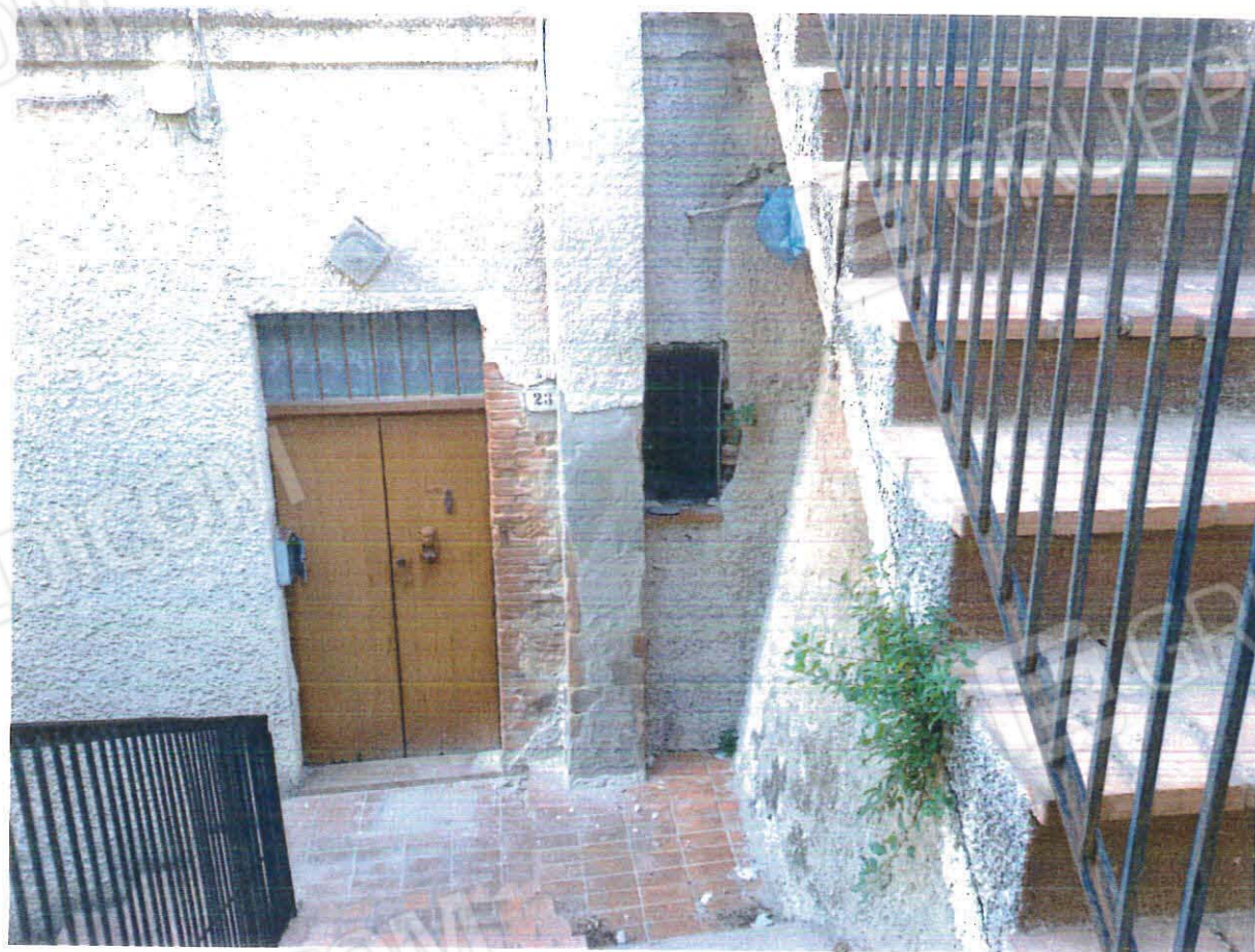
Ingresso principale e scala di accesso