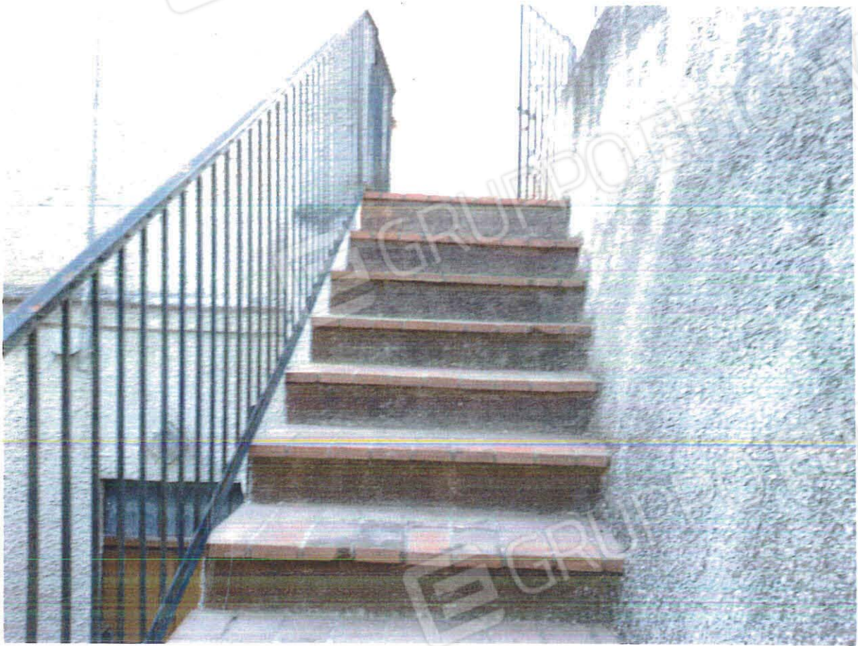
Scala di accesso esterna