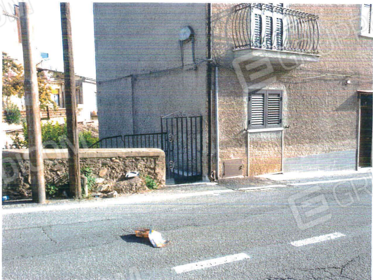
Ingresso da Viale Roma