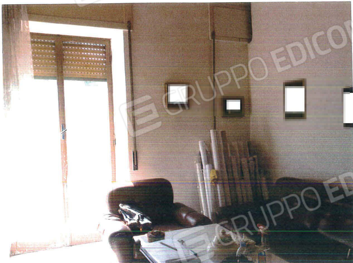
Interno ambienti piano S1