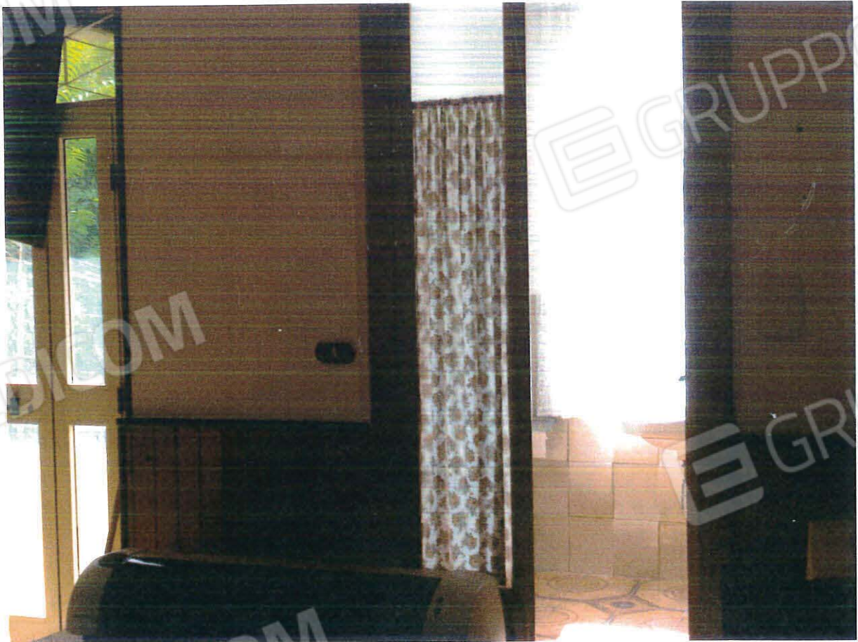
Interno ambienti piano S2