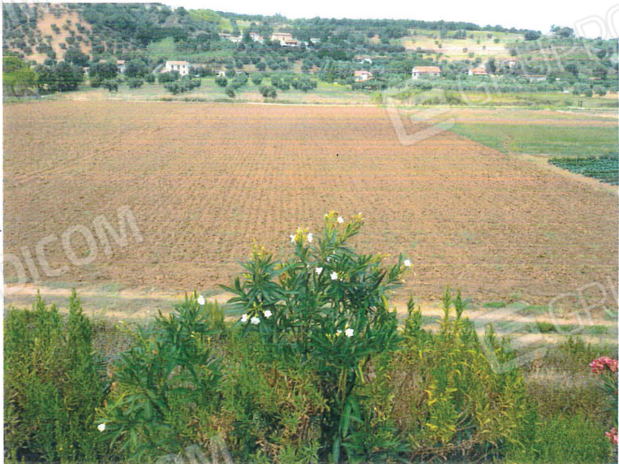
Terreni in località Pezze