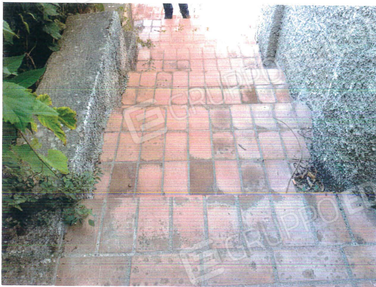
Particolare scala di accesso esterna