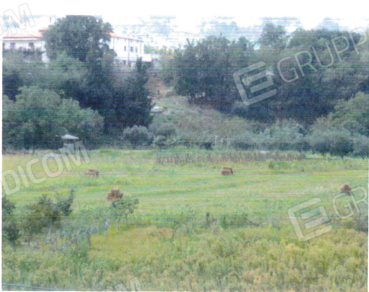
Terreni in località Valle Sala