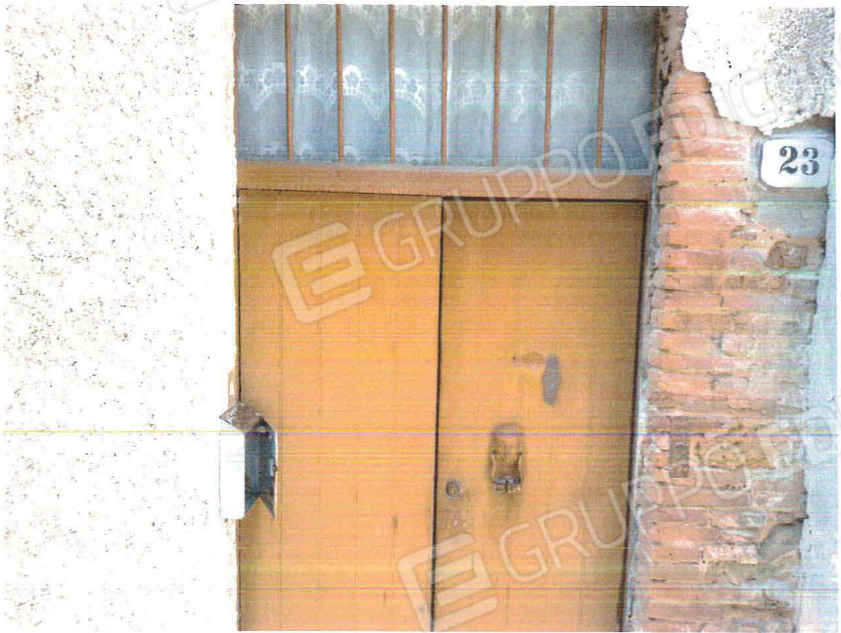
Porta di ingresso