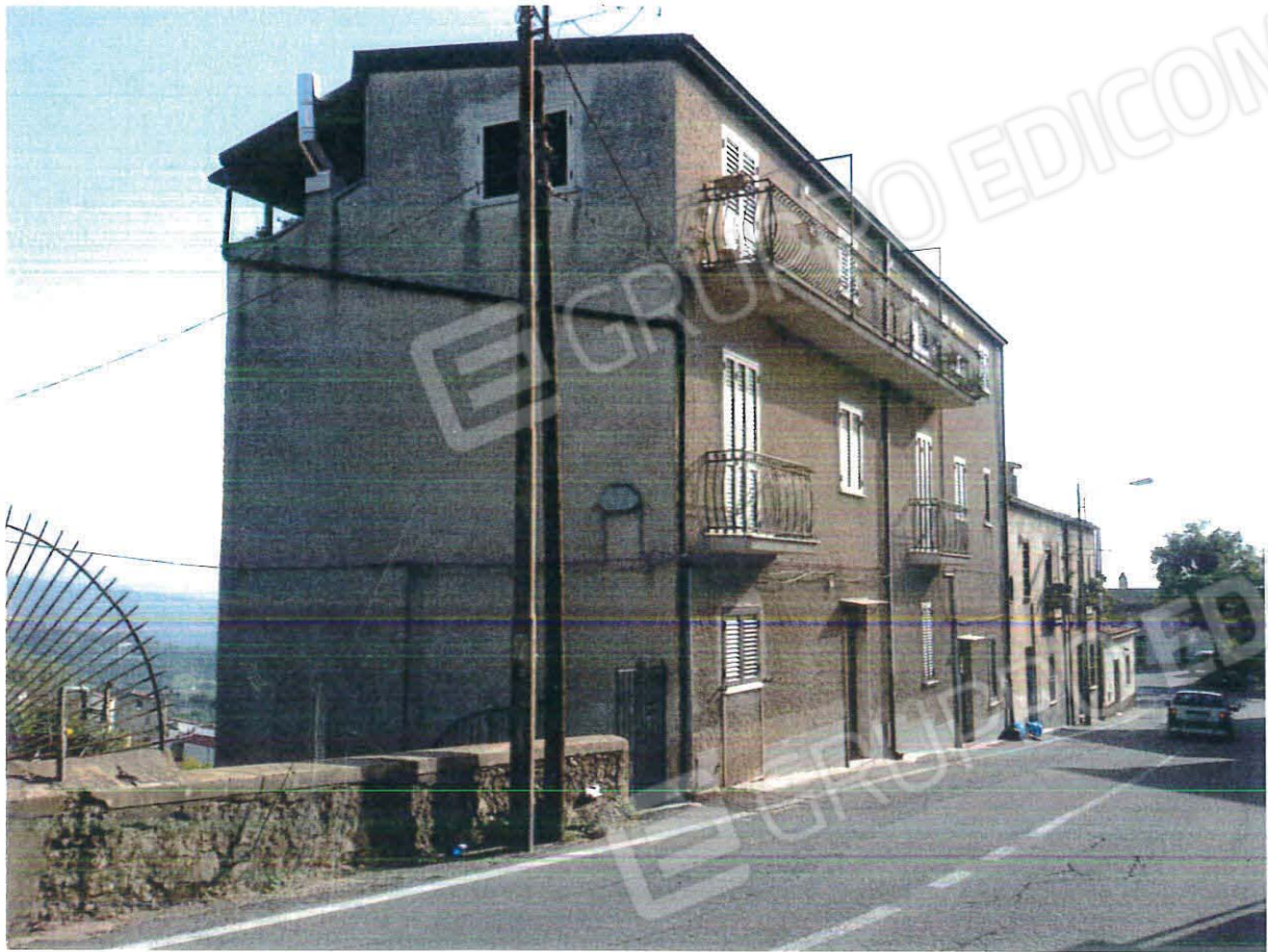
Prospetto del fabbricato principale su Viale Roma – Bisignano (CS)