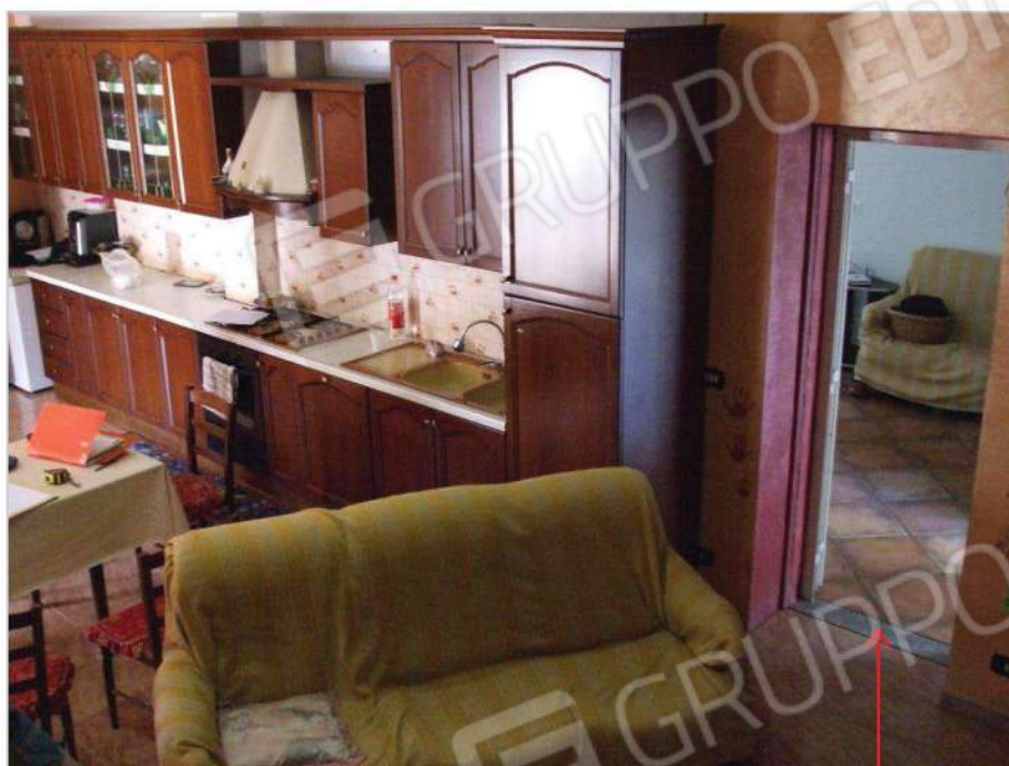
accesso interno al manufatto p.lla 592