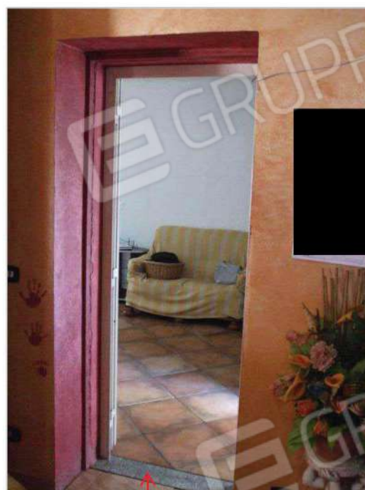
accesso interno al manufatto p.lla 592