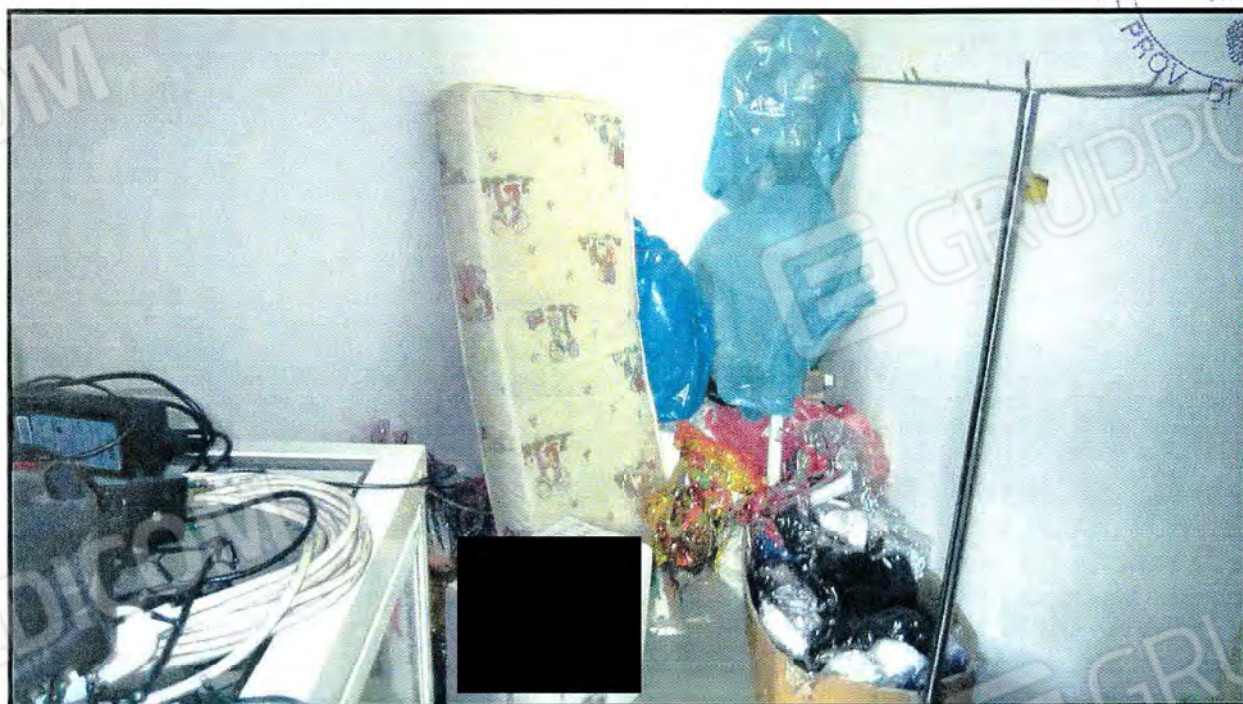
Foto 4 Riposiglio