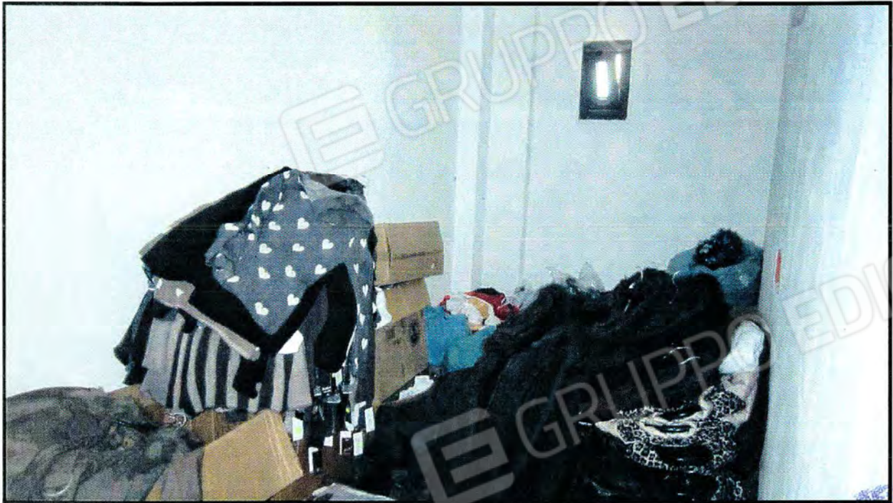
Foto 9 Ripostiglio