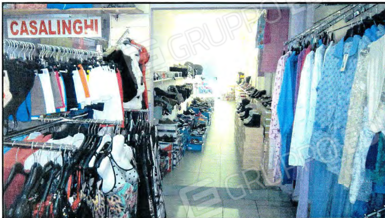
Foto 3 Area esposizione ed accesso ai servizi