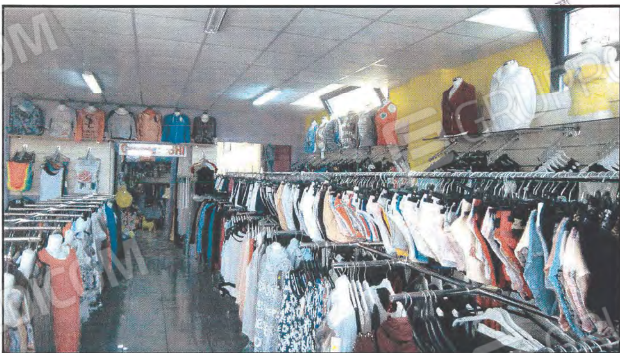
Foto 2 Area esposizione prossima all'ingresso