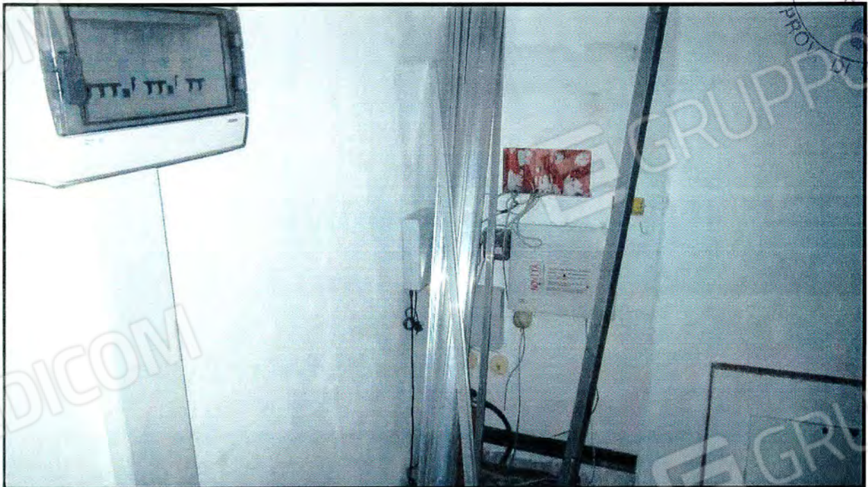
Foto 10 Locale tecnico