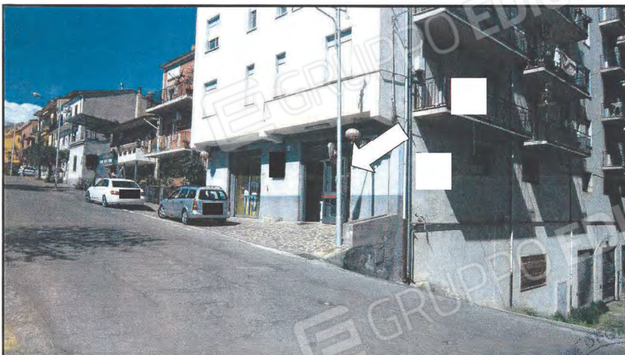
Foto 1 Fabbricato nel suo insieme in vista da Sud-Est