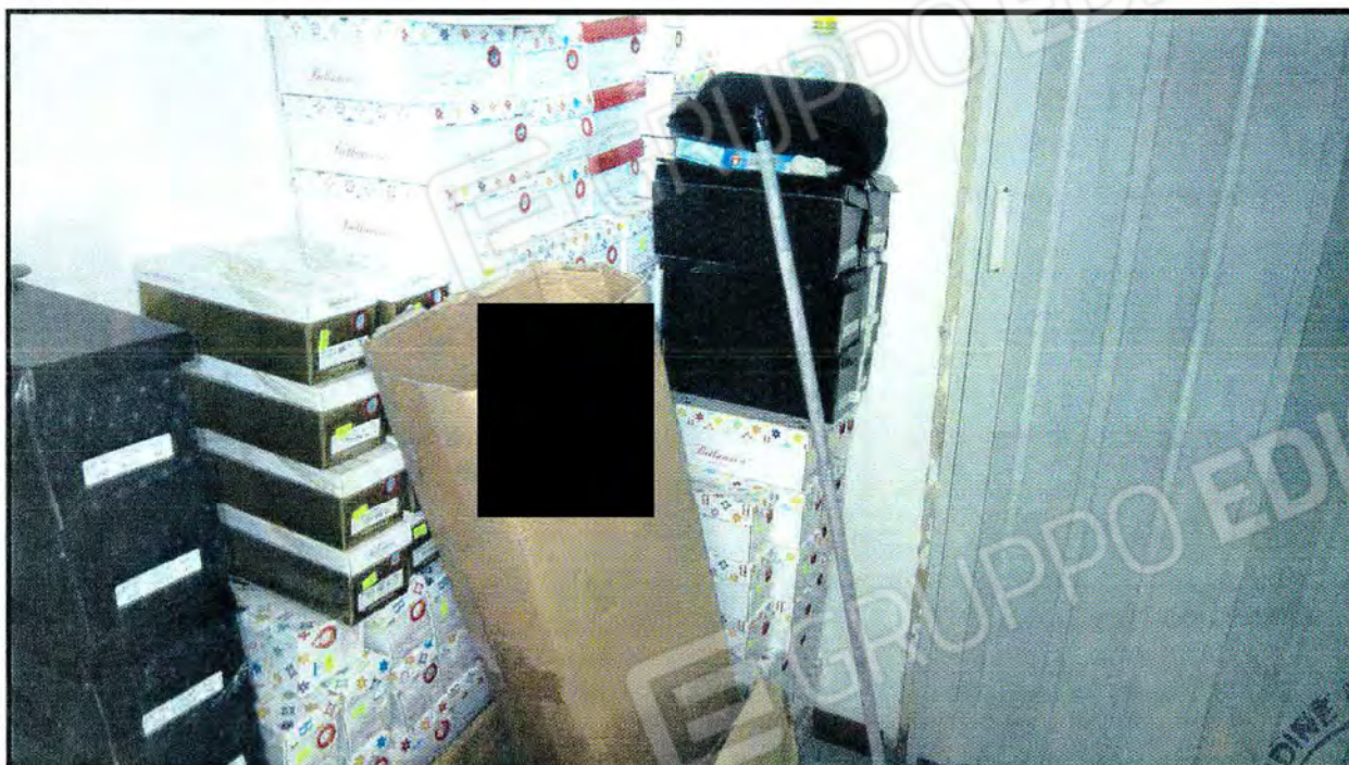
Foto 5 Antibagno servizi igienici