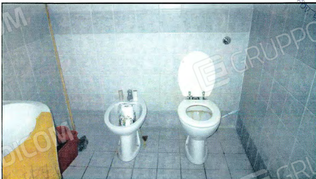
Foto 6 Wc