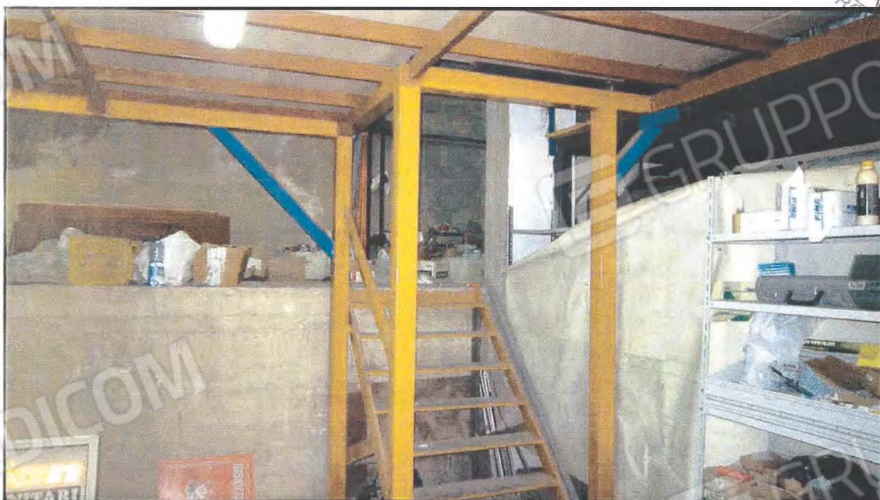
Foto A4 Interno del magazzino - Scala accesso area sopraelevata