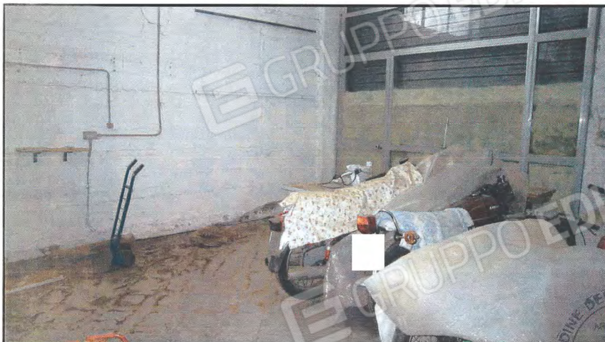
Foto A3 Interno del magazzino - Ingresso