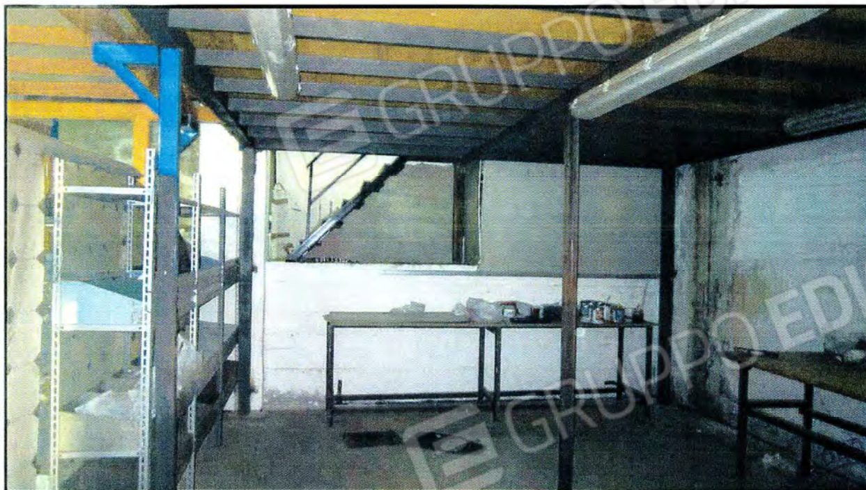
Foto 9 Interno del magazzino