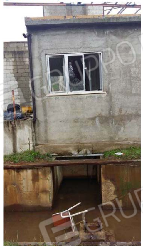
Figura 20 - Pesa