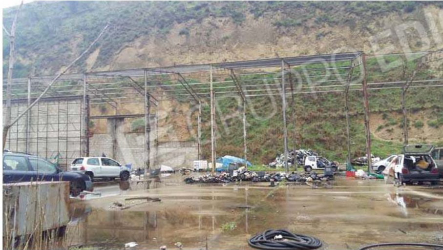
Figura 21 - Retro capannone