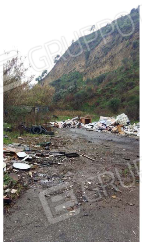
Figura 12 - Rifiuti