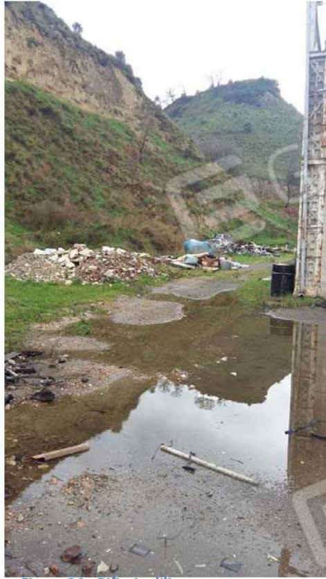
Figura 24 - Rifiuti edili