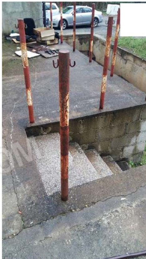
Figura 11 - Particolare scale