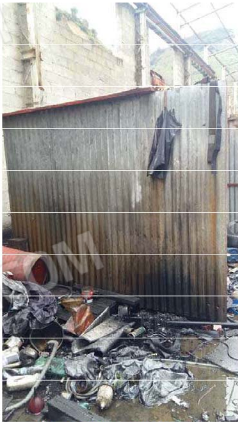
Figura 7 - Interno capannone