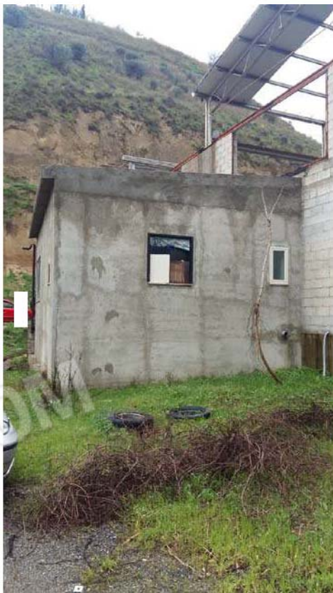
Figura 15 - Parete esterna ufficio capannone