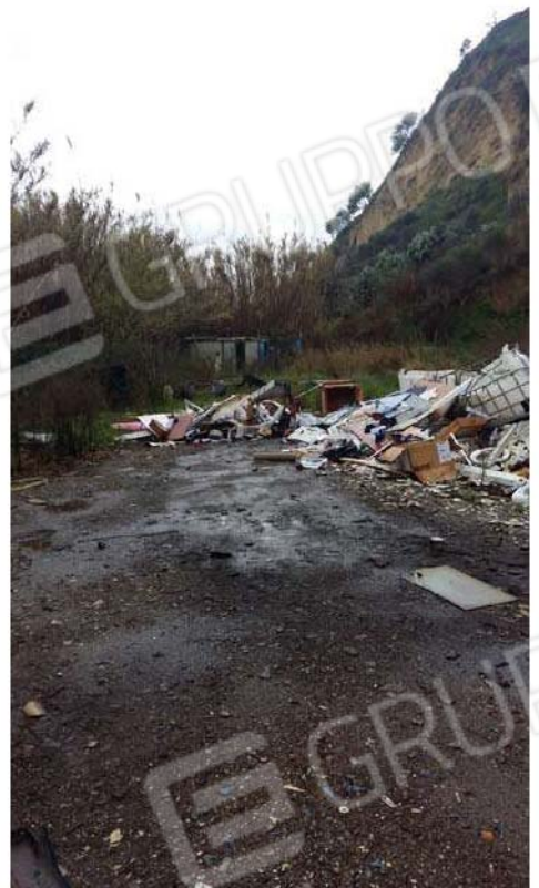
Figura 16 - Deposito in lamiera