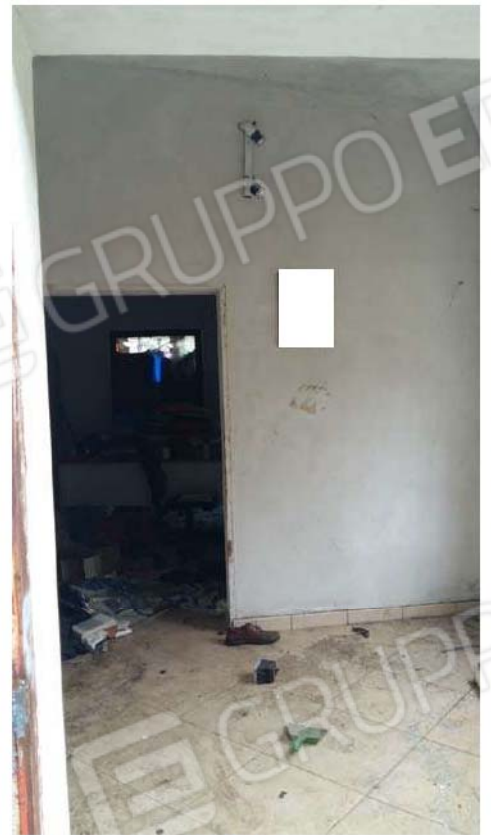
Figura 8 - Interno ufficio