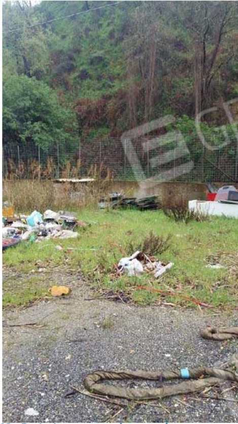
Figura 13 - Recinzione esterna lato strada