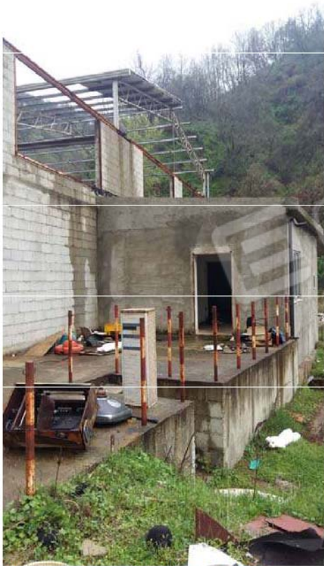
Figura 1 - Capannone - ingresso ufficio