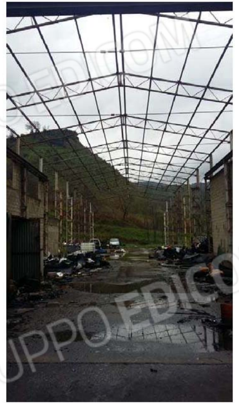
Figura 2 - Interno capannone