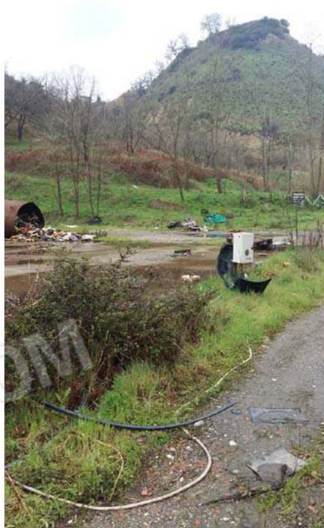
Figura 19 - Retro capannone