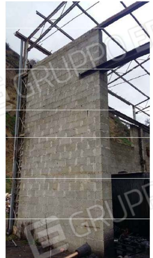
Figura 4 - Particolare Parete