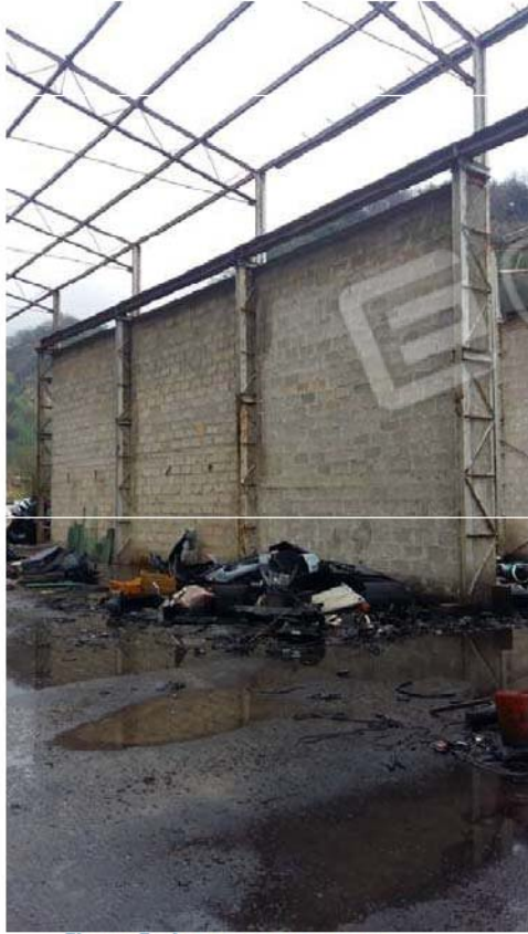
Figura 5 - Interno capannone