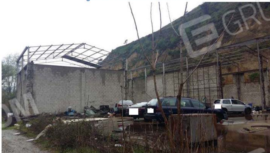
Figura 23 - Retro capannone