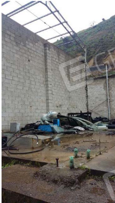
Figura 17 - Retro capannone