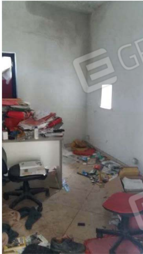
Figura 9 - Interno ufficio