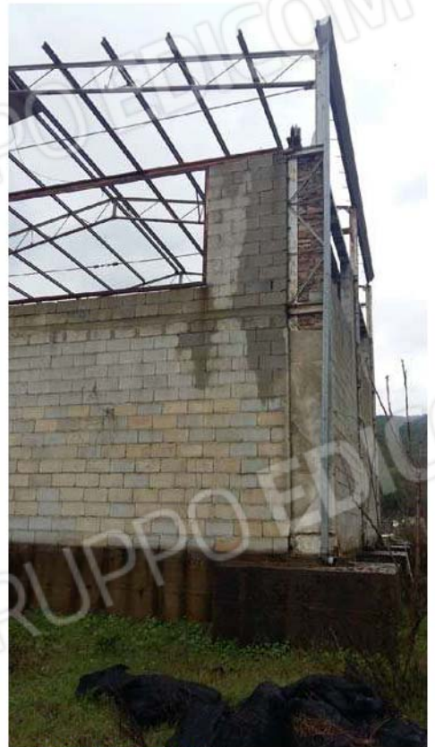
Figura 14 - Copertura