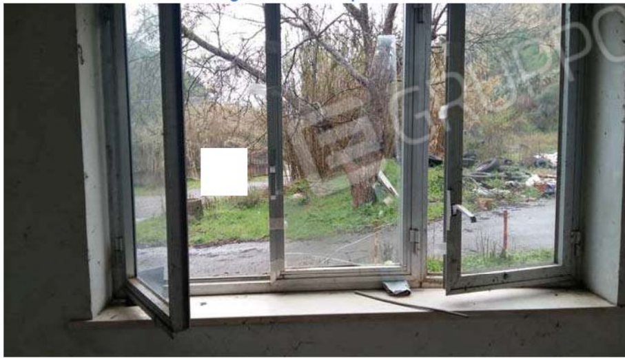
Figura 22 - Particolare finestra ufficio