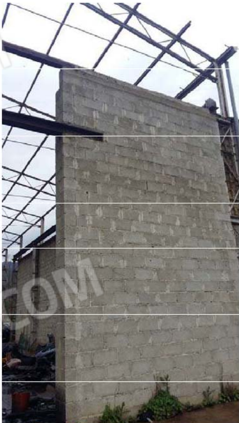
Figura 3 - Particolare parete