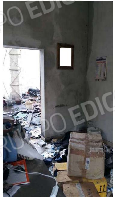
Figura 10 - Interno ufficio