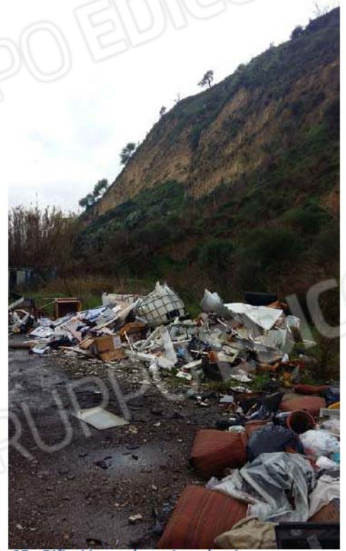
Figura 25 - Rifiuti ingombranti e urbani