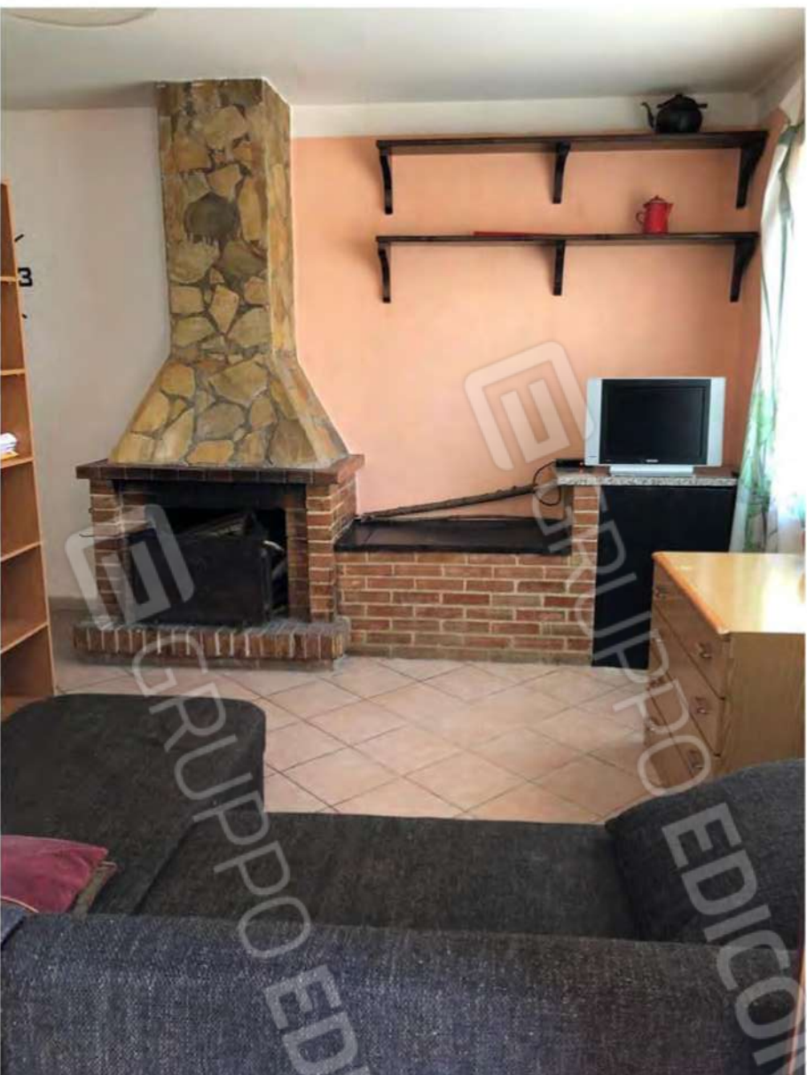
Foto 63 - Fabbricato Mendicino, fig.12, p.lla 1432, sub.2, soggiorno.