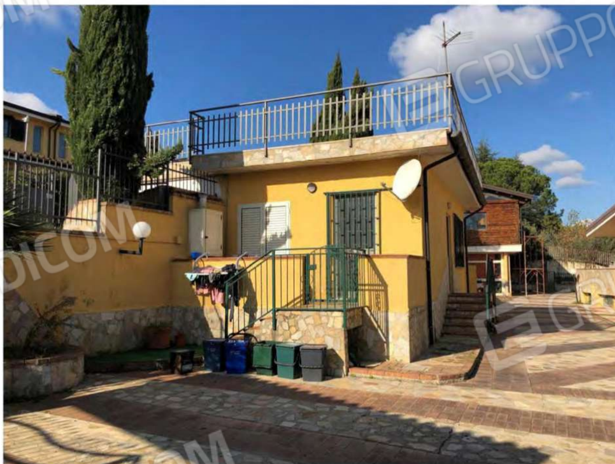
Foto 58 - Fabbricato, Mendicino, fg.12, p.IIa 1432, sub.2.