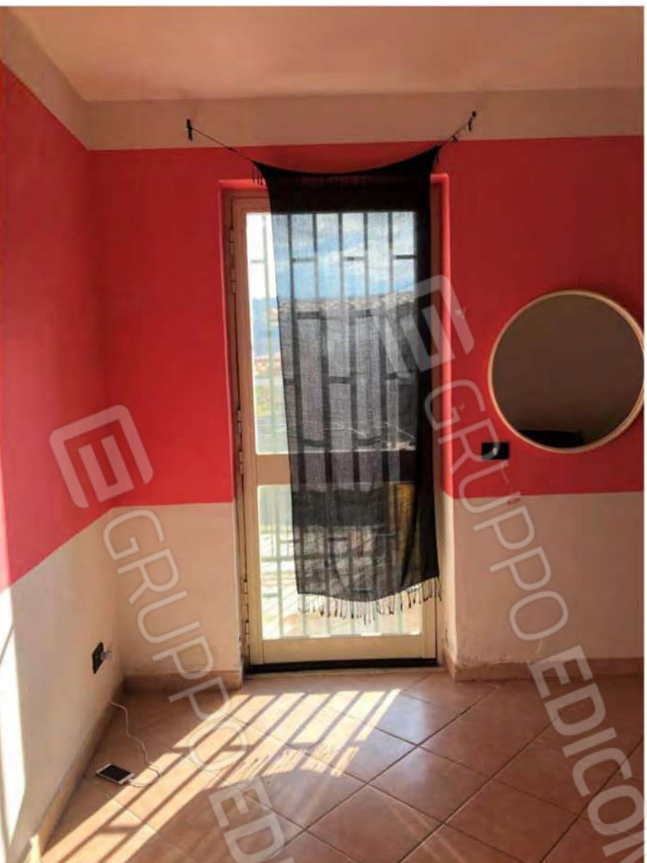
Foto 65 - Fabbricato Mendicino, fig.12, p.lla 1432, sub.2, camera da letto.