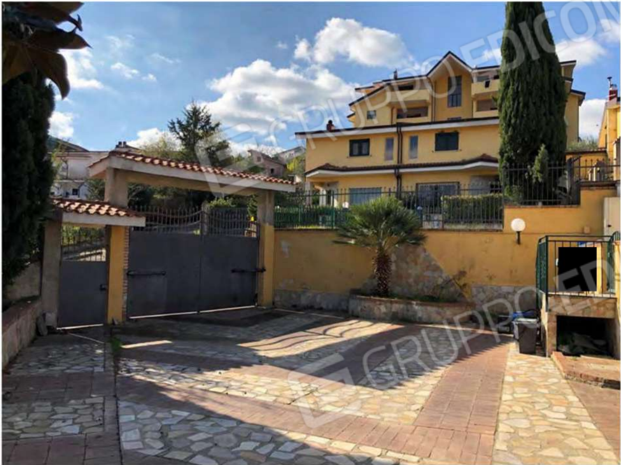
Foto 59 - Corte, Mendicino, fg.12, p.lla 1514.