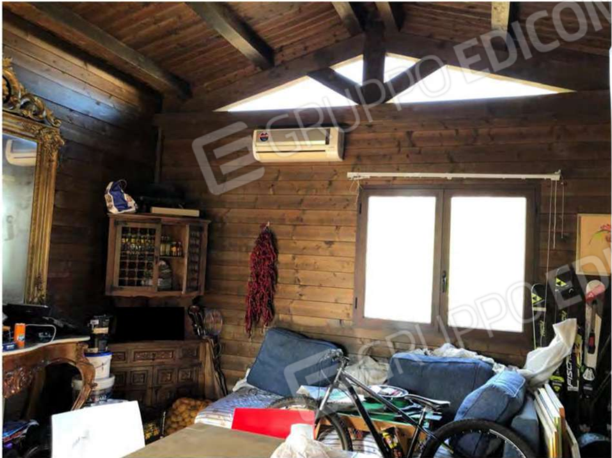
Foto 53 - Fabbricato legno p.T, Mendicino, fg.12, p.la 1431, sub.2, soggiorno.