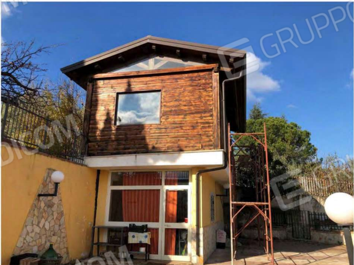
Foto 46 - Fabbricato Mendicino, fg.12, p.la 1431, sub.2.