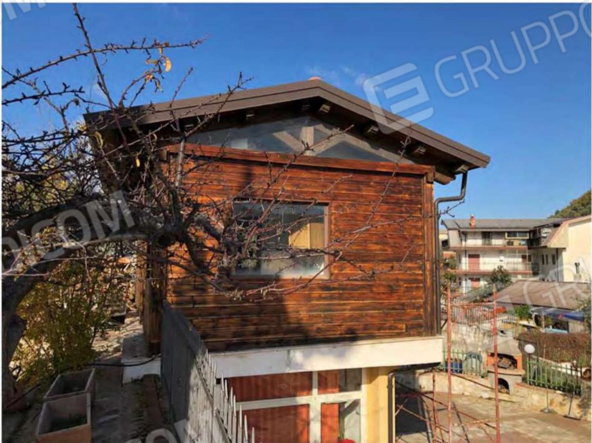
Foto 48 - Fabbricato in legno al p.T, Mendicino, fg.12, p.lla 1431, sub.2.