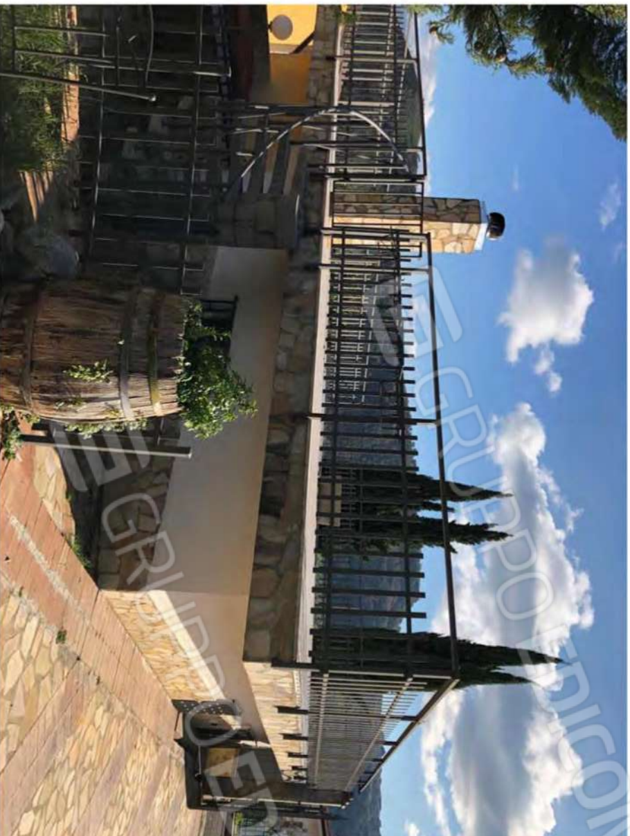
Foto 61 - Terrazzo copertura, fabbricato Mendicino, fg.12, p.lla 1432, sub.2.