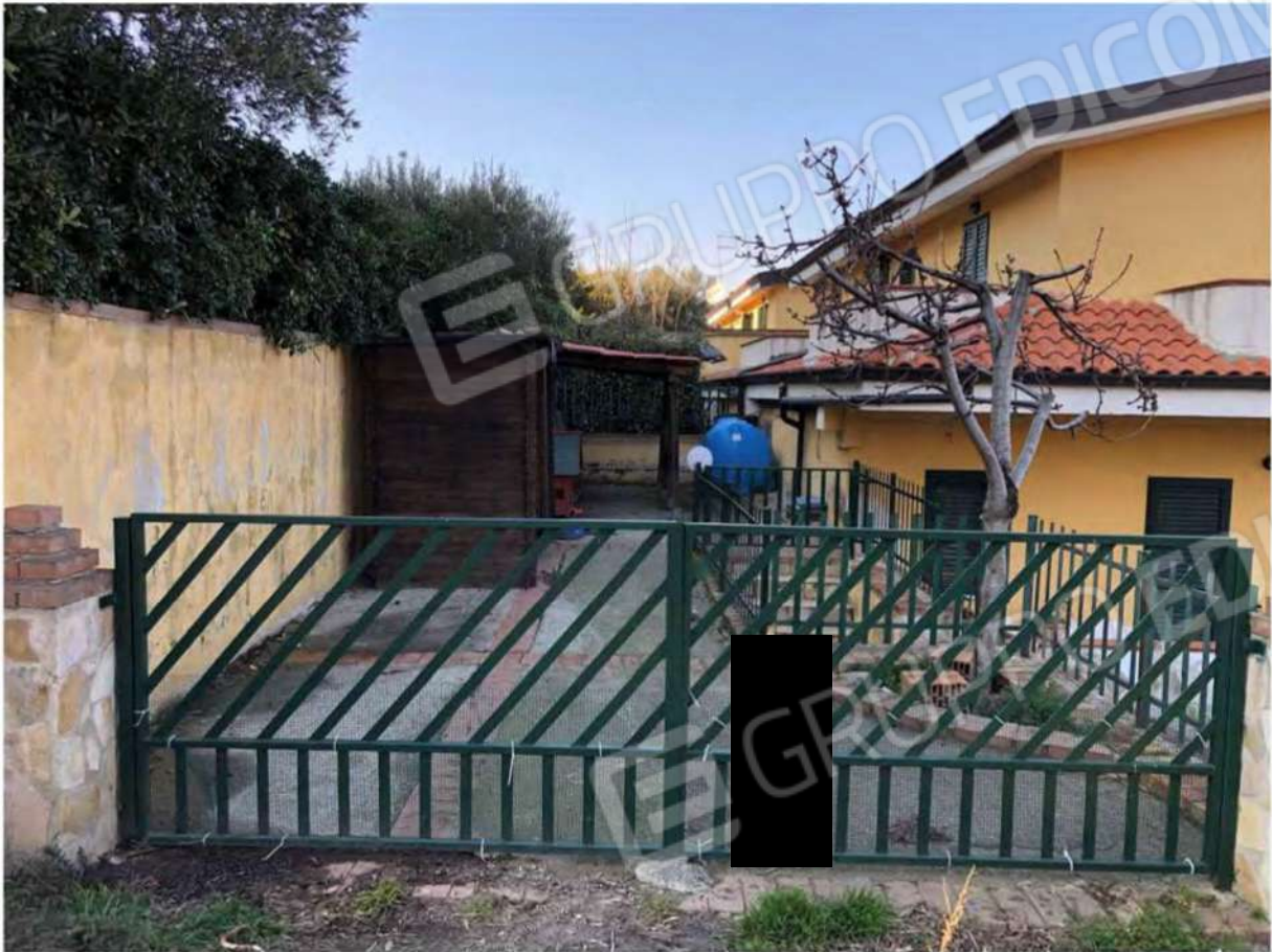
Foto 45 - Corte esclusiva, Mendicino, fg.12, p.la 1039, sub.2