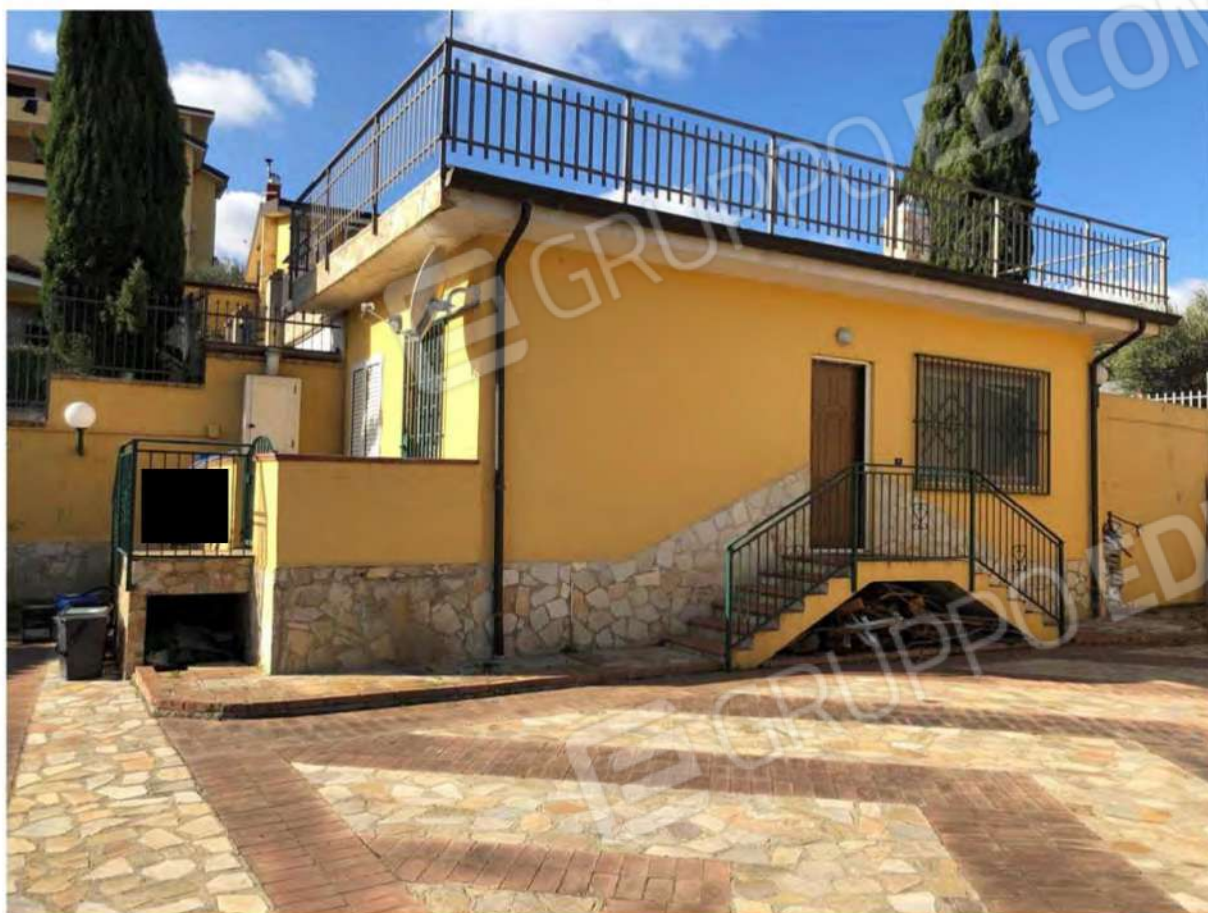
Foto 57 - Fabbricato, Mendicino, fg.12, p.IIa 1432, sub.2.