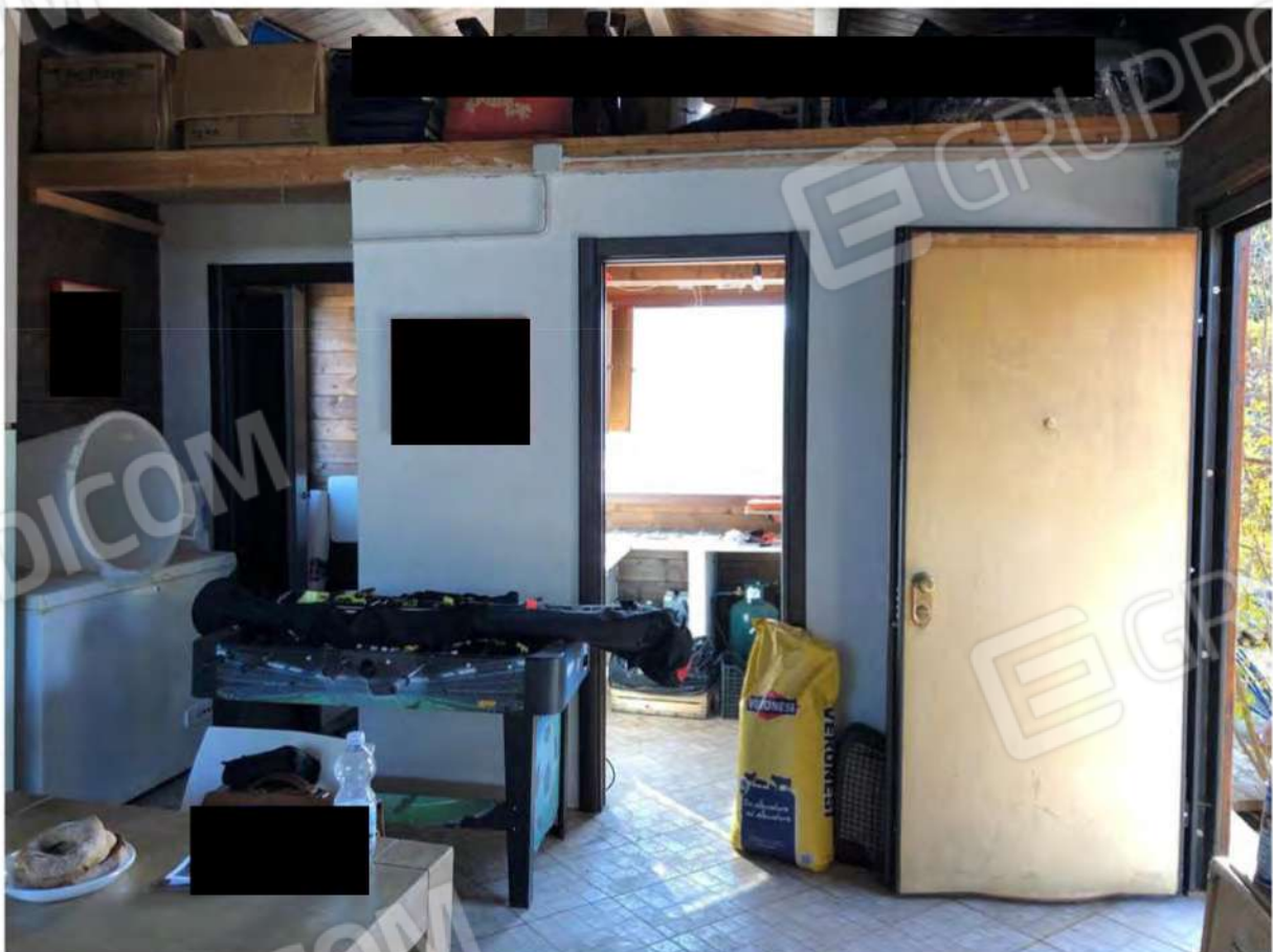
Foto 54 - Fabbricato legno p.T, Mendicino, fg.12, p.la 1431, sub.2, soggiorno.