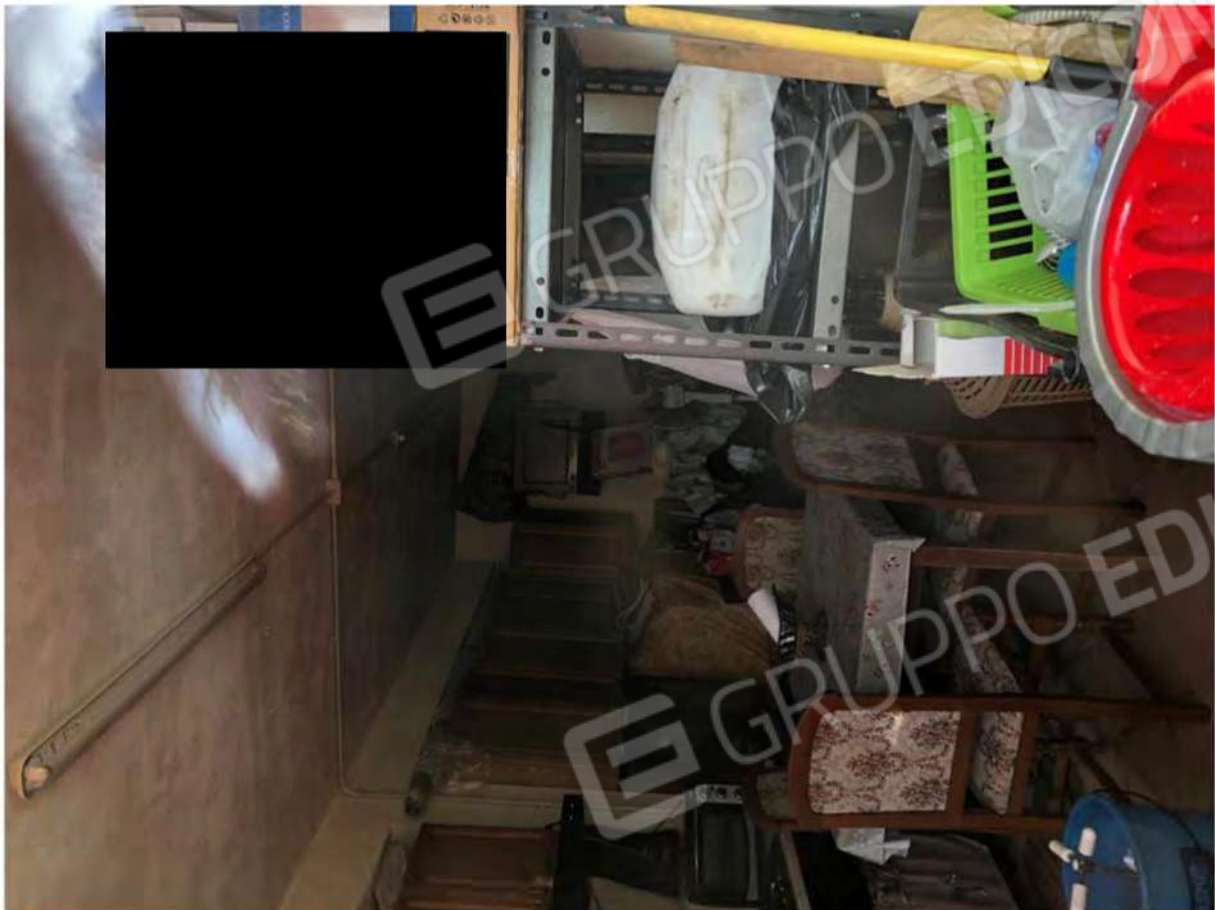
Foto 51 - Interno magazzino p.S, Mendicino, fg.12, p.lla 1431, sub.2.