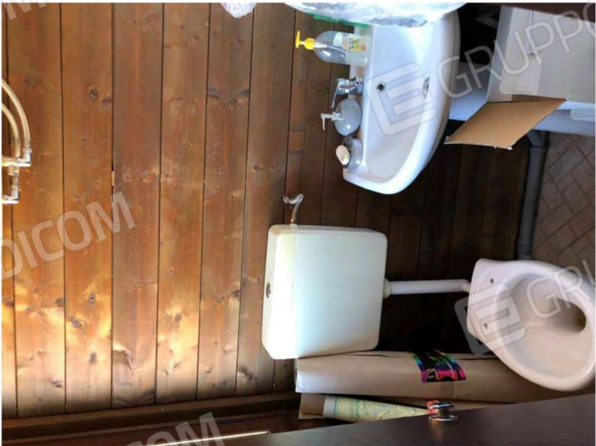
Foto 56 - Fabbricato legno p.T, Mendicino, fg.12, p.lla 1431, sub.2, bagno.