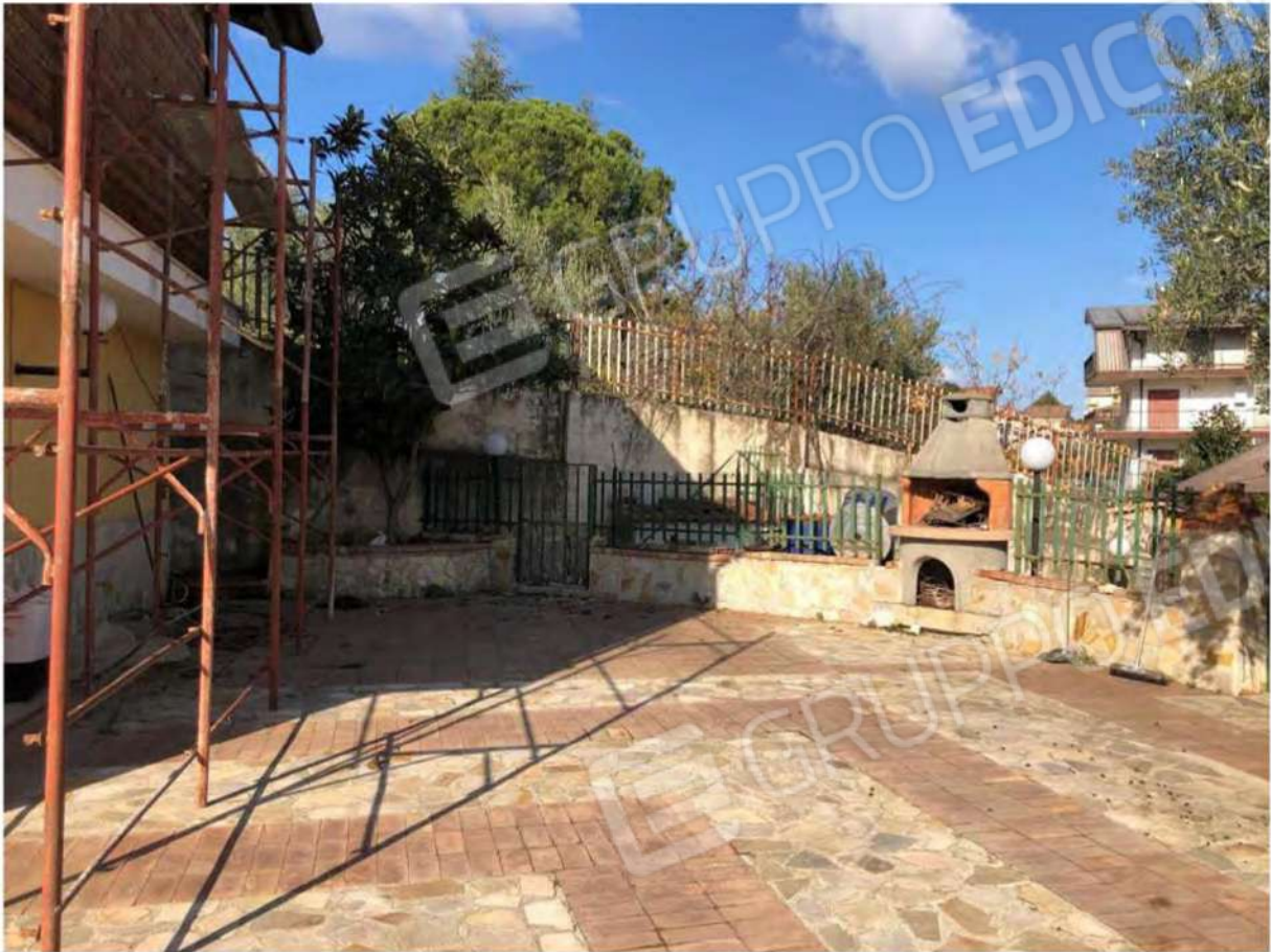
Foto 49 - Corte, Mendicino, fg.12, p.la 1514.