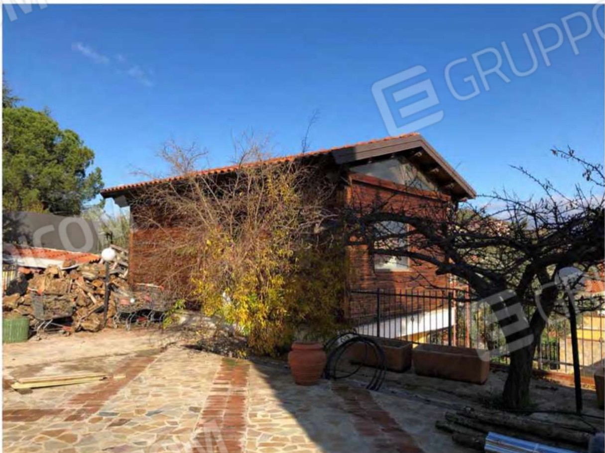
Foto 52 - Ingresso fabbricato legno p.T, Mendicino, fg.12, p.lla 1431, sub.2 e corte p.lla 1514.