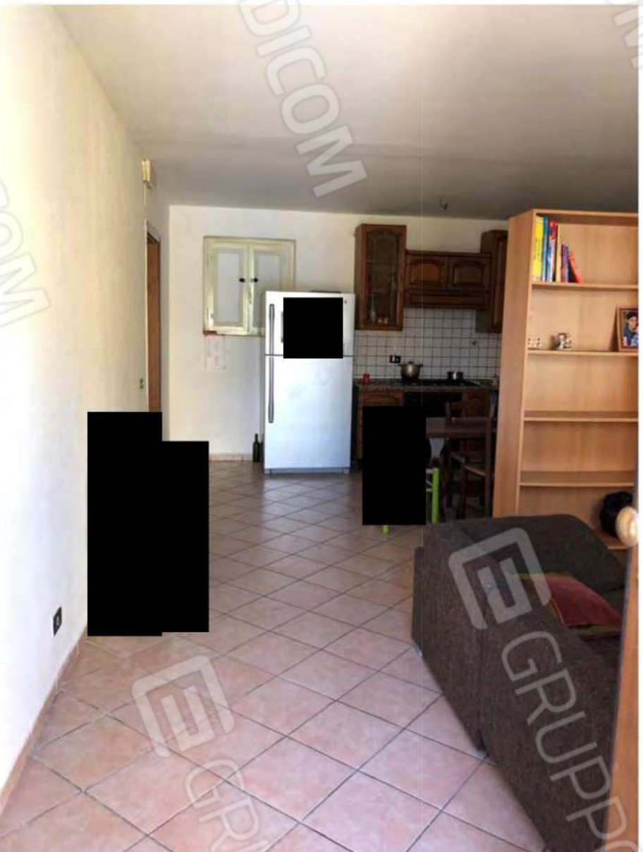
Foto 62 - Fabbricato Mendicino, fg.12, p.lla 1432, sub.2, soggiorno.