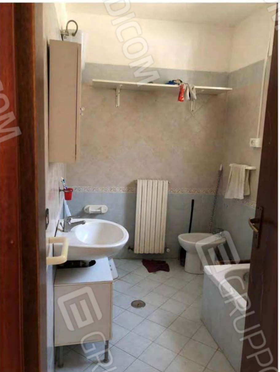
Foto 66 - Fabbricato Mendicino, fig.12, p.lla 1432, sub.2, bagno.