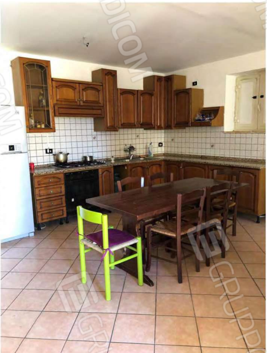
Foto 64 - Fabbricato Mendicino, fig.12, p.lla 1432, sub.2, angolo cottura.