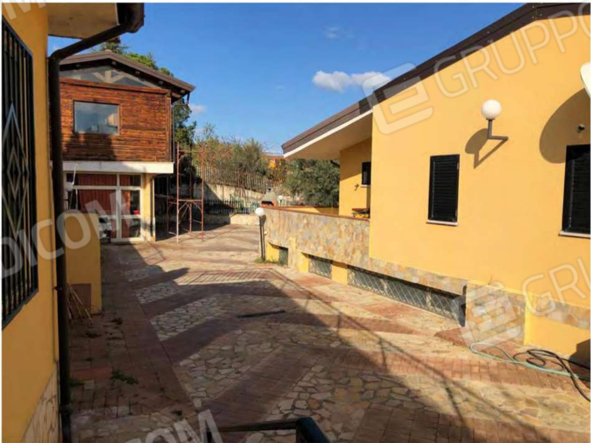
Foto 50 - Corte, Mendicino, fg.12, p.la 1514.