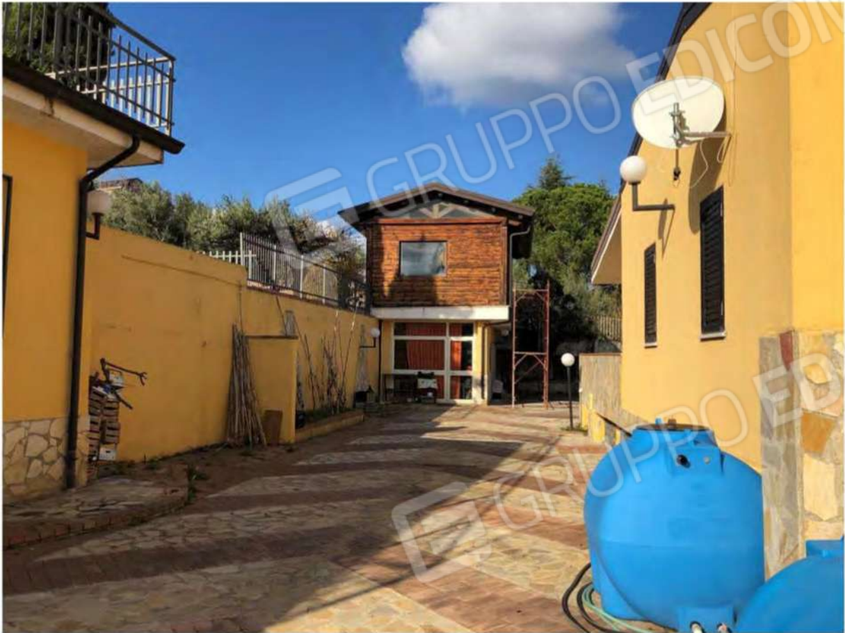
Foto 47 - Fabbricato Mendicino, fg.12, p.lla 1431, sub.2 e corte p.lla 1514.