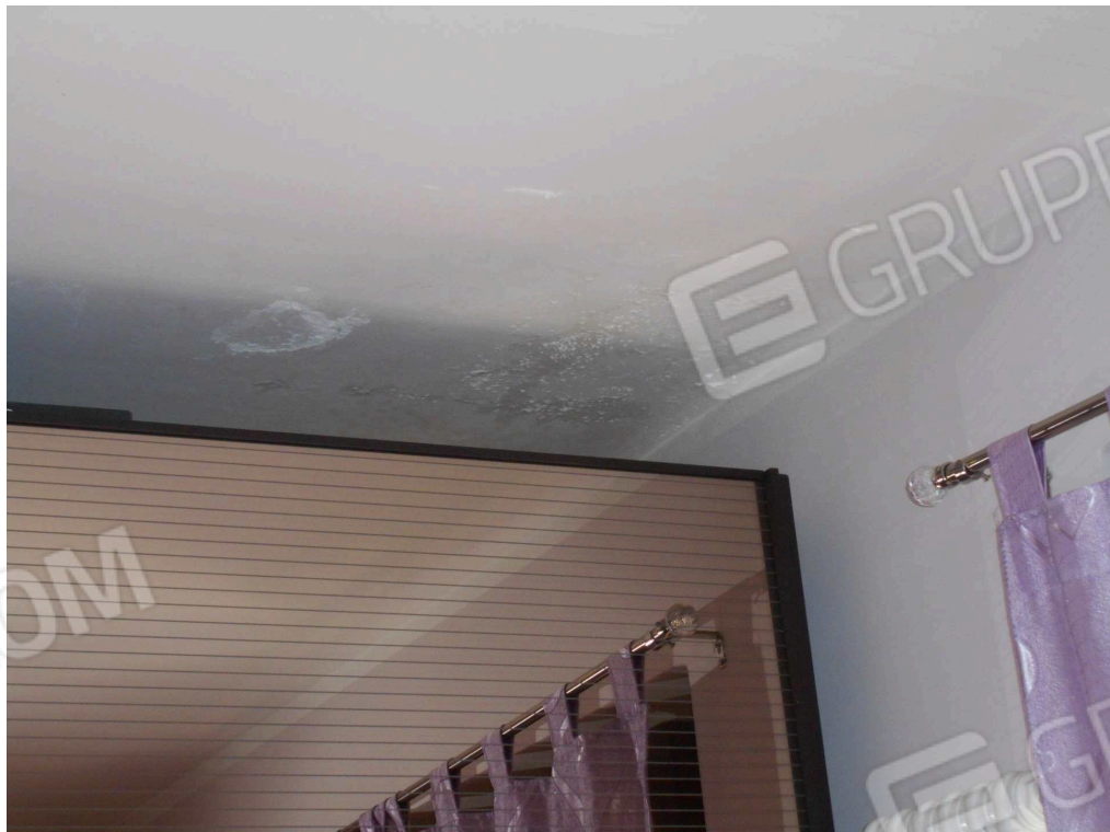
Camera da letto matrimoniale: infiltrazioni