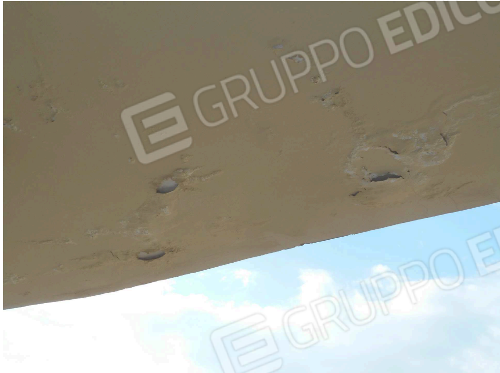
Umidità succieli balconi