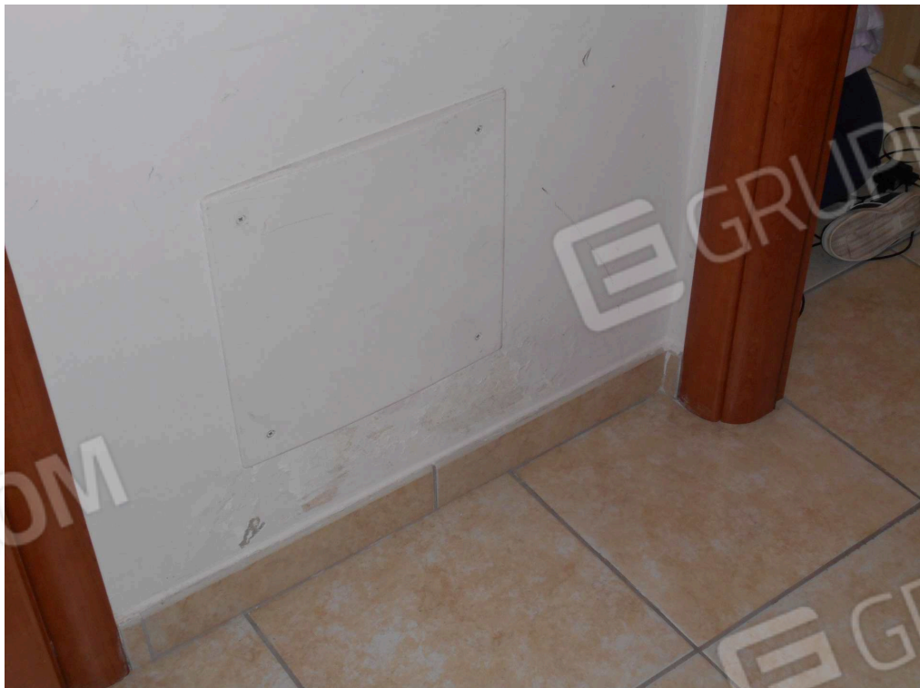
Umidità zona disimpegno