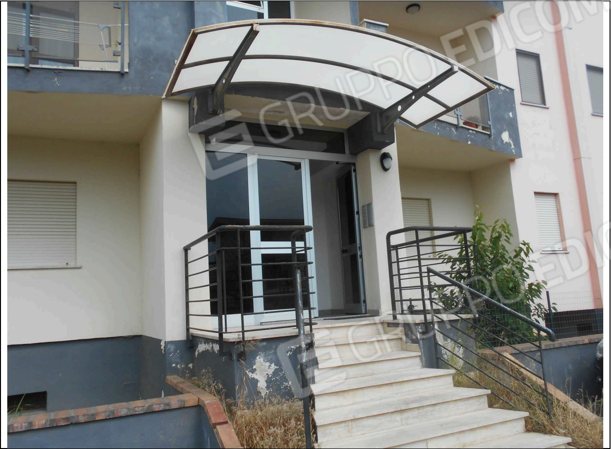
Prospetto OVEST: particolare ingresso