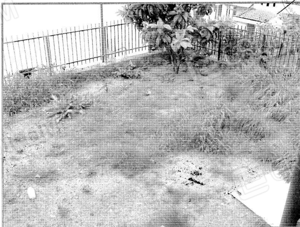
- Foto 2 (Corte esclusiva adibita a giardino – Part. 738 sub. 15) -