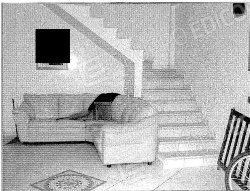
- Foto 9 (Vista su scala di collegamento tra il Piano Interrato 1 e il Piano Terra) –