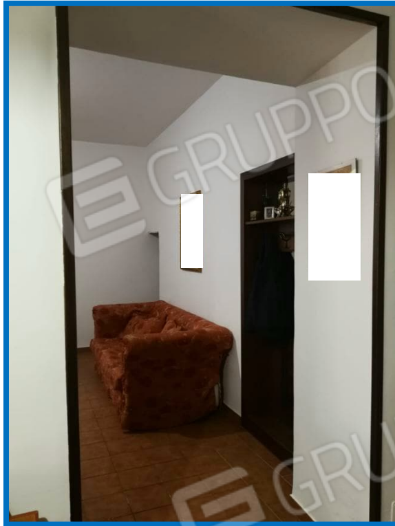
Foto n. 9 - Ingresso dalla cucina al soggiorno