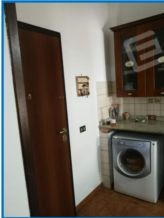
Foto n. 6 - Cucina