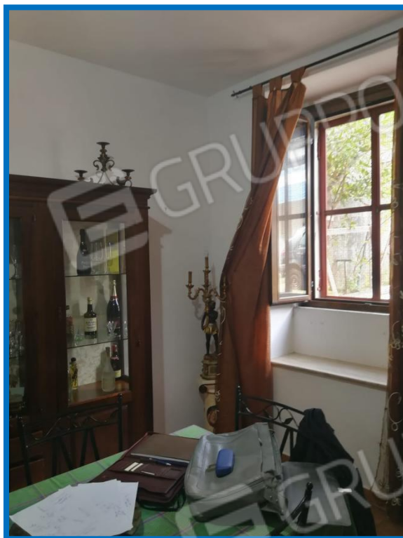
Foto n. 11 - Soggiorno