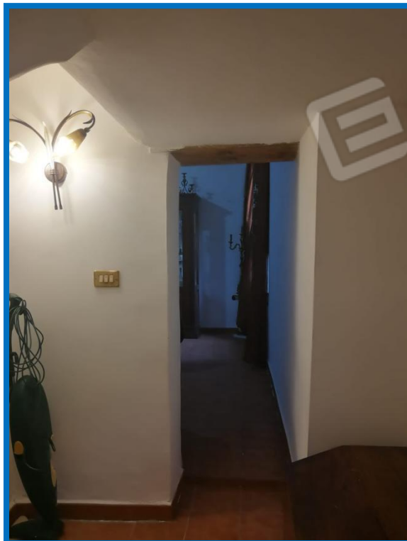
Foto n. 14 - Particolare sottoscala