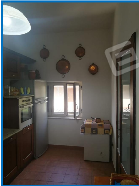
Foto n. 8 - Cucina