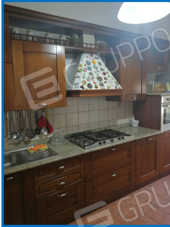
Foto n. 7 - Cucina