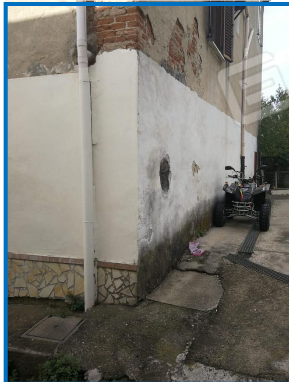
Foto n. 4 - Prospetto esterno