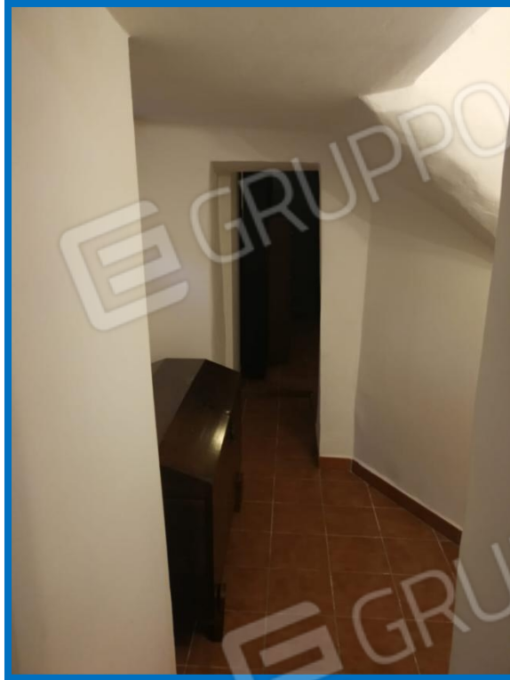
Foto n. 13 - Ingresso dal sottoscala (dal soggiorno al corridoio)