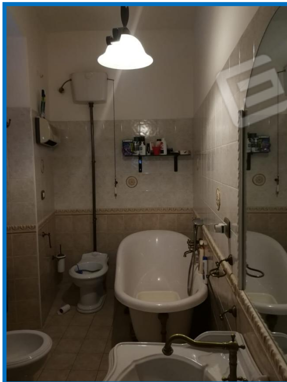
Foto n. 18 - Bagno