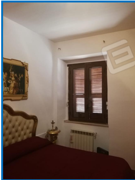
Foto n. 16 - Stanza da letto