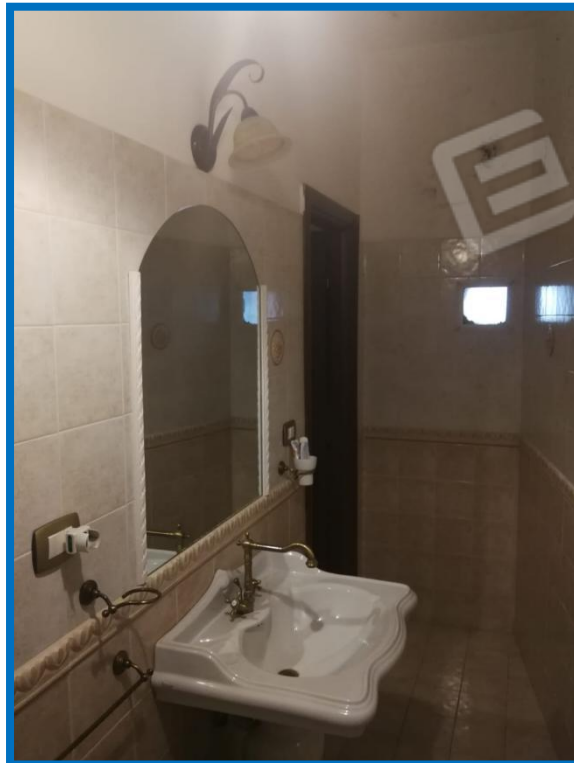
Foto n. 20 - Bagno