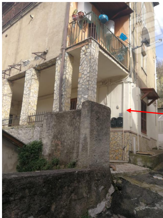
Foto n. 2 - Prospetto esterno