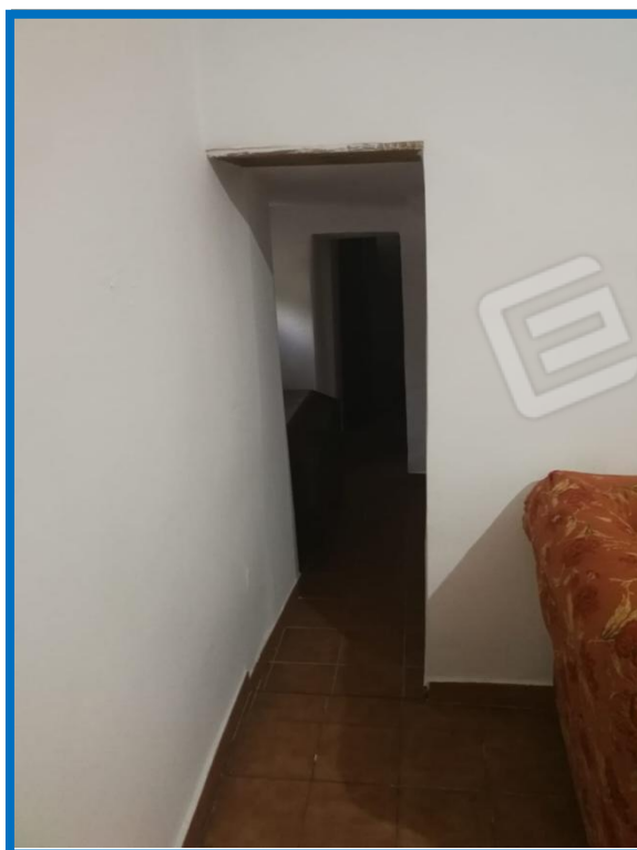
Foto n. 12 - Ingresso dal sottoscala (dal soggiorno al corridoio)