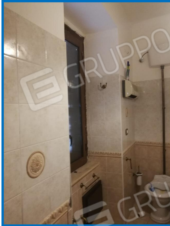
Foto n. 19 - Bagno