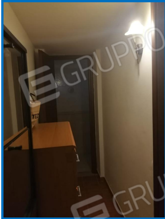
Foto n. 15 - Corridoio di accesso alla stanza da letto e al bagno