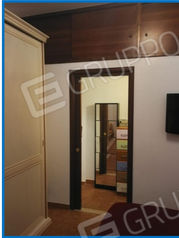
Foto n. 17 - Stanza da letto