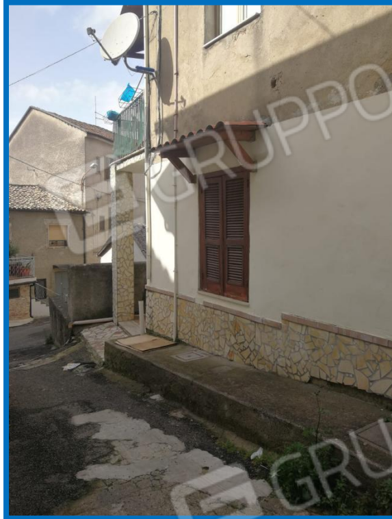
Foto n. 3 - Prospetto esterno