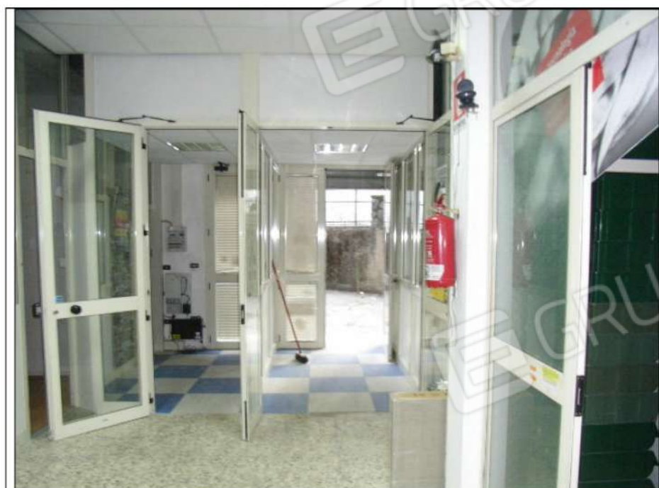
foto n°6 - Il vestibolo di ingresso: a destra, l'accesso alla zona assemblaggio e manutenzione