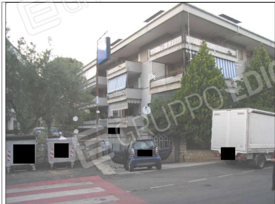
Foto n°1 : l'immobile di via Leonardo da Vinci con l'ingresso carrabile alla corte

Magazzino commerciale sito in contrada Andreotta di Castrolibero (CS), alla via Leonardo da Vinci n°35, in catasto fabbricati foglio n°9 p.lla n°631 sub 14, con annessa corte di pertinenza esclusiva in catasto fabbricati foglio n°9 p.lla n°637.