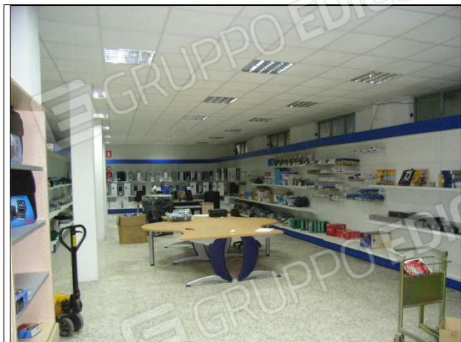
foto n°5 - la zona esposizione e vendita vista dalla porta di ingresso