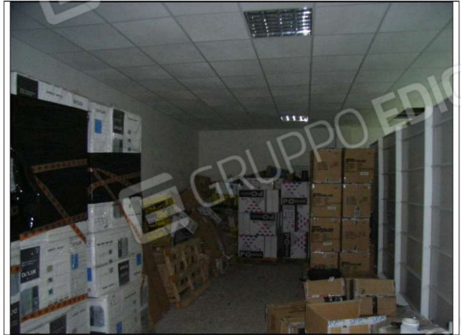
foto n°7 - area di deposito retrostante la zona esposizione e vendita