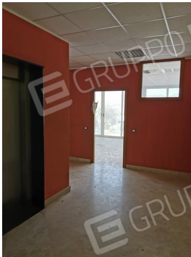
Foto 17: interno piano secondo. Fg. 29 P.Ila 197 sub 12 - ingresso sub 9.