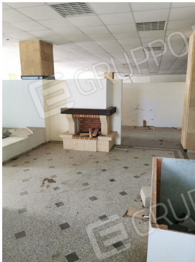
Foto 13: interno zona espositiva piano secondo. Fg. 29 P.Ila 196 sub 2.