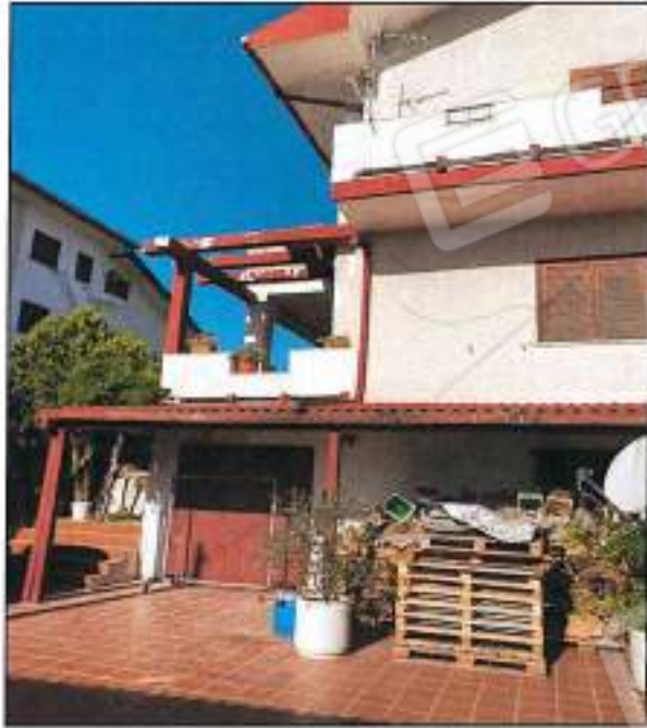
Foto n° 10 – Vista esterna fabbricato, è visibile la porta garage, e la terrazza I (Cfr. Allegato G3).