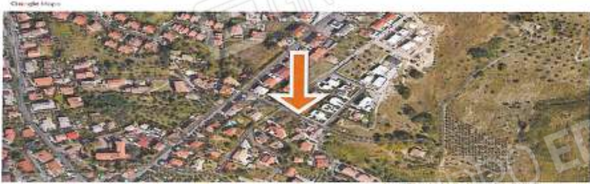
Foto n° 2 – Veduta estropolata da Google Maps- Fabbricato nella sua interezza, di cui è parte integrante la u.l. oggetto di procedura - foglio mappa 7 particelle 164 ,

Foto n° 1 – Vista foto dell'area interessata, è evidenziata con freccia il fabbricato di cui fa parte, località pasquali – via Folco Ruffo di Calabria, I.