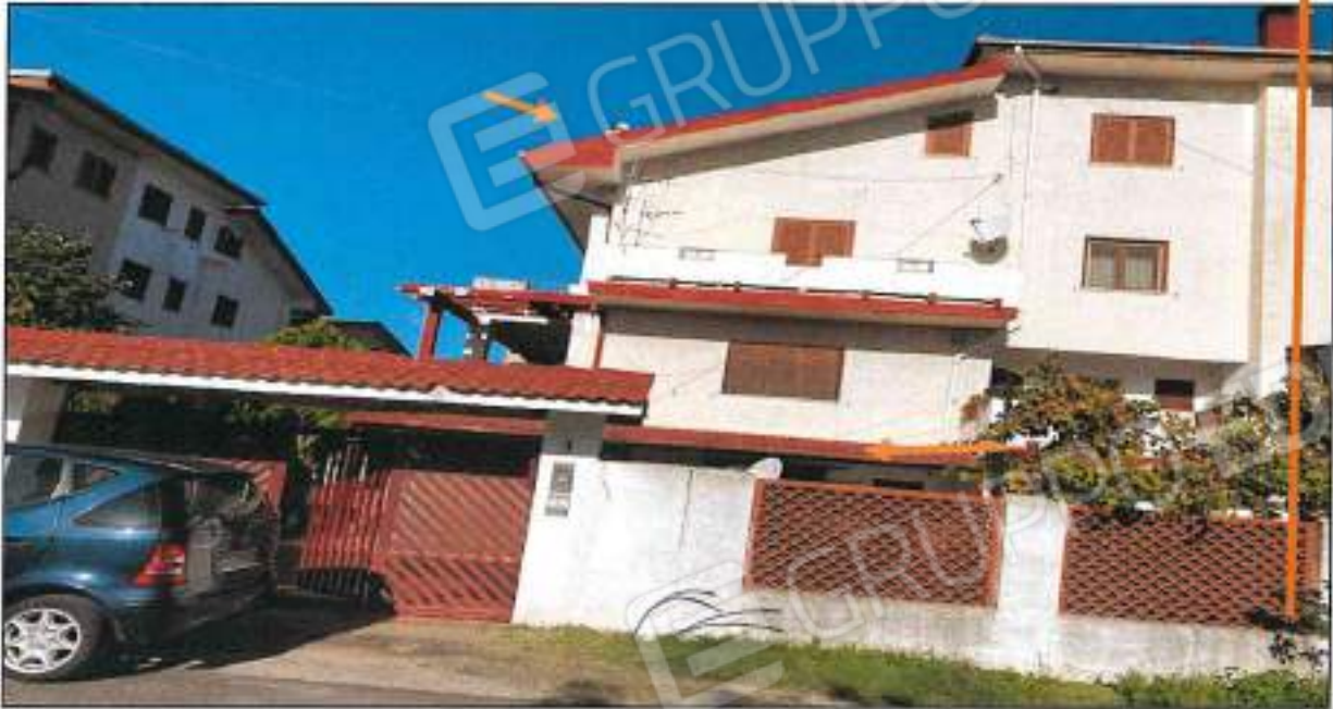
Foto n° 4 – Veduta recinzione u.l. - foglio di mappa 7 Particella n° 164 – dalla strada comunale via Folco Ruffa di Calabria

Foto n° 3 – Vista generale di parte fabbricato indicato dal segno arancio – Con la freccia è indicato la u.l. posta al piano S-T-H, oggetto di procedura, comune di Mendicino (CS), fotografata dalla strada Comunale. (beni immobili foglio di mappa 7 particella n° 164, sono visibili alcune rifiniture esterne quali cancello metallico, recinzione esterna e tettoia cancello carabile e pedonale.