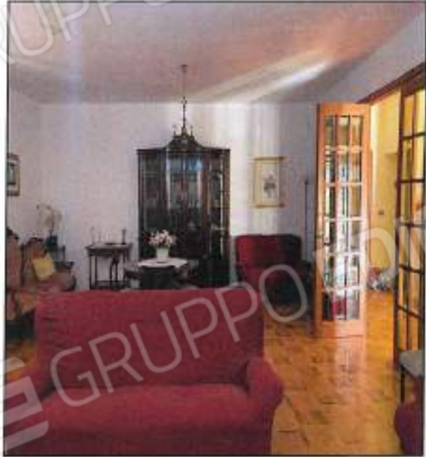
Foto n° 18 – Vista interna salone di piano terra/terzato del fabbricato, sono visibili le rifiniture in ceramica, le porte in legno e vetro di buona qualità.