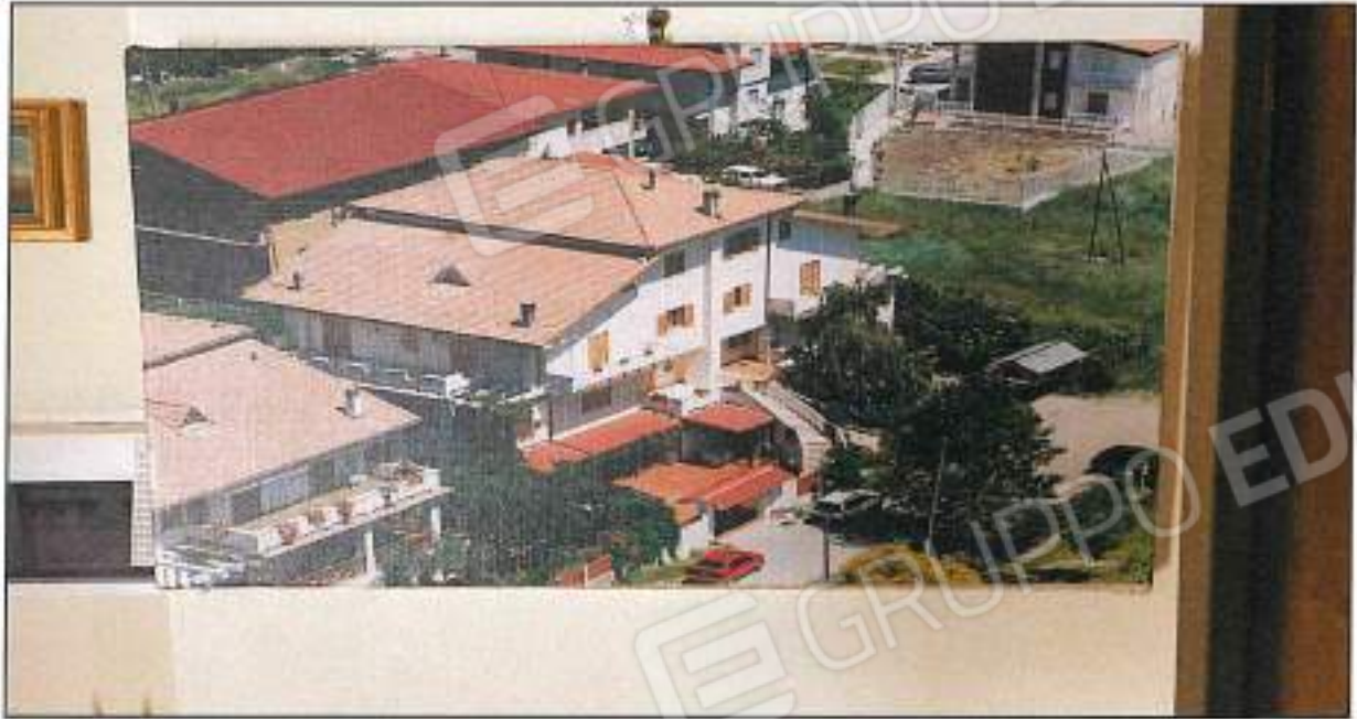
Foto n° 6 - Vista fabbricato cortile interno, parte posteriore. sono visibili le finestre vetri, provviste di inferriate.