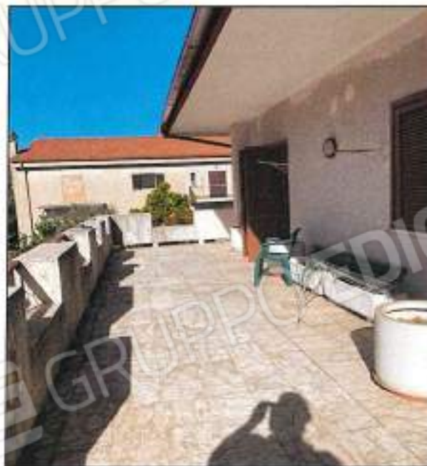
Foto n° 26 – Vista esterna terrazzo in parte scoperto al piano Primo.