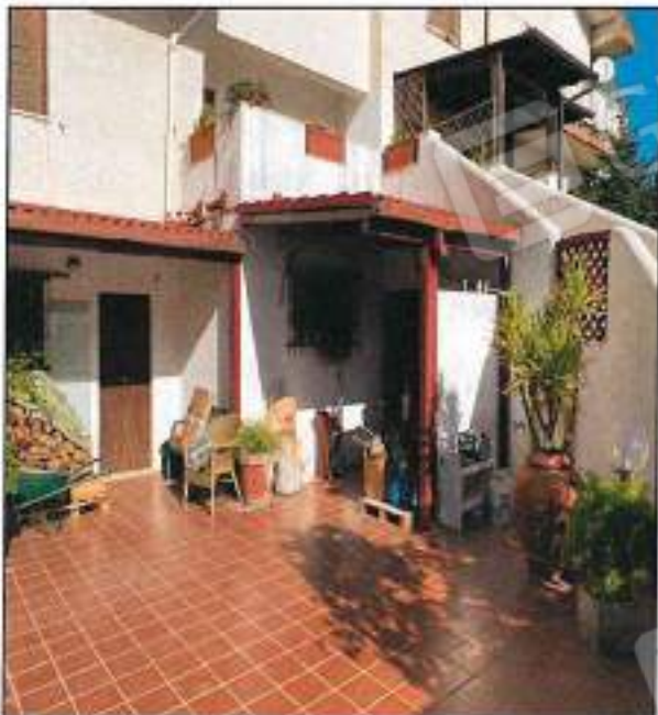
Foto n° 7 – Vista ingresso al piano seminterato, sono visibili le finiture della piastrellatura del cortile e la tettoia 2 (Ct. Allegato G3).