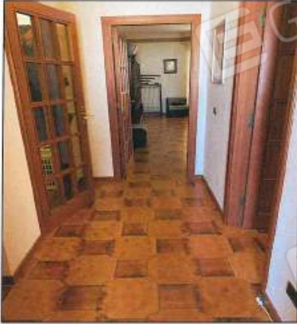
Foto n° 29 - Visto interno corridoio con funzione di disimpegno per le camere, intesi il legno e vetro, pavimenti in ceramica, radiatori in ghisa.