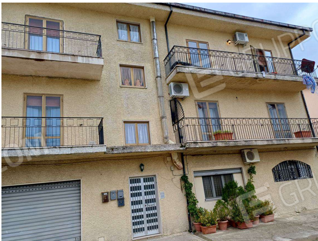
Foto N.4: Prospetto fabbricato lato Ovest con ingresso condominiale