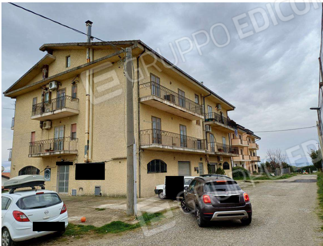
Foto N.3: Prospetto fabbricato angolo Nord - Ovest con ingresso condominiale