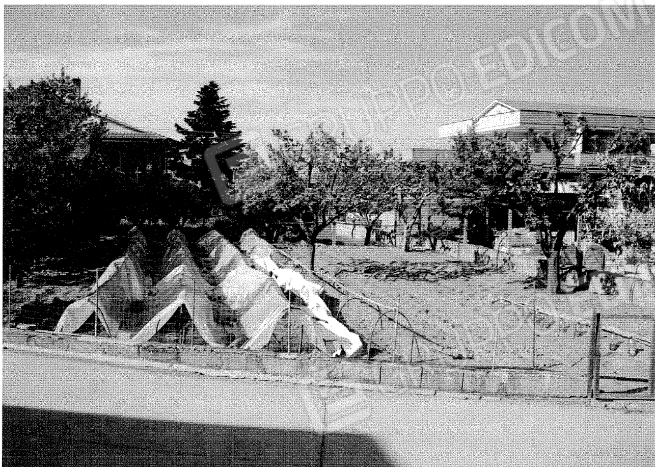
Foto n°19 :- b) Terreno con destinazione D/2 (Fg. n°37, p.lle nn.104, 70); zona coltivata ad Orto.