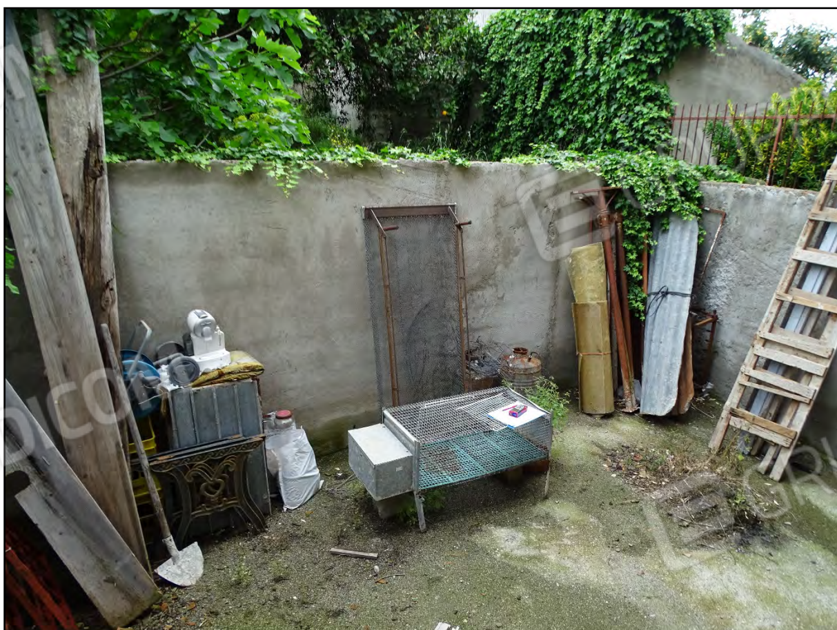
Imm. 19 - Piano primo. corte.