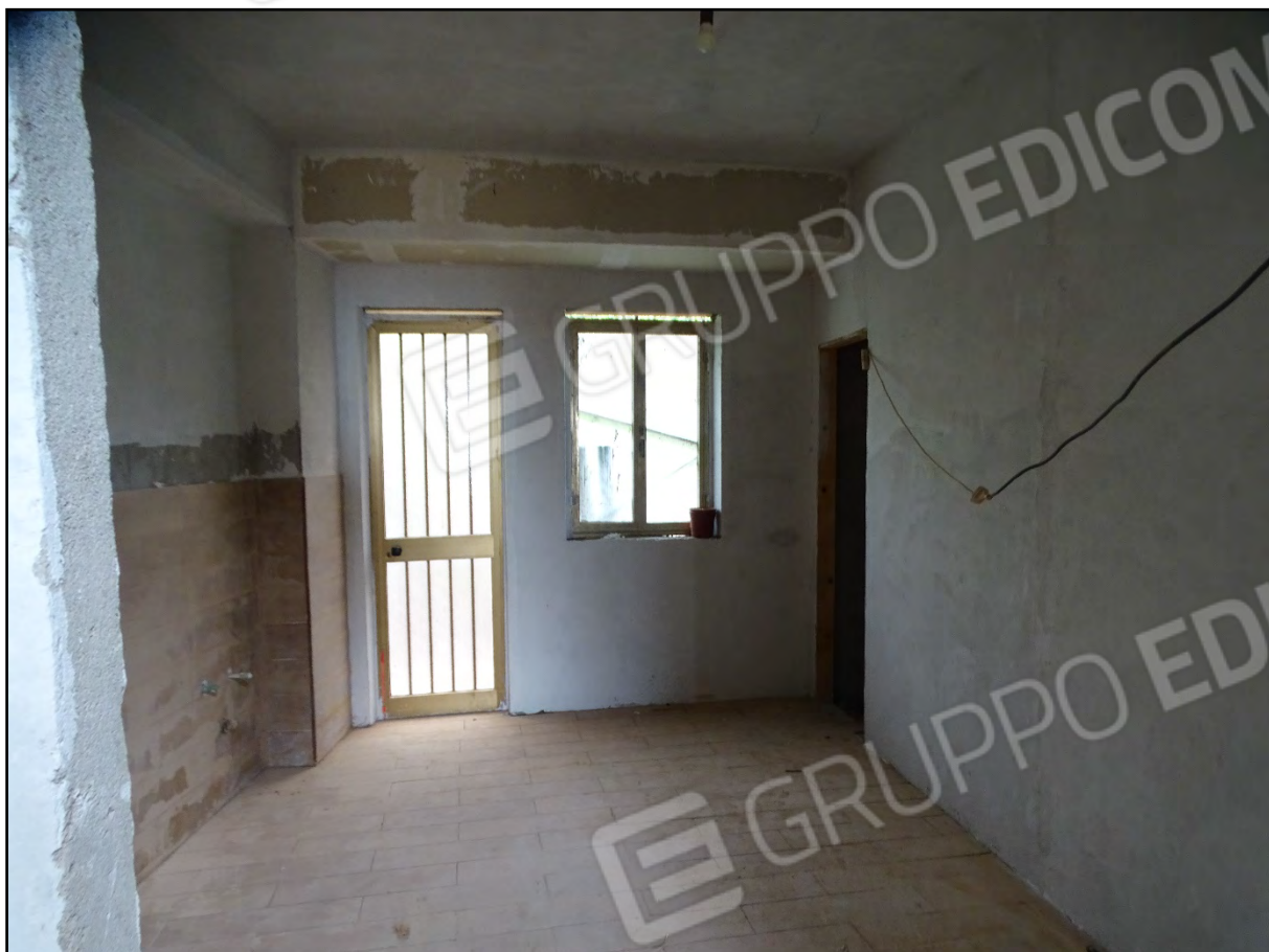
Imm. 16 - Piano primo. Vano cucina parzialmente rifinito. La porta da accesso alla corte.