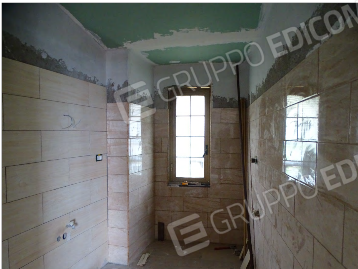
Imm. 24 - Piano secondo. Bagno.