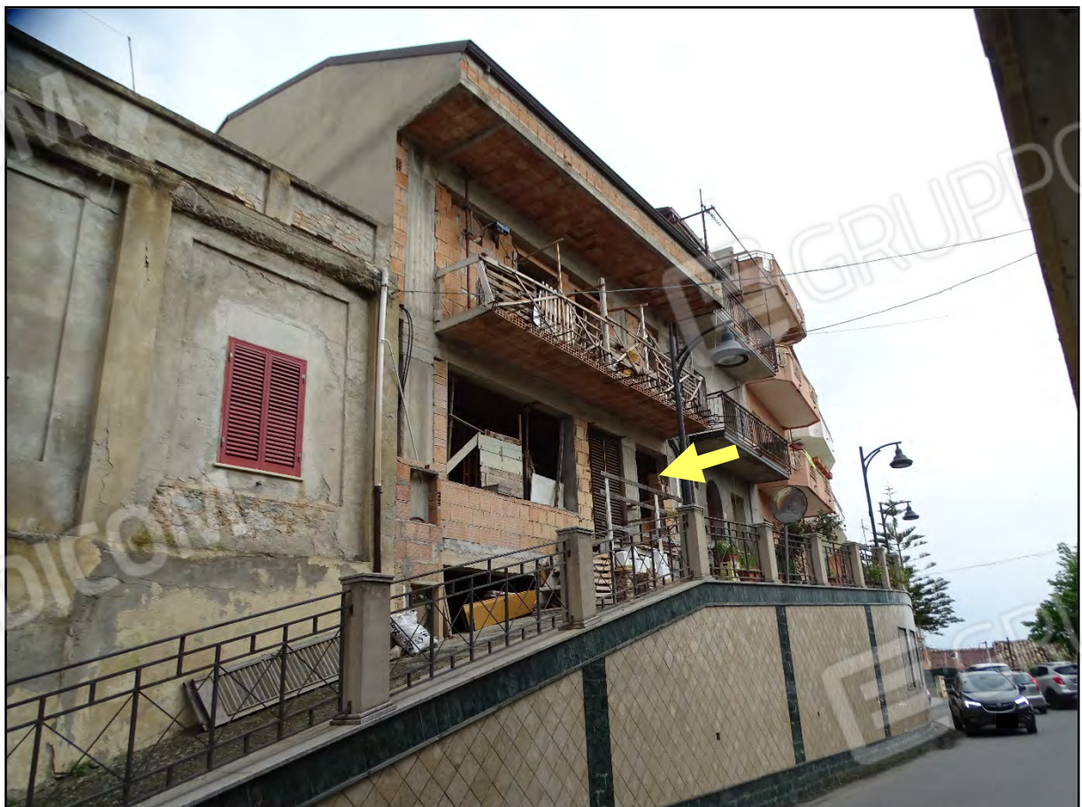
Imm. 2 - Vista fabbricato da Via Margherita. Sul lato sinistro la rampa di accesso ad un gruppo di fabbricati. In evidenza l'accesso all'immobile.