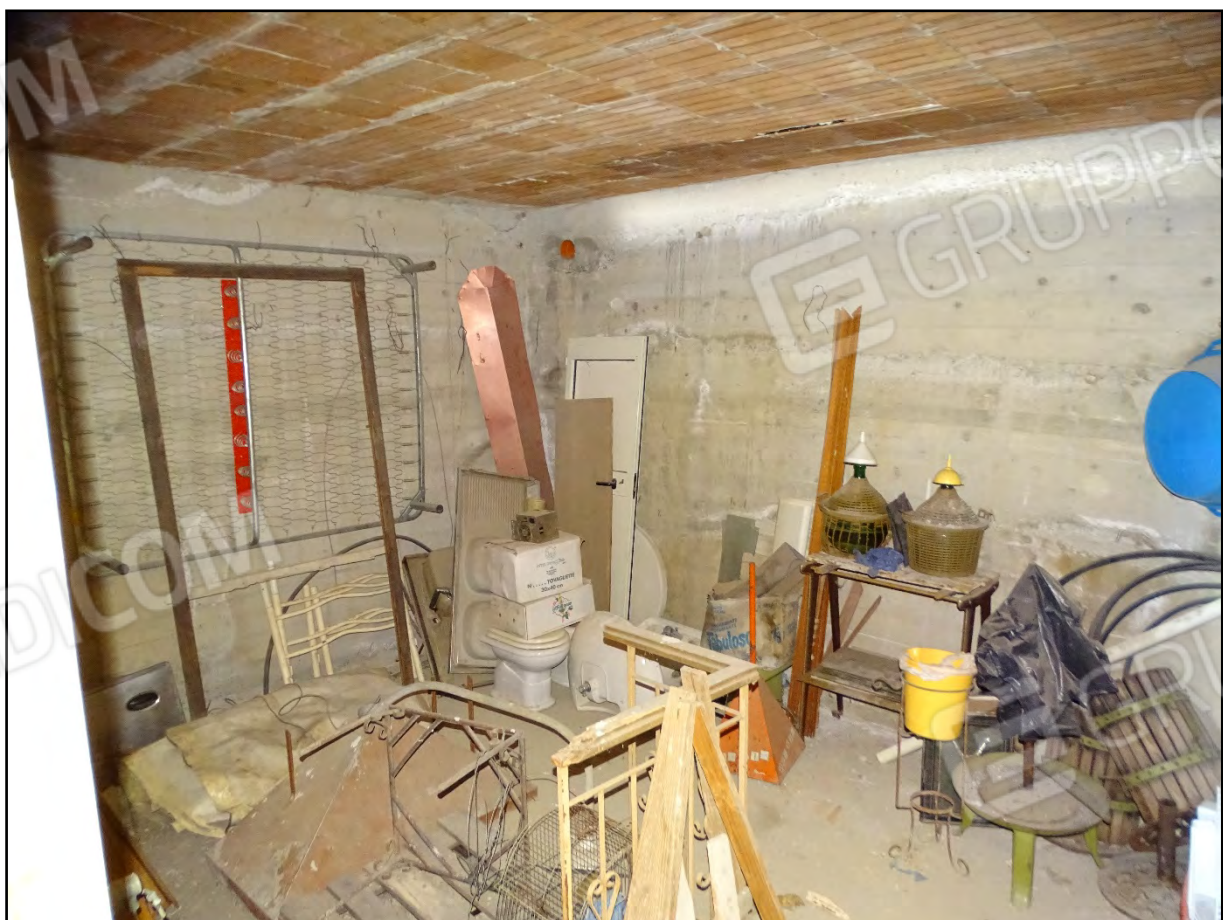
Imm. 9 - Piano terra. Vano coincidente con la soprastante corte.