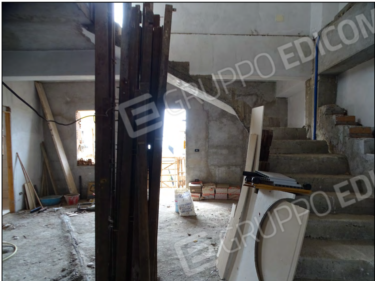
Imm. 14 - Piano primo. Vano prospiciente Via Margherita. Scala in c.a. di accesso al piano secondo.