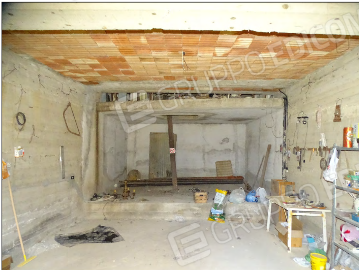
Imm. 12 - Piano interrato. Ampio vano. In fondo la zona rialzata coincidente con lo spazio destinato a corte.