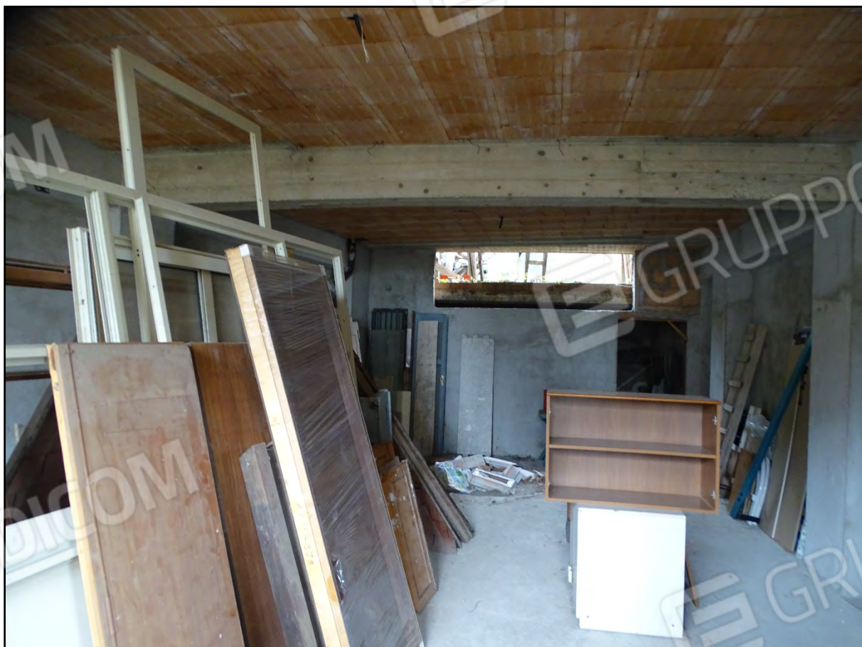
Imm. 7 - Piano terra. Vista dall'ingresso verso la corte.