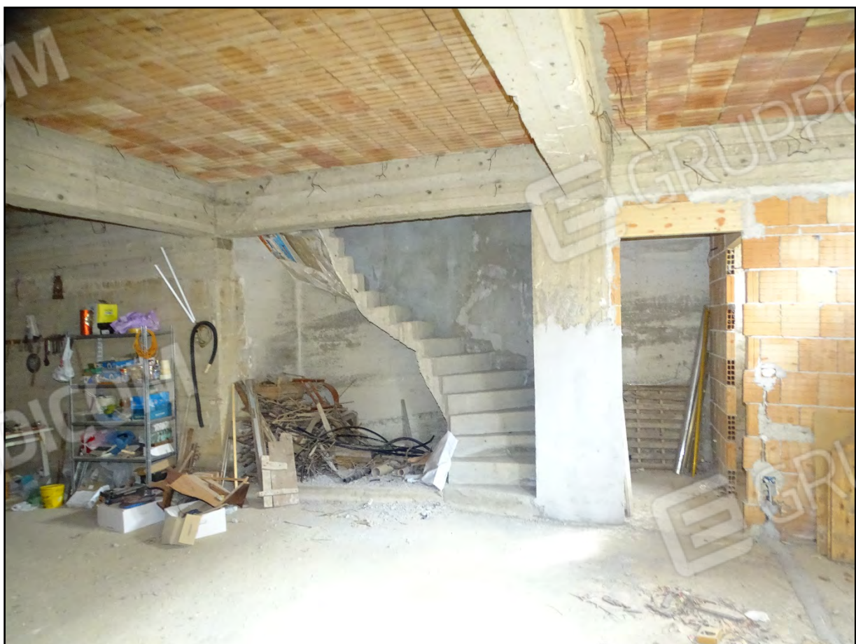
Imm. 11 - Piano interrato. Scale, wc e ampio vano.