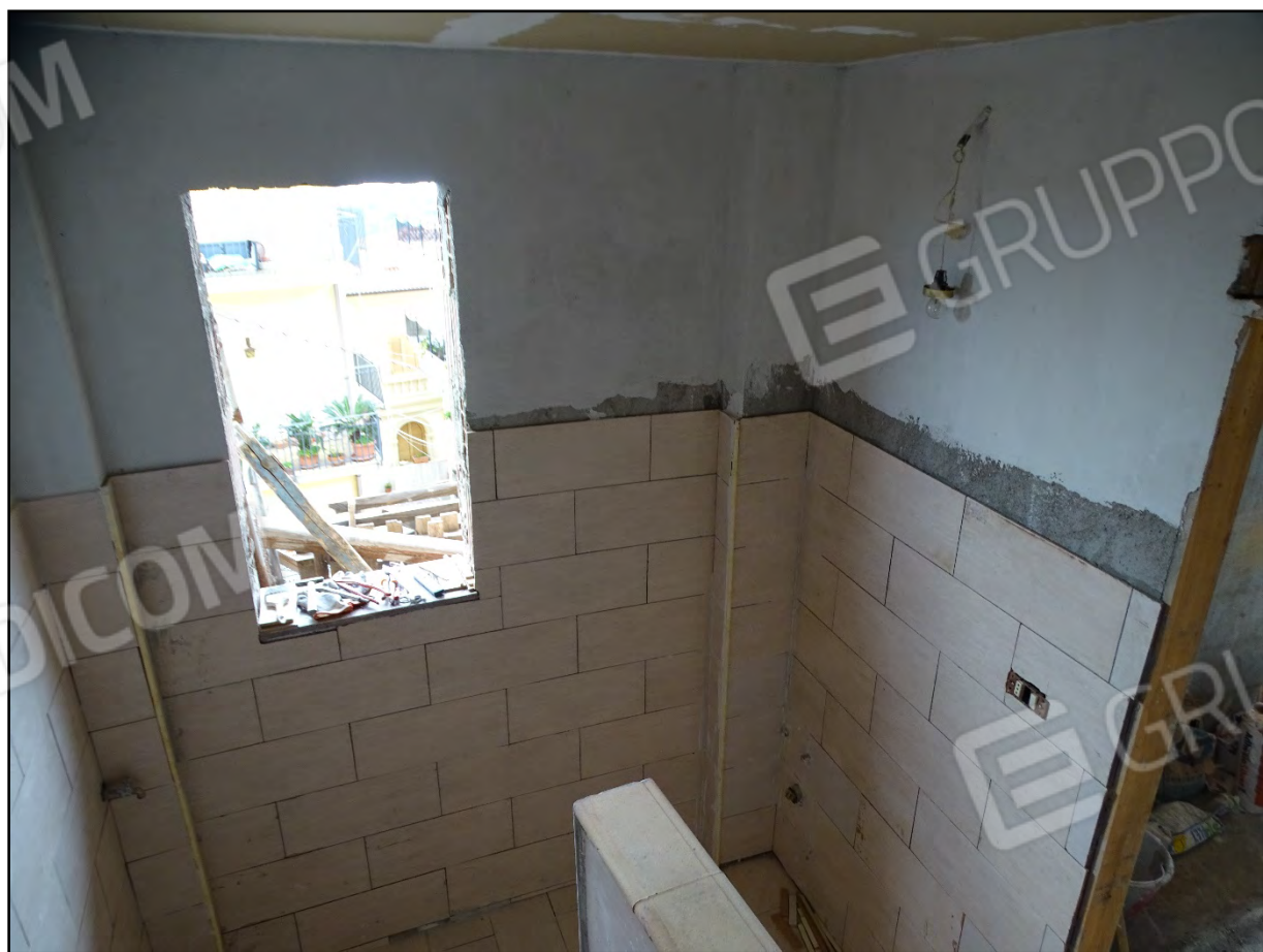
Imm. 15 - Piano primo. Wc parzialmente rifinito.