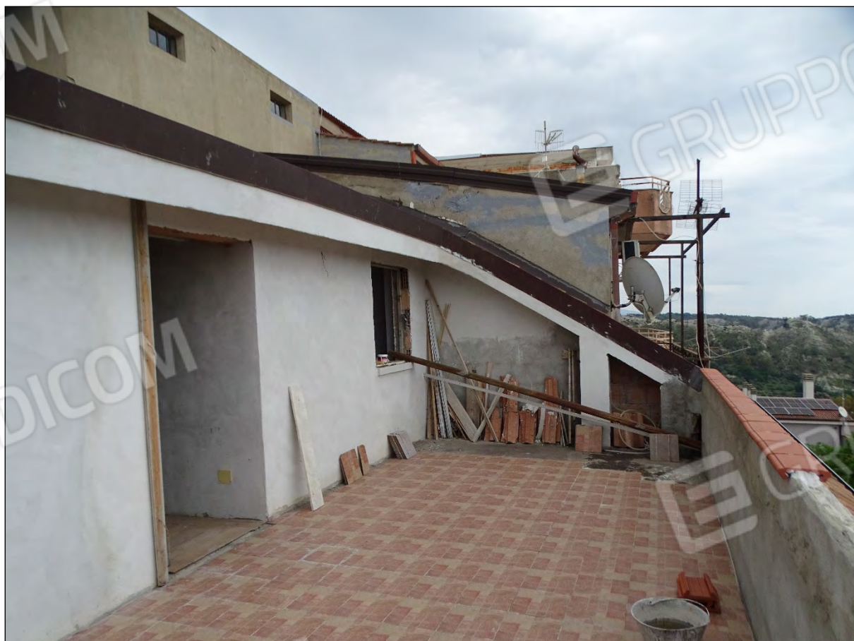
Imm. 25 - Piano secondo. Terrazzo prospiciente Via Margherita.