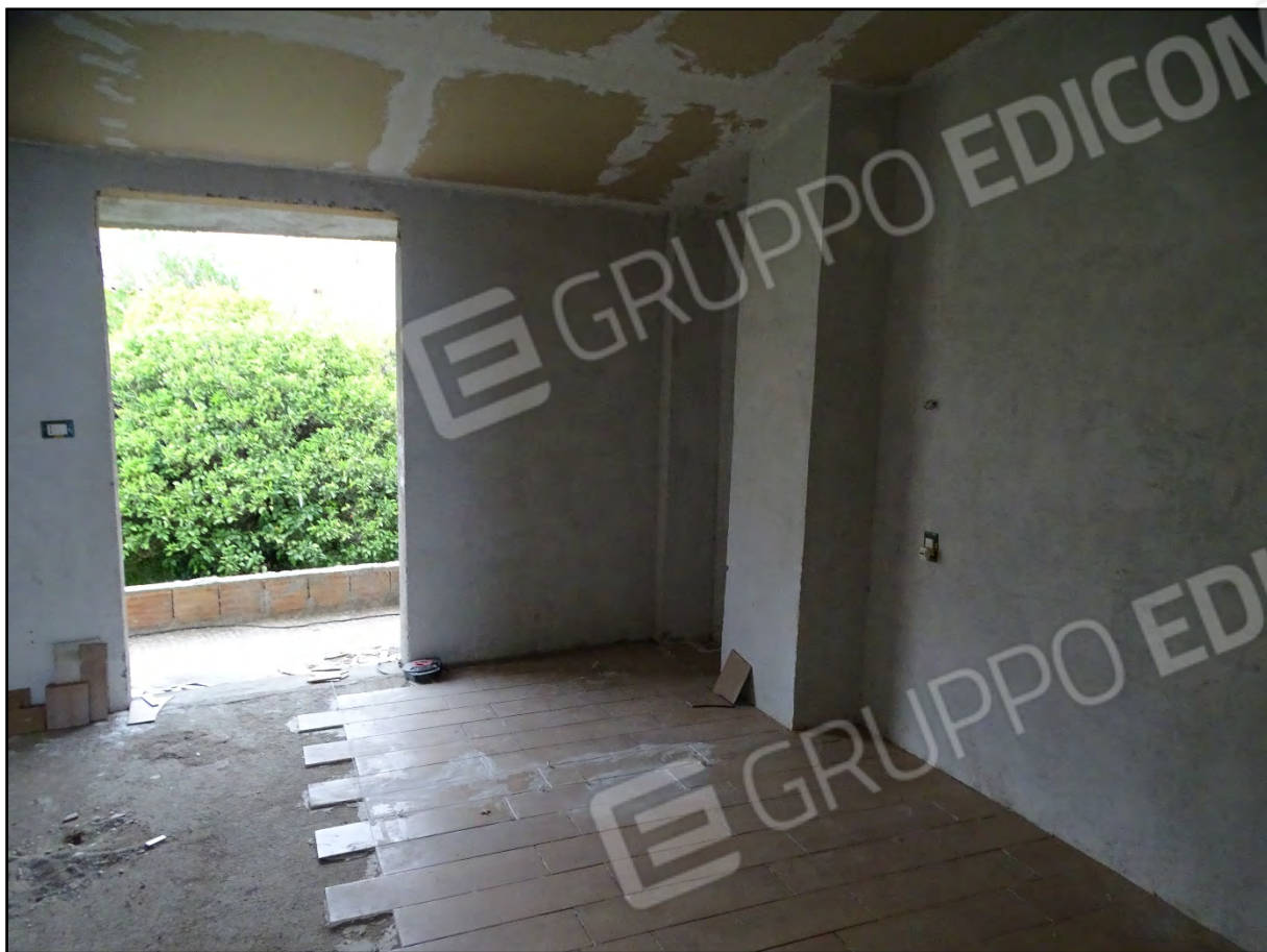
Imm. 22 - Piano secondo. Camera 1 lato corte.