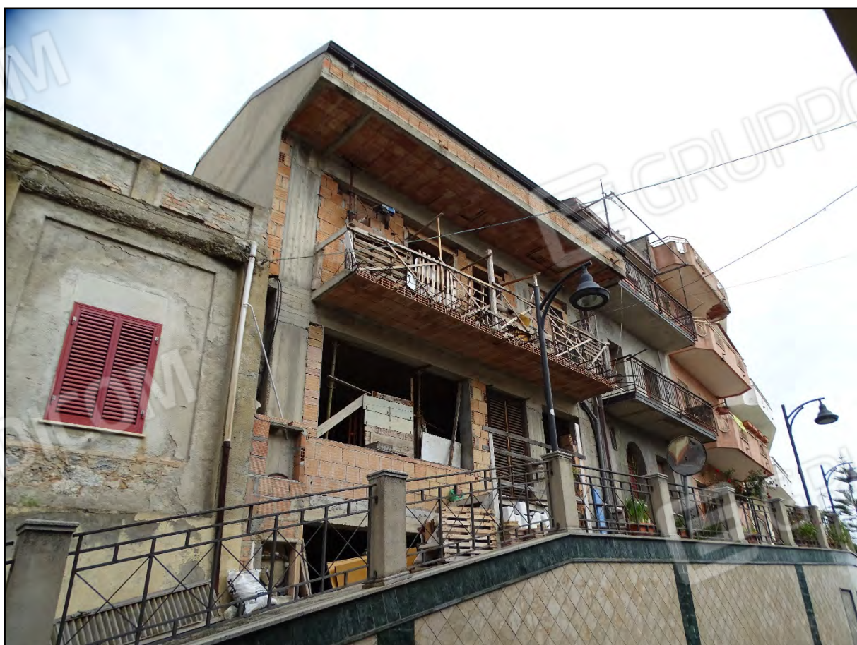
Imm. 4 - Fronte principale prospiciente Via Margherita.