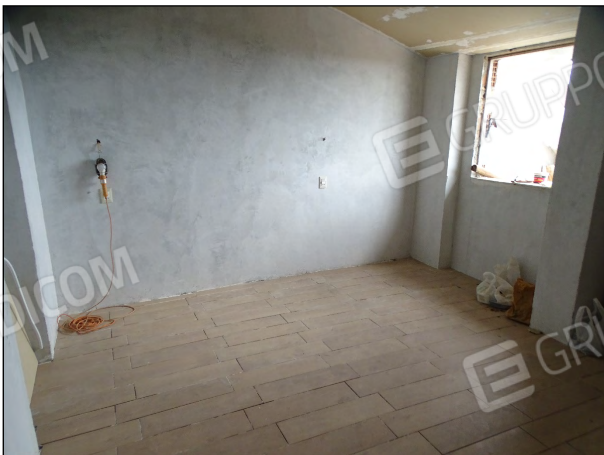
Imm. 21 - Piano secondo. Camera lato terrazza.