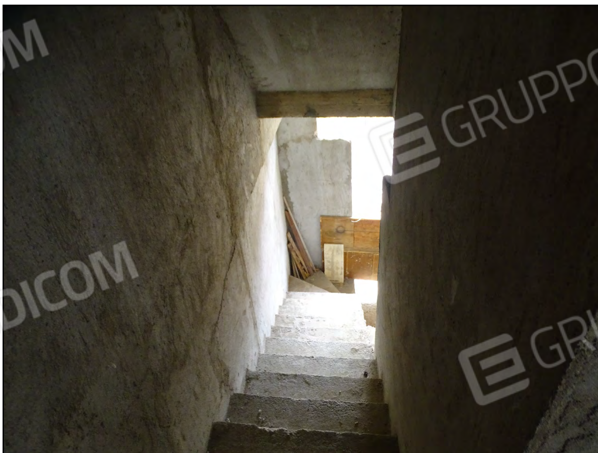
Imm. 13 - Piano terra. Scale di accesso al piano primo.