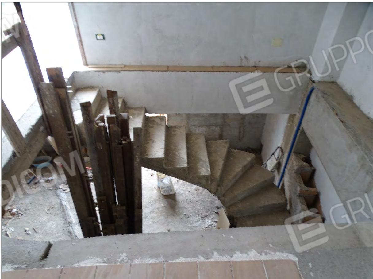
Imm. 27 - Piano secondo. Scala in c.a. di accesso posta al piano primo.