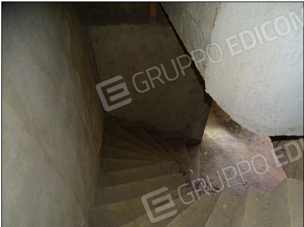
Imm. 10 - Piano terra. Scale di accesso al piano interrato.