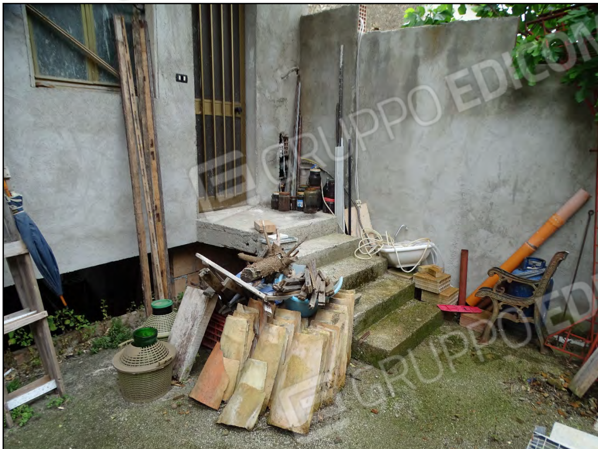
Imm. 18 - Piano primo. Accesso alla corte.