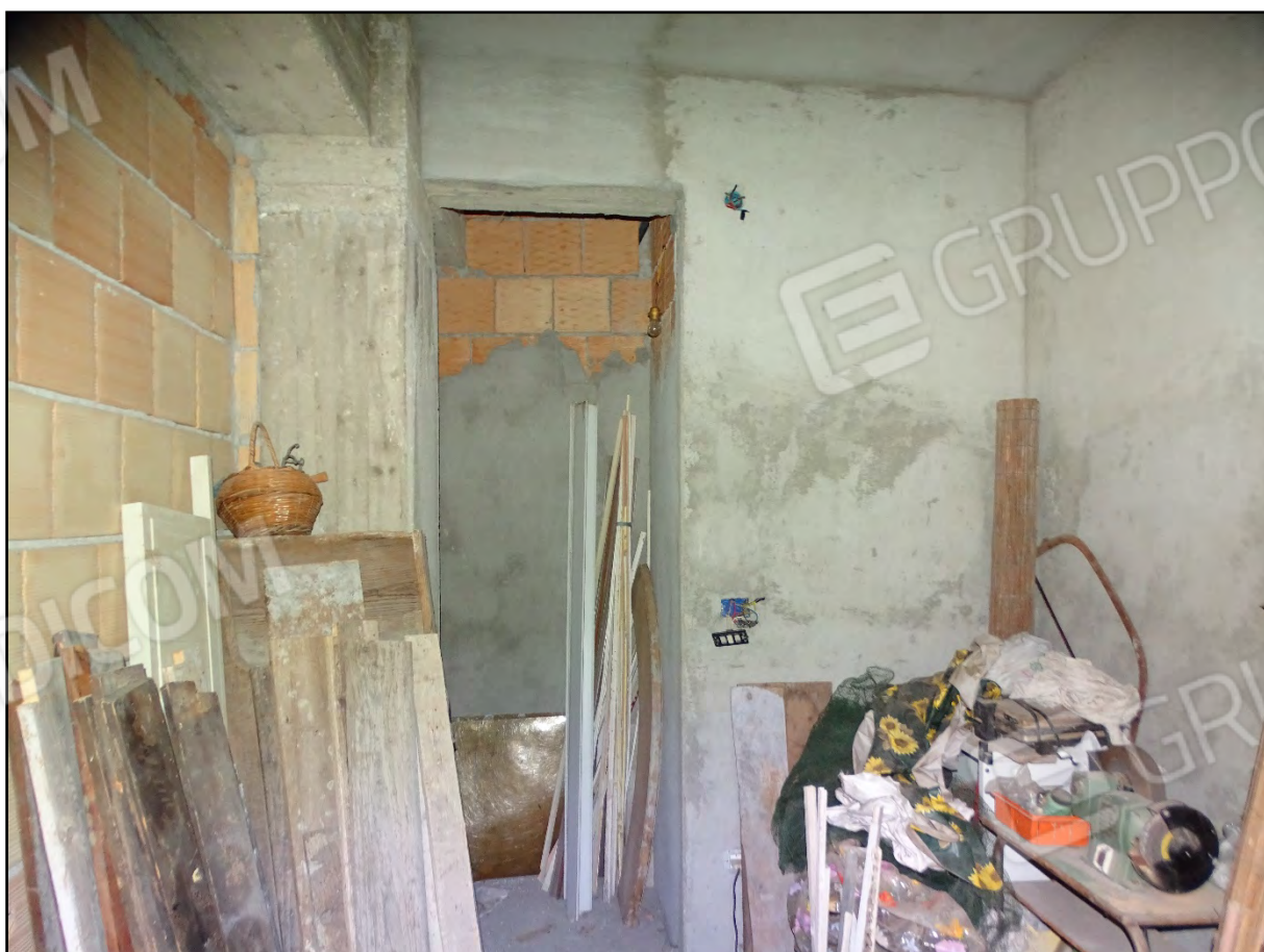
Imm. 17 - Piano primo. Ripostiglio adiacente alla cucina.