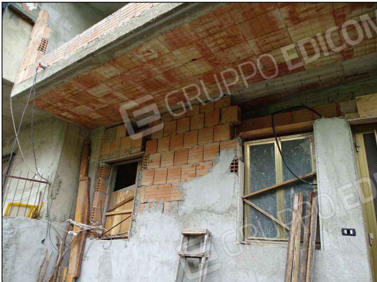
Imm. 20 - Piano primo. Vista prospetto dalla corte.