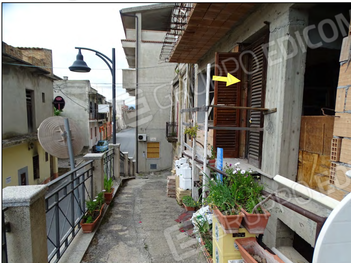
Imm. 3 - Vista fabbricato dalla rampa. Sul lato destro, indicato dalla freccia, l'accesso al piano terra.