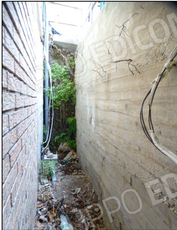
Imm. 5 - Quota ingresso Scannafosso. Si vede il ballatoio, Imm. 6 - Quota piano interrato. Scannafosso Ballatoio in tavole da carpenteria di accesso al piano terra.