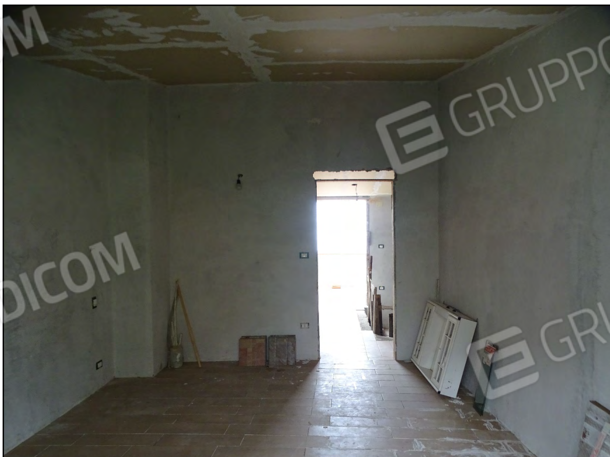
Imm. 23 - Piano secondo. Camera 2 lato corte.