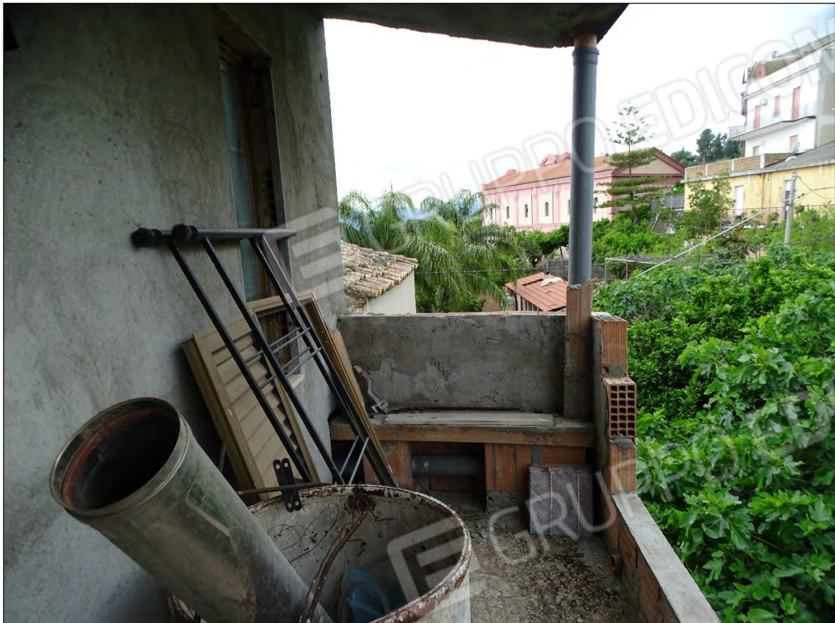
Imm. 26 - Piano secondo. Balcone prospiciente sulla corte.