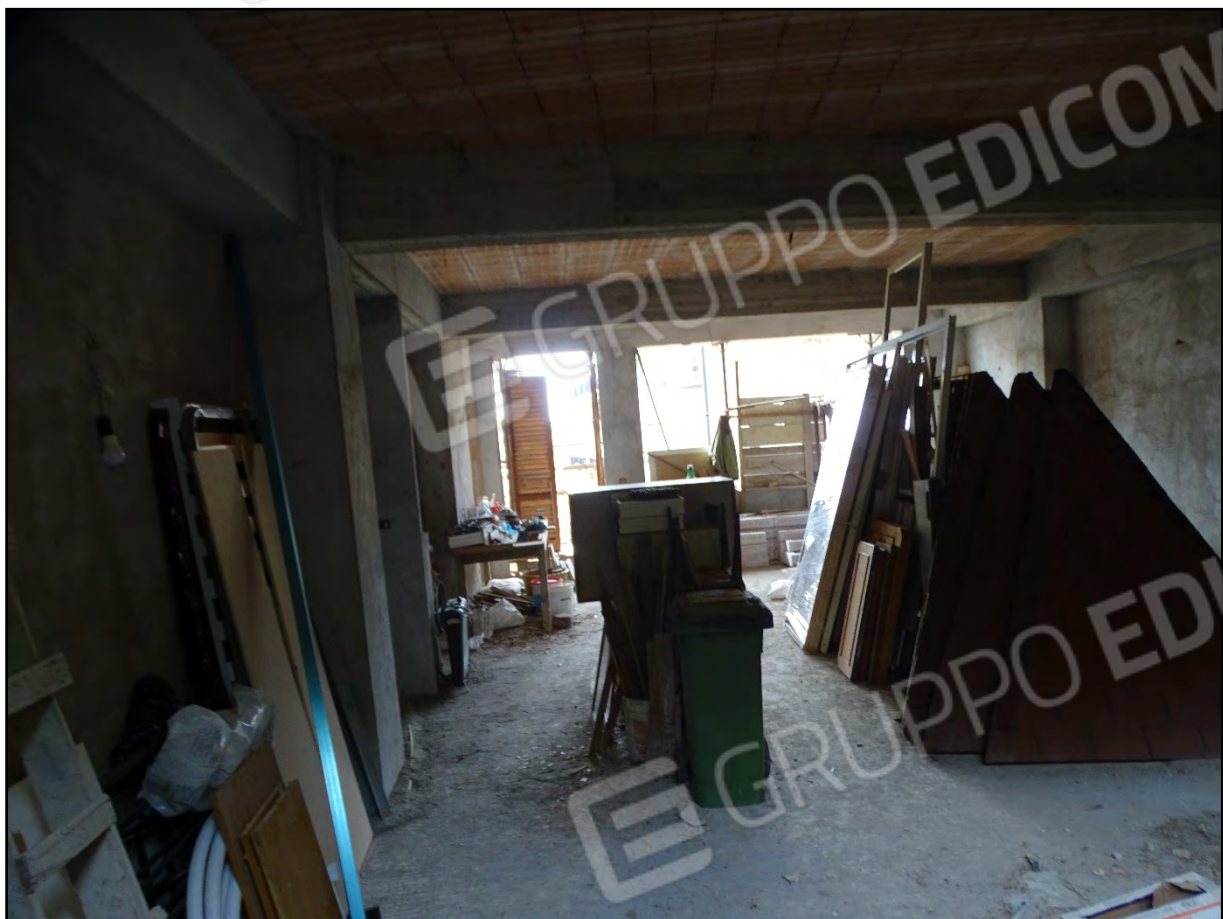
Imm. 8 - Piano terra. Vista verso l'ingresso.