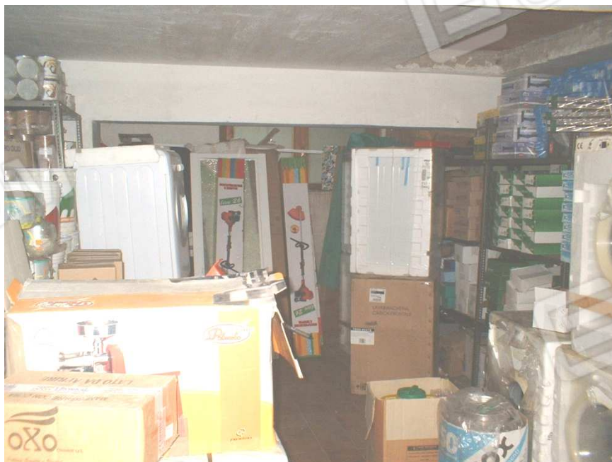
Foto 6- Area centrale dell'immobile