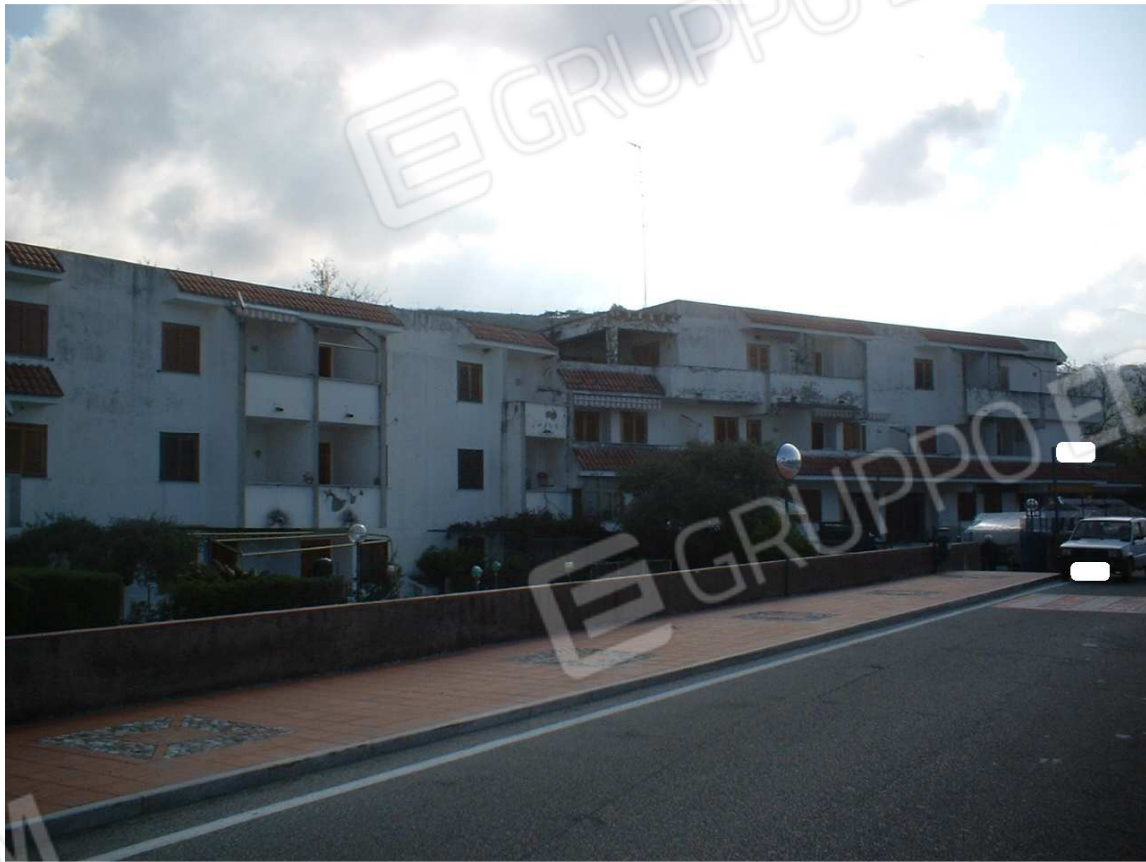
Foto 1- Facciata Ovest del fabbricato