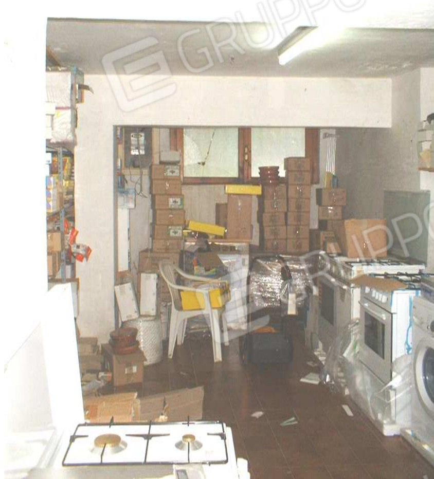
Foto 5- Area sud dell'immobile