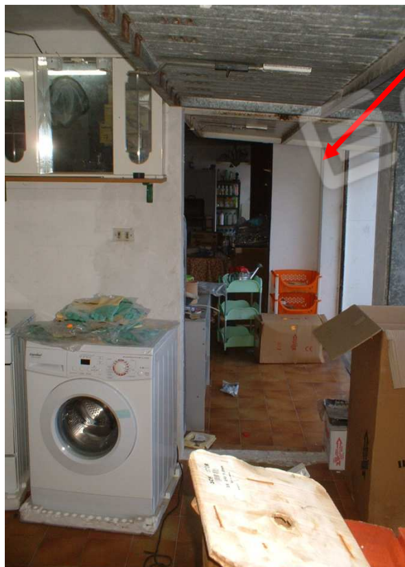
Foto 4- Varco di comunicazione con locale adiacente sulla parete sud/sud-est