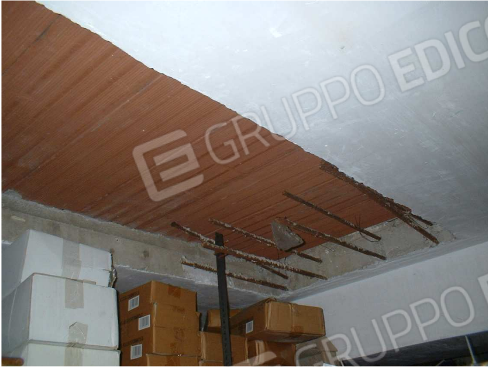
Foto 9- Dettaglio porzione solaio ammalorato