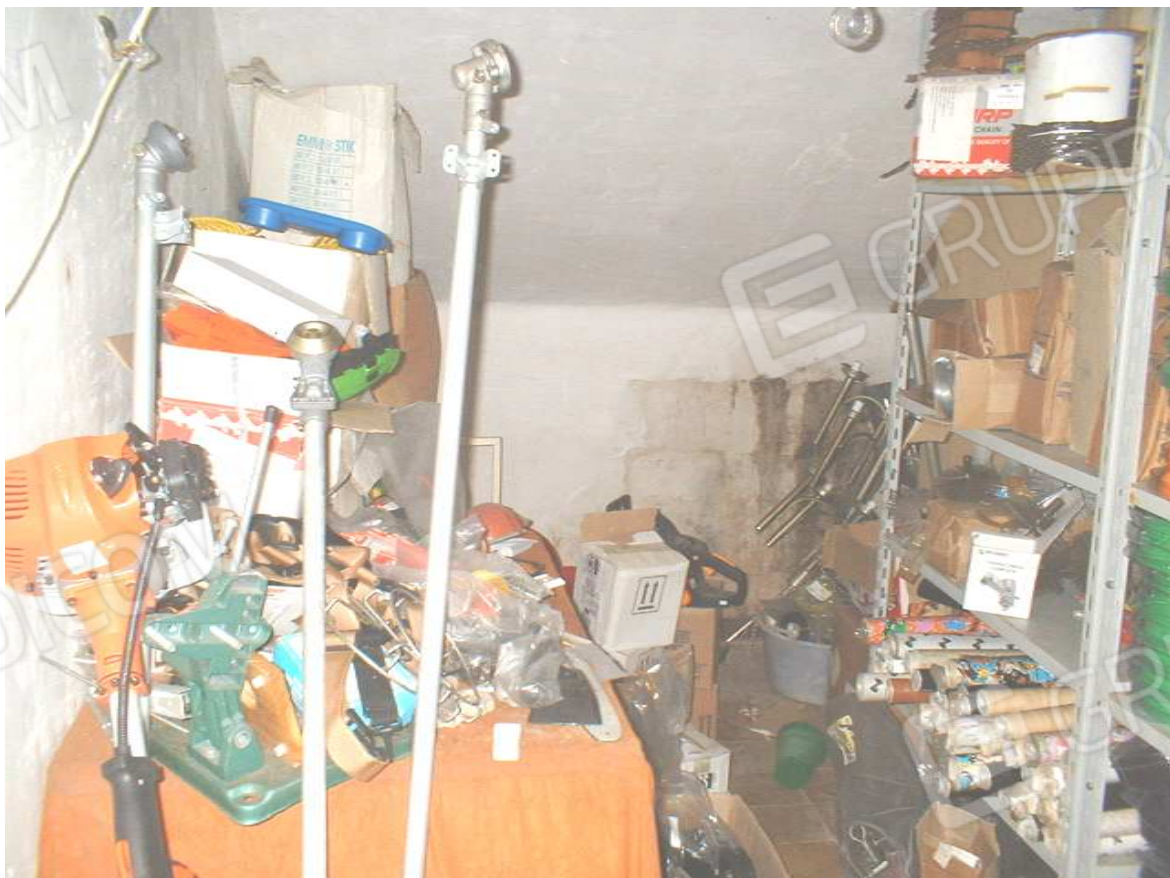
Foto 8- Dettaglio parete ovest sottoscala