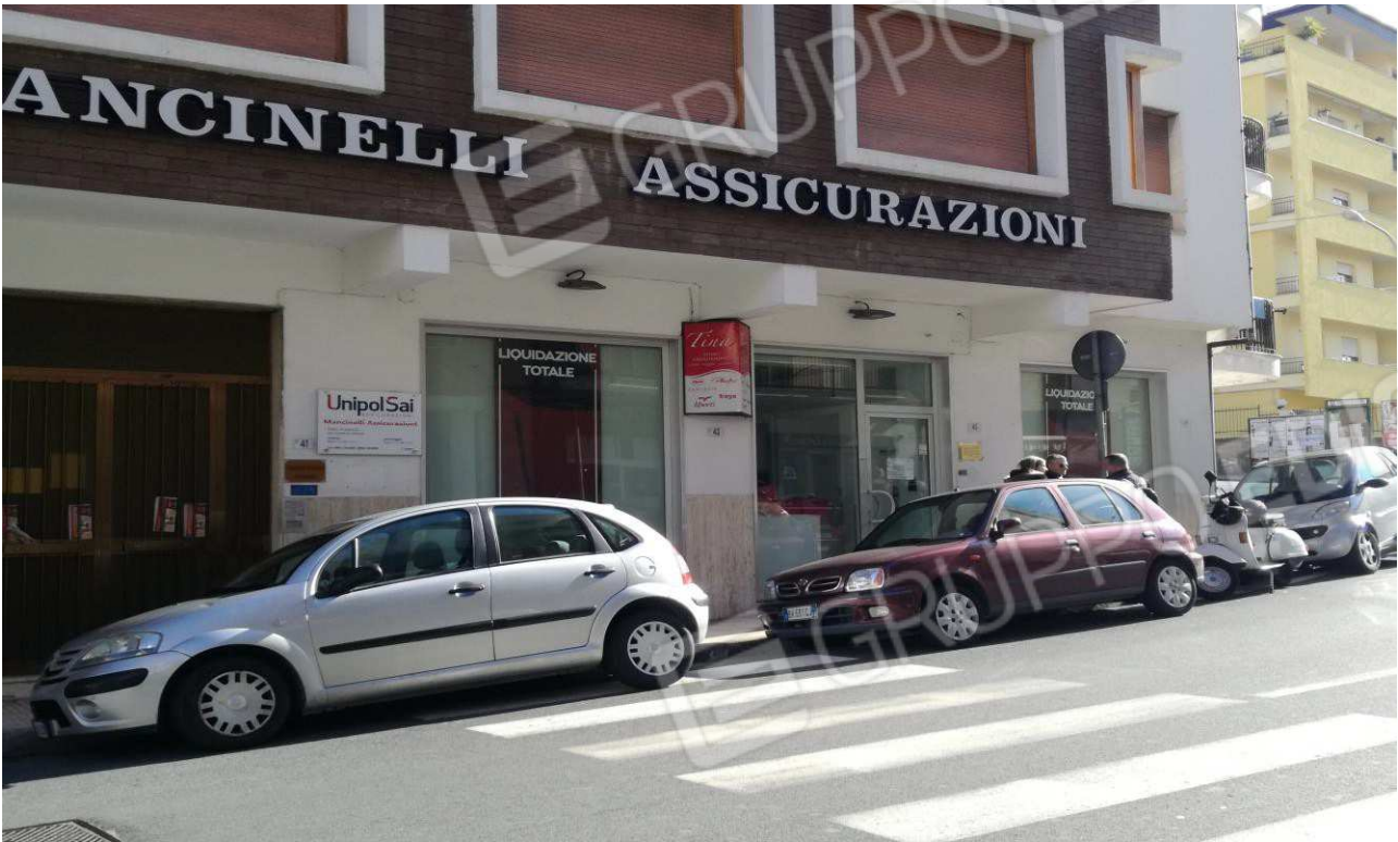
Foto n° 2 – Prospetto Ovest (immagine 1) fronte strada (Via del Cannone) del locale Negozio –

Locale Negozio P.T. in Via del Cannone, 43/45 - (F. 21 p.lla 183 sub 2)