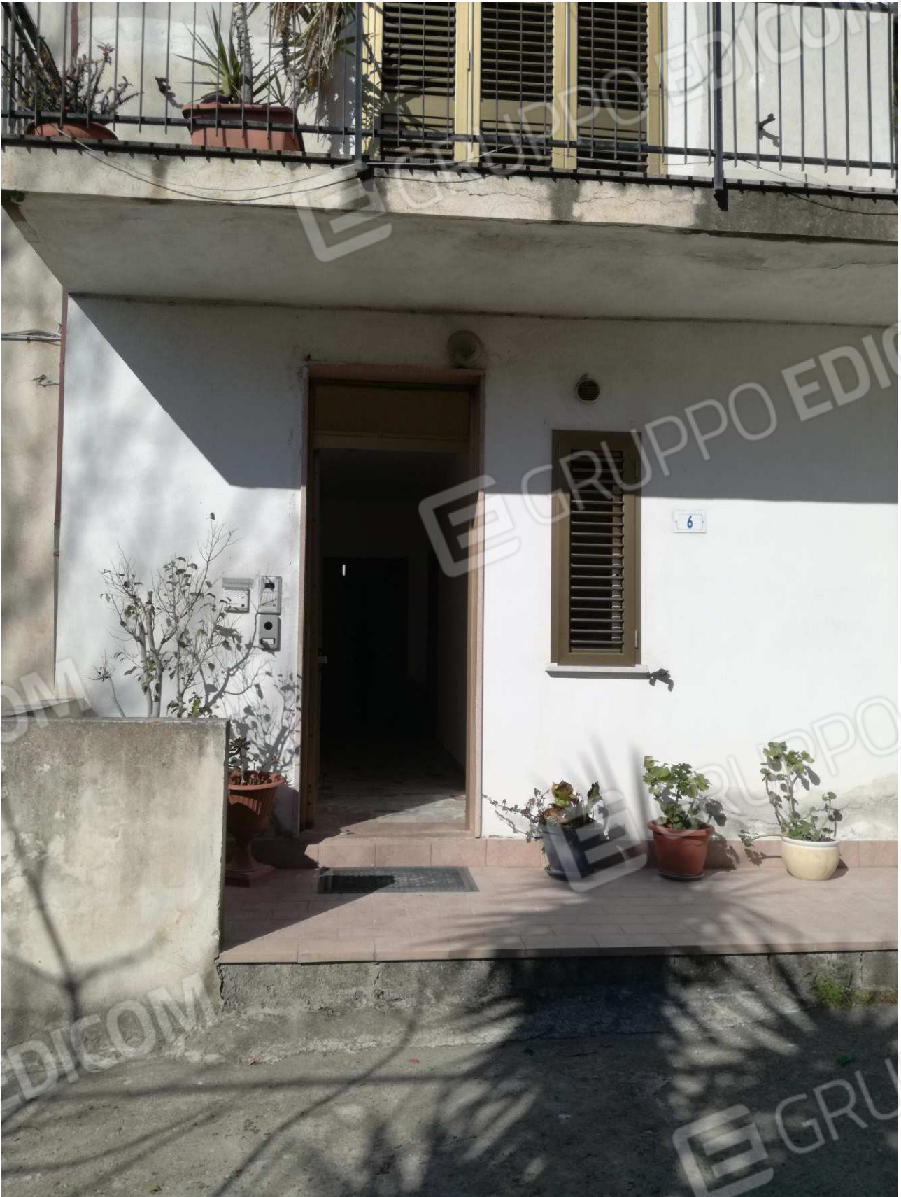
Foto n° 10 – Accesso androne comune (sub 7) fronte strada (Via T. Campanella), dell'appartamento –