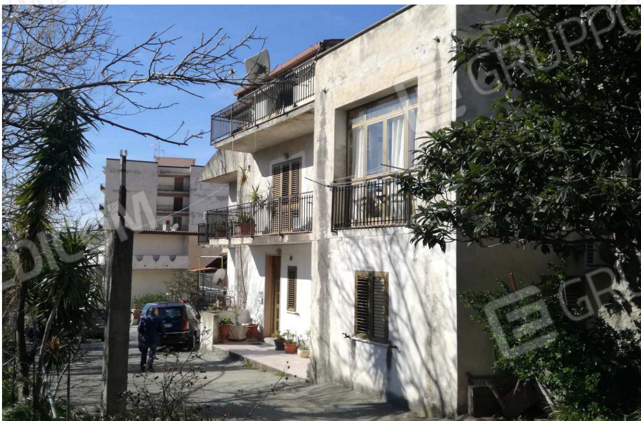
Foto n° 9 – Prospetto Sud-Est su Via T. Campanella dell'appartamento -