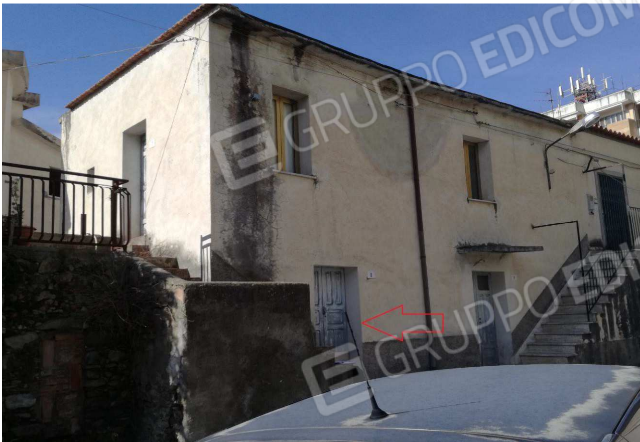
Foto n° 21 – Prospetto Sud-Est fronte strada (Via T. Campanella) –