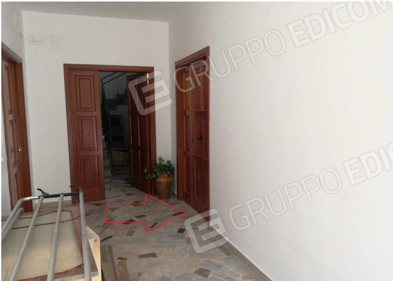
Foto n° 11 – Androne comune (sub 7) con indicazione ingresso appartamento –