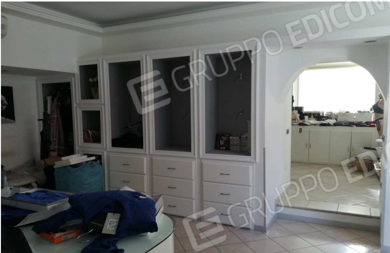
Foto n° 6 – Interno locale Negozio (immagine 3) con vista accesso sull'unità immobiliare adiacente di altra ditta NON interessata –