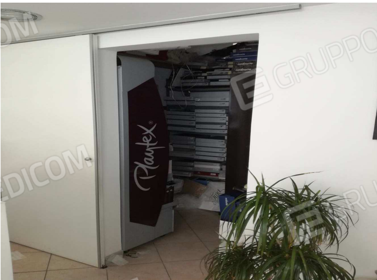
Foto n° 7 – Interno locale Negozio (immagine 4) con vista su retro-negozio adibito a ripostiglio/deposito –