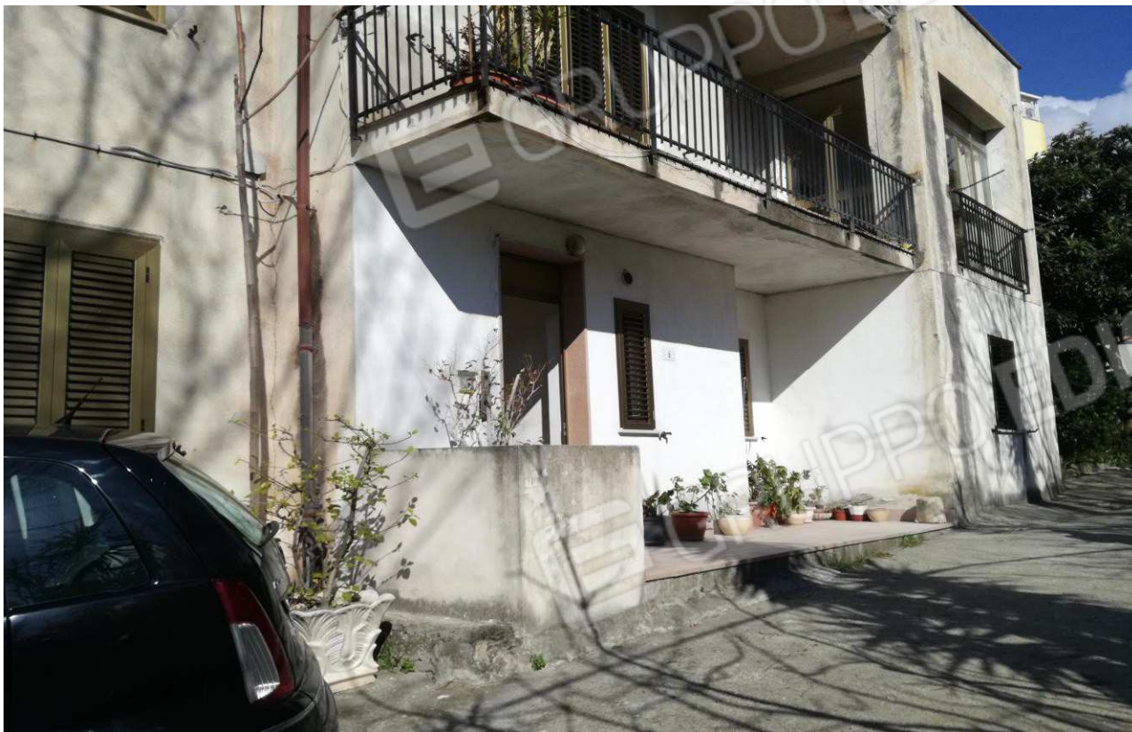
Foto n° 8 – Prospetto Sud-Ovest su Via T. Campanella dell'appartamento –