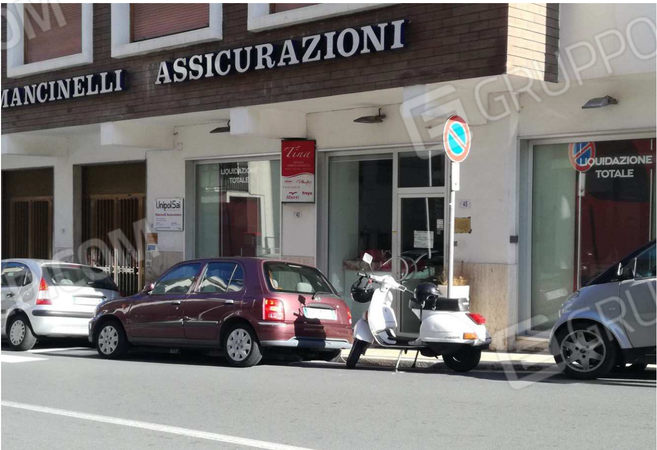
Foto n° 3 – Prospetto Ovest (immagine 2) fronte strada (Via del Cannone) del locale Negozio –