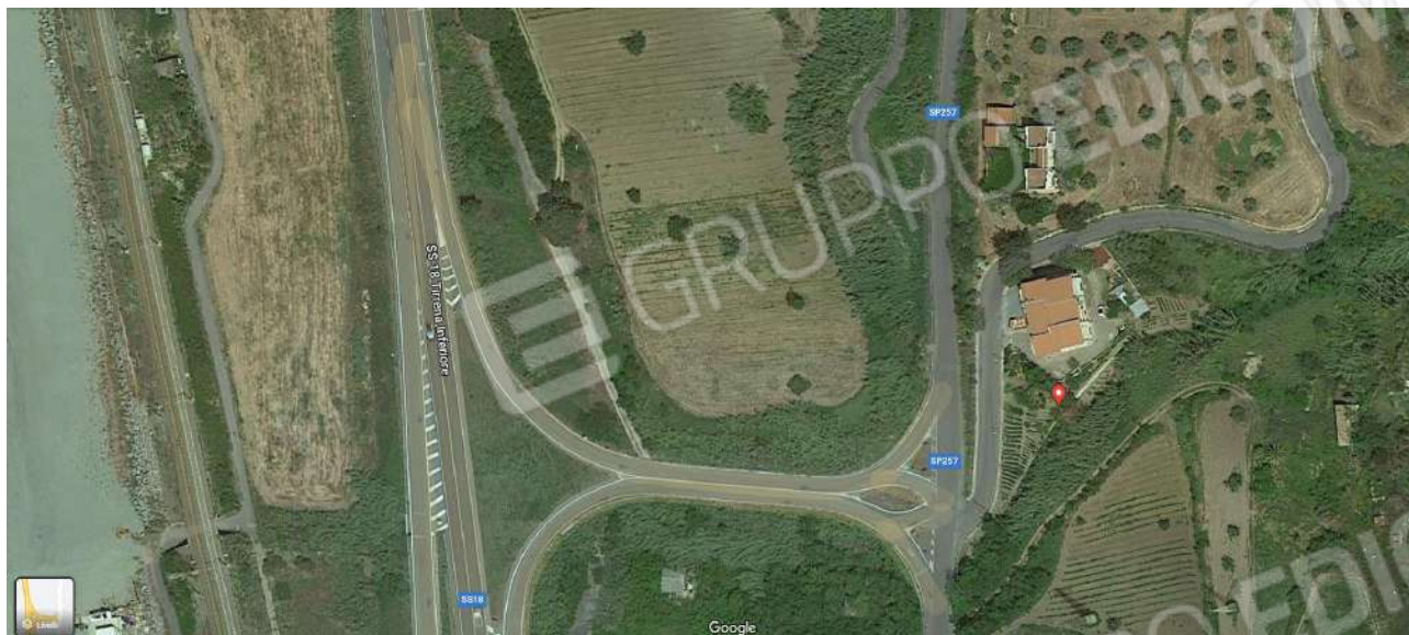
Vista della zona dall'alto - 39.110425, 16.080688