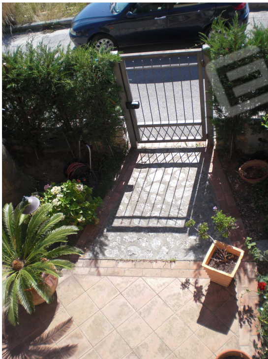
FOTO 7 - accesso alla corte - lato ovest