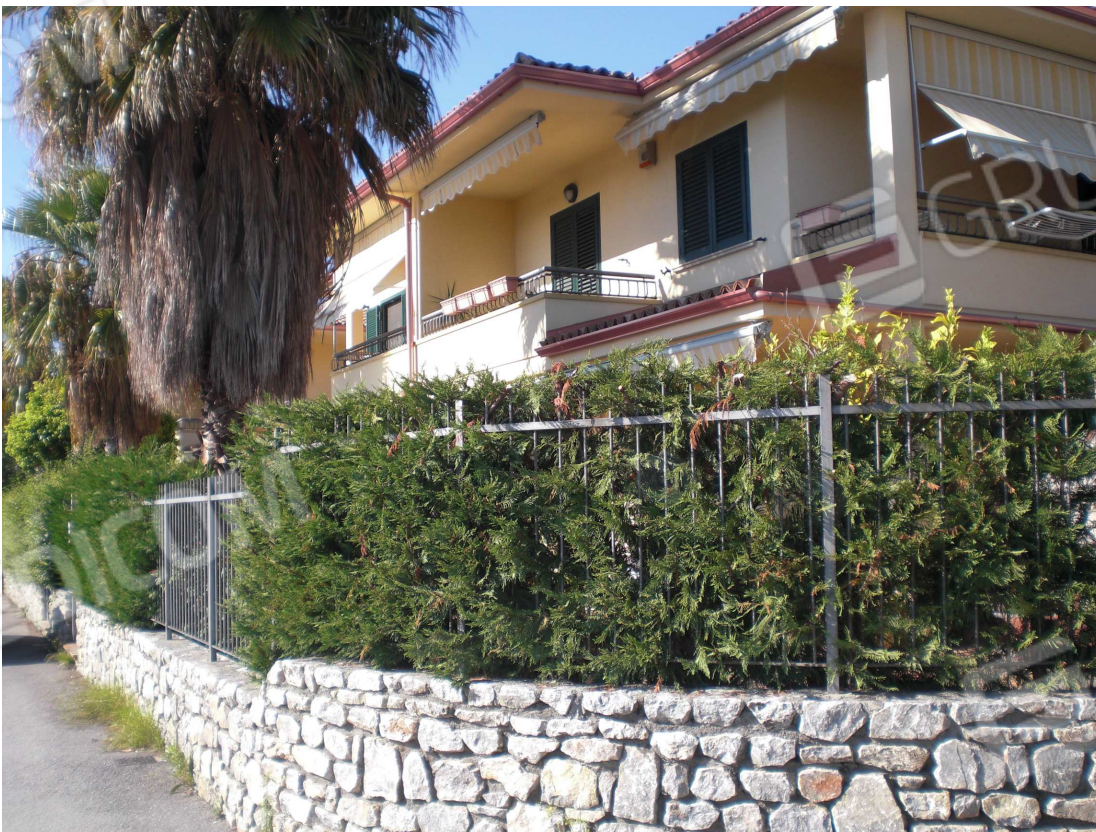
– Prospetto lato ovest