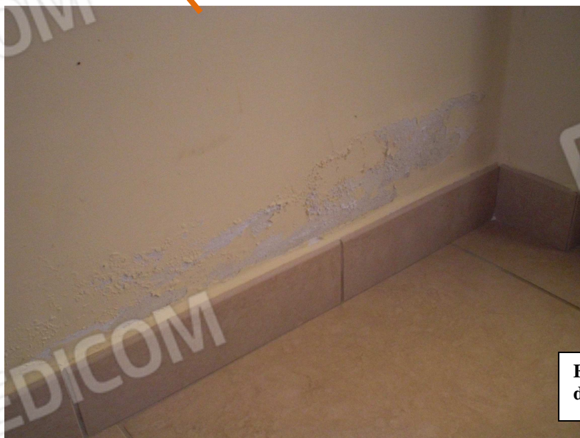
FOTO 13 - Particolare foto 12 – vista della parete cucina/soggiorno