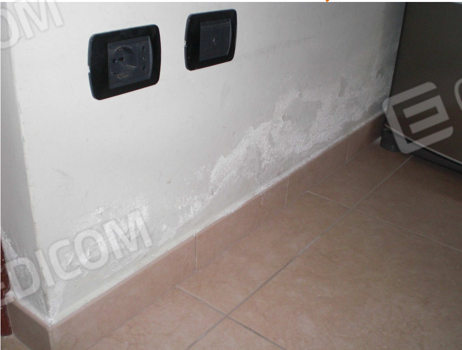
FOTO 24 - Particolare foto 23 - parete cucina/intercapedine