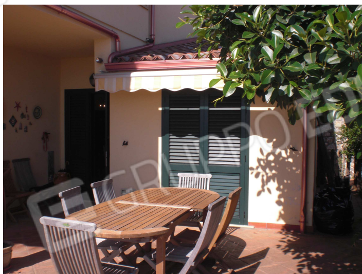
FOTO 8 - ingresso e cucina - lato ovest