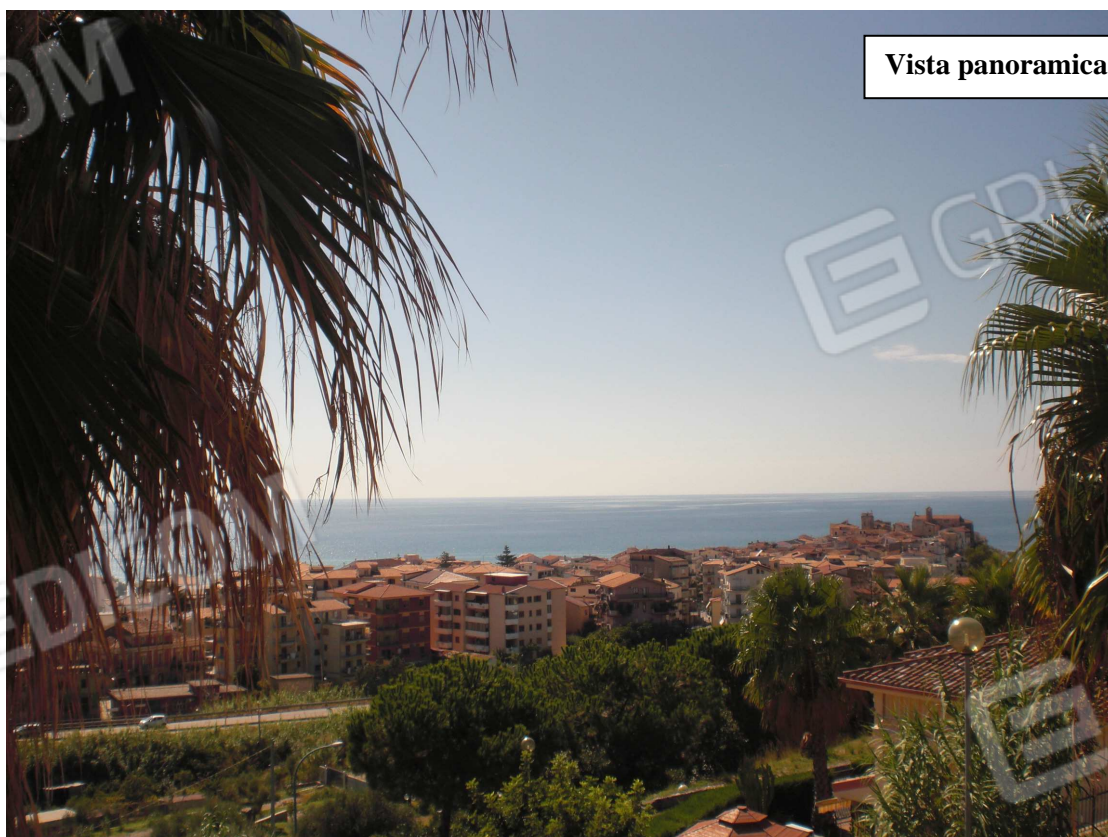
Vista panoramica dall'alloggio