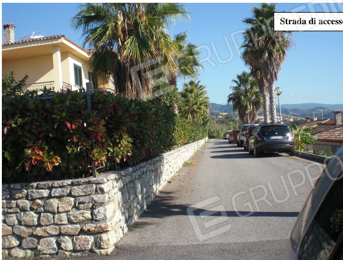
Strada di accesso all'immobile