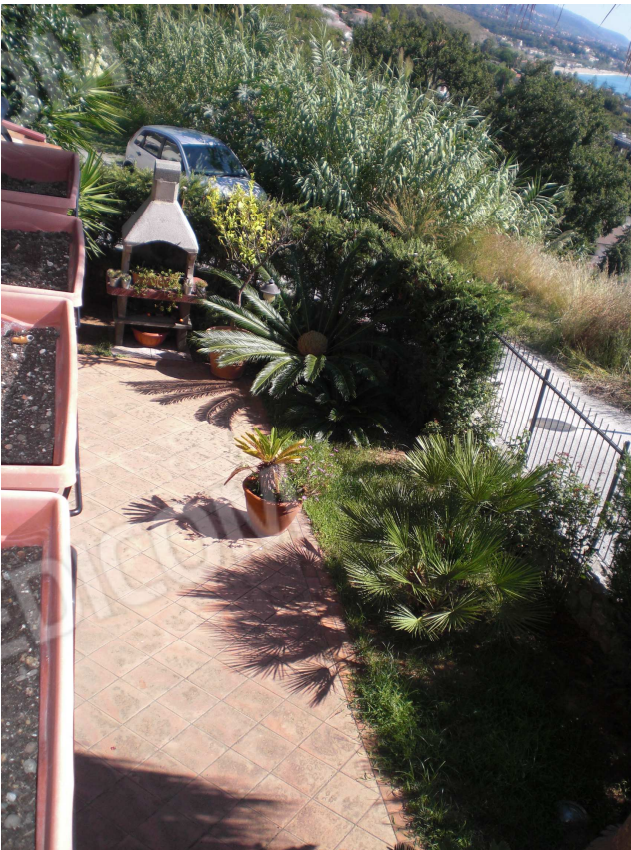
FOTO 5 - corte lato ovest