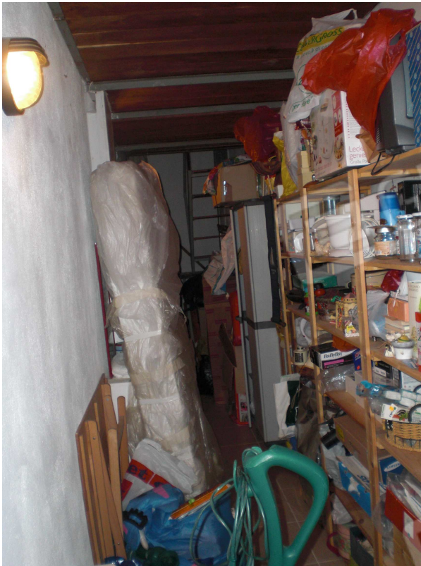
FOTO 25 - intercapedine