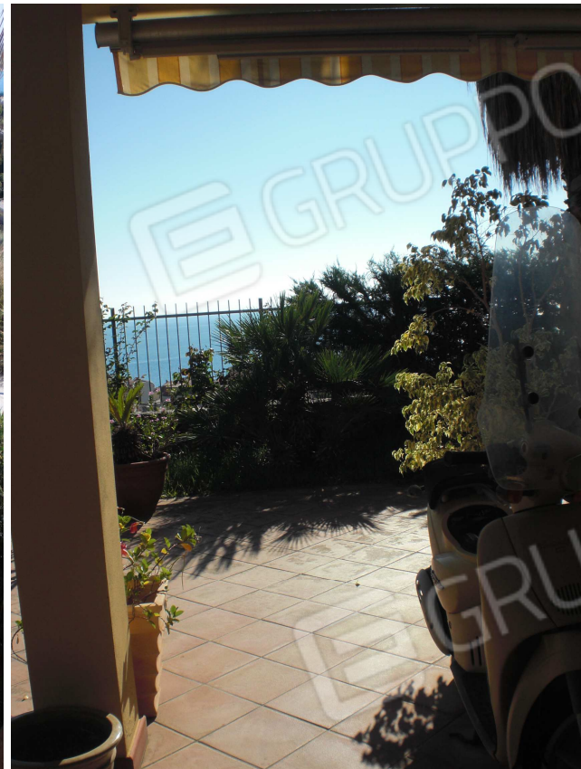
FOTO 6 - corte lato ovest