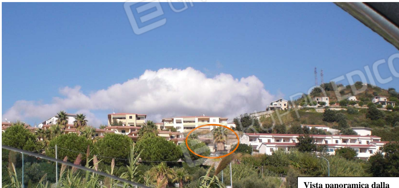
Vista panoramica dalla SS 18

Individuazione dell'immobile nel contesto ambientale – f. 13, p.lla 963, sub graffati 4 e 8 (corte)