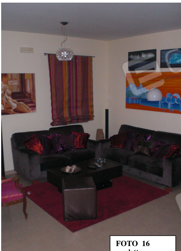
FOTO 16 - salotto