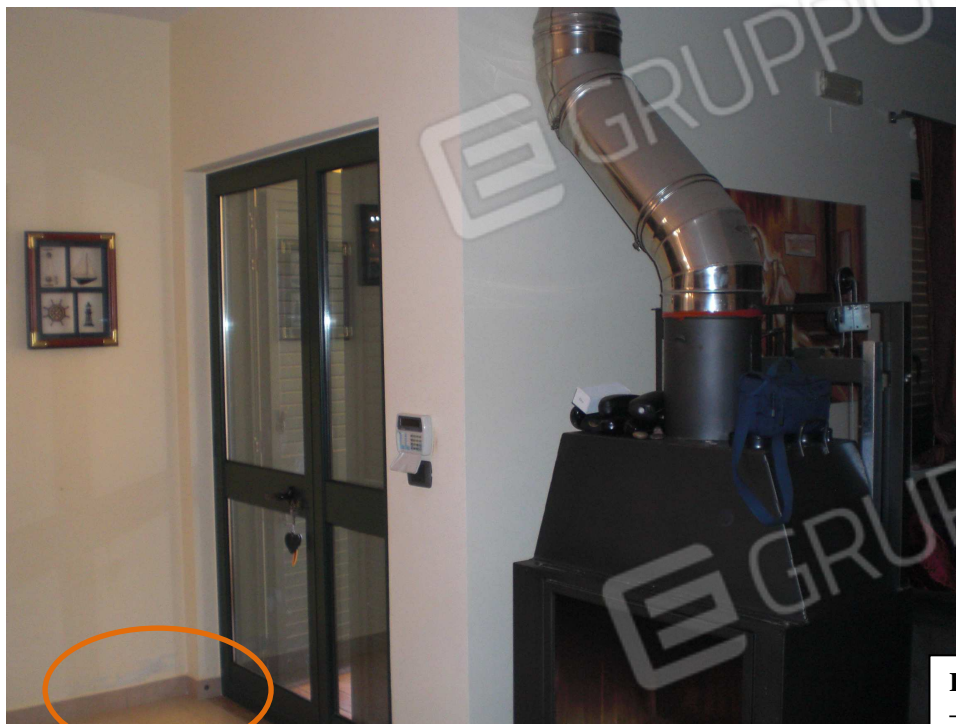
FOTO 12 - ingresso al soggiorno