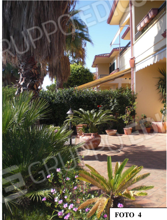
FOTO 4 - corte lato ovest