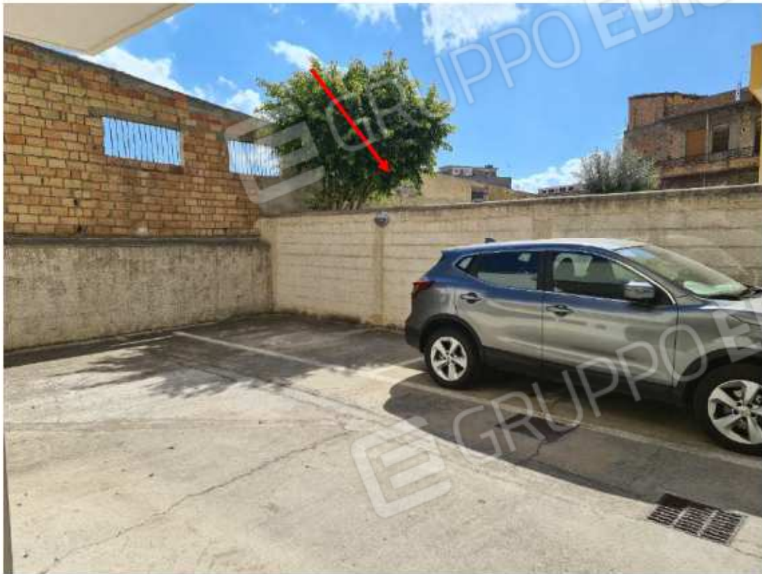
Vista dal lato part. 376 sub 52

Area urbana posto al piano seminterrato del maggior fabbricato a 7 piani f.t., sito in Reggio Calabria Strada Statale 18 I° Tratto n.1/C, riportata nel NCEU al foglio 19 particella 376 sub 27