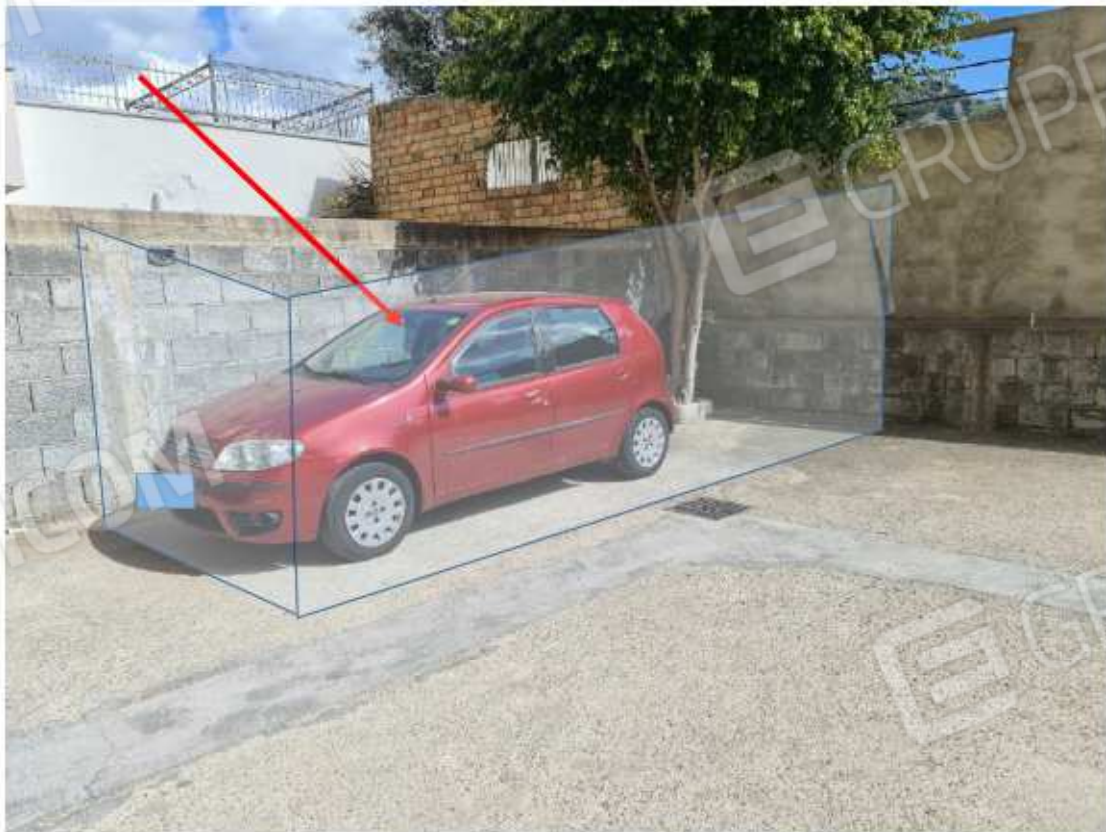
Vista dal lato part. 366 altra ditta