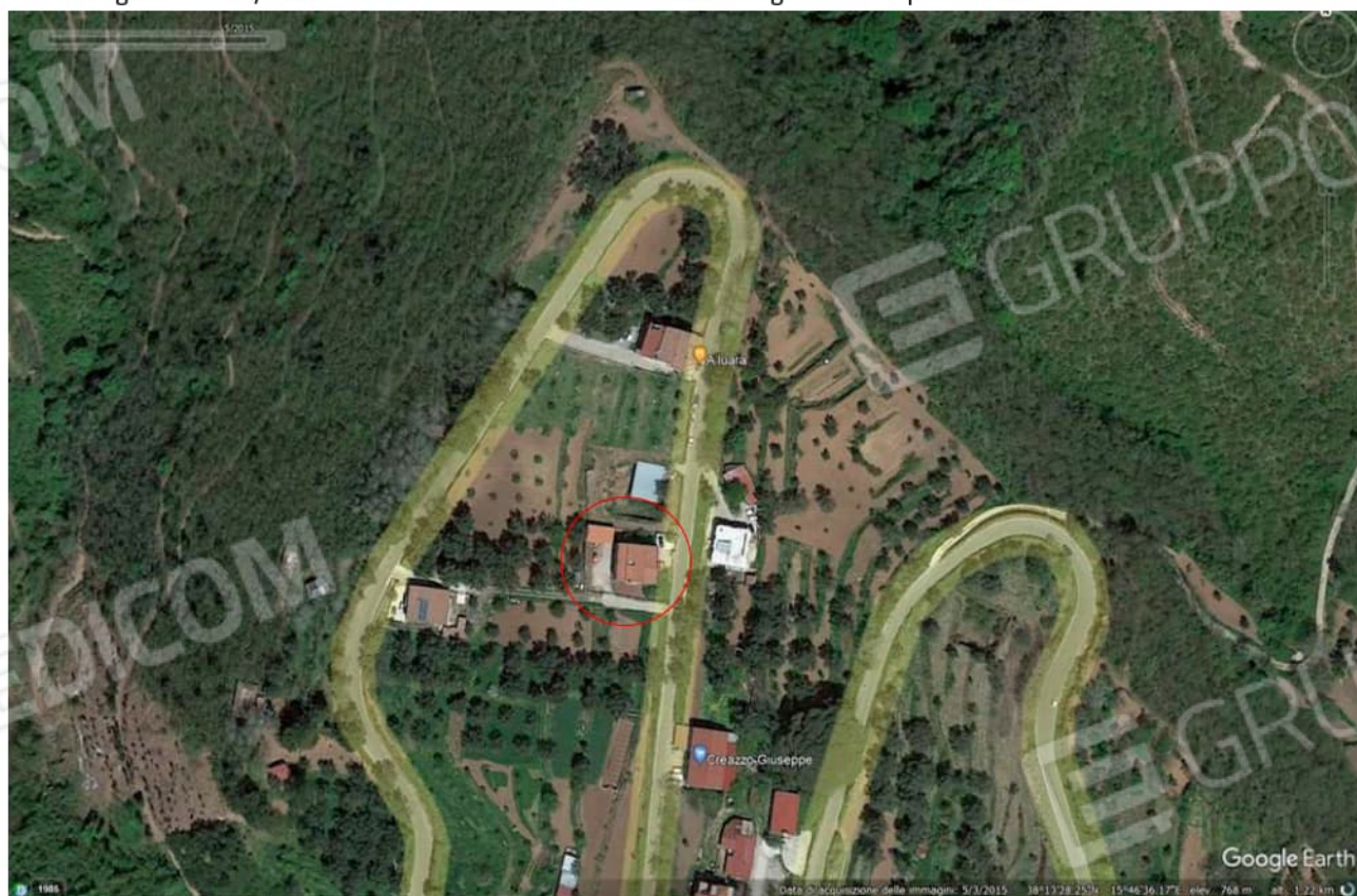
Foto Google Heart 05/2015 – Si evince la costruzione della legnaia e box per animali