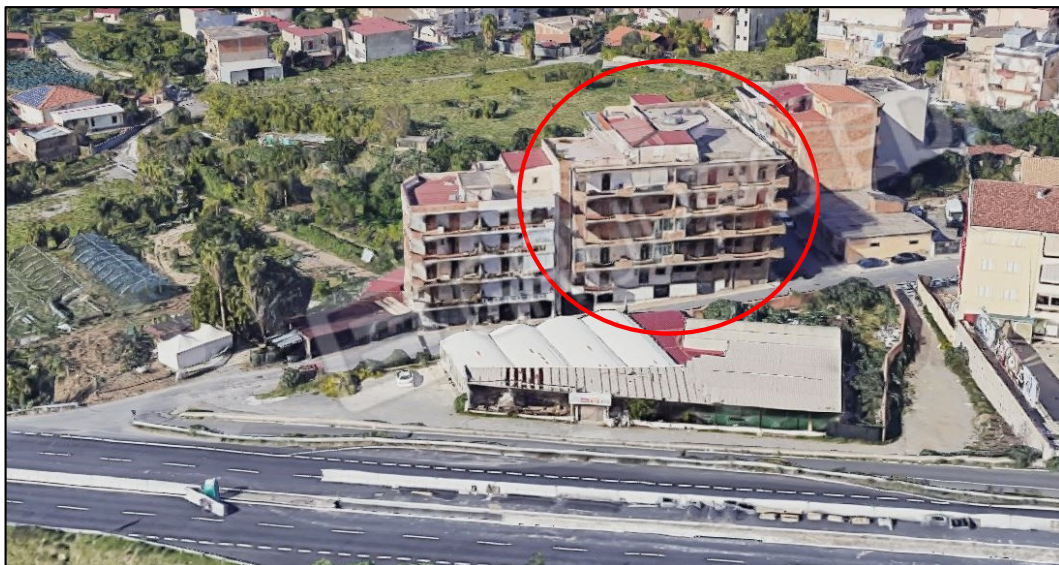
Foto n° 3 Vista aerea del fabbricato di cui fa parte l'immobile pignorato