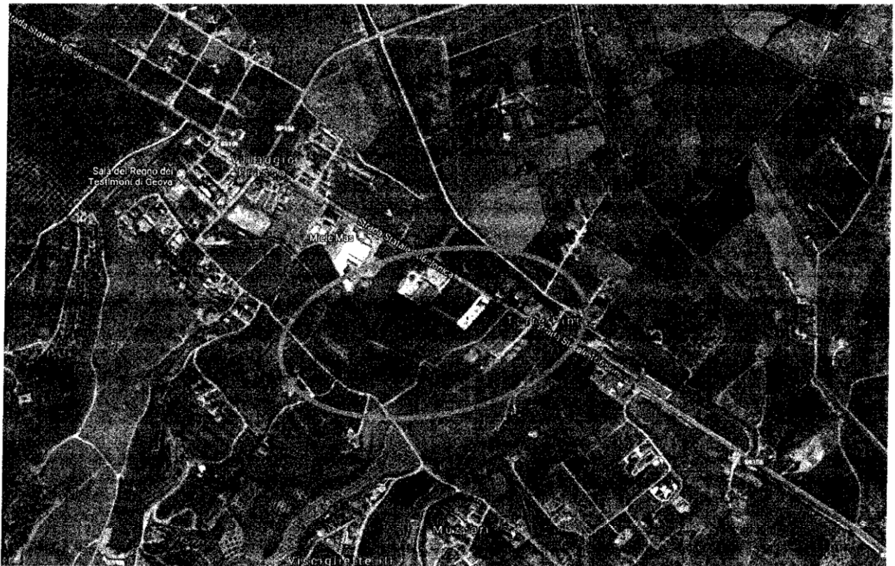
Foto aerea: inquadramento territoriale immobili ubicati in c.da Torre Bruciata:

Precisamente i suddetti beni sono ubicati in parte a valle della strada SS 106, ove procedendo verso Nord-Ovest, si possono individuare il complesso dei fabbricati riportati al foglio 73 particella 80, consistenti in capannoni, uffici, magazzini depositi, magazzini commerciali e aree di corte, segue poi il fabbricato per civili abitazioni e magazzini individuato al foglio 73 particella 1568 (ex fabbricato rurale particella 200), e infine la porzione di terreno individuato al foglio 73 particella 79. Nella sua interezza tale complesso di immobili confina a Nord-Est con il Torrente Leccalardo, a Nord-Ovest con altre proprietà, a Sud-Ovest con la strada SS 106 dalla quale avviene l'ingresso principale alle particelle 80 e 1568, e a Sud-Est con strada traversa alla SS 106 sulla quale è posto un altro accesso alla particella 80. A monte della SS 106 sono invece ubicate le porzioni di terreno individuate rispettivamente al foglio 83, particelle 50, 115 e 142, tutte e tre confinanti tra loro. In particolare la particella 115 risulta direttamente accessibile dalla SS 106 mentre tutto e tre le porzioni di terreno sono accessibili da strada Villaggio Frassa, parallela alla SS 106, con la quale confina a Sud, mentre sui restanti lati confinano con altre proprietà, come rilevato nella foto aerea allegata.