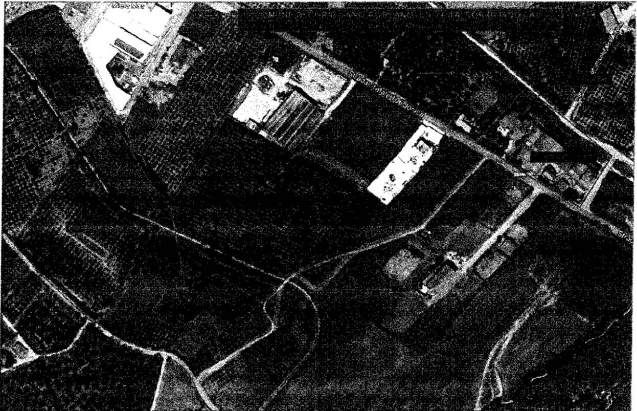
Foto aerea: individuazione immobili pignorati ubicati in e.da Torre Bruciata:

Come osservabile nel seguente elaborato planimetrico allegato, la particella 80 del foglio 73 è costituita da diversi corpi di fabbrica, capannoni, abitazioni, uffici, magazzini depositi, aree di corte e camminamenti, disposti tutti in maniera ravvicinata tra di loro. In particolare si identifica un aggregato di fabbricati minori, di remota costruzione e allo stato attuale in condizioni fatiscenti e collabenti, non utilizzabili a causa di dissesti statici avanzati, individuati dai subalterni 3-4-5-6-7-8, posti sul confine Sud-Ovest e confinante con la SS 106. In continuità a questi segue poi il subalterno 2. Sul lato opposto a Nord-Est a confine con il Torrente Leccalardo sono invece ubicati rispettivamente i subalterni 9-10-11-12 che costituiscono un aggregato di fabbricati di maggiore consistenza tutti collegati tra loro, mentre il subalterno 1 costituisce il cortile comune a tutti gli altri subalterni.