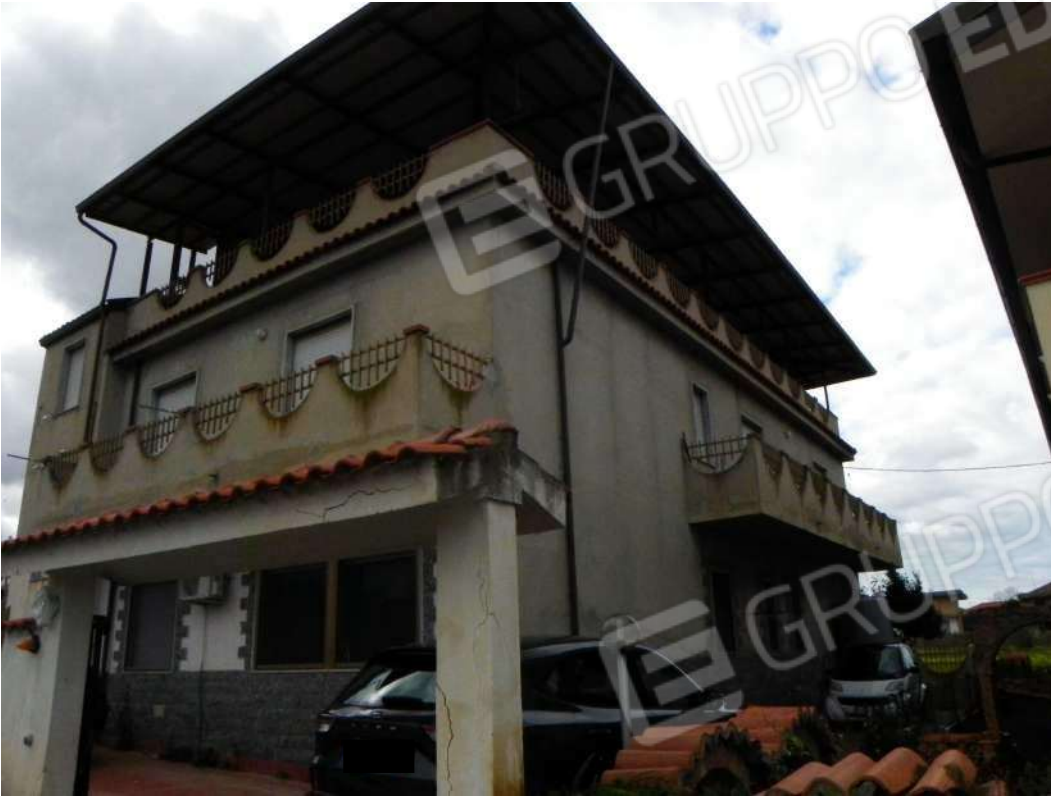
Foto 1 – Unità Immobiliare primo piano lato strada privata (sub 3)