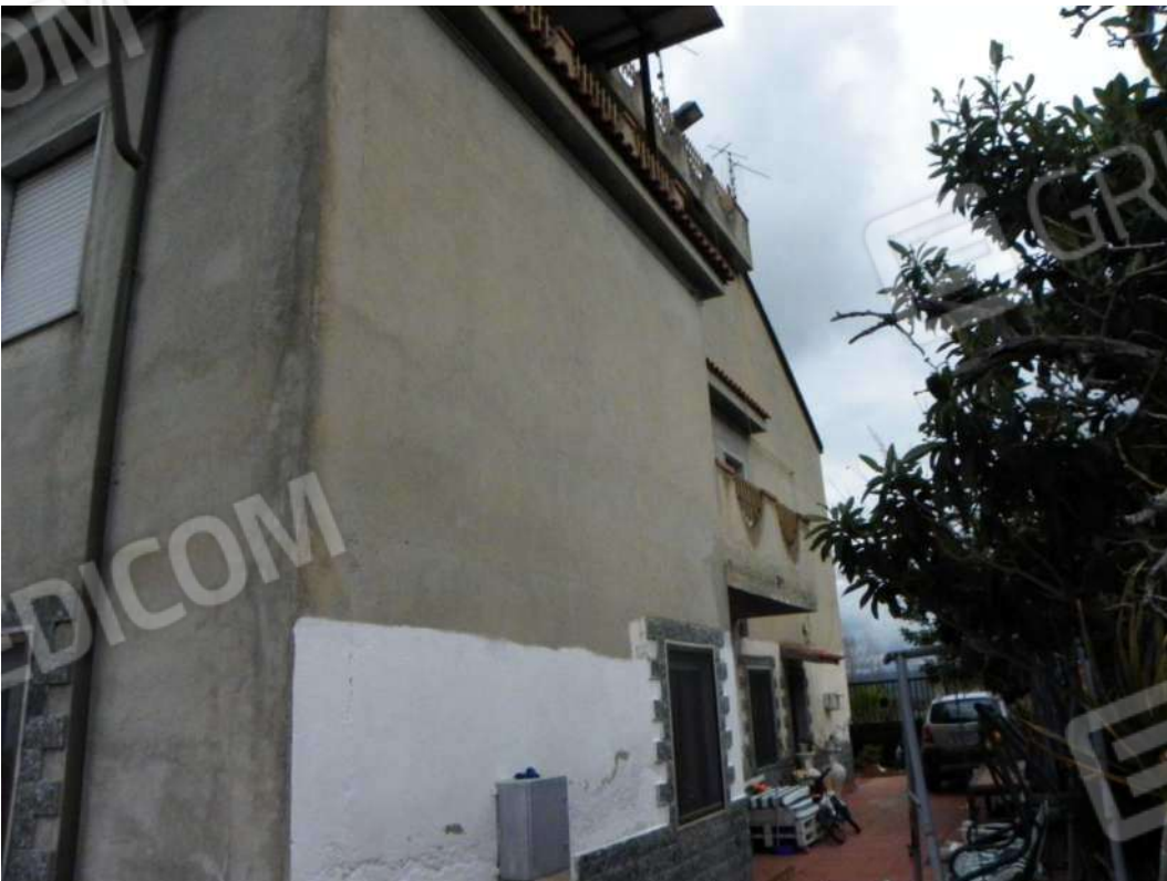
Foto 2 – ingresso fabbricato con individuazione U.I. (piano terra)