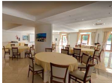
Sala cerimonie - ristorante