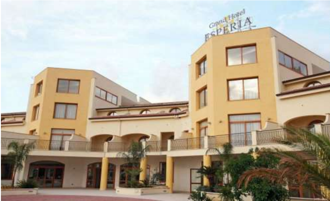
Vista frontale del complesso turistico.

Gli ambienti interni sono così dislocati: