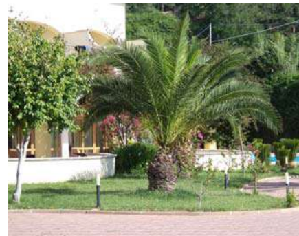
Parcheggio e giardino

La pavimentazione dei numerosi ambienti interni è prevalentemente in gres porcellanato levigato con inserti dello stesso tipo, i bagni pavimentati e rivestiti con piastrelle di ceramiche monocottura, le porte sono in legno, le uscite di sicurezza sono garantite da infissi di sicurezza con maniglione