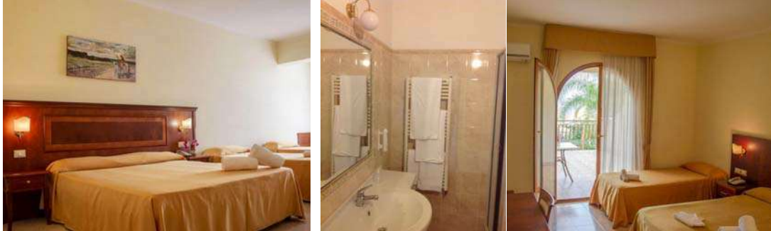
Camere con bagno privato

n. 32 camere con bagno privato e solarium, di tipo doppie-matrimoniali, triple e quadruple. Ogni camera è dotata di impianto telefonico, impianto tv satellitare e collegamento ad Internet wi-fi.