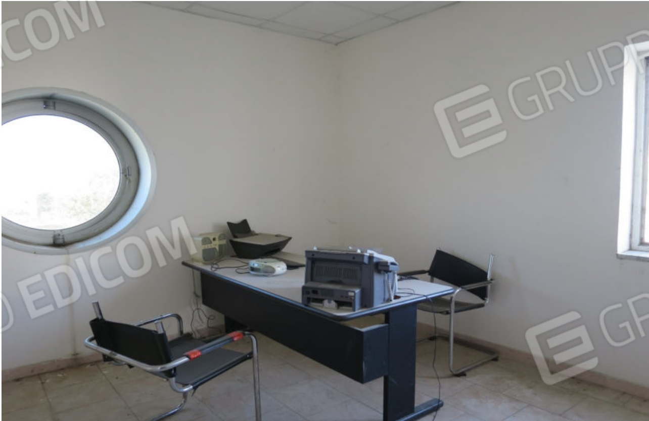
FOTO N. 10 VISTA DEL LOCALE UFFICIO N.2 AL PIANO PRIMO