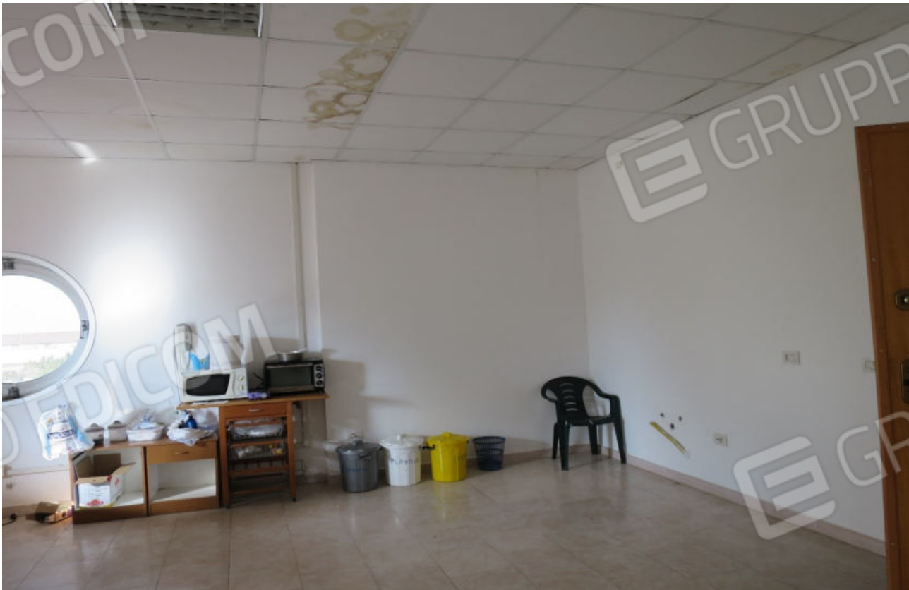
FOTO N. 15 ALTRA VISTA DEL LOCALE UFFICIO N.3 DALL'INGRESSO PRINCIPALE