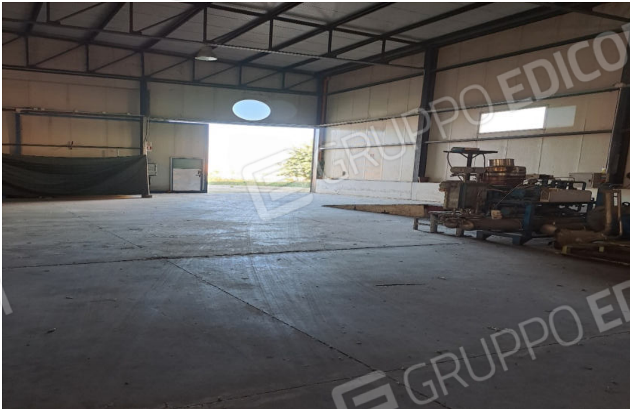
FOTO N.3 VISTA DELL'INGRESSO PRINCIPALE DEL CAPANNONE RIPRESO DALLA PARTE CENTRALE