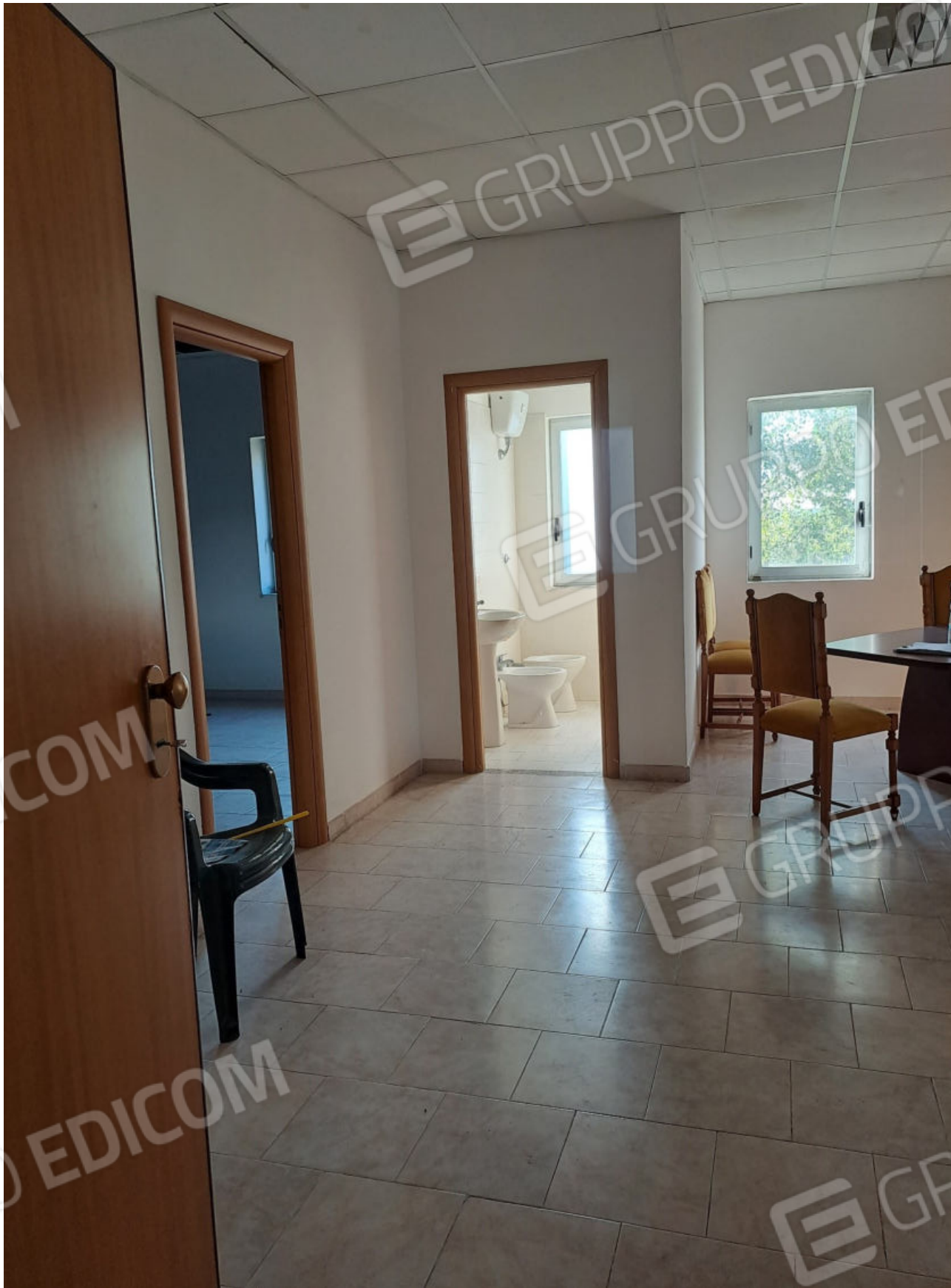
FOTO N. 16 ALTRA VISTA DEL LOCALE UFFICIO N.3 DALL'INGRESSO PRINCIPALE