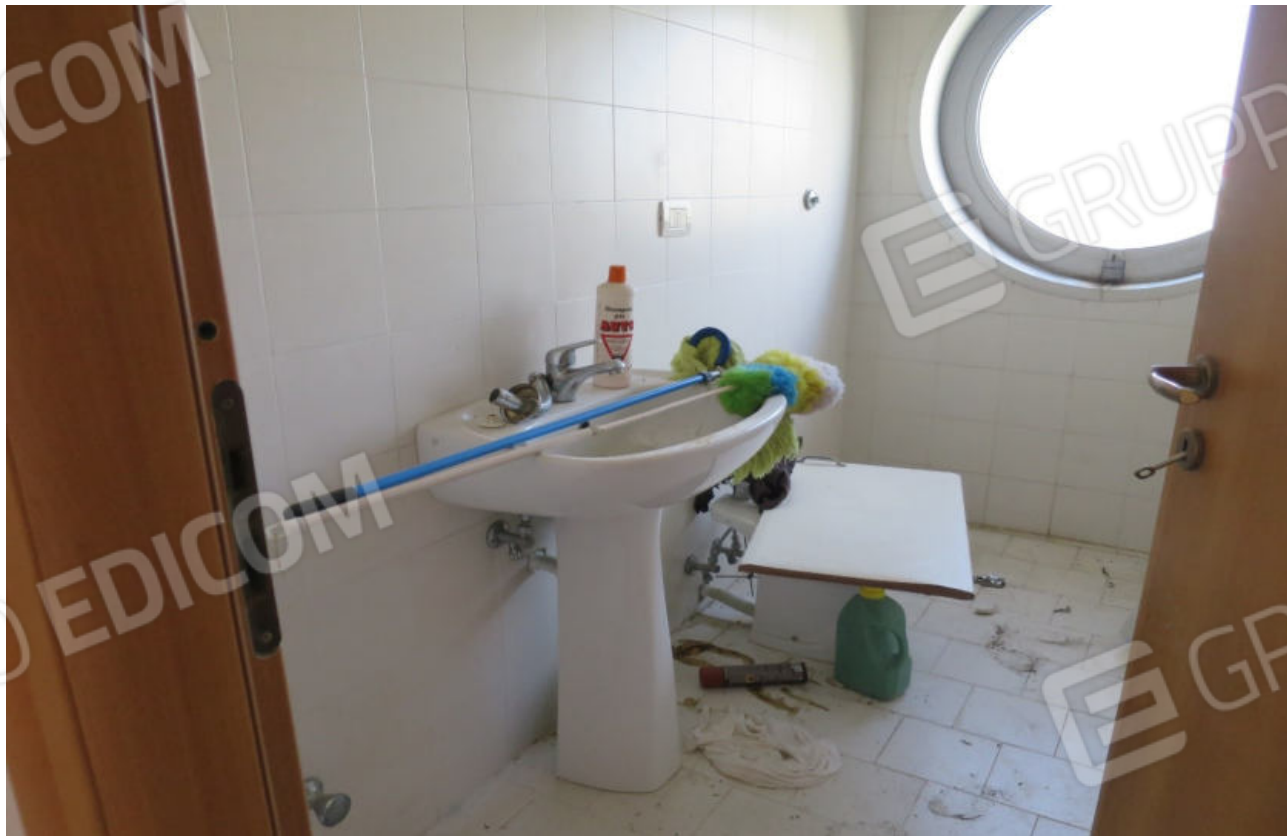
FOTO N. 13 VISTA DEL LOCALE BAGNO AL PIANO PRIMO UBICATO FRONTALMENTE AL VANO SCALE