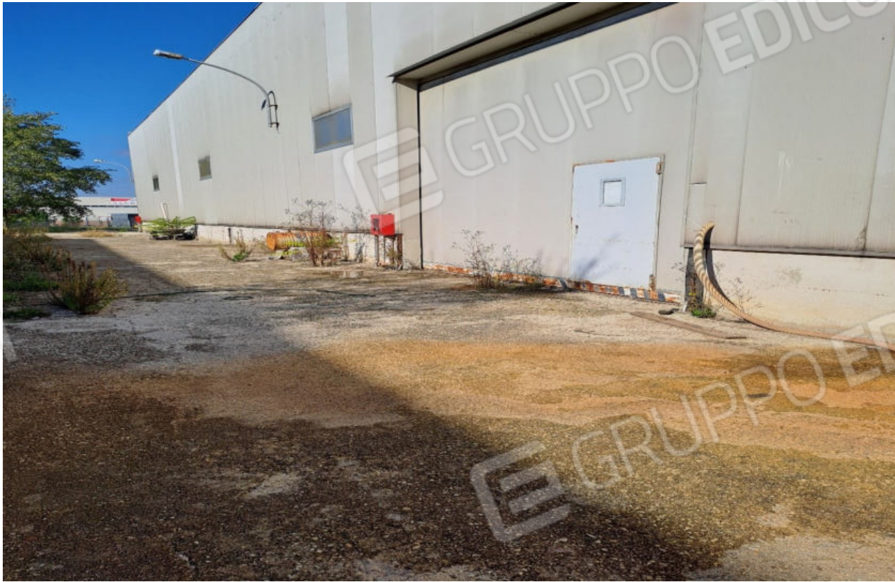
FOTO N.11 VISTA ESTERNA DELLA FACCIATA OSPITANTE L'INGRESSO CARRAB. LATERALE DEL CAPANNONE