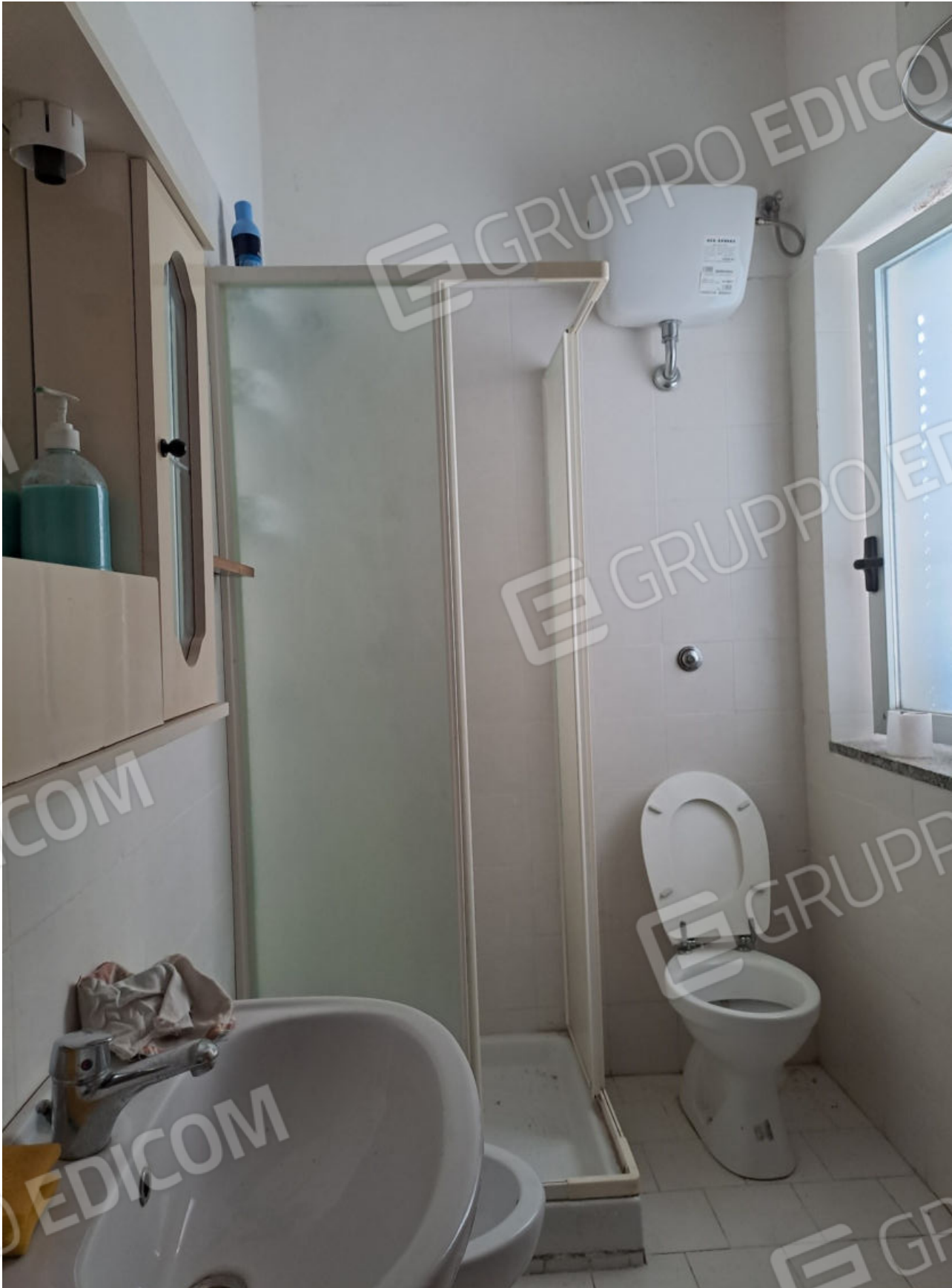
FOTO N. 7 VISTA DEL LOCALE BAGNO ATTIGUO AL VANO GUARDIOLA