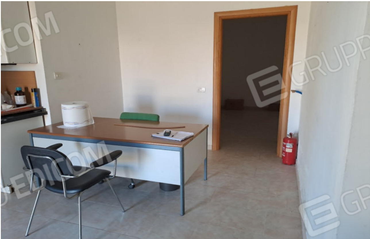
FOTO N. 4 ALTRA VISTA DEL LOCALE GUARDIOLA RIPRESO NEI PRESSI DELL'INGRESSO DALL'ESTERNO