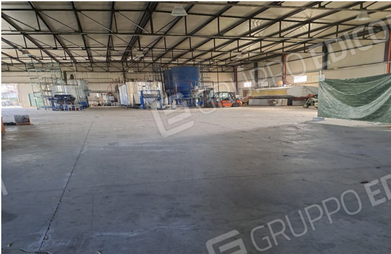
FOTO N.1 VISTA DELLA PARTE CENTRALE DEL CAPANNONE DALL'INGRESSO PRINCIPALE