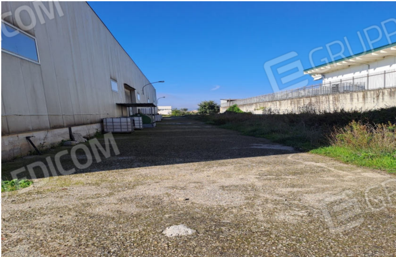
FOTO N.12 VISTA ESTERNA DELLA FACCIATA OSPITANTE ALTRO INGRESSO CARRAB. LATERALE DEL CAPANNONE