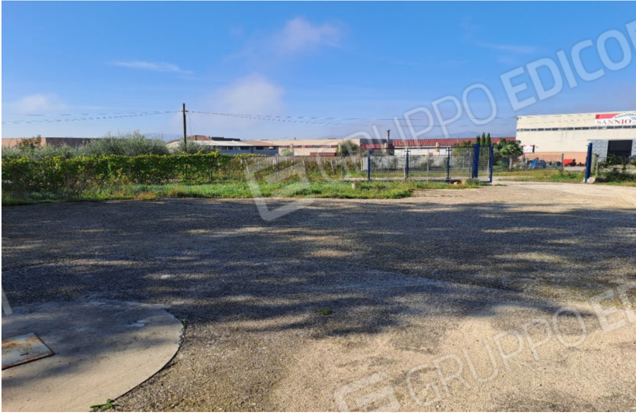
FOTO N.7 VISTA DELLA PIAZZOLA ANTISTANTE OSPITANTE L'INGRESSO CARRABILE PRINCIPALE DEL LOTTO