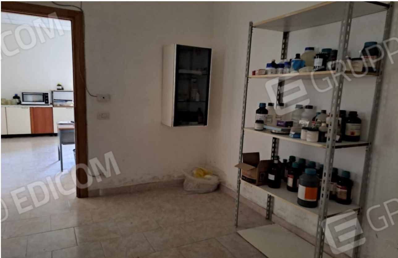
FOTO N. 6 VISTA DEL LOCALE MENSA