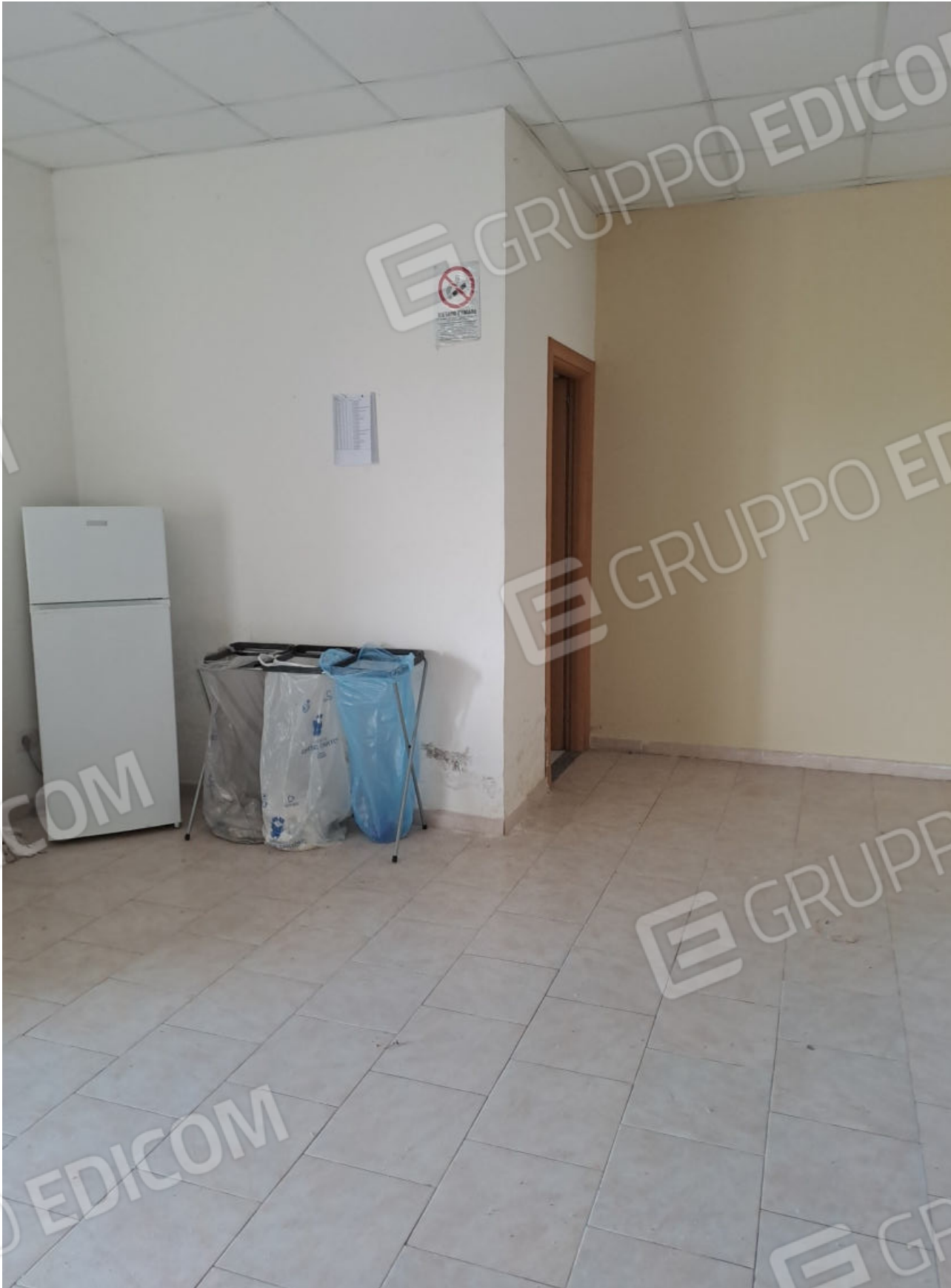
FOTO N. 2 ALTRA VISTA DEL LOCALE UFFICIO RIPRESO DAI PRESSI DALL'INGRESSO PRINCIPALE