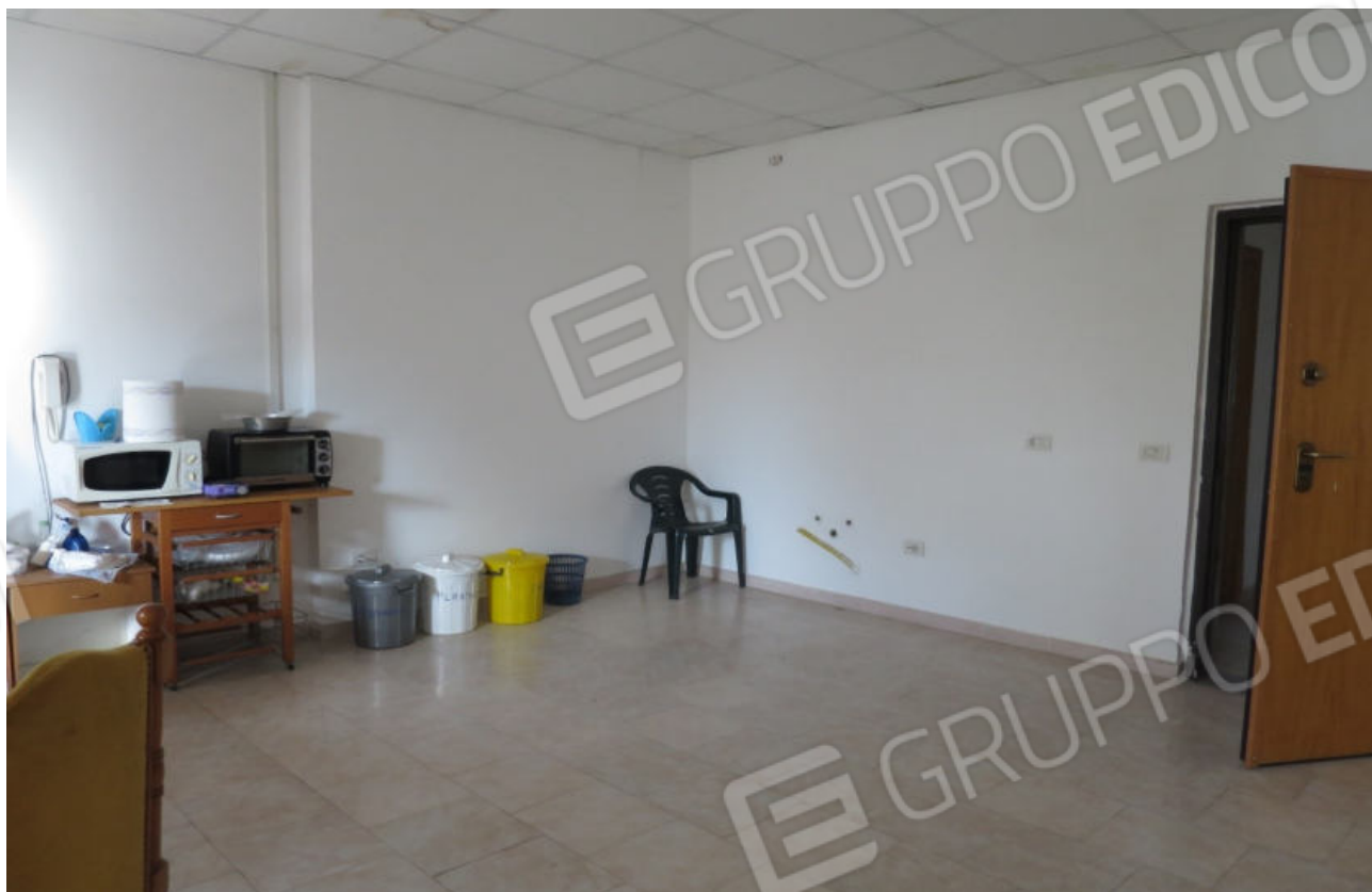
FOTO N. 12 ALTRA VISTA DEL LOCALE UFFICIO N.3 AL PIANO PRIMO