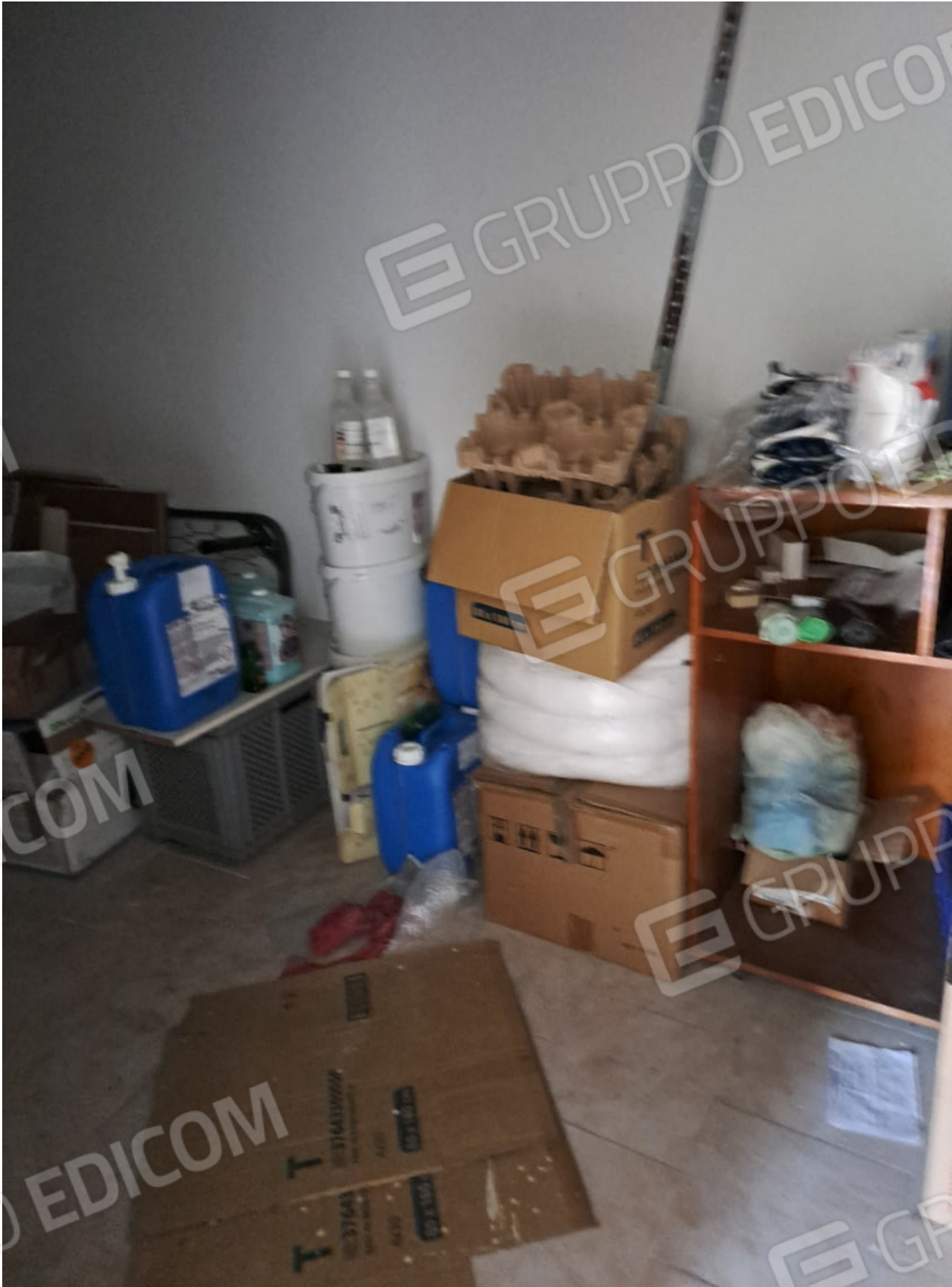
FOTO N. 8 ALTRA VISTA DEL LOCALE INFERMERIA