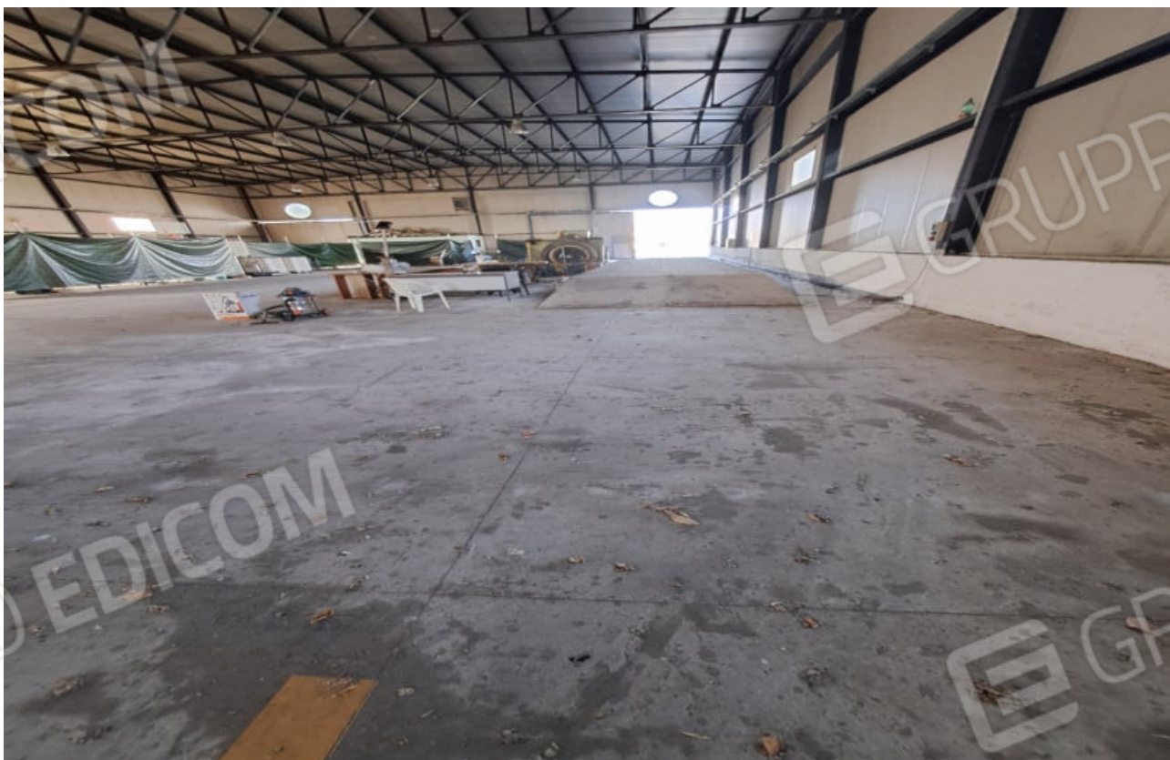
FOTO N.6 ALTRA VISTA DELLA PARETE OSPITANTE L'INGRESSO CARRABILE PRINCIPALE DEL CAPANNONE