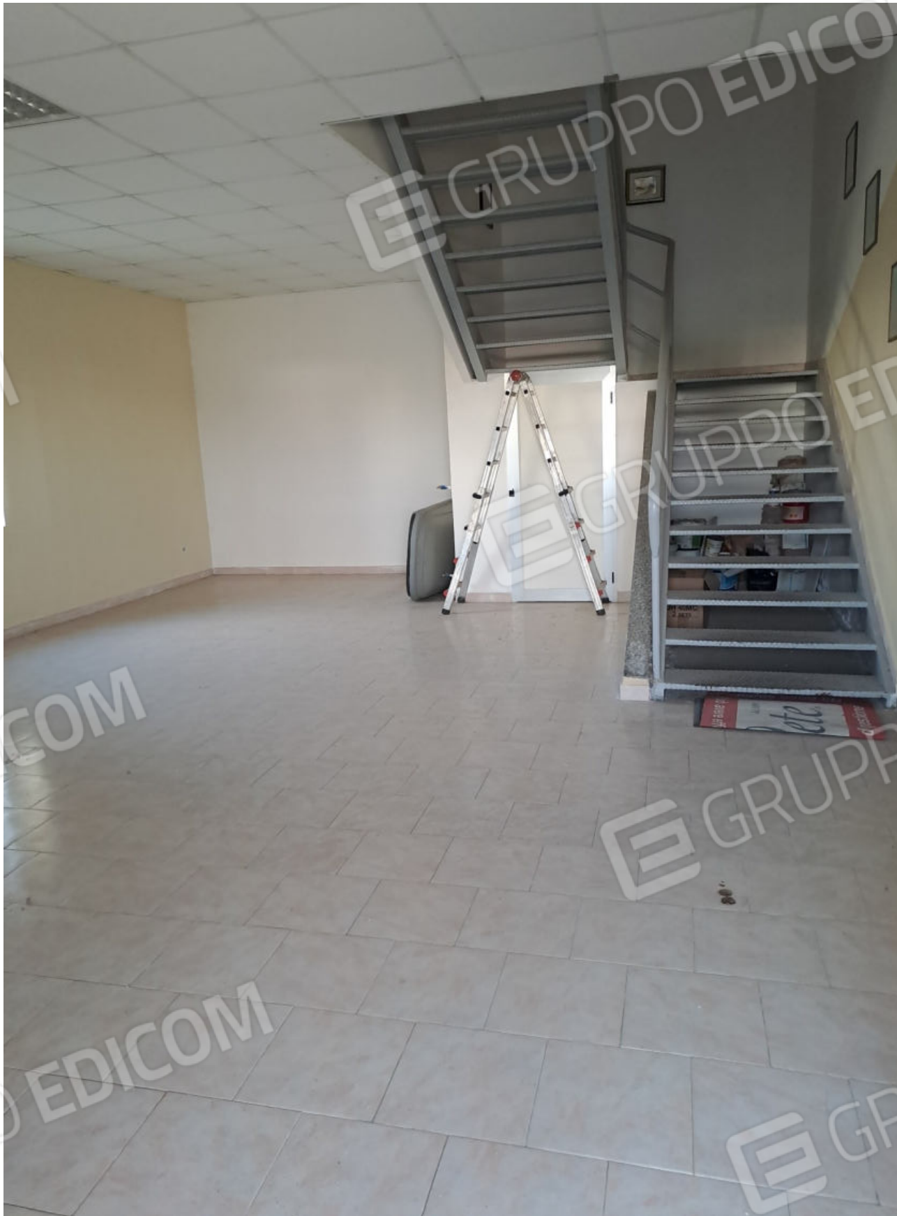
FOTO N.1 VISTA DEL LOCALE UFFICIO E DELLA SCALA DI ACCESSO AL PIANO PRIMO DALL'INGRESSO PRINCIPALE