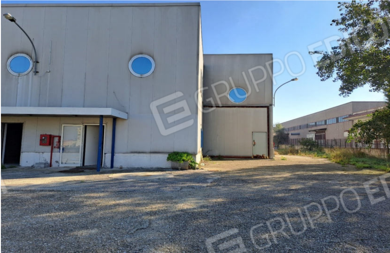
FOTO N.9 VISTA DELLA FACCIATA DEL CAPANNONE OSPIT. GLI INGRESSI AI VANI UFFICIO E CARRABILE