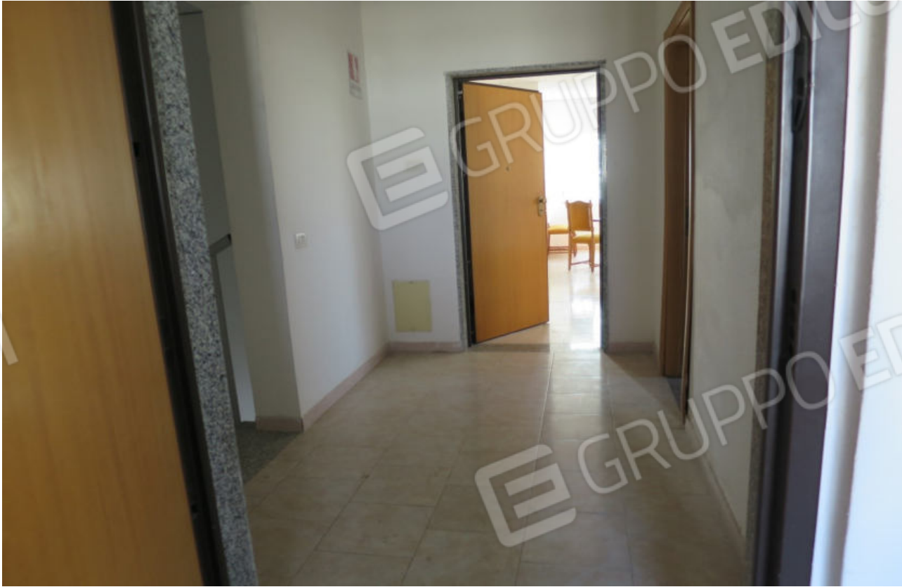
FOTO N. 9 VISTA DEL DISIMPEGNO AL PIANO PRIMO