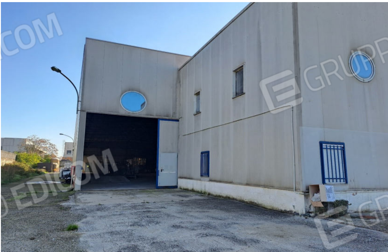
FOTO N.10 VISTA LAT.DELL'ALTRA FACCIATA DELL'AREA OSPIT. I VANI UFFICIO E L'ACCESSO CARRABILE IN USO