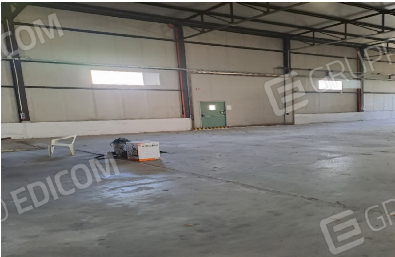
FOTO N.4 VISTA DELL'UNICO INGRESSO LATERALE DEL CAPANNONE RIPRESO DALLA PARTE CENTRALE