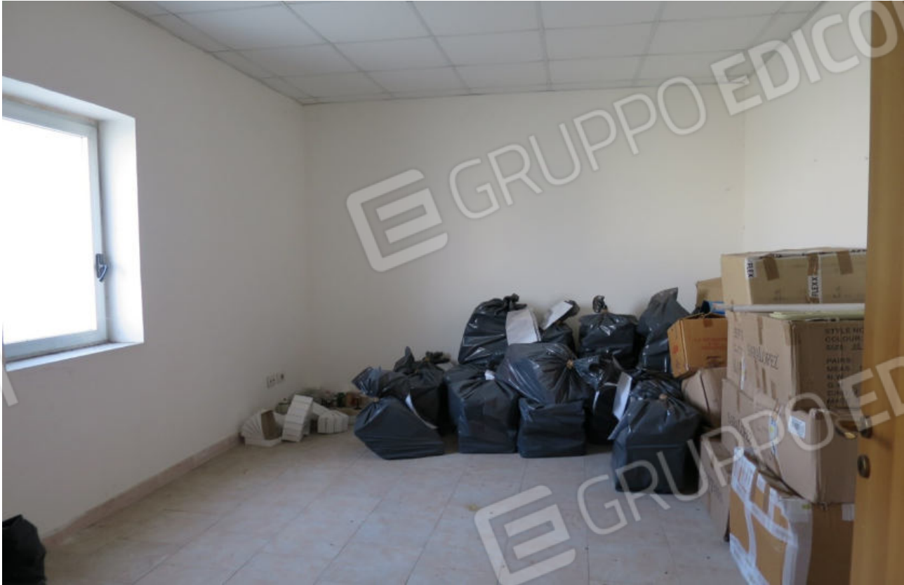
FOTO N. 11 VISTA DEL LOCALE UFFICIO N.1 AL PIANO PRIMO