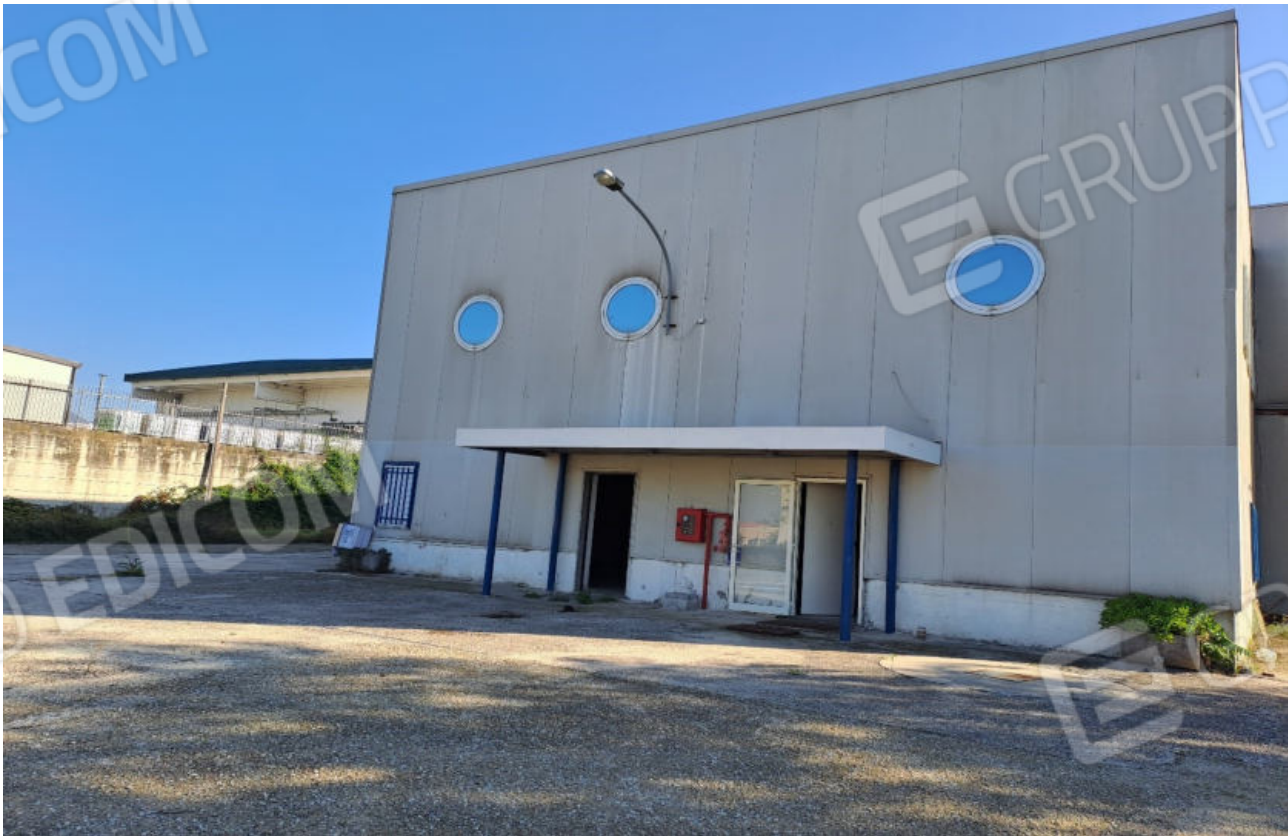
FOTO N.8 VISTA DELLA FACCIATA PRINCIPALE DEL CAPANNONE OSPITANTE GLI INGRESSI AI VANI UFFICIO