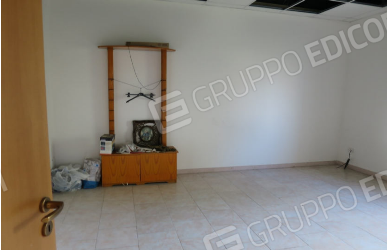
FOTO N. 14 VISTA DEL LOCALE UFFICIO N.4 AL PIANO PRIMO