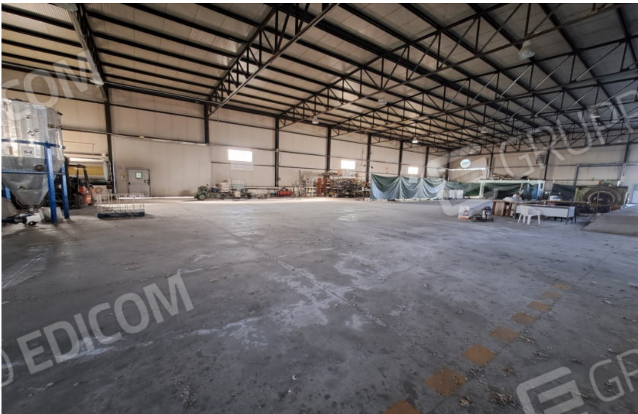
FOTO N.2 ALTRA VISTA DELLA PARTE CENTRALE DEL CAPANNONE DALL'INGRESSO LATO POSTERIORE