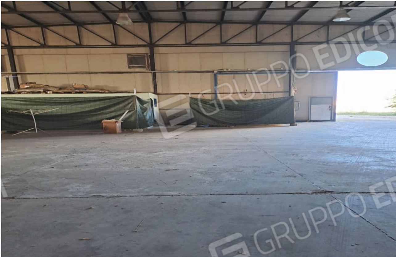
FOTO N.5 VISTA DELLA PARETE OSPITANTE L'INGRESSO CARRABILE PRINCIPALE DEL CAPANNONE