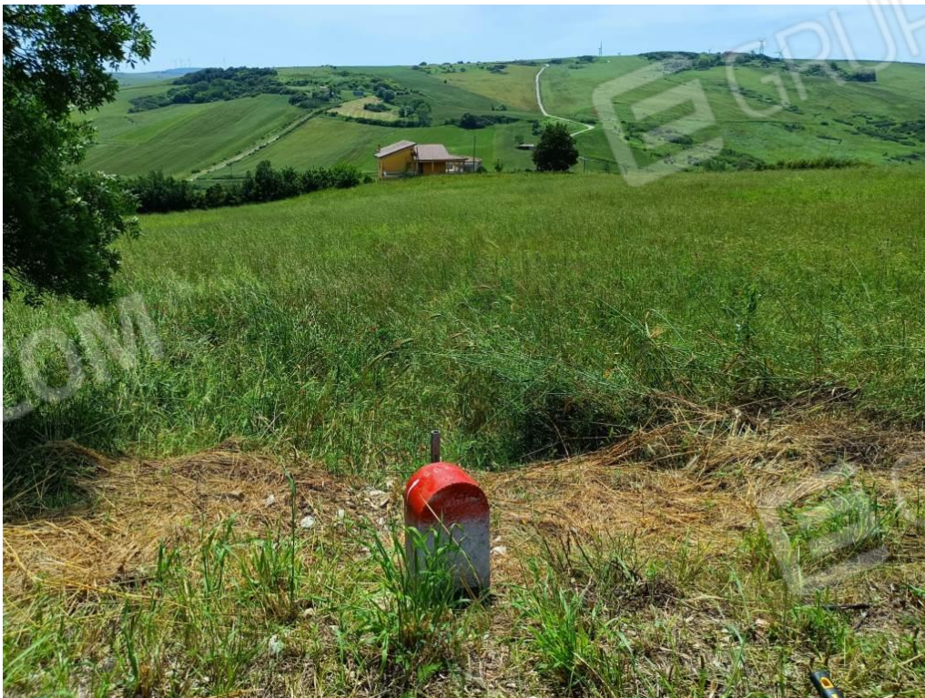
Foto 12 – Primo Termine Lapideo posto in prossimità del Confine Ovest della ex particella 236 visto da Ovest