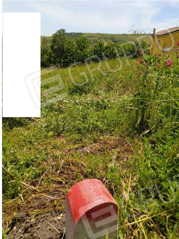
Foto 13 – Secondo Termine Lapideo apposto in prossimità del confine Est della particella 236 visto da Ovest