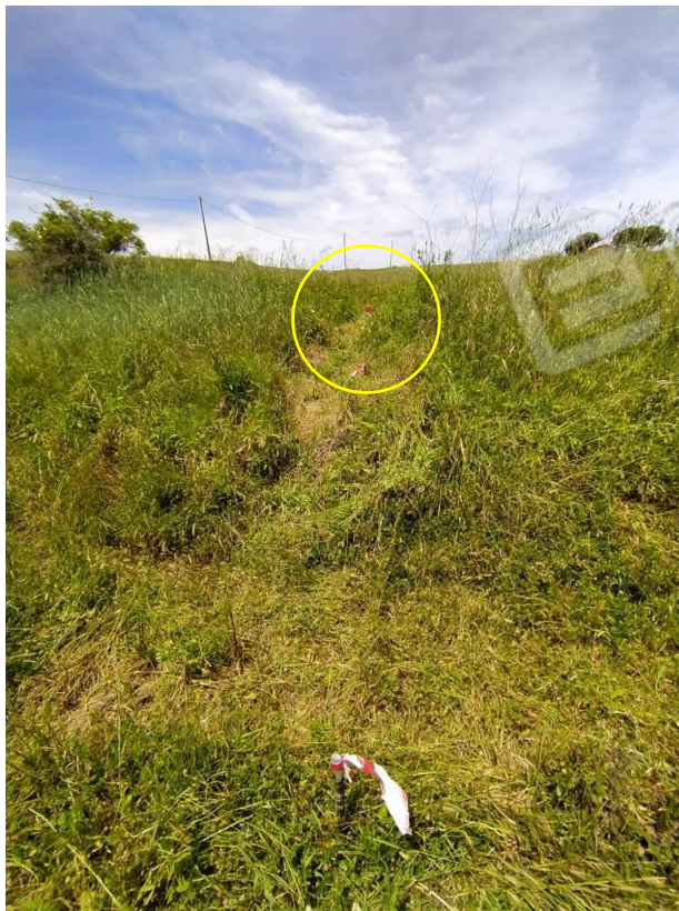
Foto 10 – Picchetto in Ferro in prossimità del confine Est della ex particella 24 visto da Est da dove si nota il quinto termine