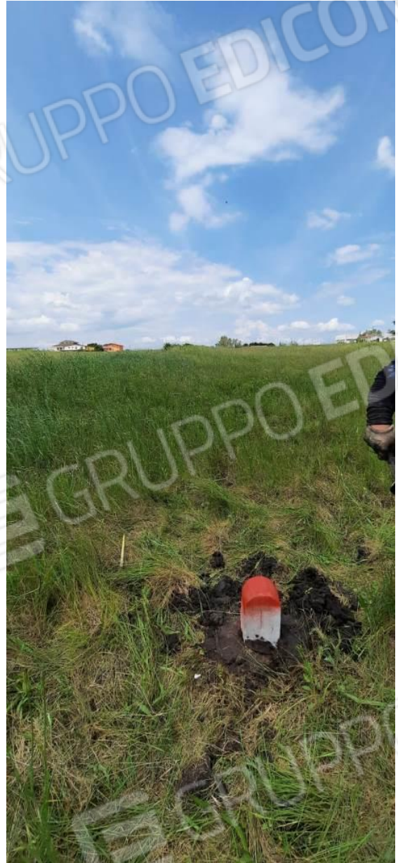
Foto 3 / 4 – Secondo Termine Lapideo apposto sulla ex particella 24 a circa 200 mt dal primo, visto da rispettivamente da Sud/Est e da Nord