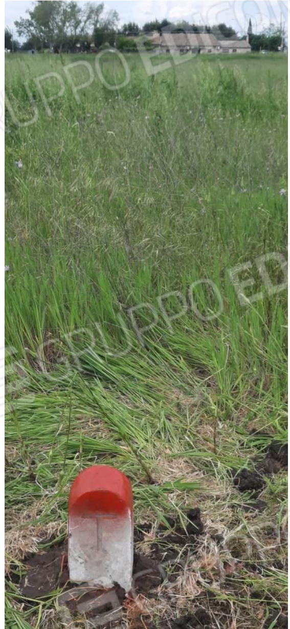
Foto 1 / 2 – Primo Termine Lapideo apposto sulla ex particella 24 visto da Ovest verso Est(1) Nord/EST(2) in prossimità del confine alla Strada Statale 90