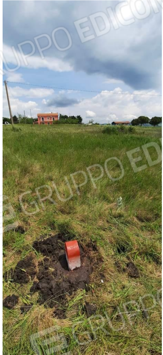
Foto 5 / 6 – Terzo Termine Lapideo apposto sulla ex particella 24 a circa 100 mt dal secondo, visto rispettivamente da Est e da Sud