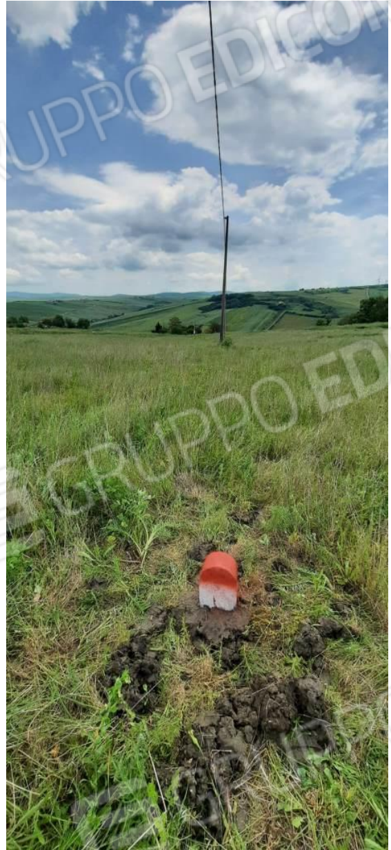
Foto 7 /8 – Quarto Termine Lapideo apposto sulla ex particella 24 a circa 100 mt dal terzo, visto rispettivamente da Sud/Est e da Ovest