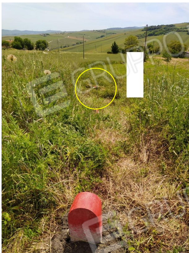
Foto 9 – Quinto Termine Lideo apposto sulla ex particella 24 in prossimità del confine Est visto da Ovest da dove si nota il picchetto in ferro posto in prossimità del confine