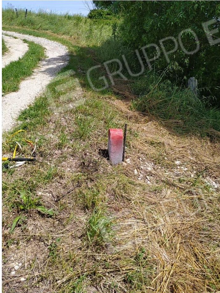
Foto 11 – Primo Termine Lapideo e picchetto in ferro posti in prossimità del Confine Ovest della ex particella 236 visto da Sud