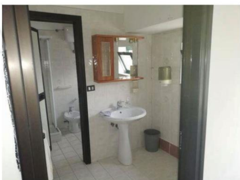
foto 37: ...Sala guardiania al 27.10.2022