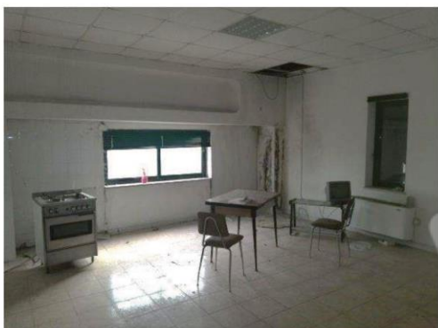
foto 35: ...Sala guardiania al 27.10.2022