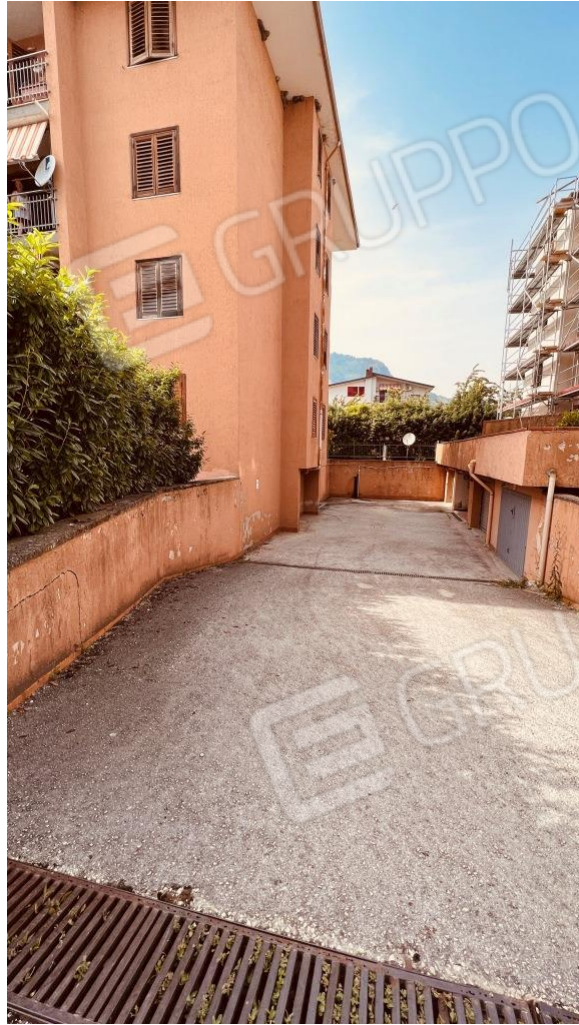
Foto 14 – Rampa di accesso al seminterrato del fabbricato di cui alla scala A del Parco Rondine