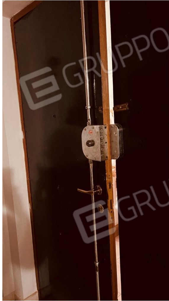
Foto 4 – Portone di accesso all'abitazione al piano terzo (4° fuori terra) del fabbricato scala B del condominio Parco Rondine