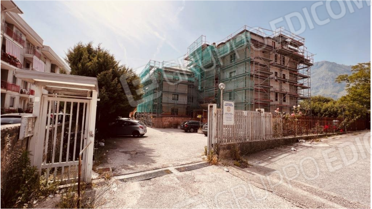
Foto 1 – Accesso dalla pubblica strada al Condominio Parco Rondine