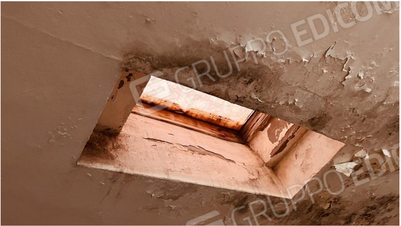
Foto 6 – Dettaglio macchie di umidità intorno al lucernaio dell'ingresso/soggiorno