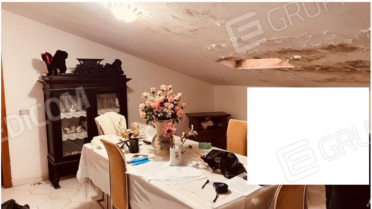
Foto 5 – Ingresso soggiorno dell'abitazione – vista lucernaio ed ampie macchie di umidità