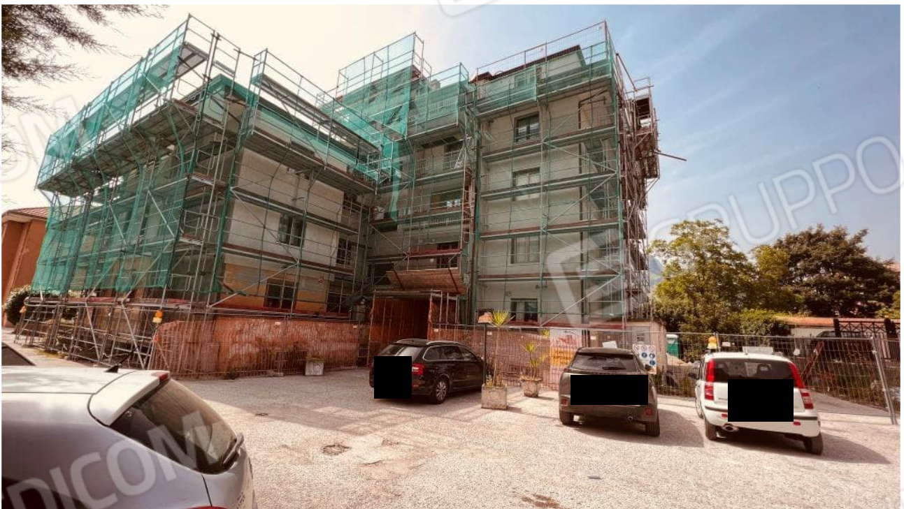
Foto 2 – Fabbricato di cui alla Scala B del condominio Parco Rondine