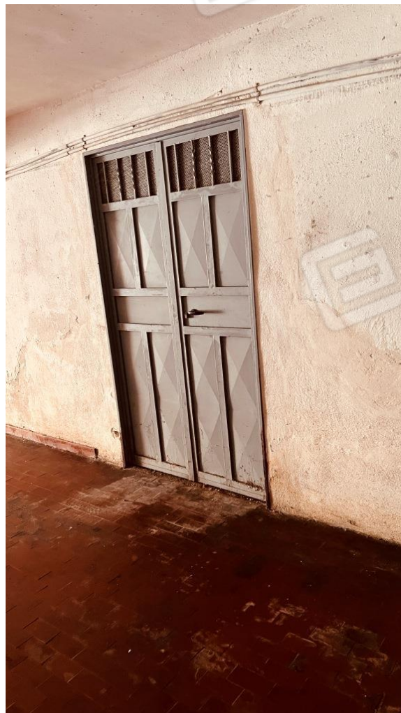
Foto 17 – Portone d'ingresso al Deposito nel seminterrato del fabbricato di cui alla scala A del Parco Rondine