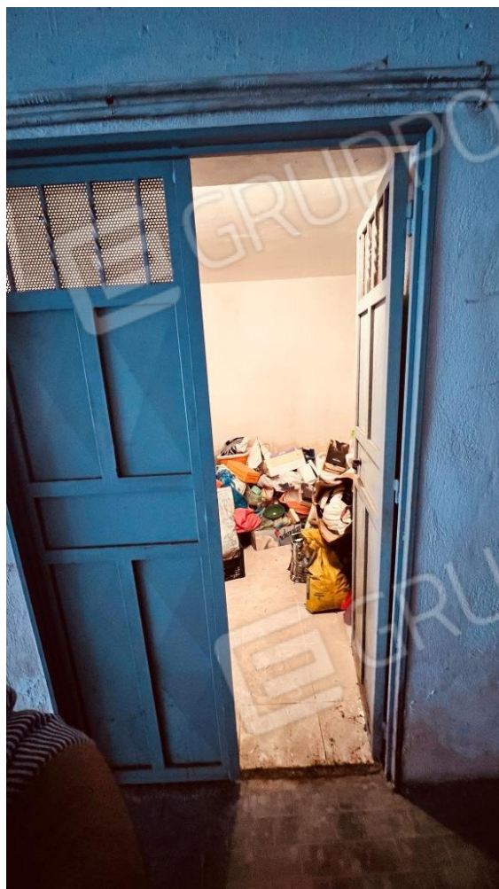
Foto 18 – Vano deposito nel seminterrato del fabbricato di cui alla scala A del Parco Rondine