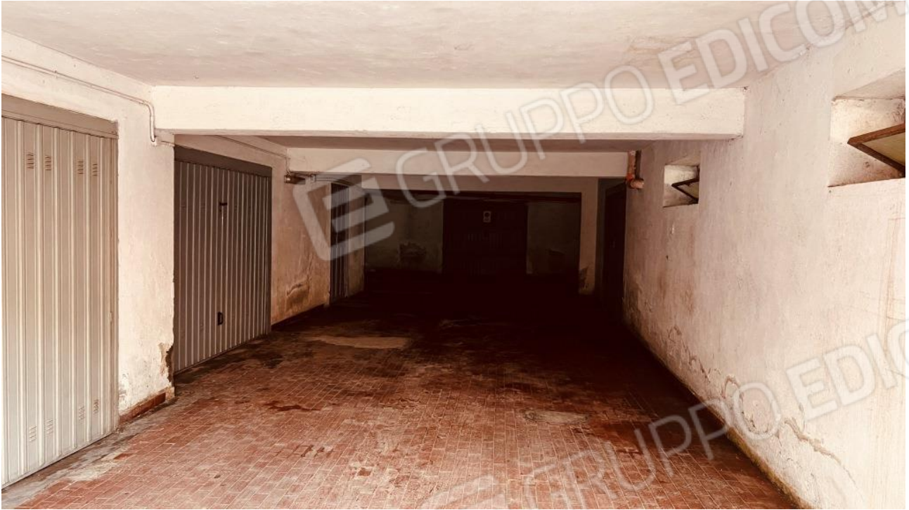
Foto 16 – Area di ingresso al seminterrato del fabbricato di cui alla scala A del Parco Rondine