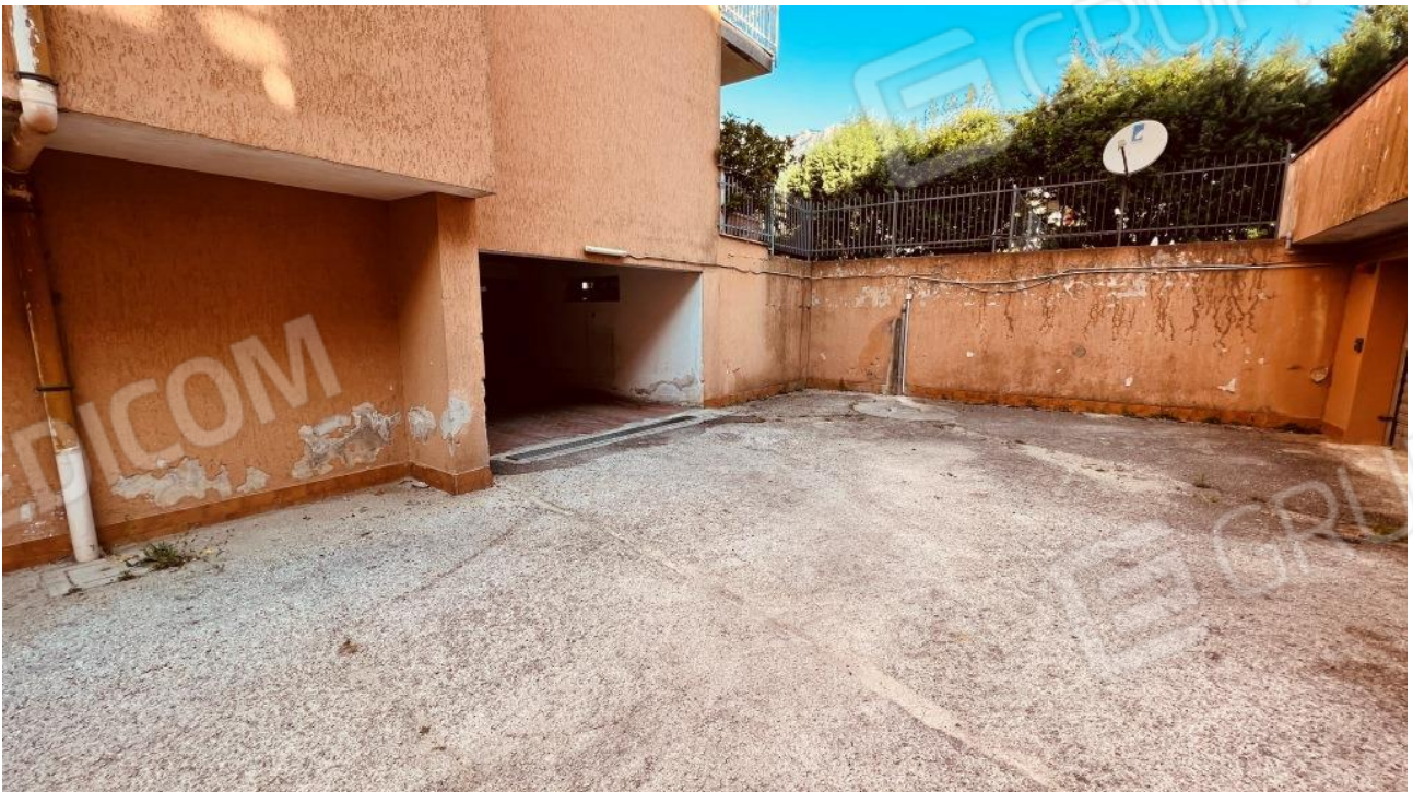
Foto 15 - Accesso al seminterrato del fabbricato di cui alla scala A del Parco Rondine