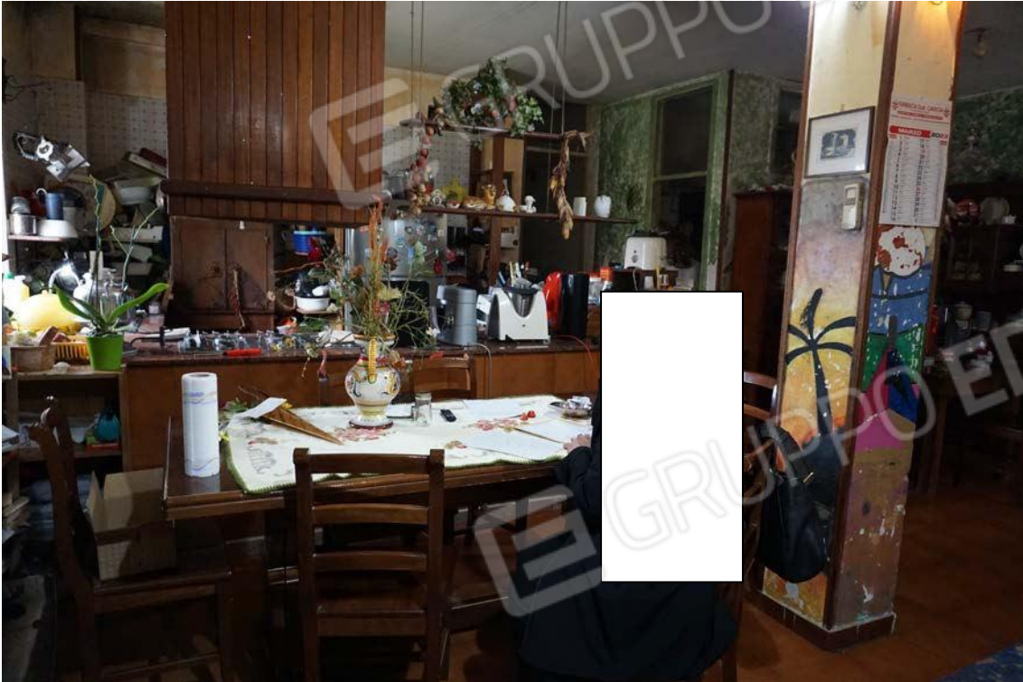
Fig.41 – Vista su vano cucina del sub.11