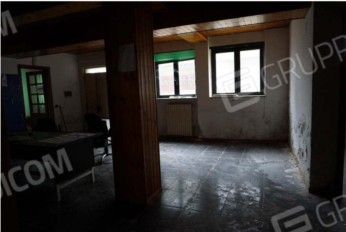
Fig.30 – Vista vano uso ufficio dell'immobile sub.9 (A10)