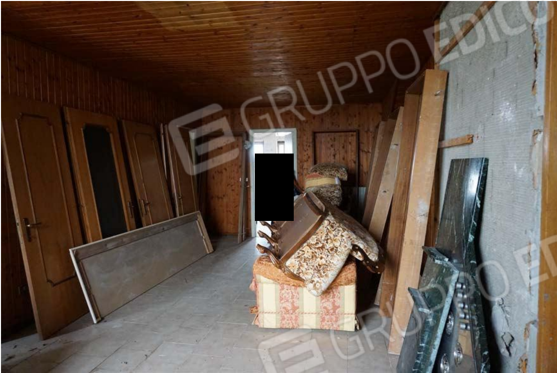
Fig.31 – Vista su vano interno dell’immobile sub.9 (A10)