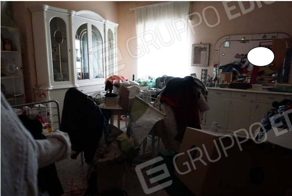
Fig.43 – Vista su vano soggiorno del sub.11