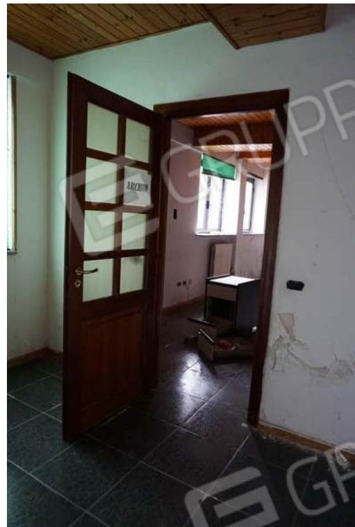
Figg.35-36 – Vista di dettaglio degli interni del sub.9 (A10)