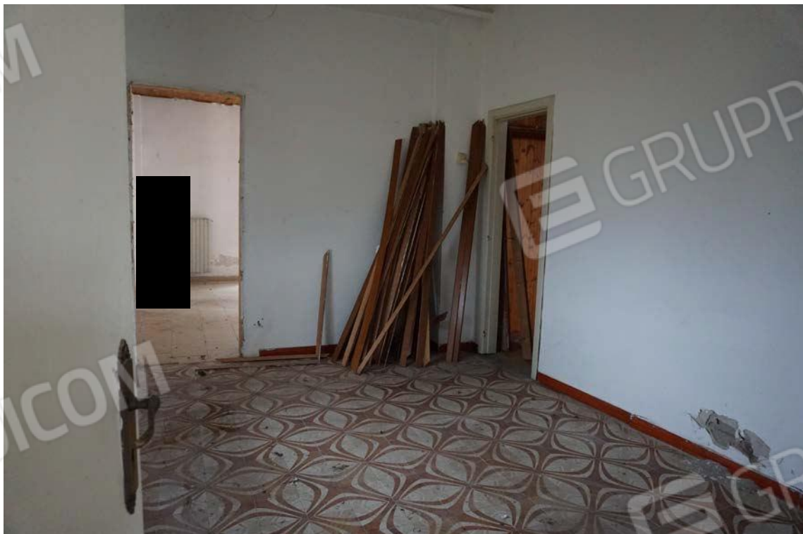
Fig.24 – Vista vano interno dell’immobile sub.9 (A10)