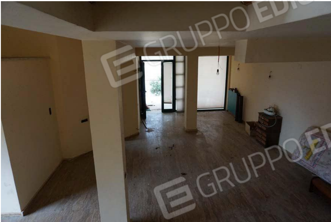
Fig.52 – Vista su vano principale