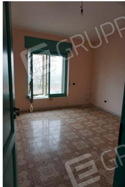
Figg.63-64 – Vista su pianerottolo e vano posto al secondo piano