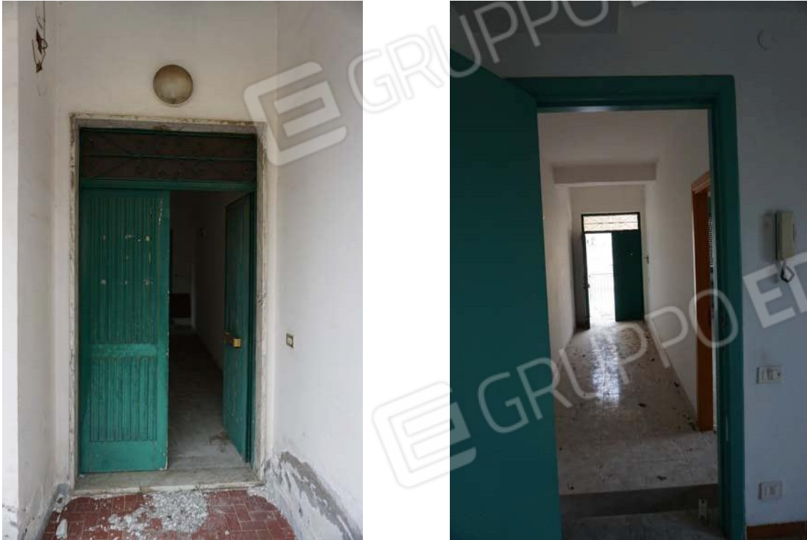
Figg.68-69 – Vista porta d’ingresso ed ingresso dell’immobile al sub.13 (A10)