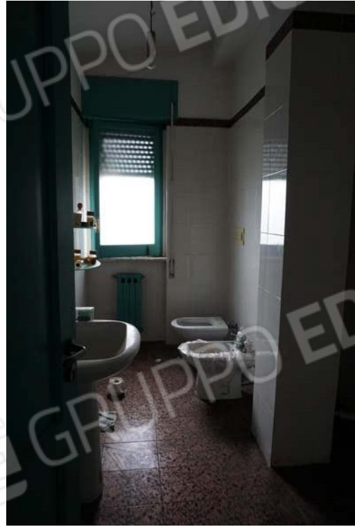
Figg.56-57 – Vista su vano cucina e bagno