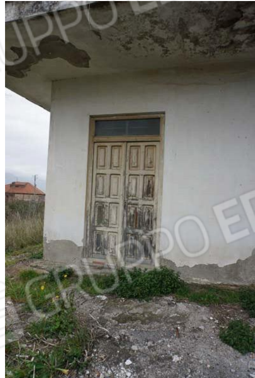
Figg.20-21 – Vista esterna dell’ingresso del sub.9 (A10)