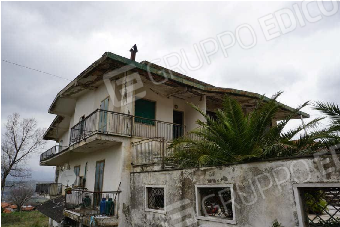
Fig.6 – Vista del fronte sud-ovest da Viale dei Pini