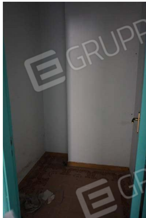
Figg.79-80 – Vista bagno e ripostiglio dell’immobile al sub.13 (A10)