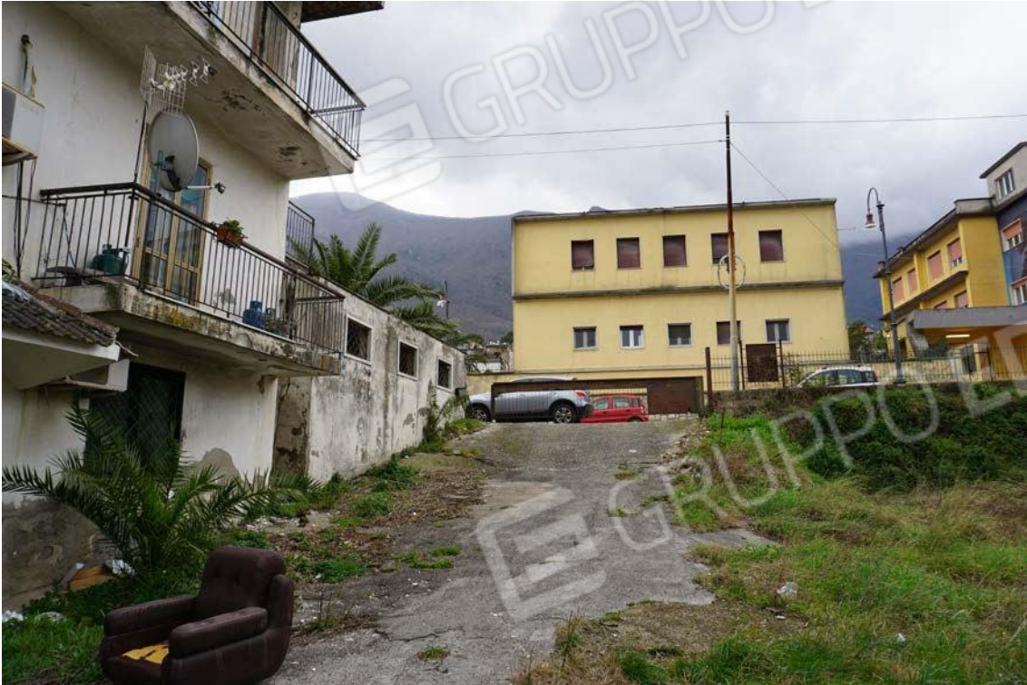
Fig.14 – Vista dell'accesso a Viale dei Pini dell'immobile al foglio 16, p.lla 642, sub.7 (A10)