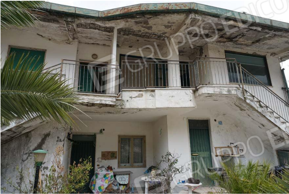
Fig.8 – Vista del fronte sud di Viale dei Pini