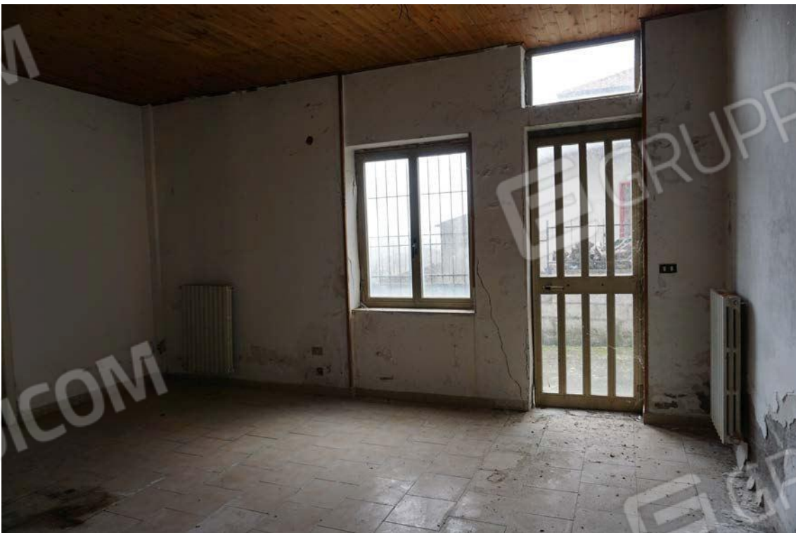
Fig.26 – Vista secondo ingresso dell’immobile sub.9 (A10)