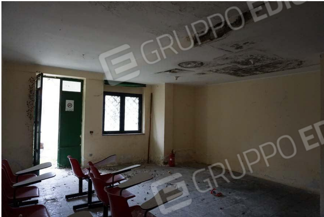
Fig.16 – Vista vano interno sub.7 (A10)