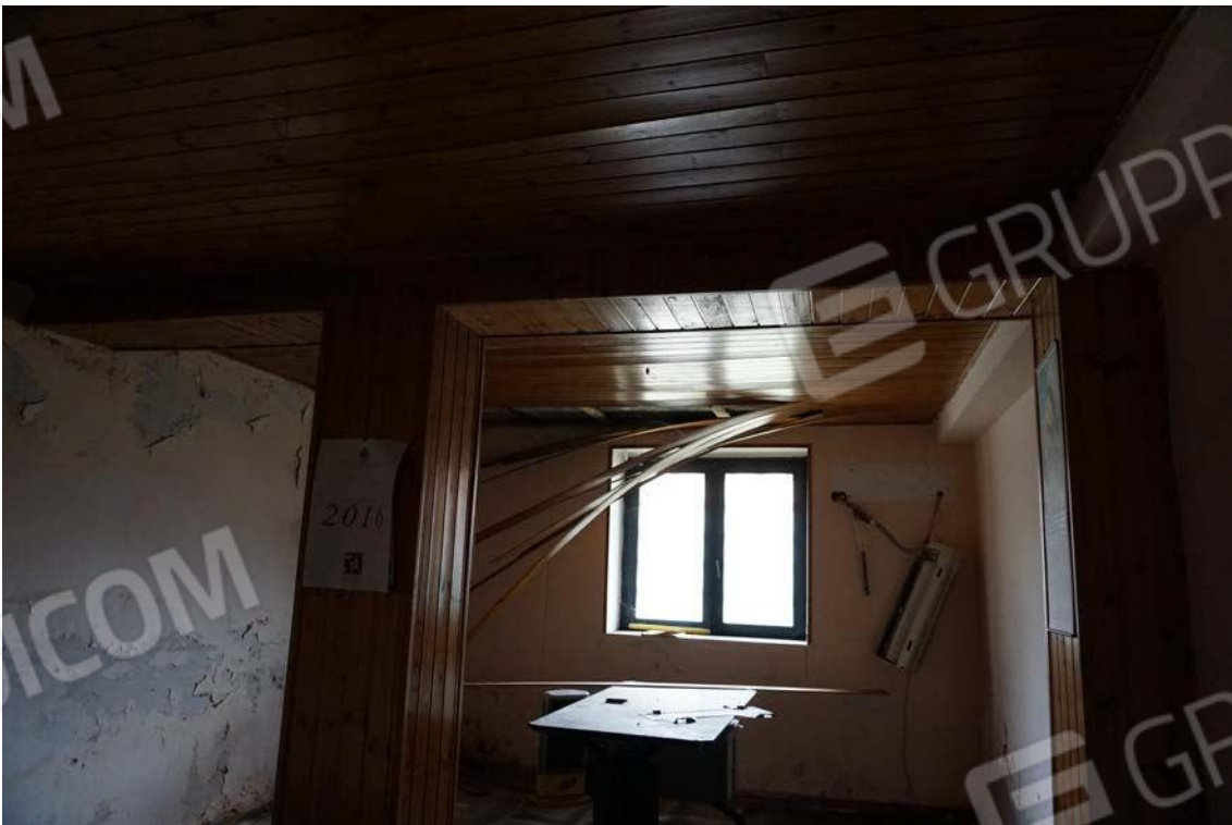
Fig.32– Vista su vano interno dell’immobile sub.9 (A10)