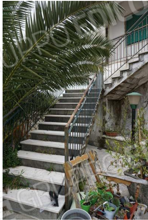
Figg.10-11 – Vista accesso corte a sud e scala di accesso al primo piano