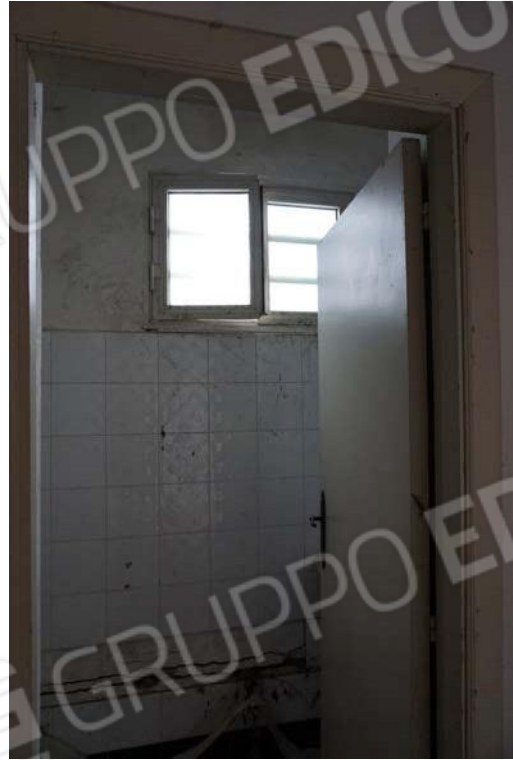
Figg.37-38 – Vista di dettaglio degli interni del sub.9 (A10)