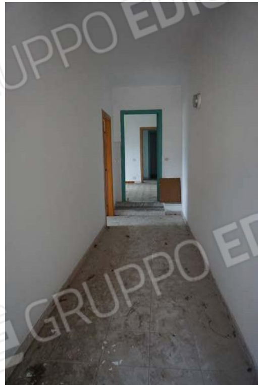
Figg.77-78 – Vista disimpegno dell’immobile al sub.13 (A10)