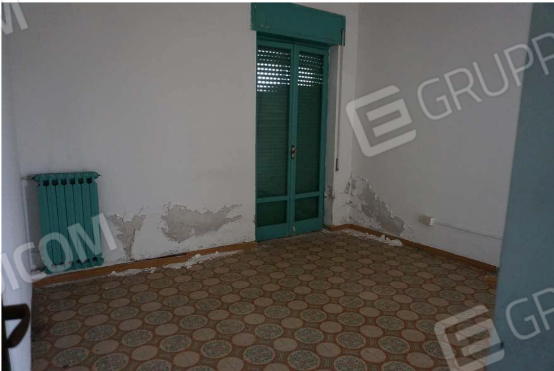
Fig.74 – Vista vano dell’immobile sub.13 (A10)