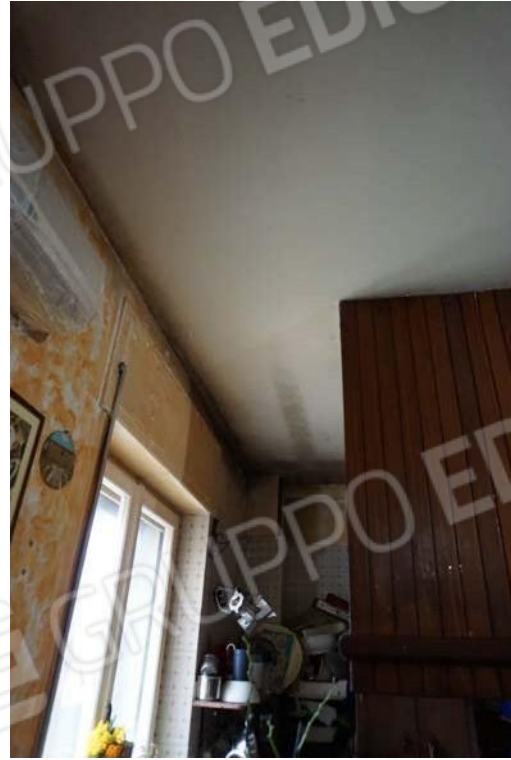
Fig.45 – Vista di dettaglio degli spazi interni del sub.11