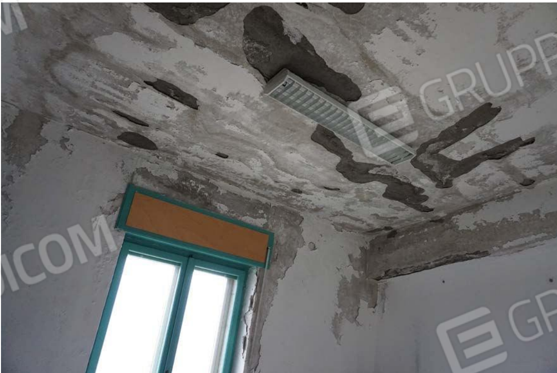
Fig.76 – Vista del degrado per infiltrazione del solaio vano dell’immobile sal ub.13 (A10)