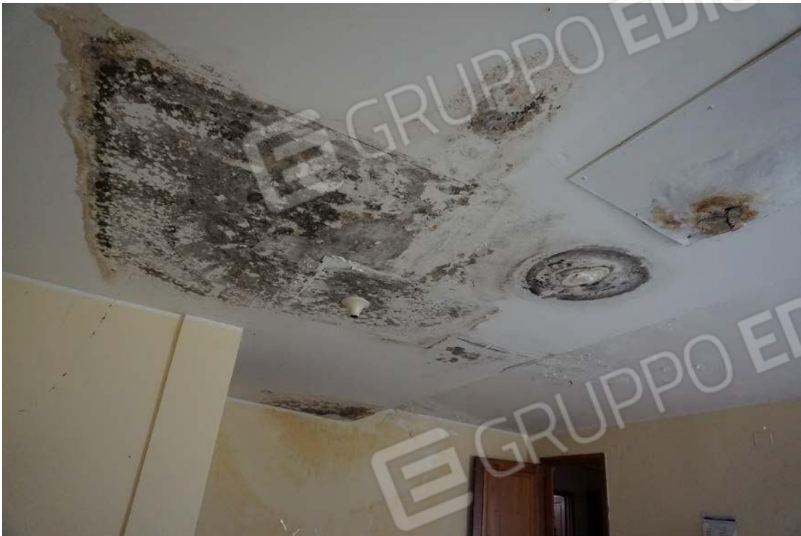
Fig.18 – Vista vano interno sub.7 (A10)