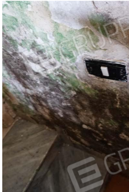
Fig.46 – Vista di dettaglio degli spazi interni del sub.11 e degrado delle superfici per infiltrazioni