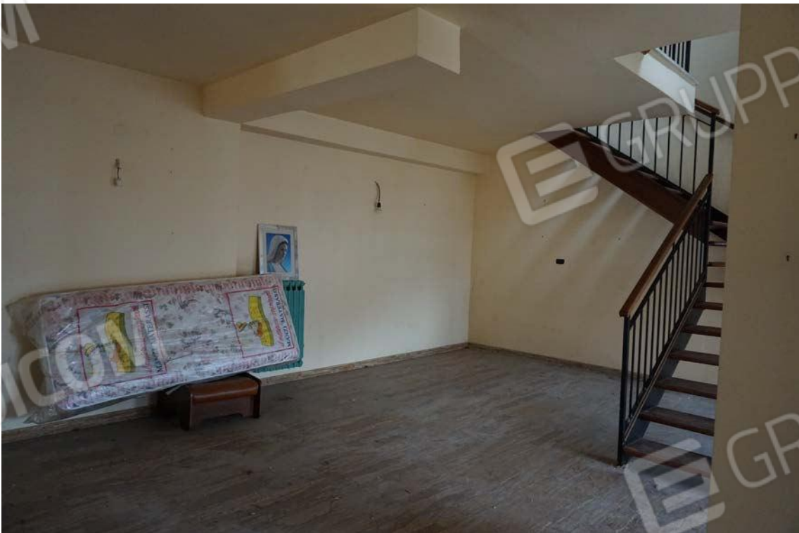
Fig.51 – Vista su vano scala di accesso al piano superiore