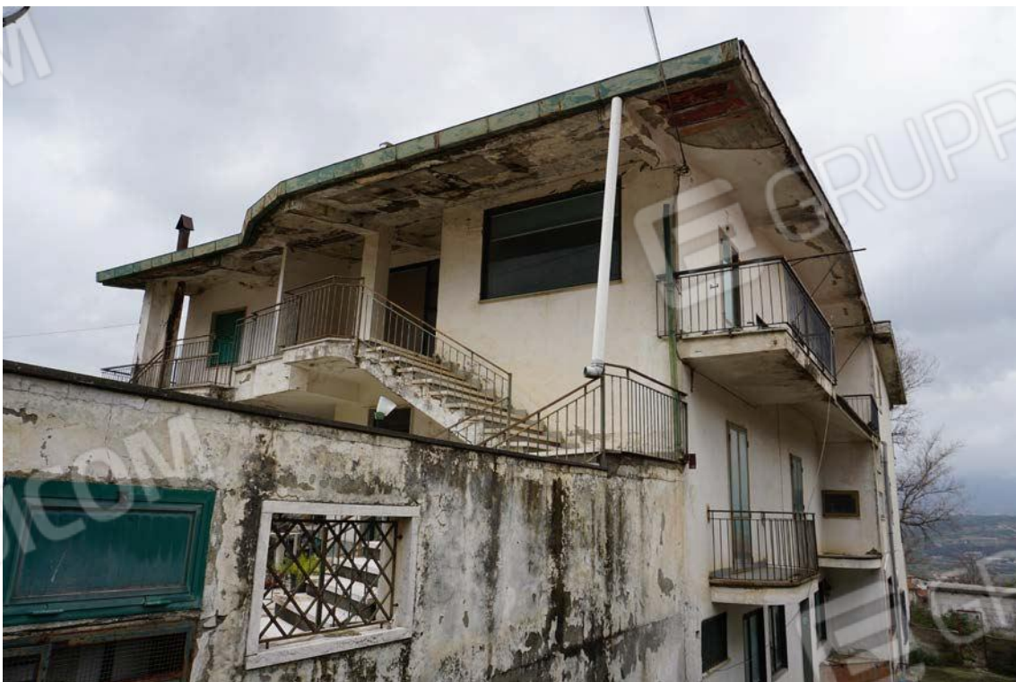
Fig.7 – Vista del fronte sud-est da Viale dei Pini