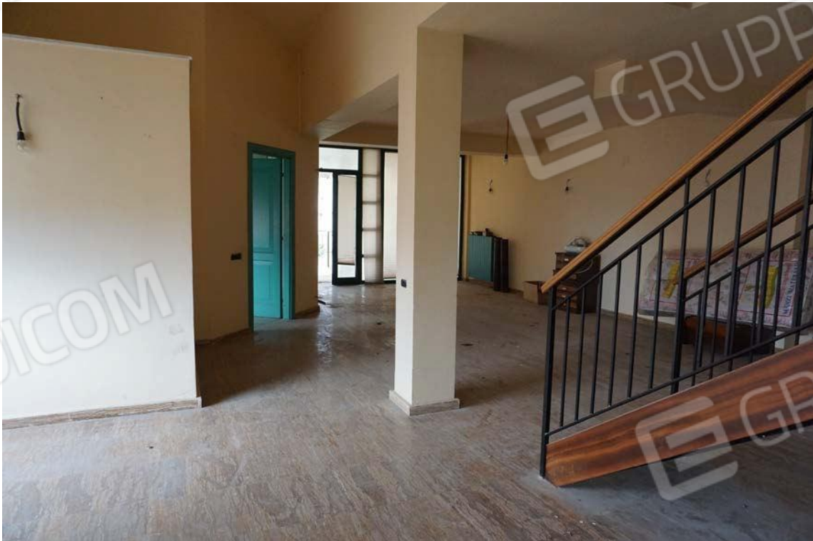
Fig.49 – Vista vano soggiorno dell’immobile al sub.12