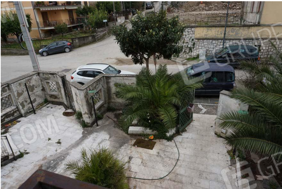
Fig.9 – Vista di dettaglio della corte su Viale dei Pini