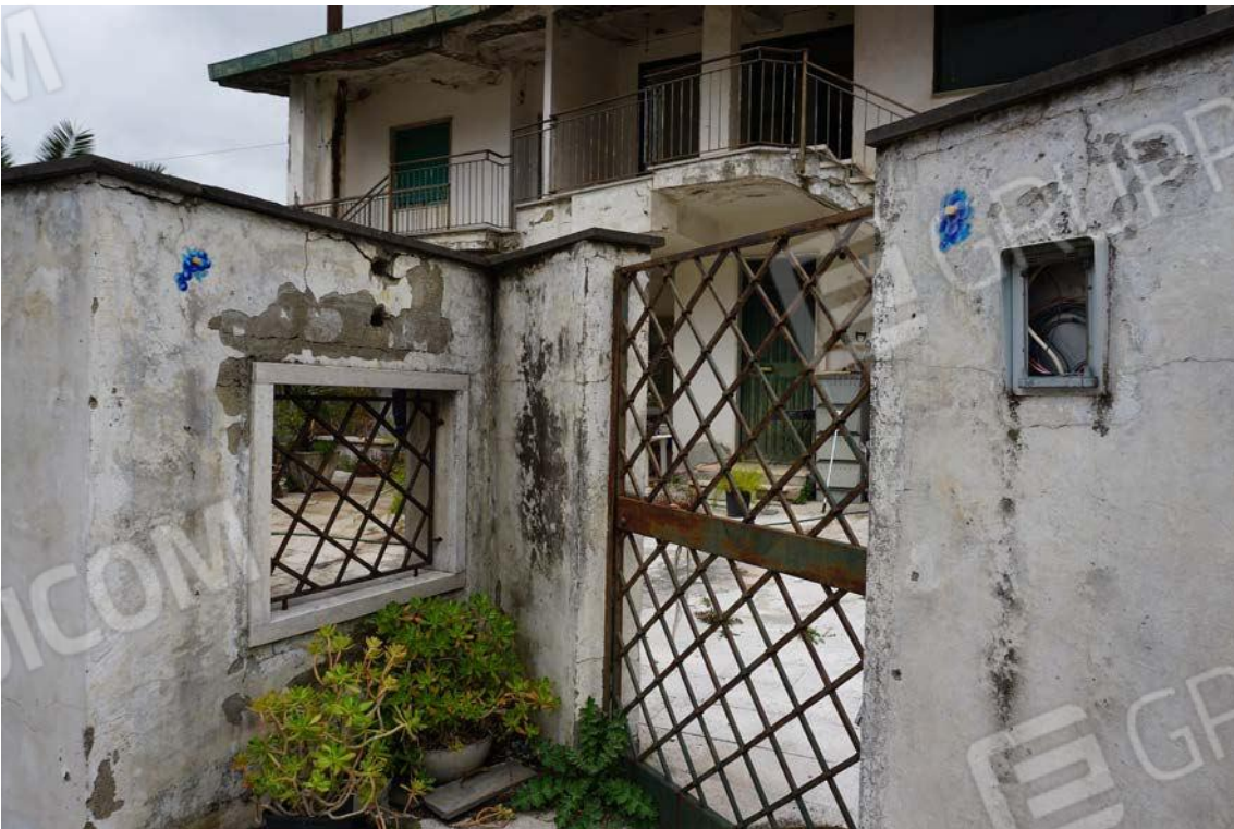
Fig.5 – Vista accesso alla proprietà da Viale dei Pini