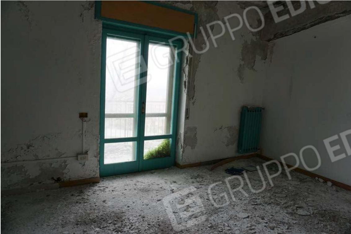
Fig.75 – Vista vano dell’immobile sub.13 (A10)