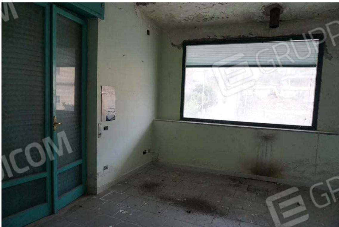
Fig.55 – Vista su vano cucina