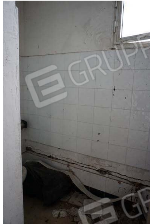
Figg.39-40 – Vista di dettaglio degli interni del sub.9 (A10)