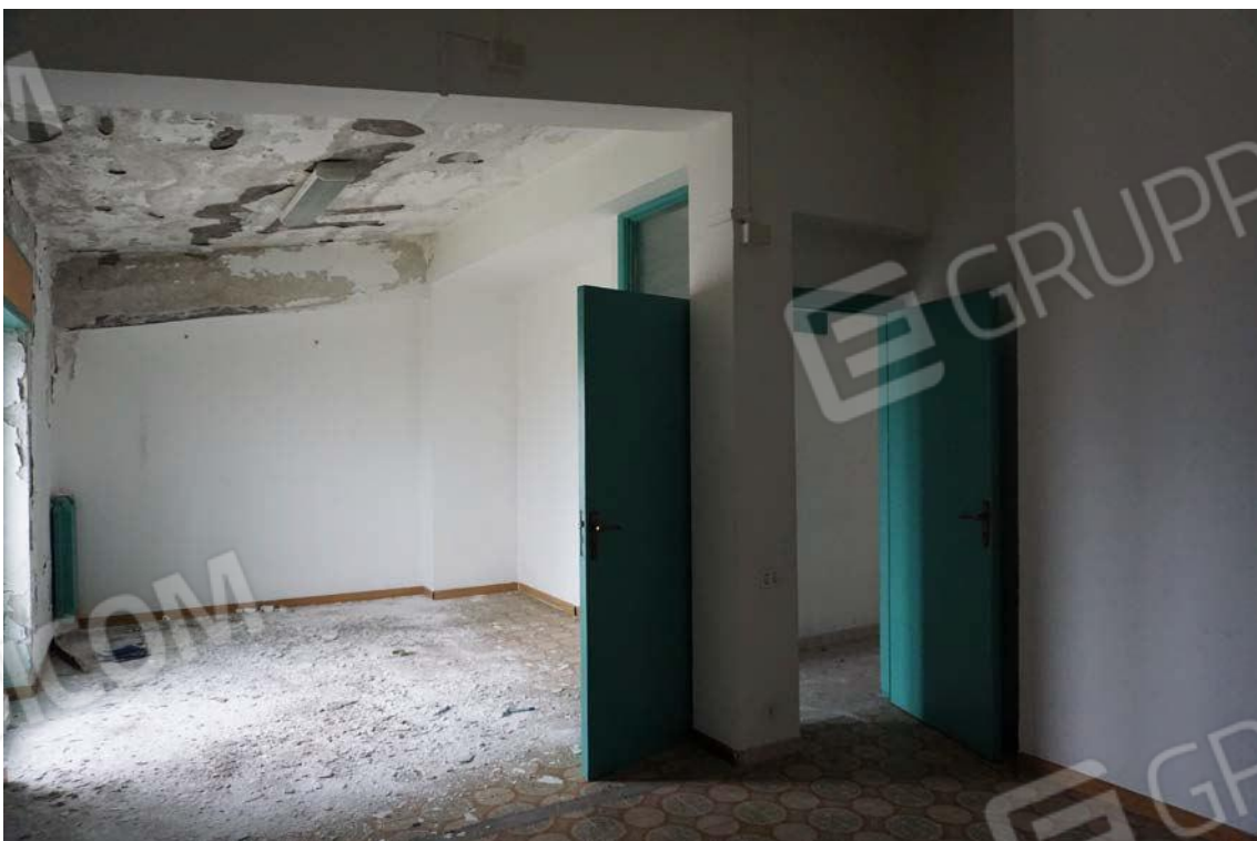
Fig.72 – Vista sala dell'immobile al sub.13 (A10)