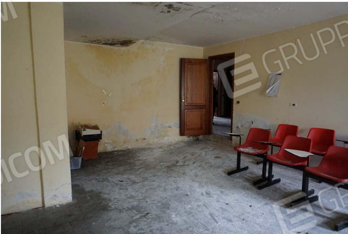
Fig.17 –Vista vano interno sub.7 (A10)