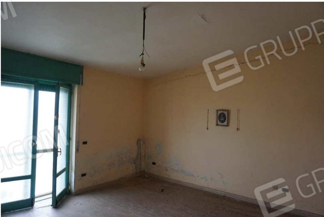
Fig.53 – Vista su vano interno dell'immobile al sub.12