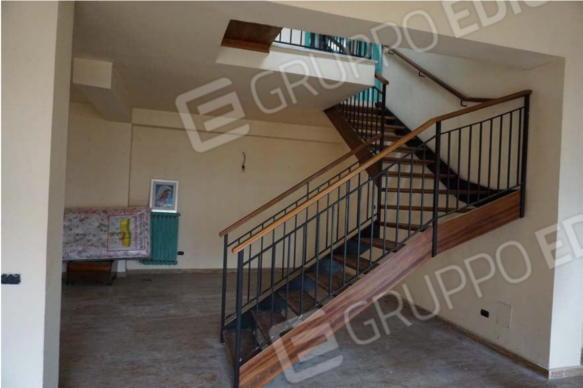
Fig.50 – Vista su vano scala di accesso al secondo piano