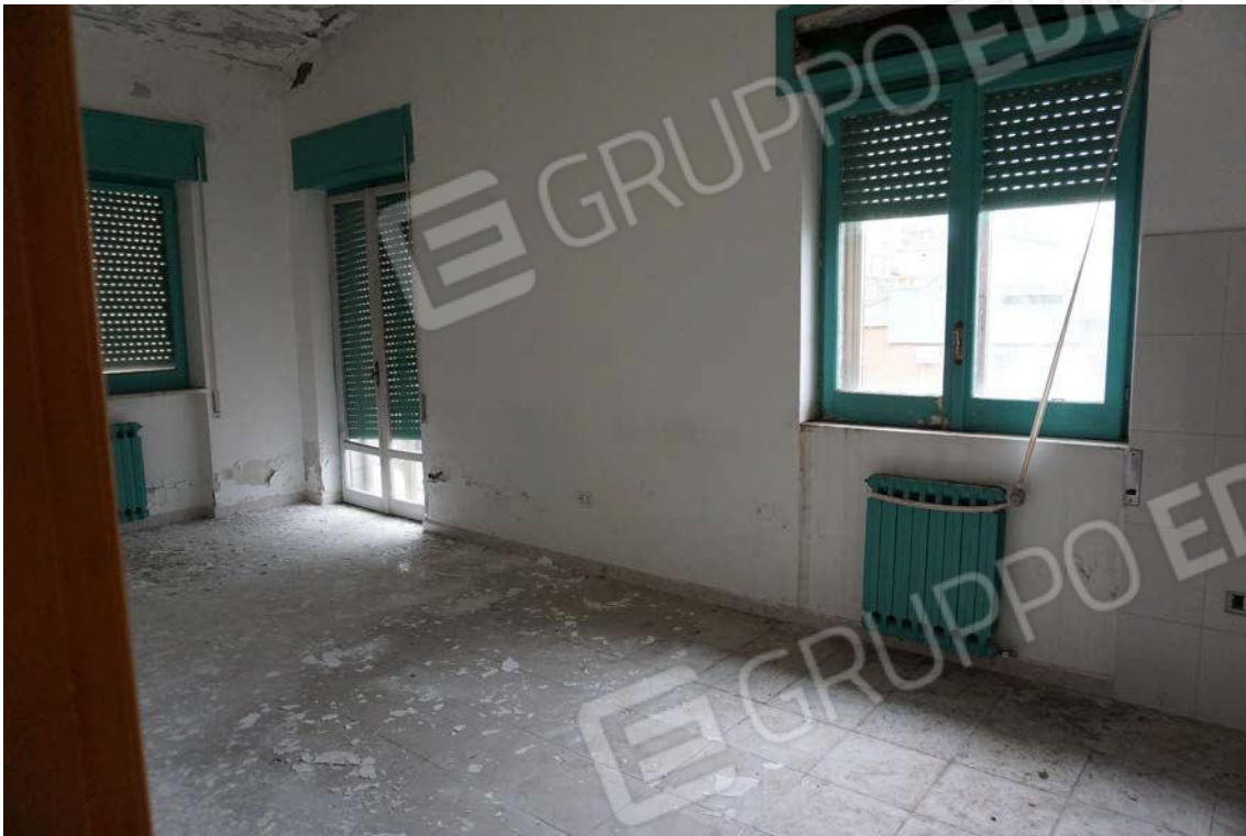
Fig.73 – Vista dell’immobile al sub.13 (A10)