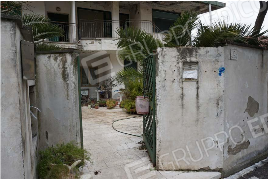
Fig.4 – Vista accesso alla proprietà da Viale dei Pini