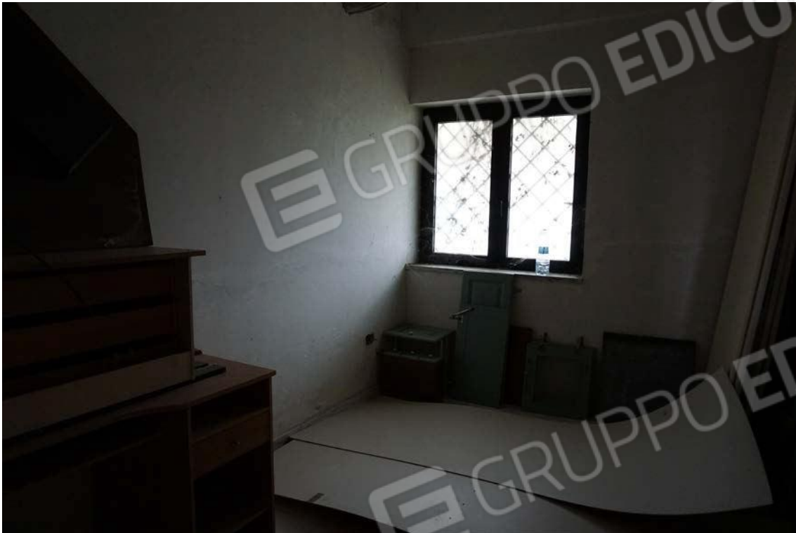
Fig.27 –Vista vano interno dell’immobile sub.9 (A10)