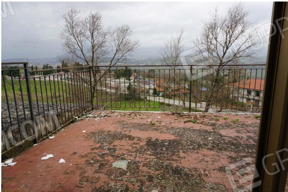
Fig.67 – Vista su terrazzo posto al secondo piano rivolto a nord dell'immobile