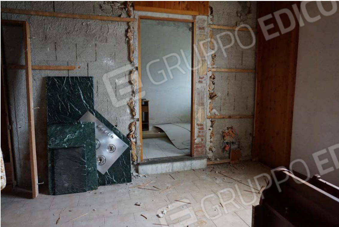
Fig.25 – Vista vano interno dell’immobile sub.9 (A10)