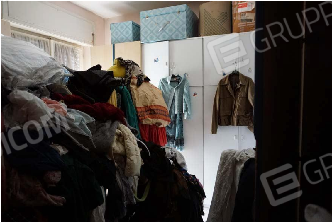
Fig.42 – Vista su vano letto del sub.11