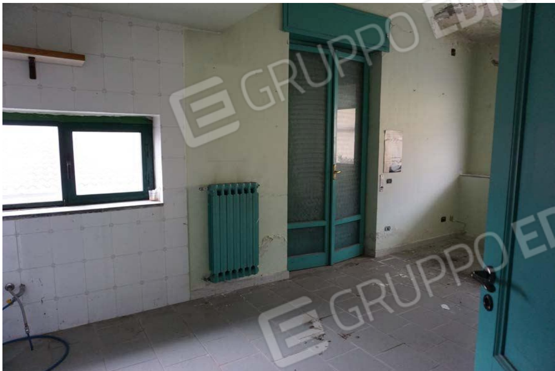
Fig.54 – Vista su vano cucina