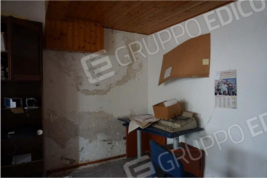
Fig.29 – Vista vano uso ufficio dell'immobile sub.9 (A10)