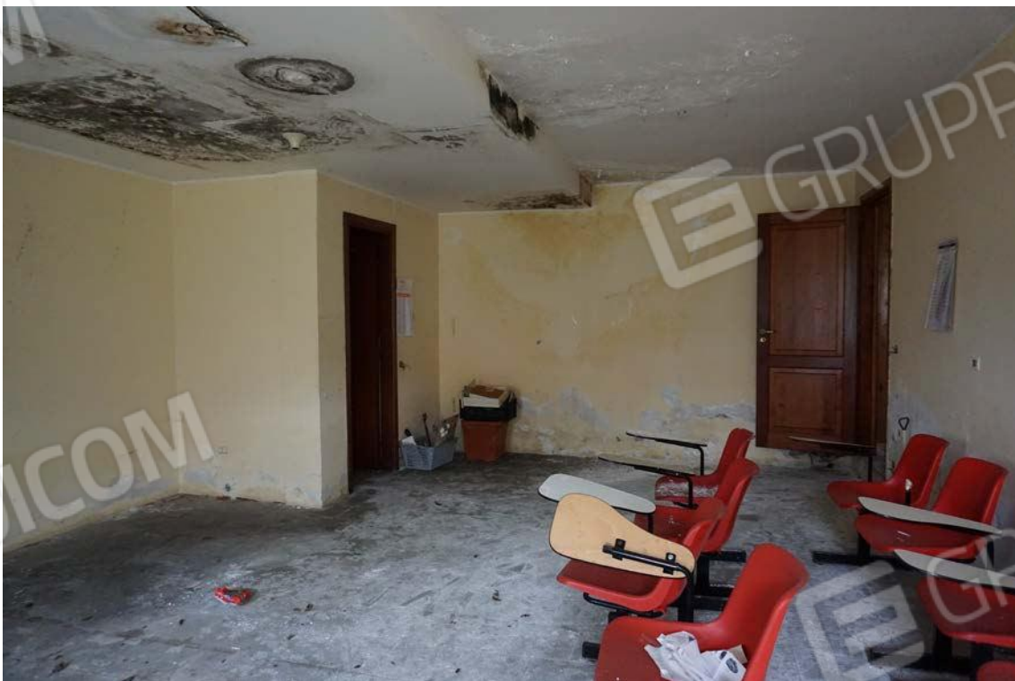
Fig.19 – Vista vano interno sub.7 (A10)