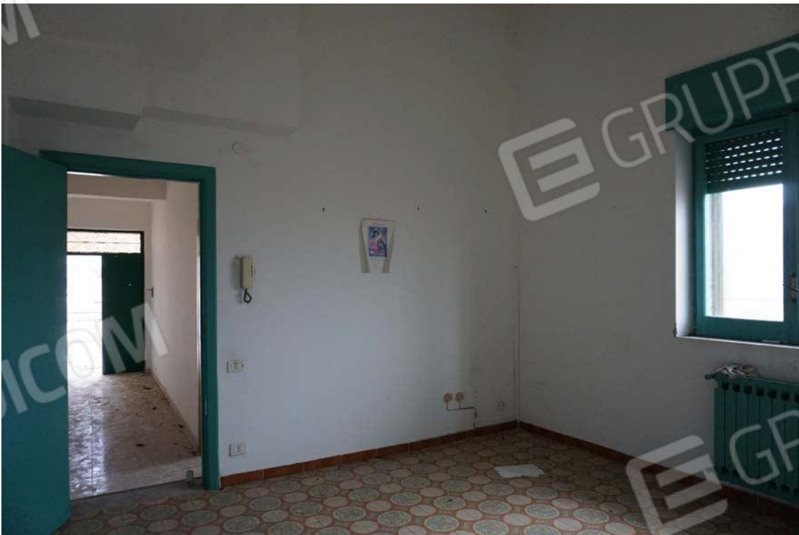
Fig.70 – Vista vano ufficio dell’immobile al sub.13 (A10)