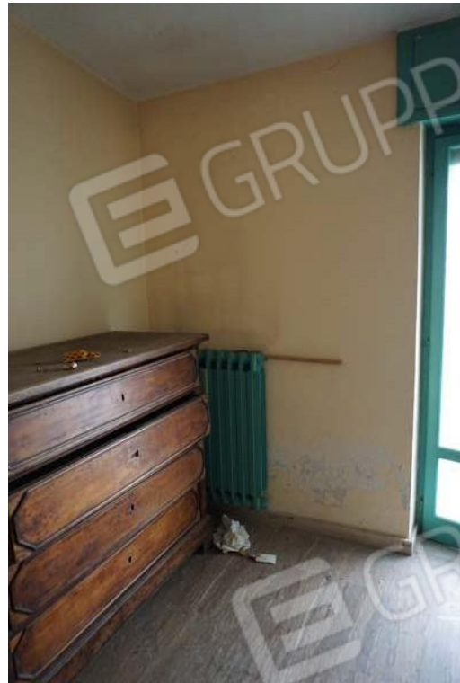
Fig.58-59 – Vista su vano posto al primo piano