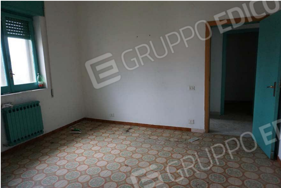
Fig.71 – Vista vano ufficio dell'immobile al sub.13 (A10)