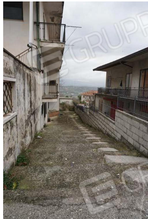
Figg.2-3 – Vista degli accessi alla proprietà da Viale dei Pini