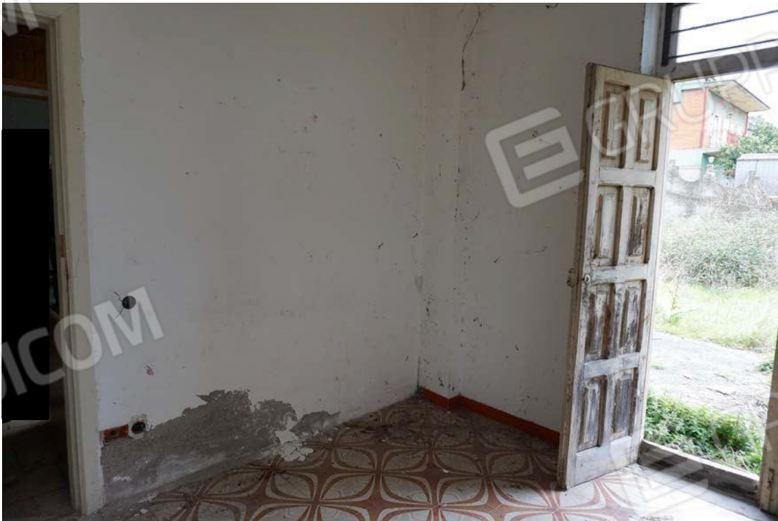
Fig.22 – Vista interna dell’ingresso del sub.9 (A10)