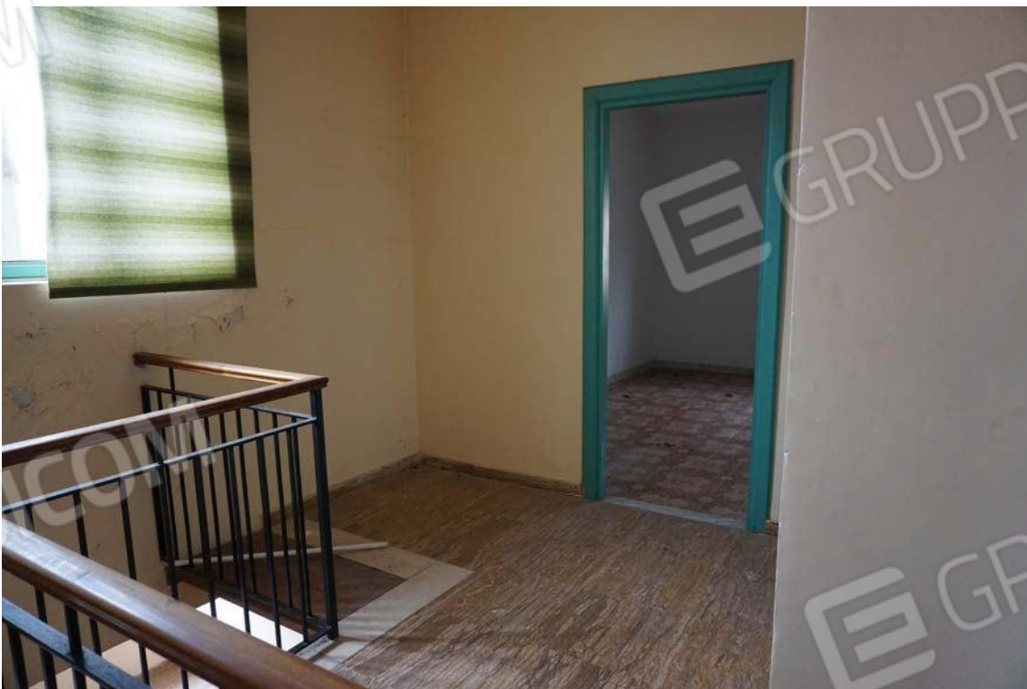
Fig.61 – Vista su pianerottolo posto al secondo piano