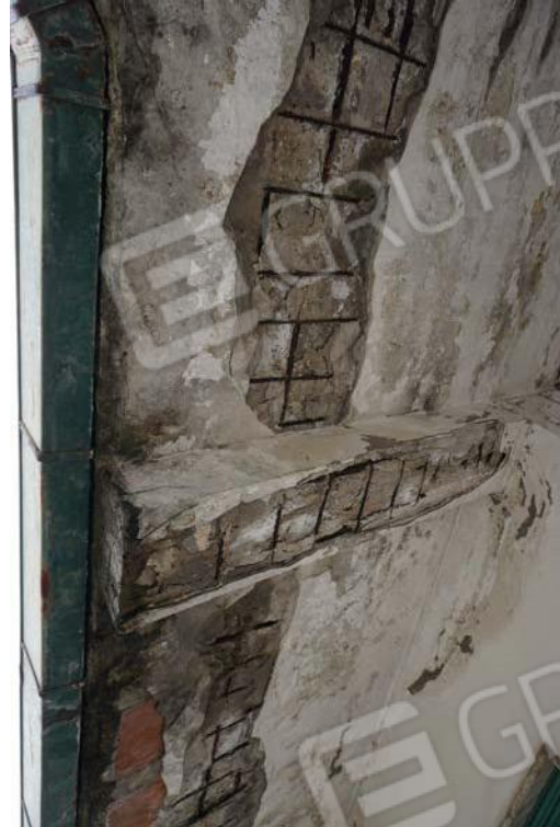
Figg.12-13 – Vista di dettaglio sul degrado delle strutture