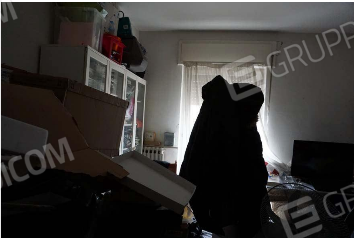
Fig.44 – Vista su vano interno del sub.11