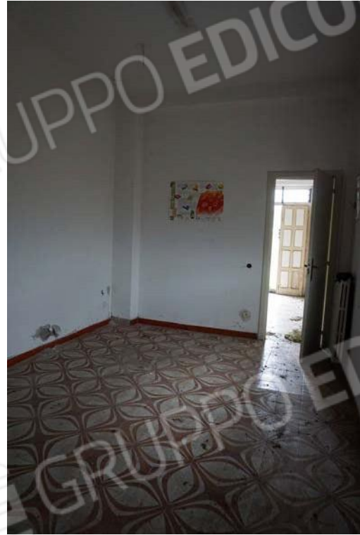
Figg.33-34 – Vista di dettaglio degli interni del sub.9 (A10)