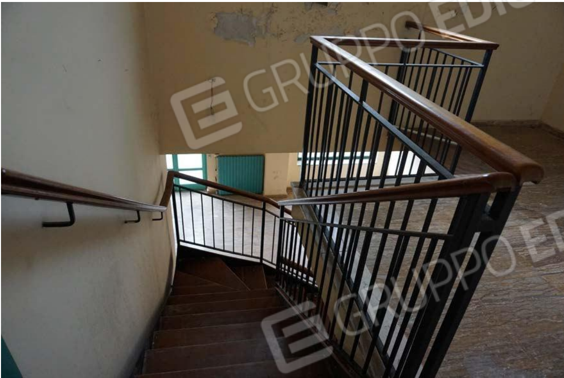
Fig.60 – Vista su scala e pianerottolo posto al secondo piano