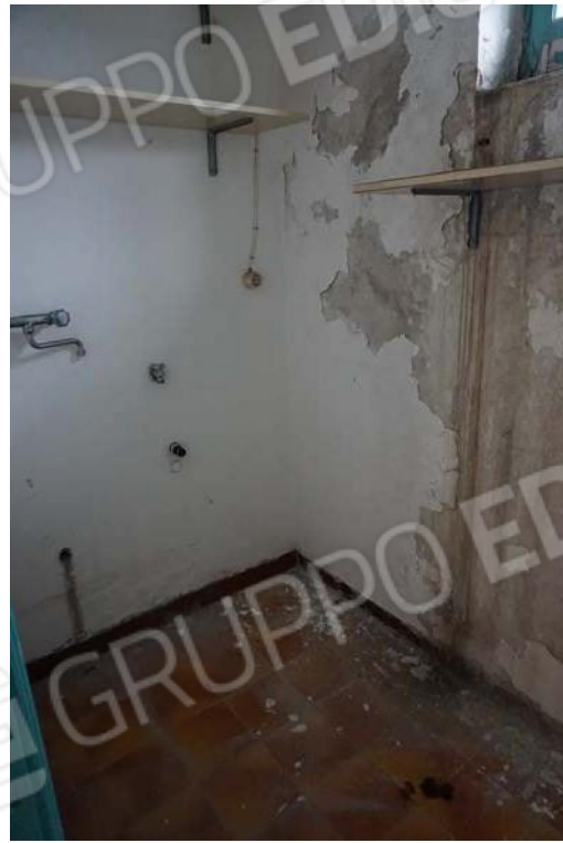
Figg.65-66 – Vista su vano ripostiglio