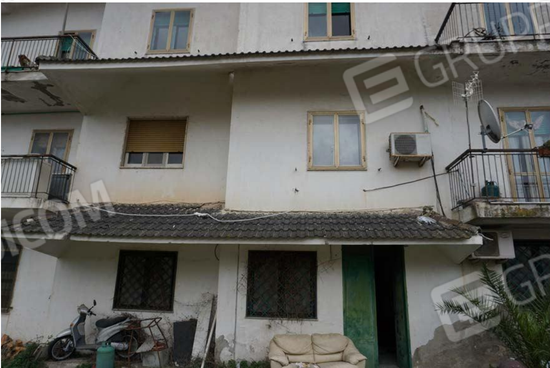
Fig.15 – Vista ingresso dell'immobile sub.7 (A10)