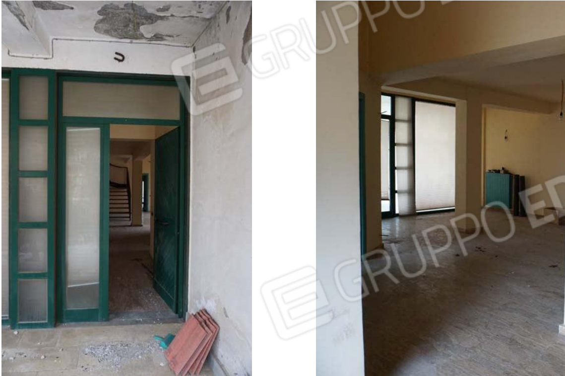
Figg.47-48 – Vista dell’ingresso e del vano d’ingresso dell’immobile al sub.12