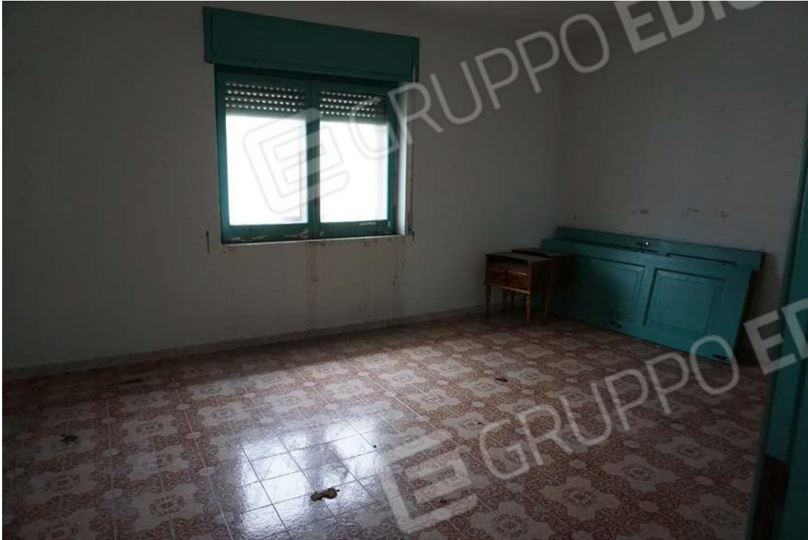
Fig.62 – Vista su vano posto al secondo piano