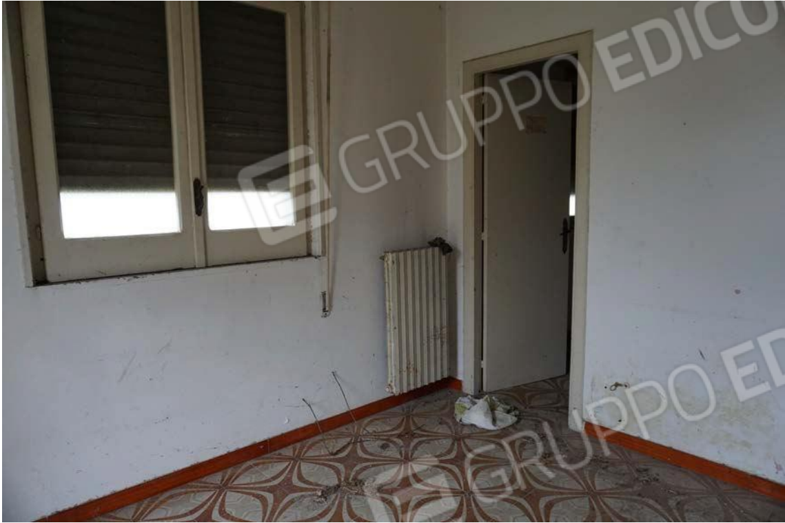
Fig.23 – Vista vano interno dell’immobile sub.9 (A10)