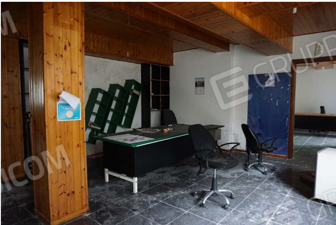
Fig.28 – Vista vano uso ufficio dell’immobile sub.9 (A10)