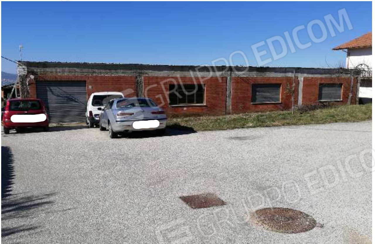
Foto n. 1: ...Vista dell'immobile Fig. 10 p.lla 462/1 dalla strada di accesso...