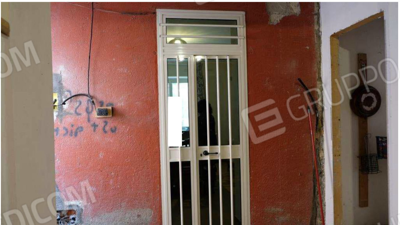
Foto 4 – Porta di accesso al corpo del fabbricato ex deposito dall'abitazione