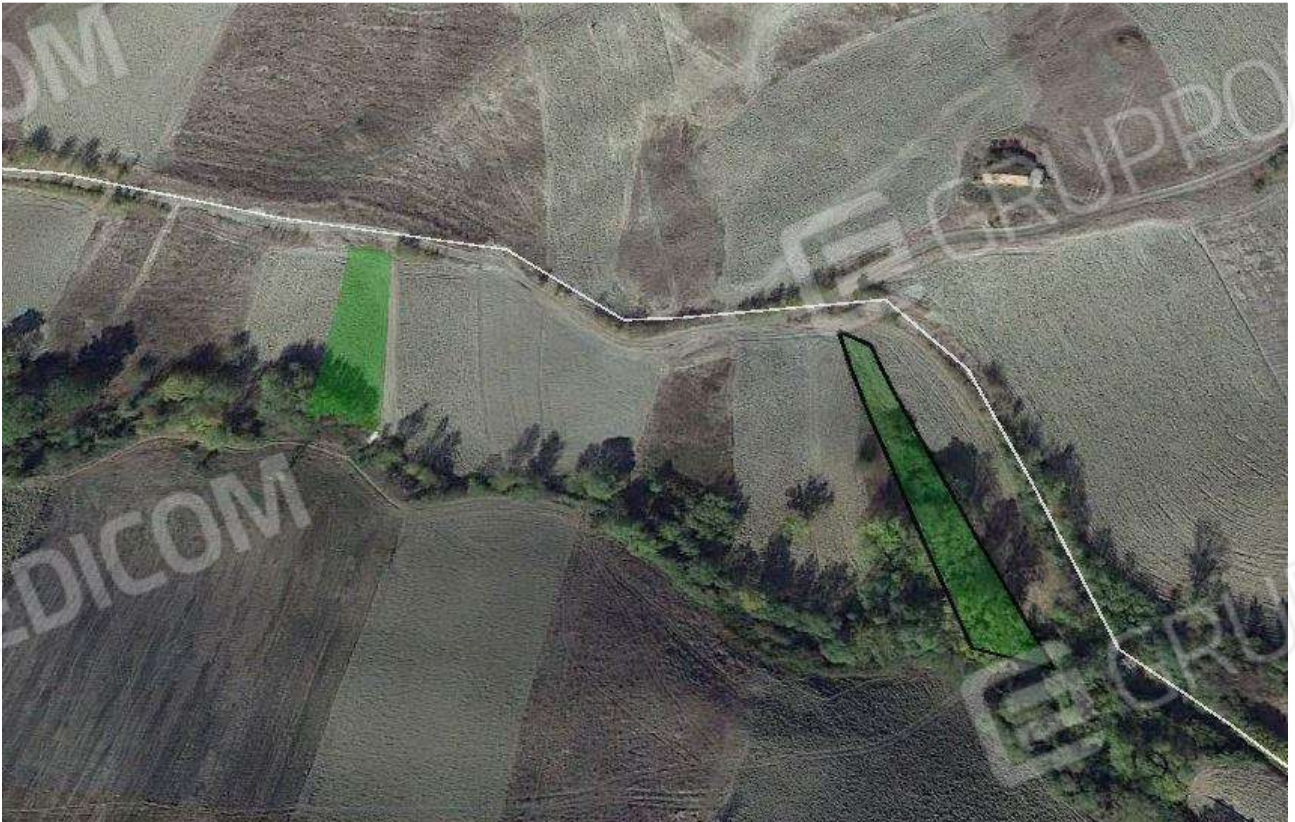
Foto 24 – Vista satellitare delle aree delle particelle pignorate del foglio 97