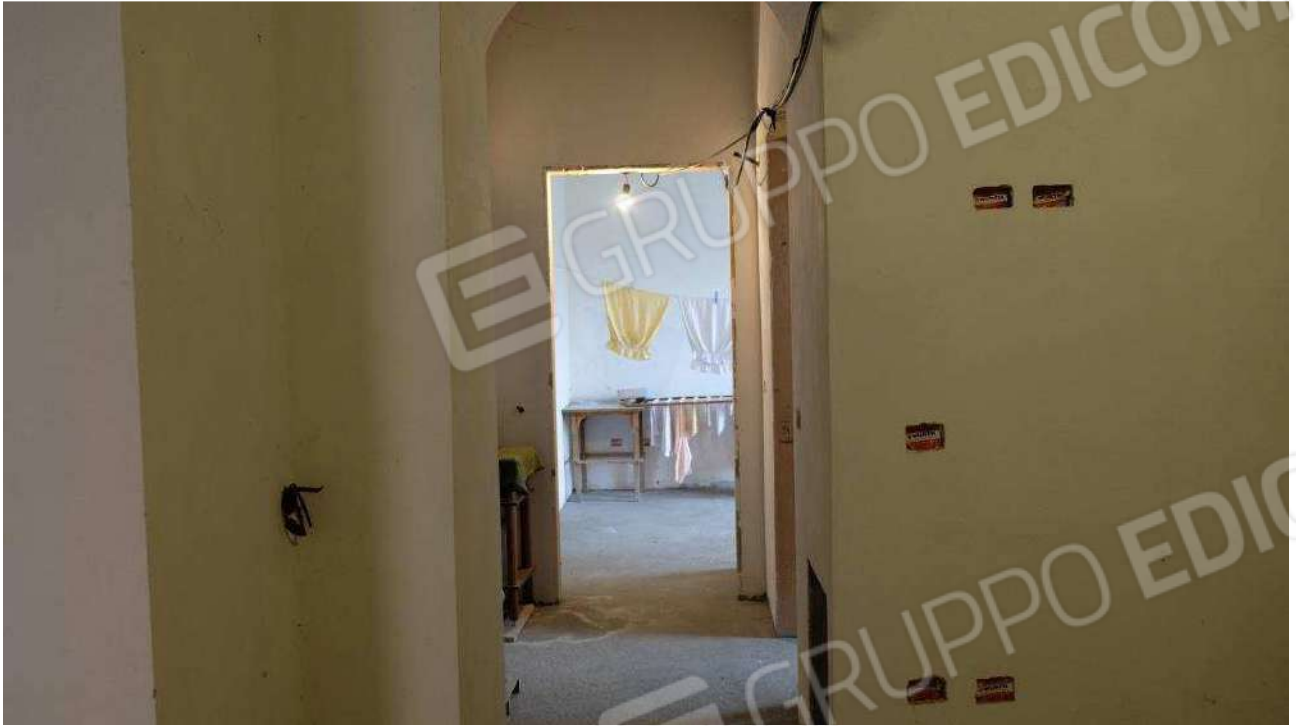
Foto 5 – Dettaglio degli interni dell'immobile ex deposito nello stato rustico