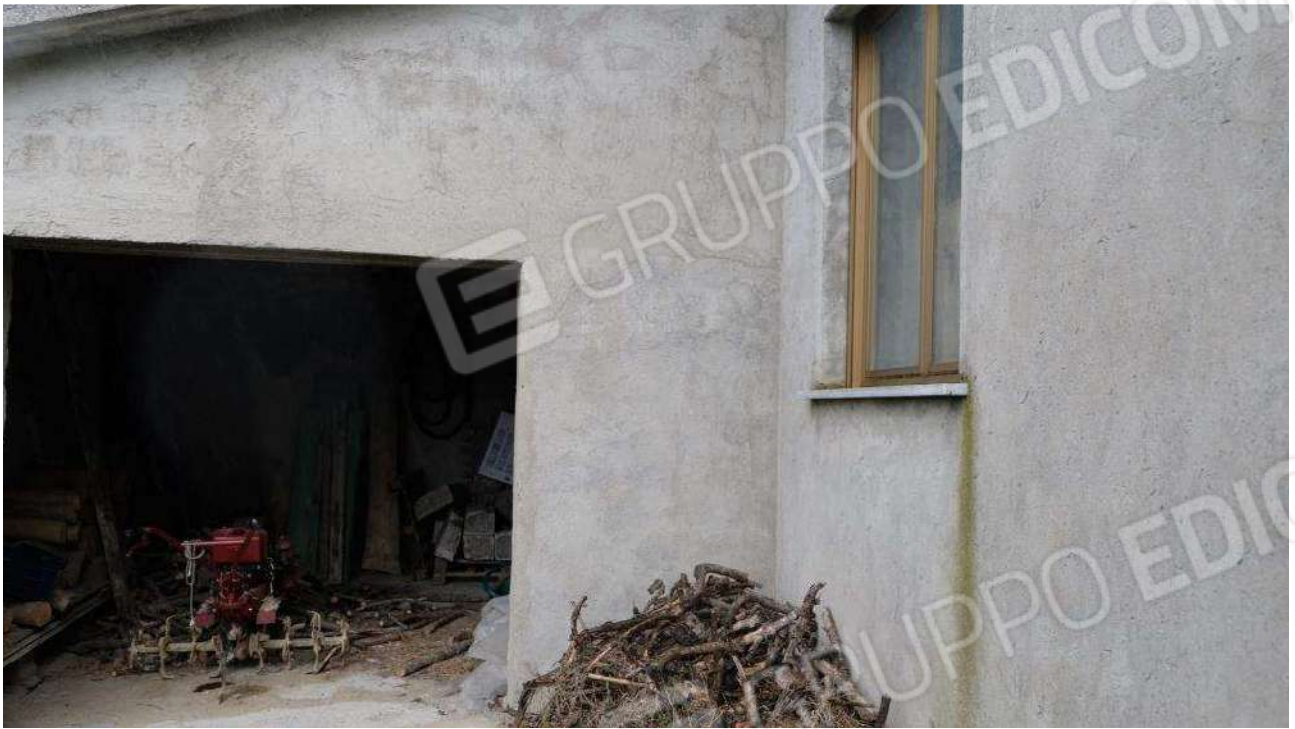
Foto 15 – Dettaglio dell'ingresso al locale più piccolo dell'autorimessa