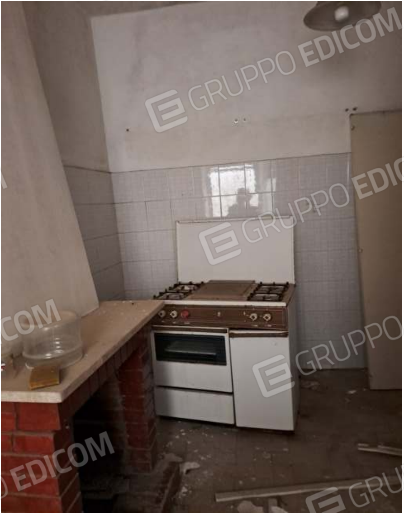
FOTO N. 9 ALTRA VISTA DEL LOCALE CUCINA