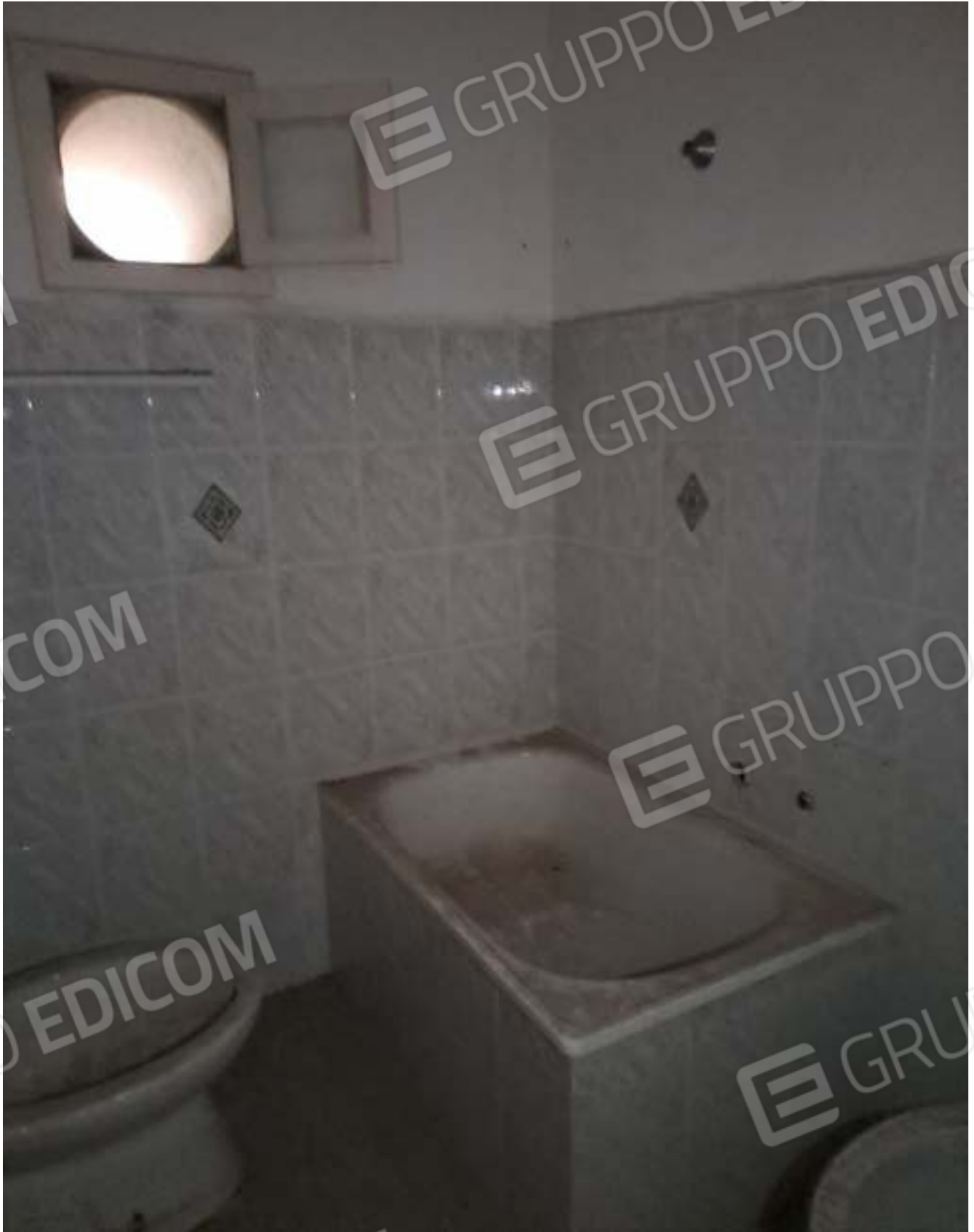
FOTO N. 10 VISTA DEL LOCALE BAGNO