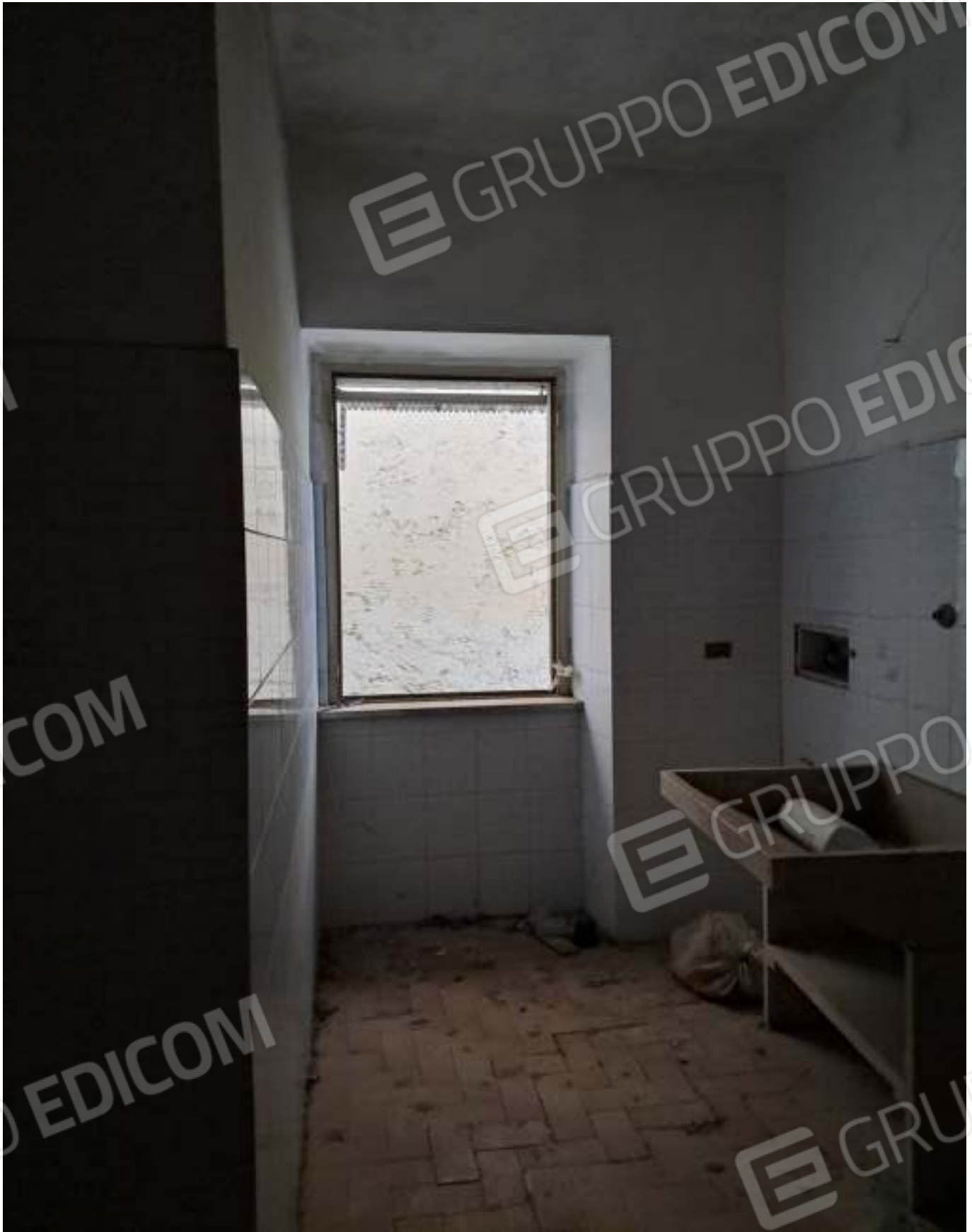
FOTO N. 8 VISTA DEL LOCALE CUCINA