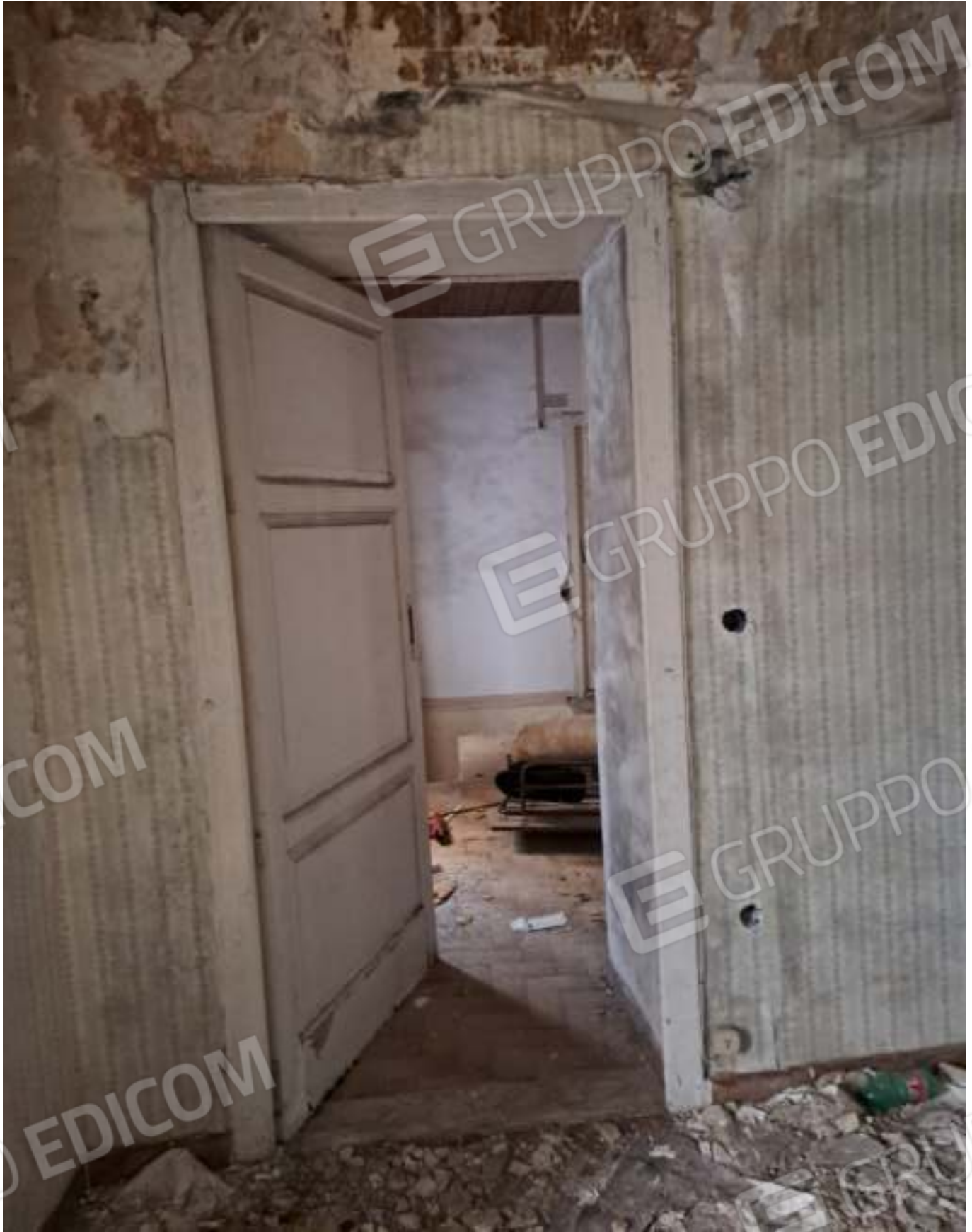
FOTO N. 7 VISTA DELLA PORTA DI COMUNICAZIONE TRA INGRESSO E LETTO 1