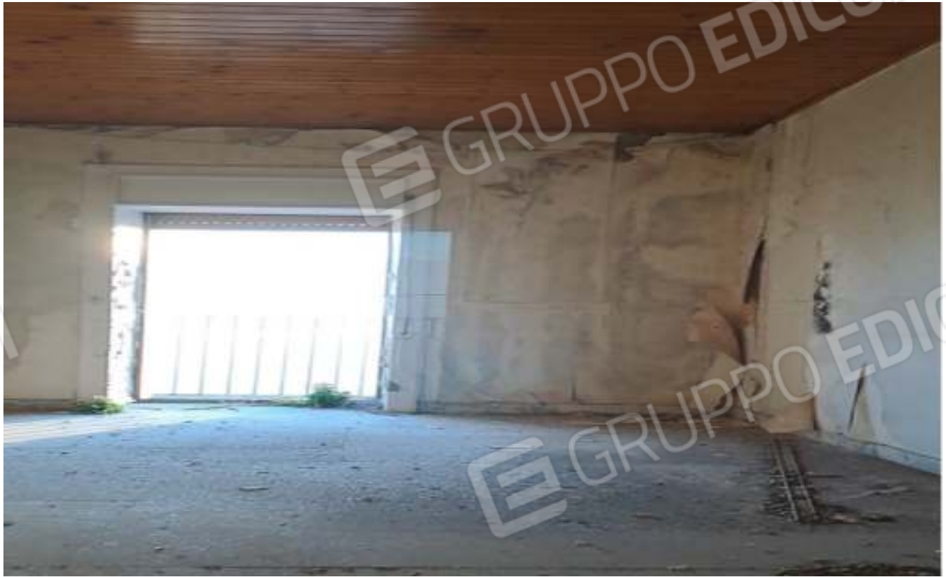
FOTO N. 11 VISTA DEL LOCALE SOGGIORNO PRANZO