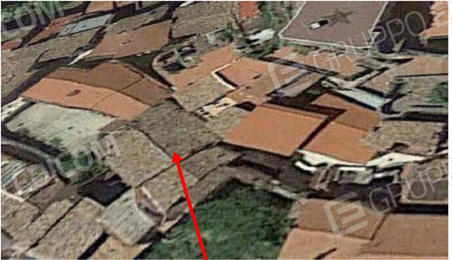
VISTA AEREA DA GOOGLE MAPS DI DETTAGLIO-QUI CESPITE