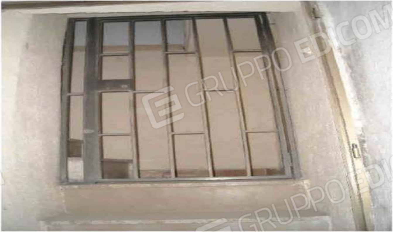
FOTO N.1 VISTA DELLA SCALA DI ACCESSO DALL'ANDRONE COMUNE