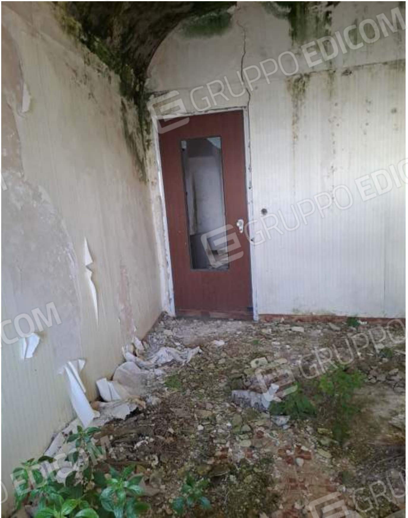
FOTO N. 6 ALTRA VISTA DEL LOCALE LETTO 2