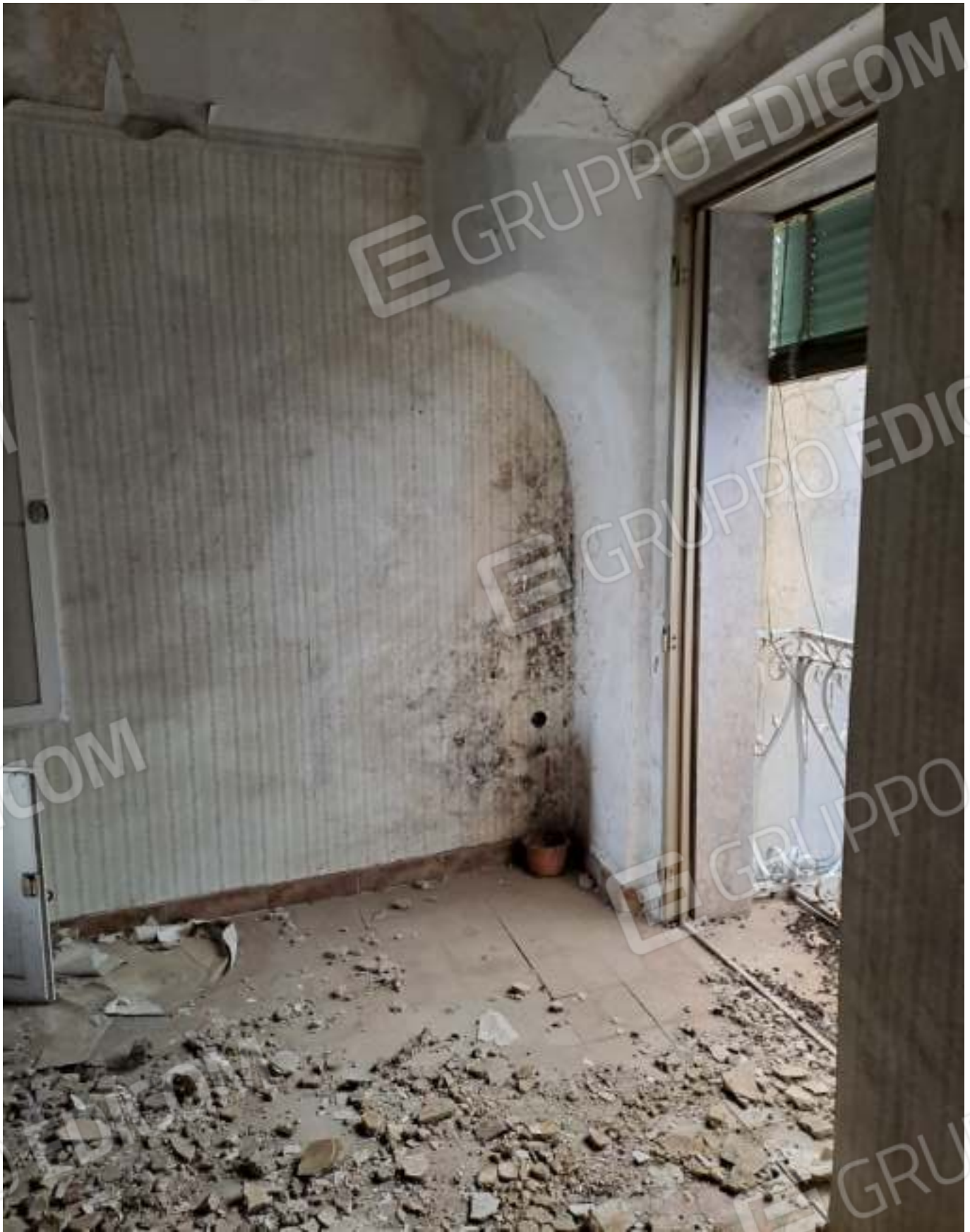
FOTO N. 5 ALTRA VISTA DEL LOCALE LETTO 1