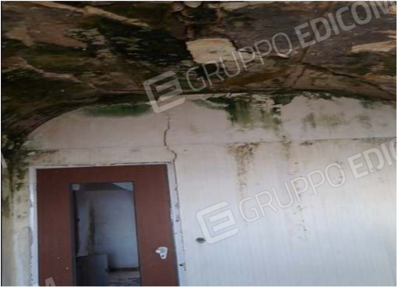
FOTO N. 13 VISTA DI PORZIONE DI VOLTA DEL LOCALE LETTO 1