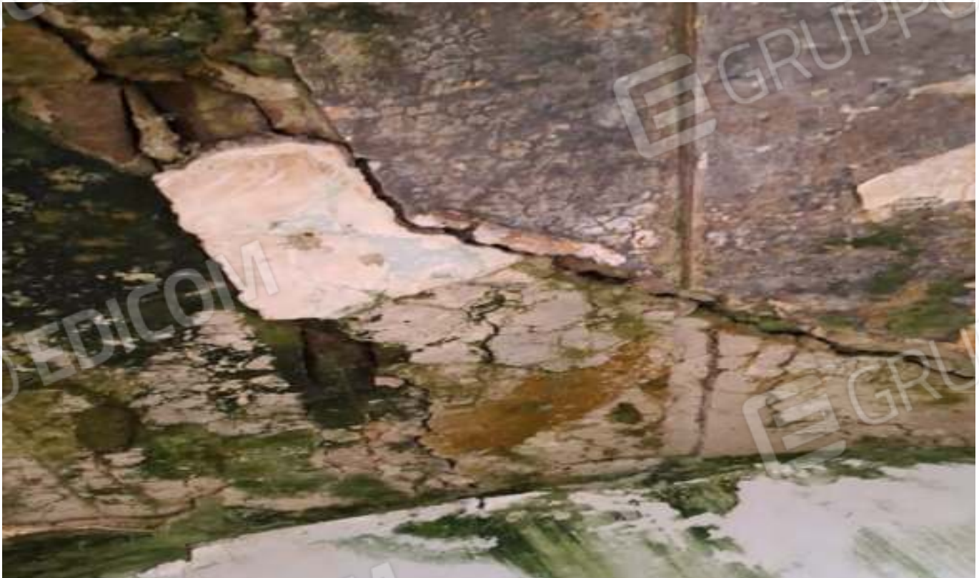
FOTO N. 14 VISTA INGRANDITA DEL DEGRADO DELLA VOLTA DEL LOCALE LETTO 1