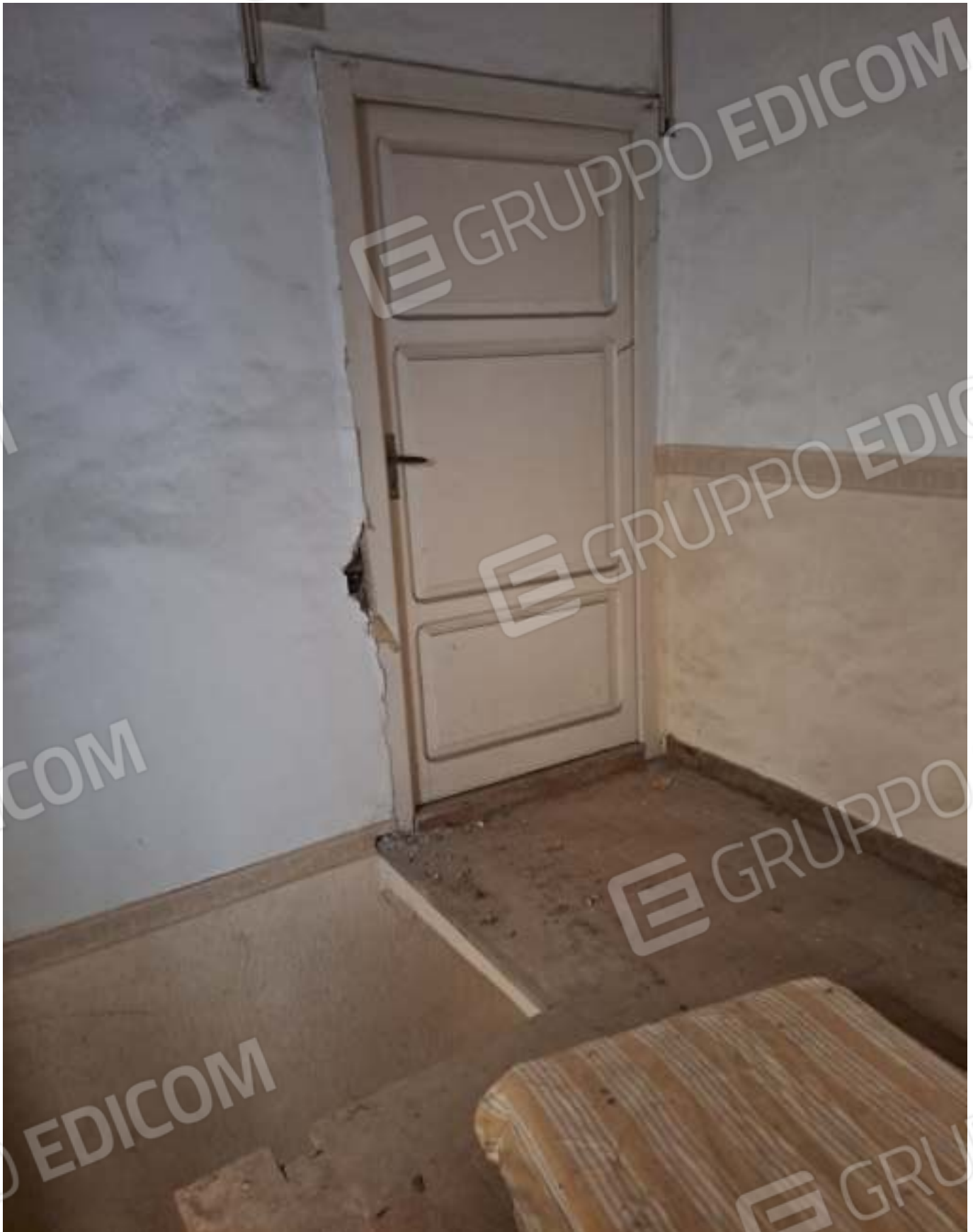
FOTO N. 3 VISTA DELLA PORTA DI ACCESSO ALLA CUCINA