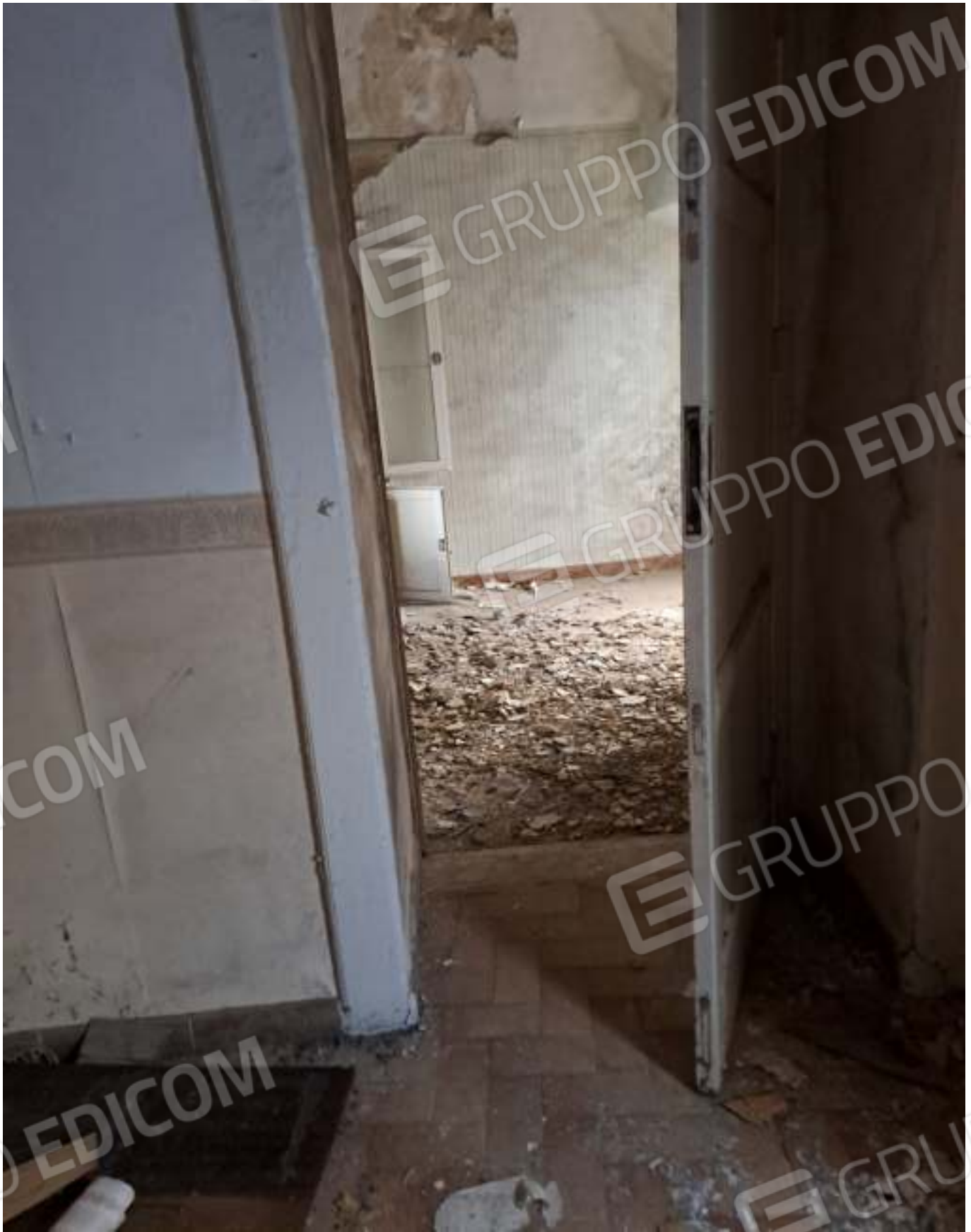
FOTO N. 4 VISTA DEL LOCALE LETTO 1