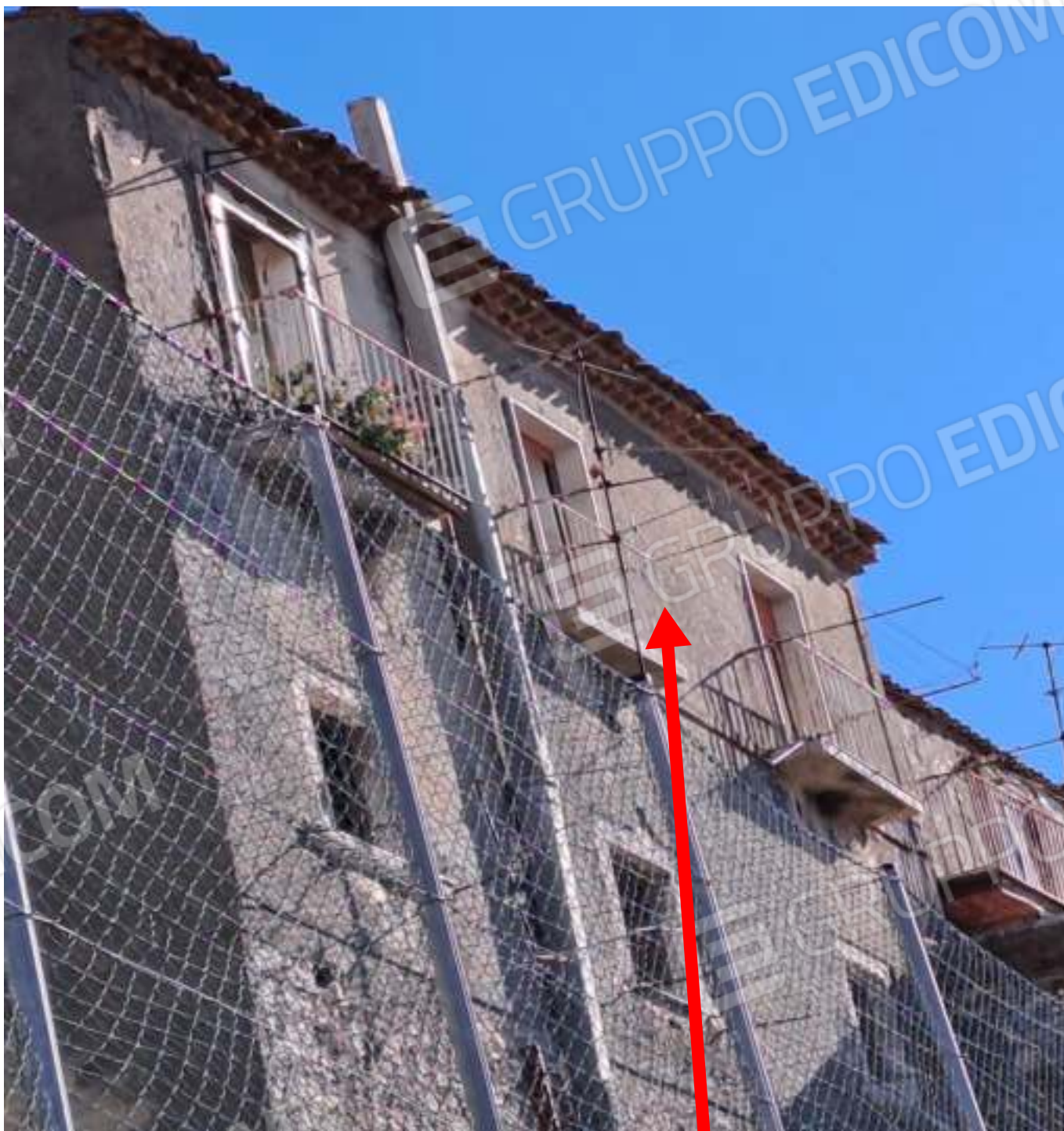
FOTO N. 15 VISTA DEL PROSPETTO ESTERNO DAL LATO SUD OVEST DEL CESPITE