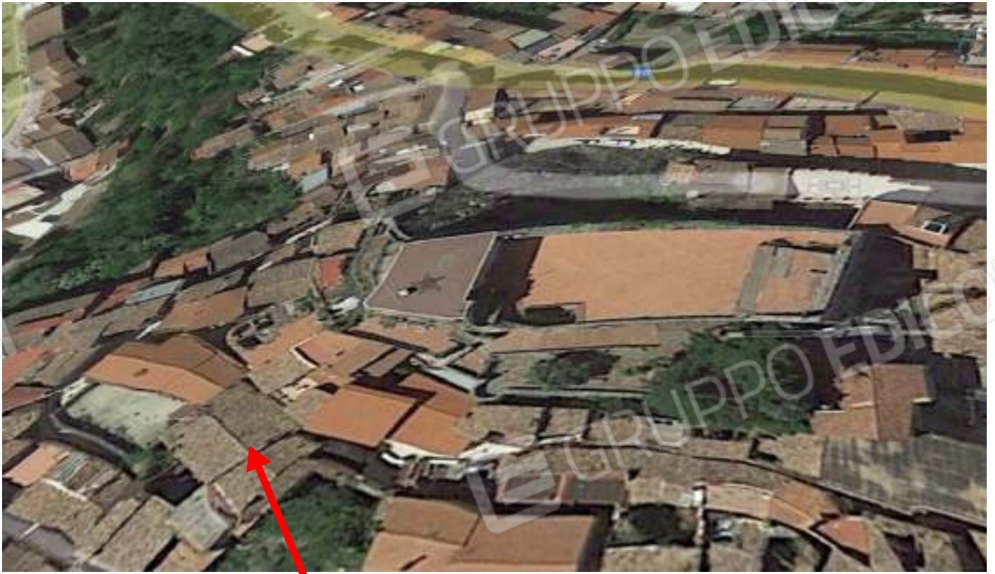
VISTA AEREA DA GOOGLE MAPS-QUI CESPITE