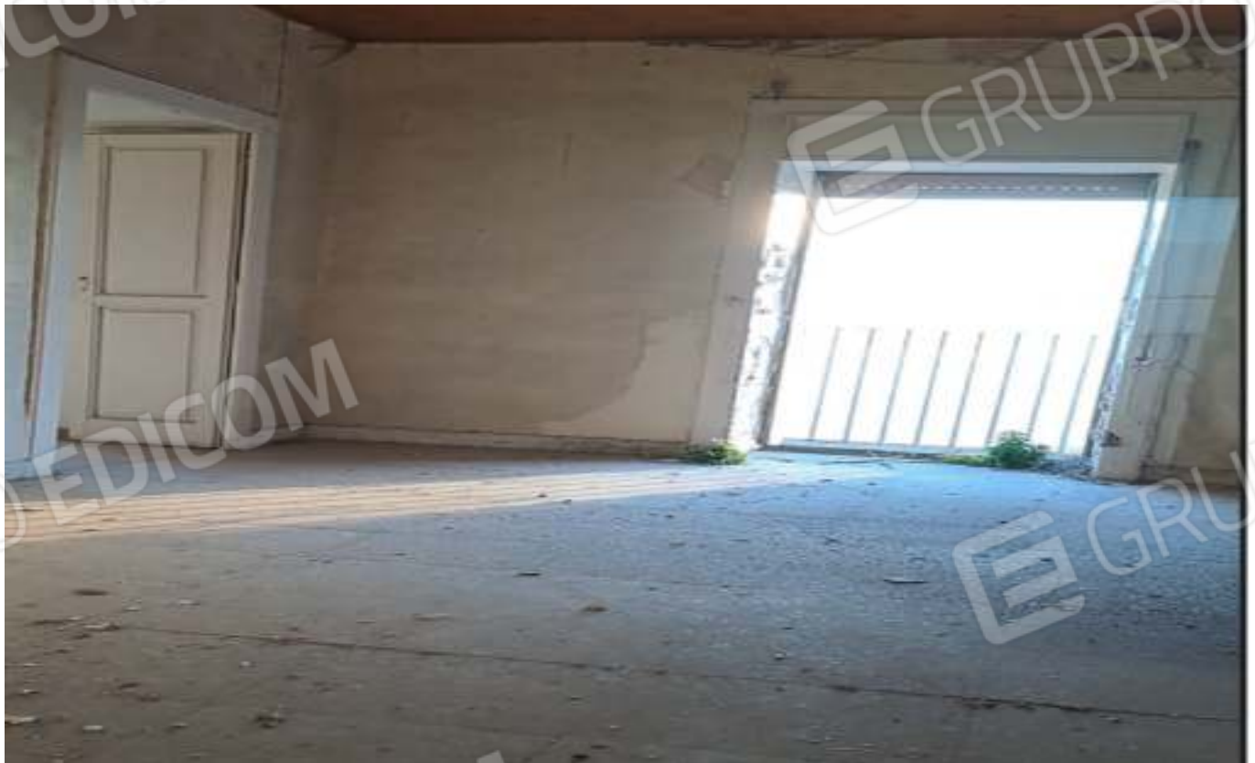
FOTO N. 12 ALTRA VISTA DEL LOCALE SOGGIORNO PRANZO