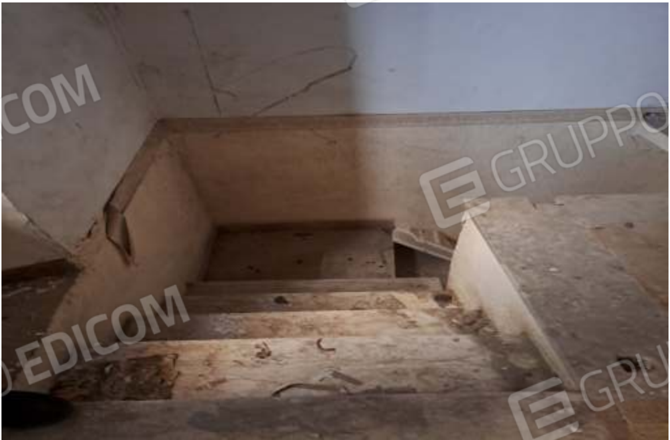
FOTO N.2 ALTRA VISTA DELLA SCALA DI ACCESSO