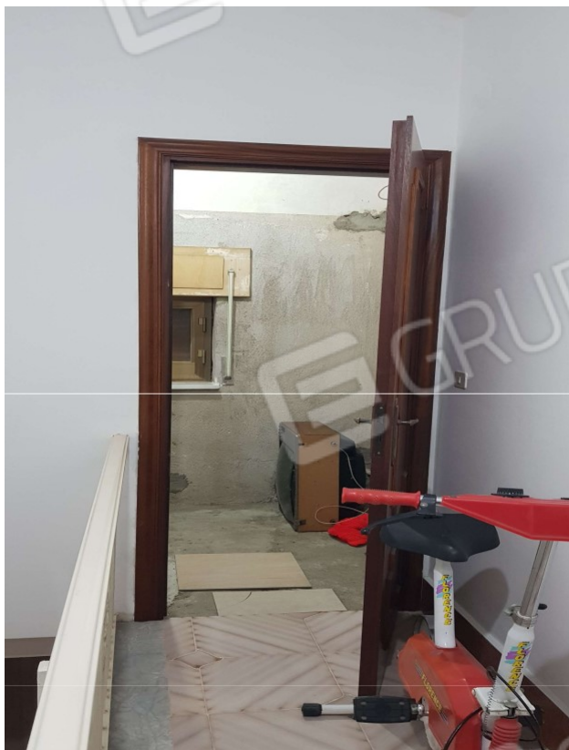
Piano Primo (sub 2) WC 1