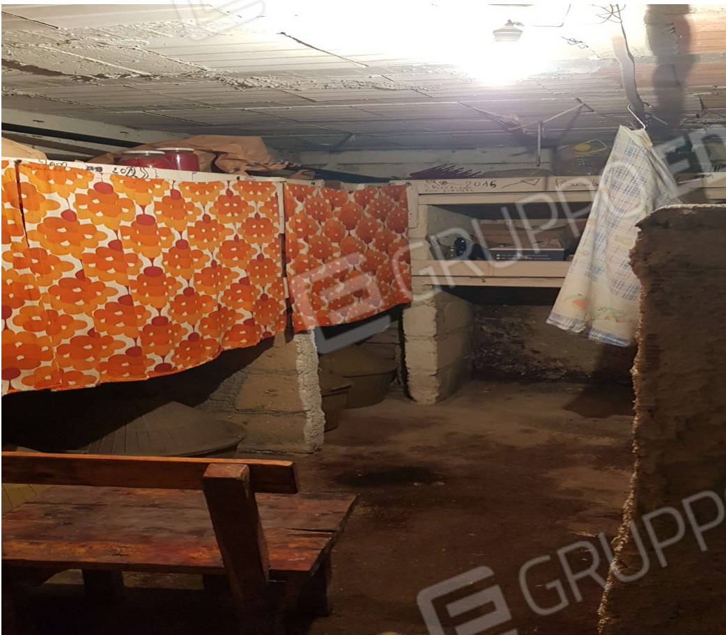
Lotto 1- Paduli (BN) DEPOSITI Fg. 19 p.Ila 422 sub 3 Deposito 1