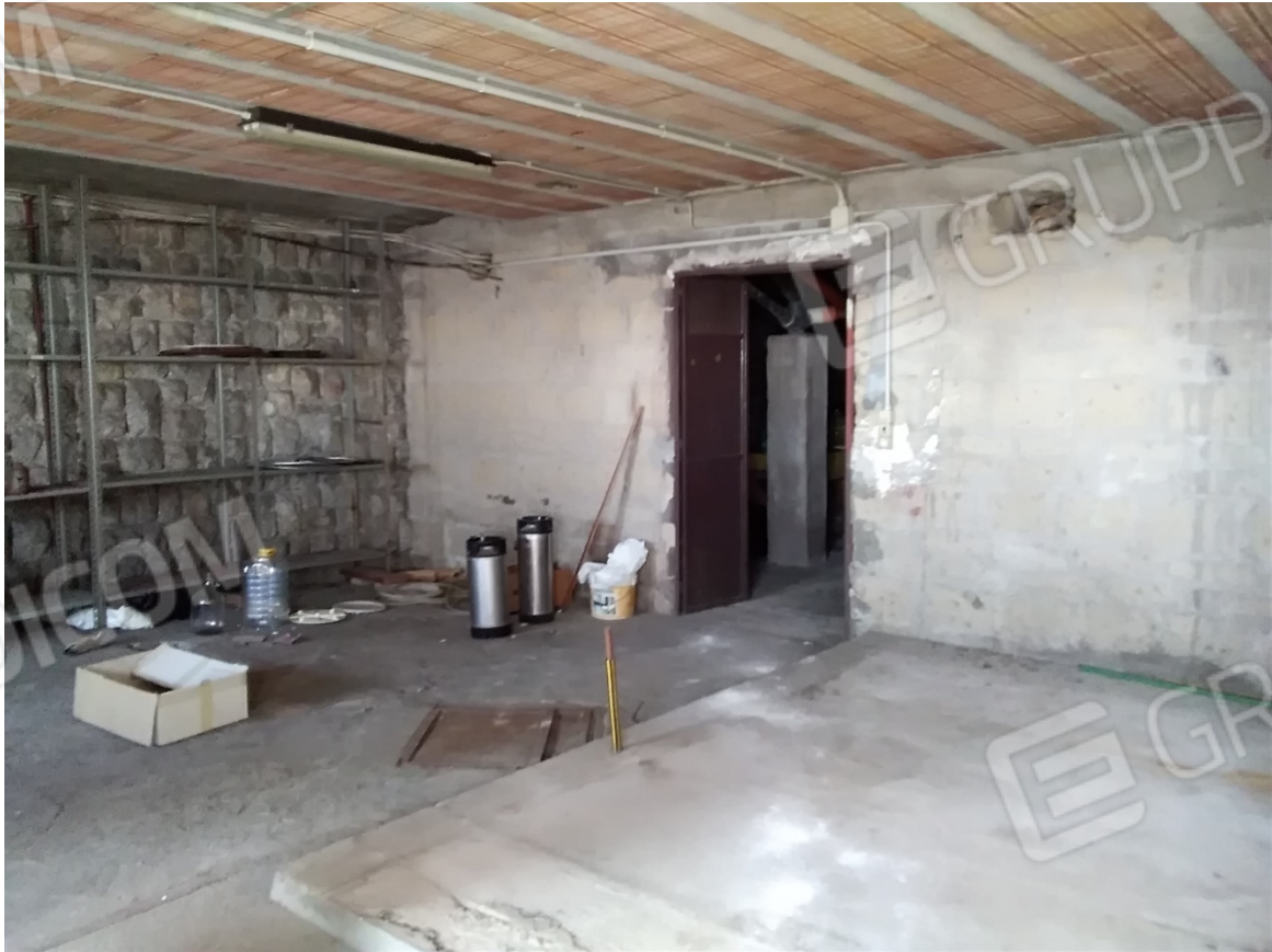
N14_DEPOSITO _PIANO SEMINTERRATO 1°