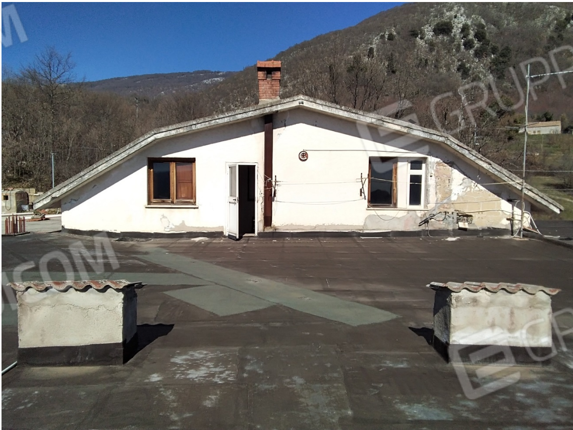
N30_PIANO PRIMO_APPARTAMENTO+LASTRICO SOLARE