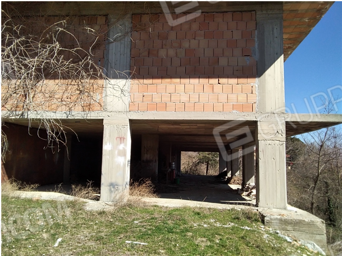
N10_PROSPETTO LATERALE OVEST_PIANI (SEMINTERRATO 1°-Seminterrato 2°)