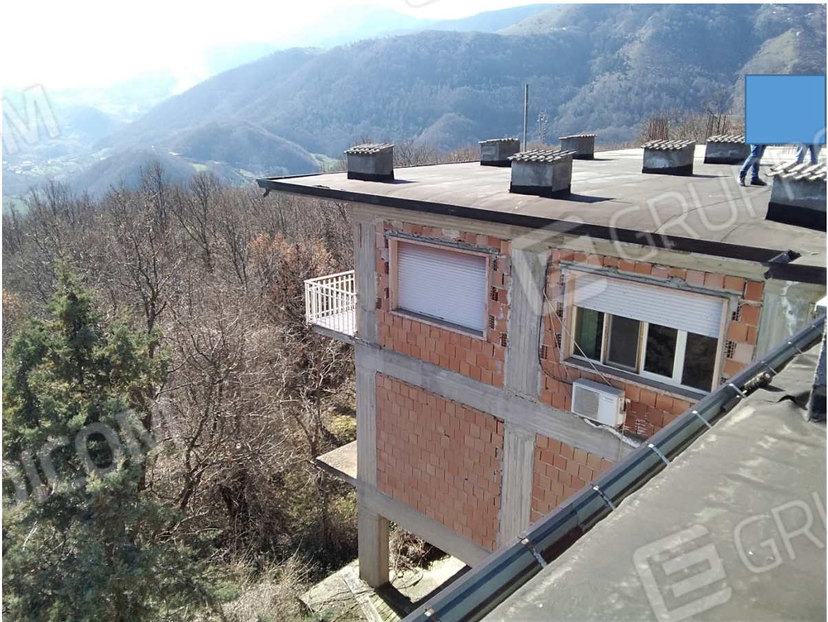
N12_PROSPETTO LATERALE EST