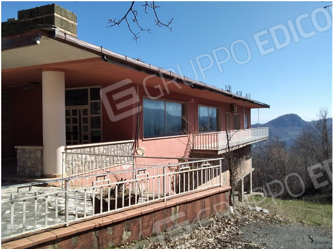
N7_PROSPETTO LATERALE OVEST