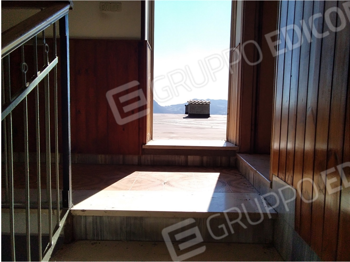
N35_INGRESSO LASTRICO SOLARE