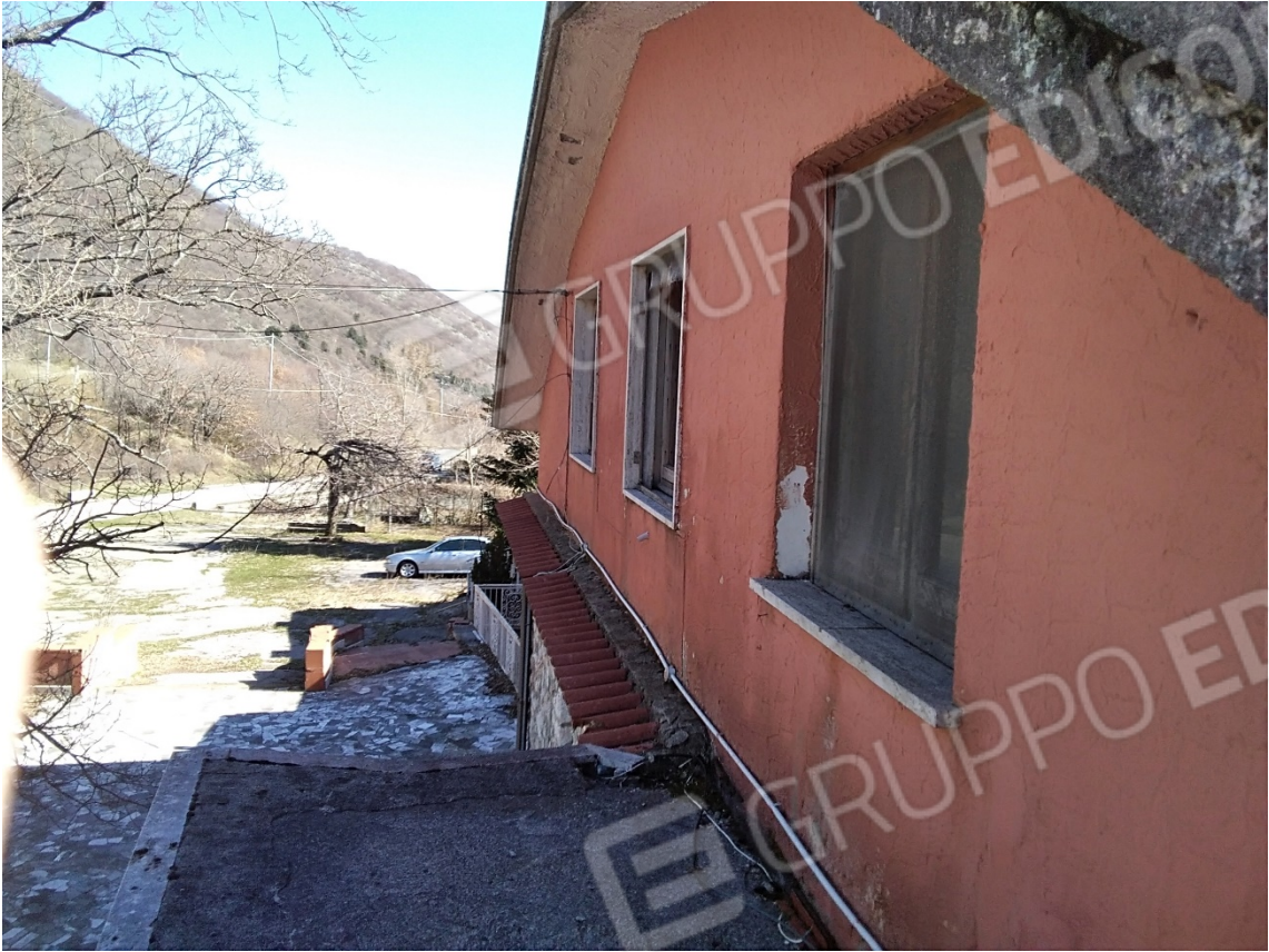
N31_PROSPETTO ANTERIORE APPARTAMENTO_PIANO PRIMO