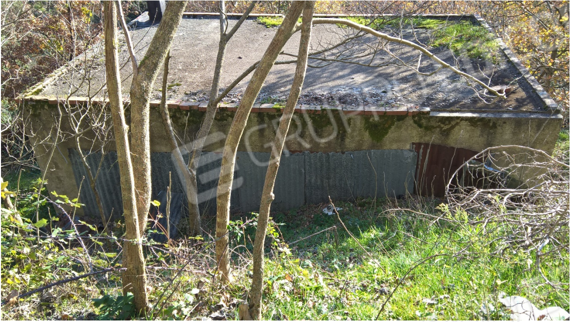
N17_DEPOSITO_PIANO DI CAMPAGNA