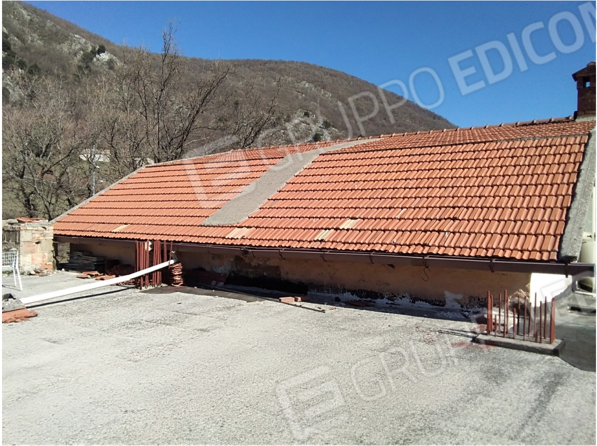
N33_COPERTURA PRIMO PIANO