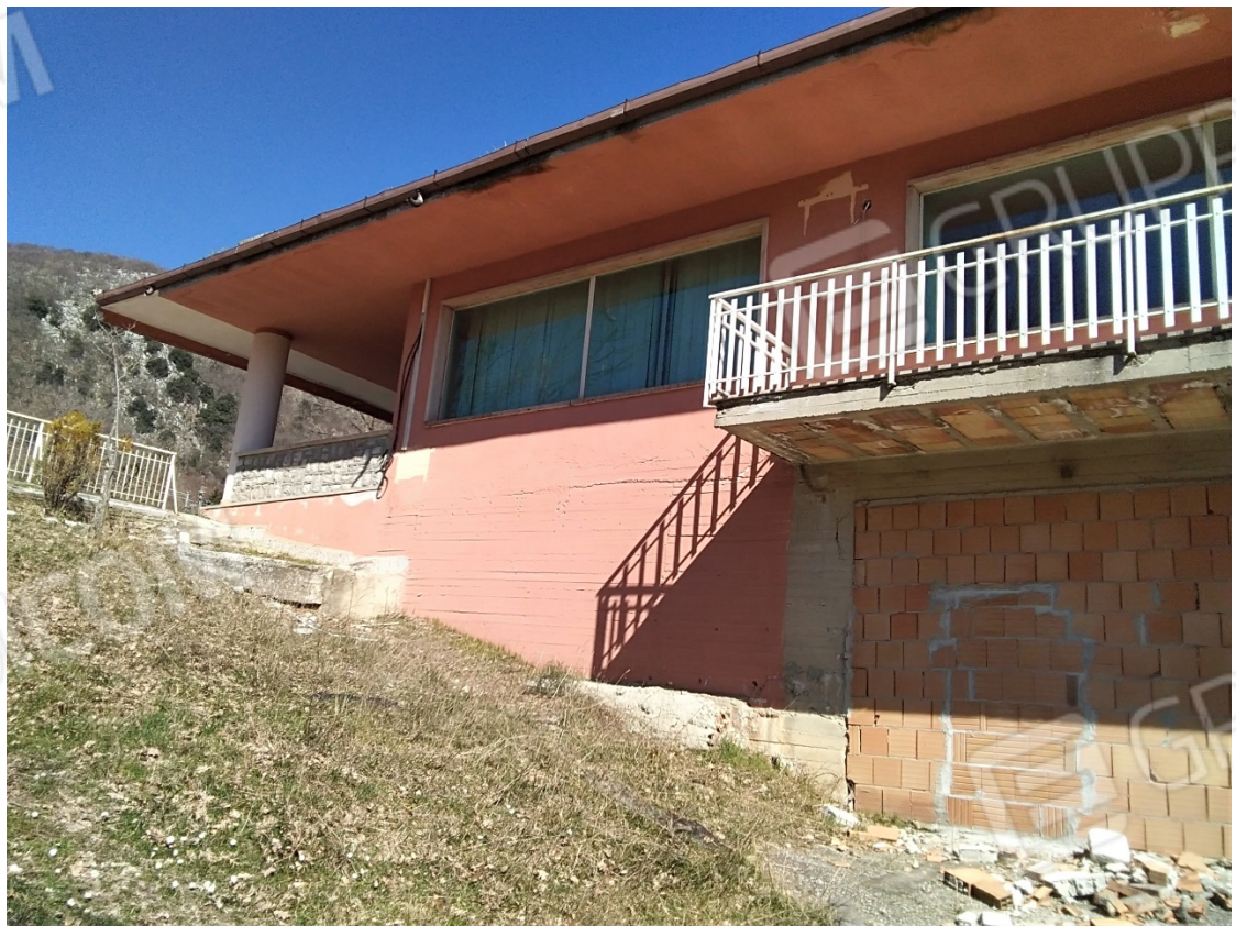
N8_PROSPETTO LATERALE OVEST (PORTA CHIUSA)