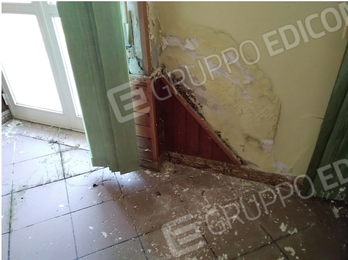
N21_SALA RISTORANTE_PIANO TERRA_AREA AMPLIAMENTO