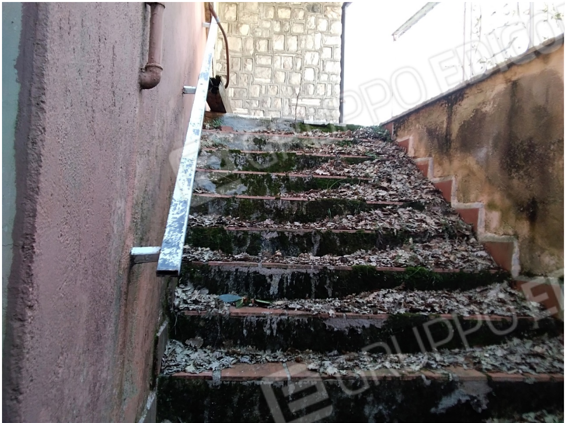
N29_SCALA ESTERNA DI ACCESSO AL PIANO SEMINTERRATO 1°