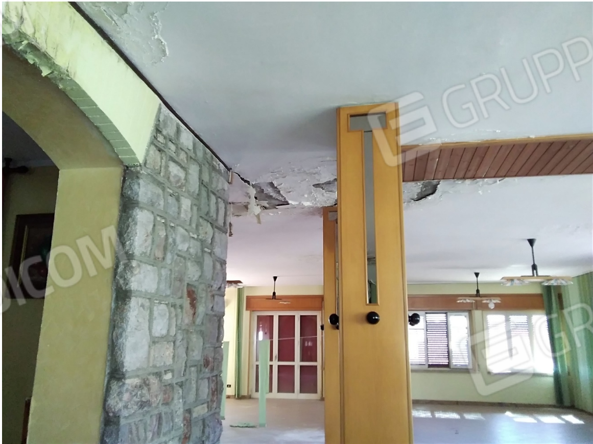
N20_SALA RISTORANTE_PIANO TERRA