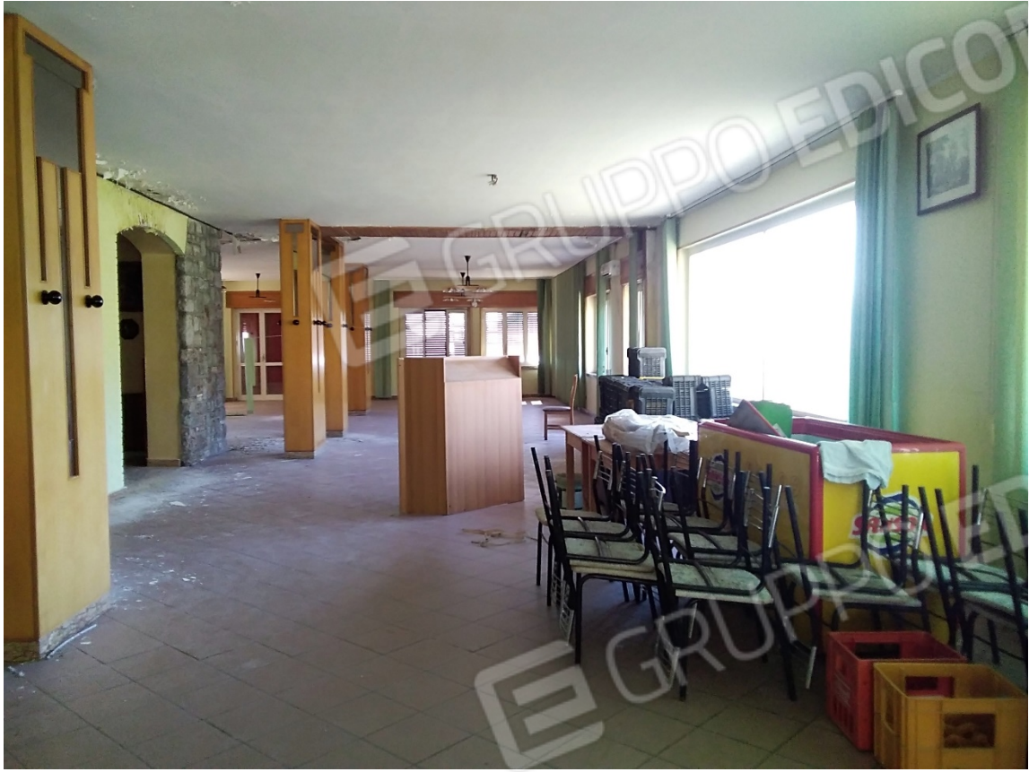
N19_SALA RISTORANTE_PIANO TERRA