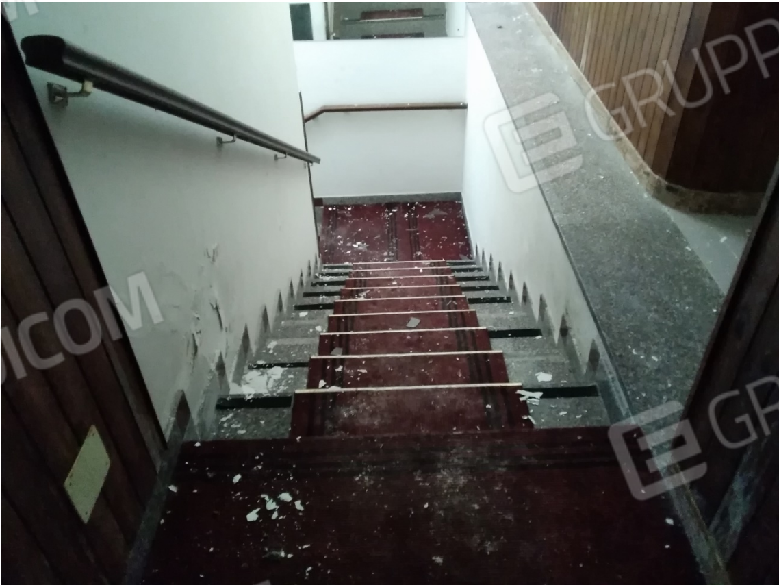
N26_SCALA DI ACCESSO AI SERVIZI DEL PIANO SEMINTERRATO 1°