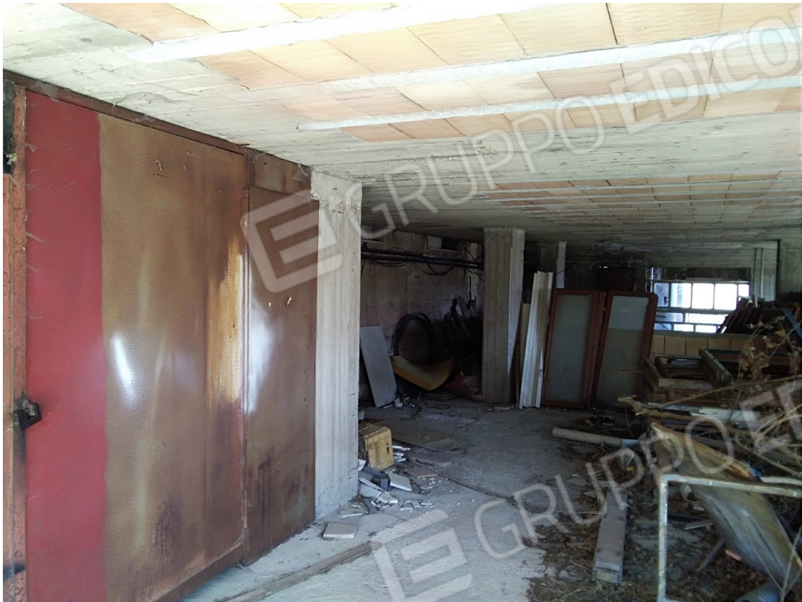
N13_DEPOSITI PIANO SEMINTERRATO 2°