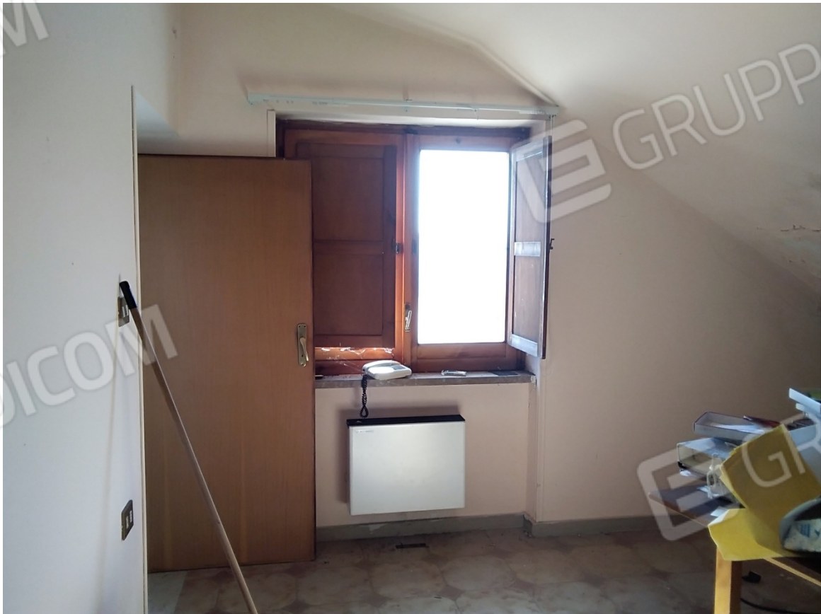
N 40_STUDIO_PIANO PRIMO