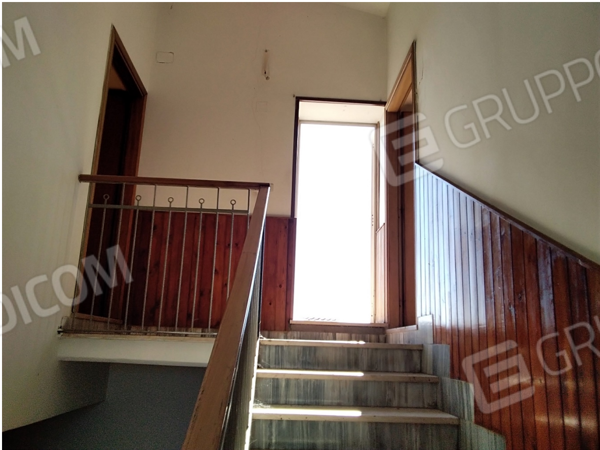
N34_VANO SCALA_INGRESSI PIANO PRIMO