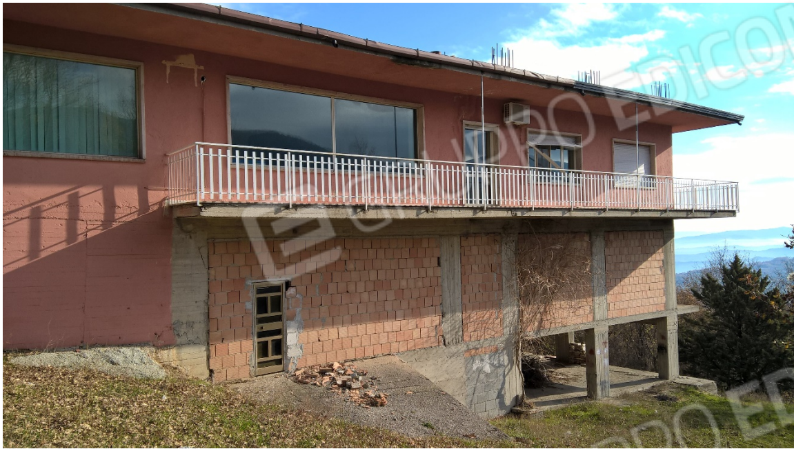
N9_PROSPETTO LATERALE OVEST_(PORTA APERTA)