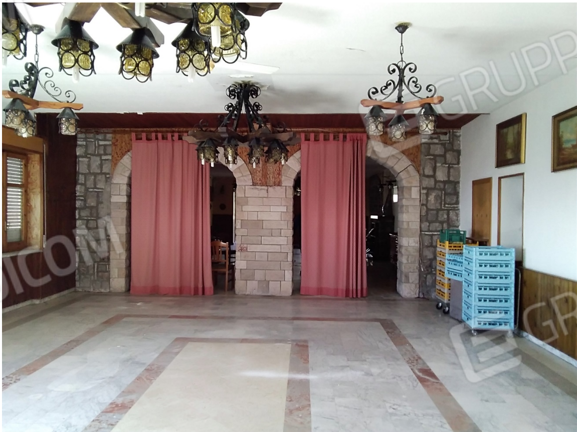
N22_SALA RISTORANTE_PIANO TERRA