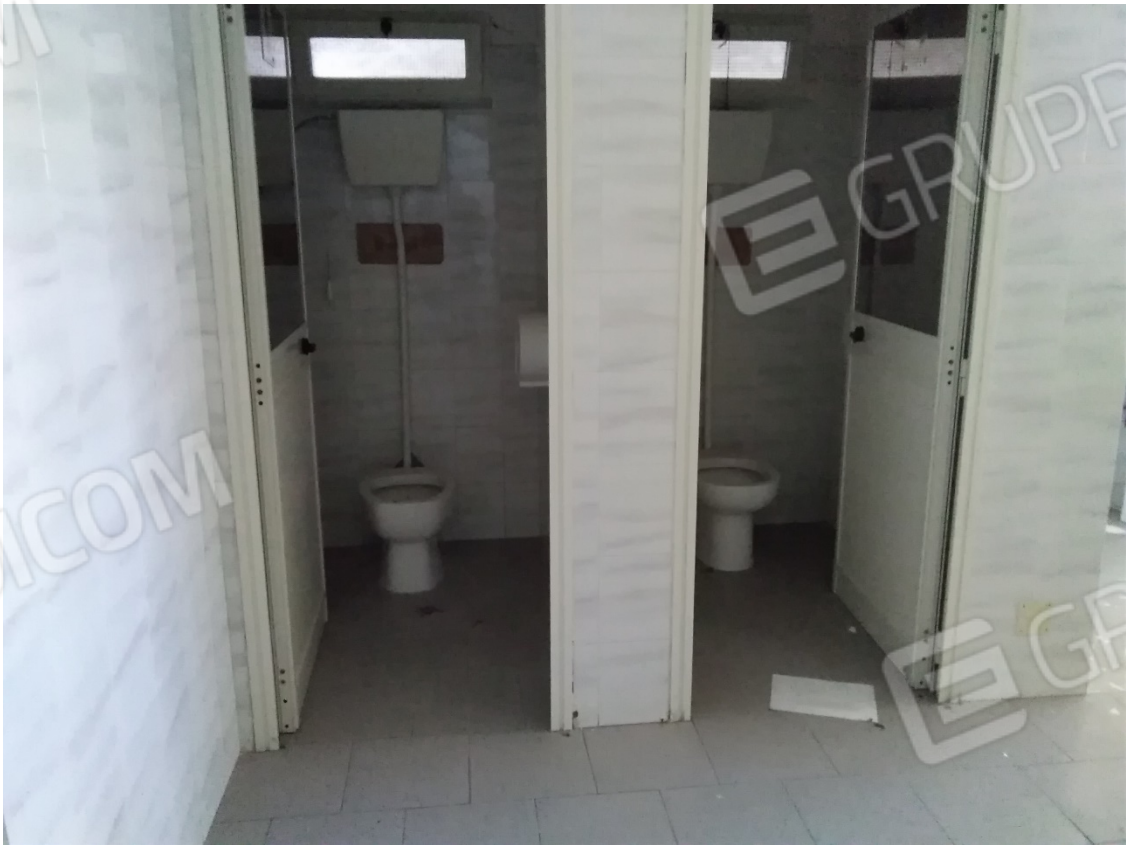
N28_SERVIZI_PIANO SEMINTERRATO 1°