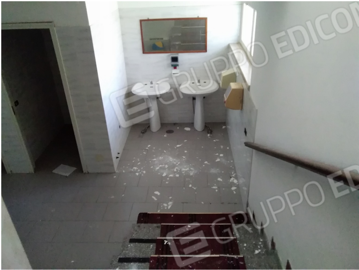
N27_SERVIZI_PIANO SEMINTERRATO 1°