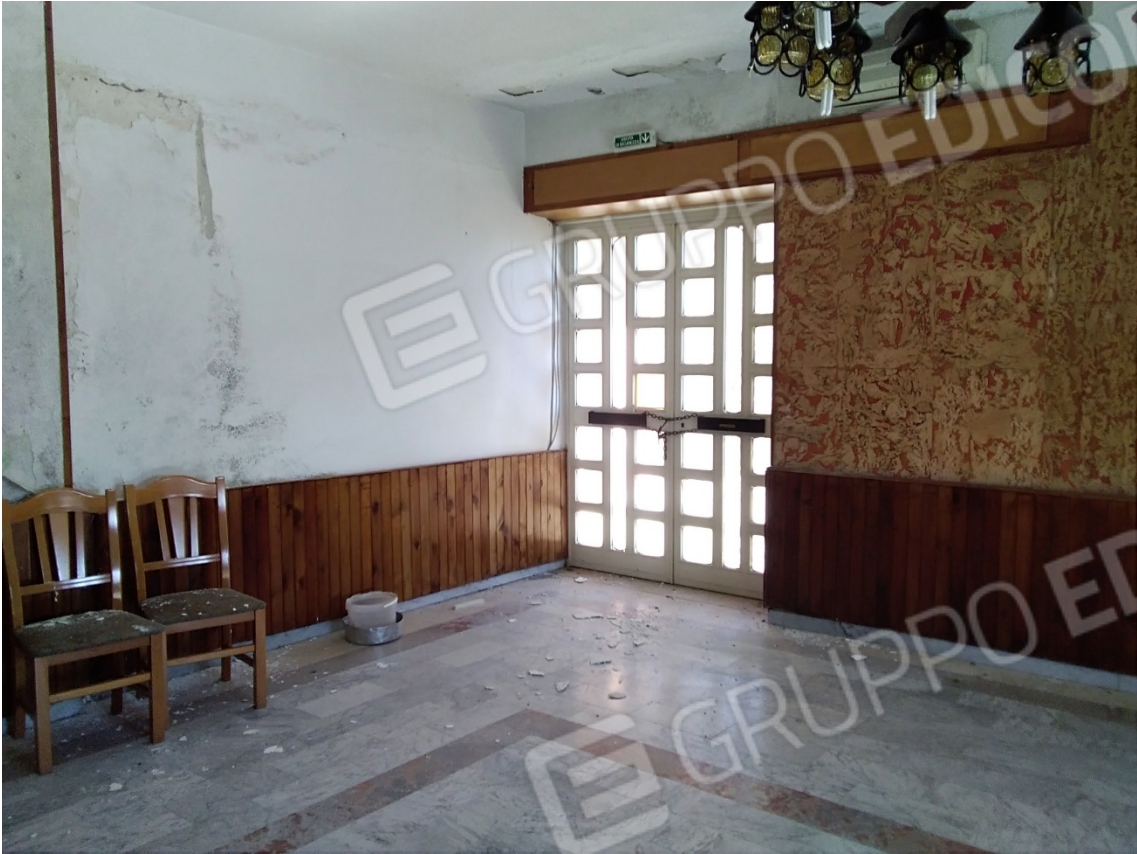
N23_SALA RISTORANTE_PIANO TERRA_INGRESSO LATO EST