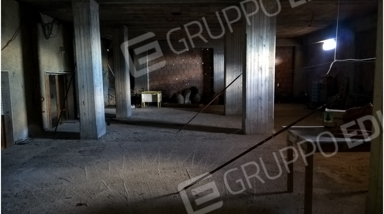
N15_DEPOSITO_PIANO SEMINTERRATO °