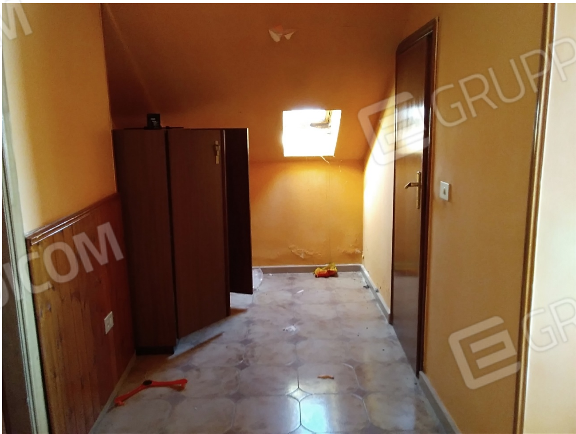
N36_DISIMPEGNO -PIANO PRIMO