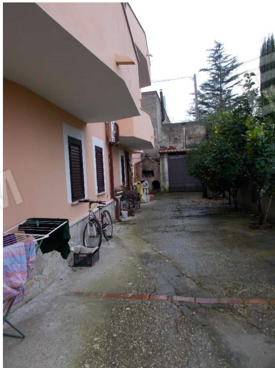
Foto n. 4 (Spazio cementato antistante il Piano S1 e Ingresso esterno Piano S1)