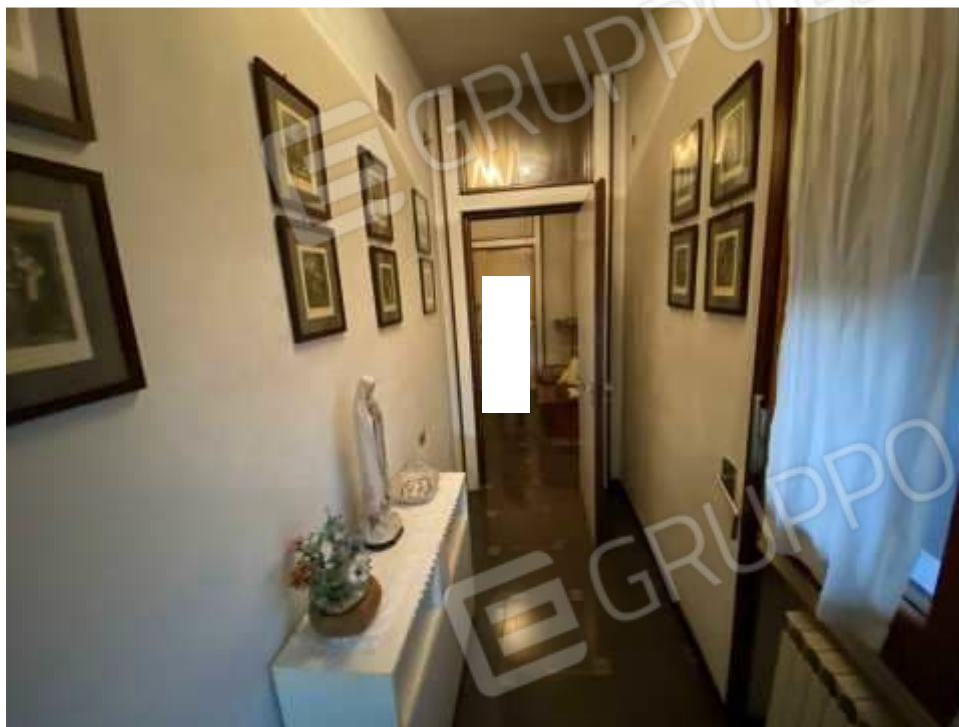
FOTO N. 3 Ingresso appartamento