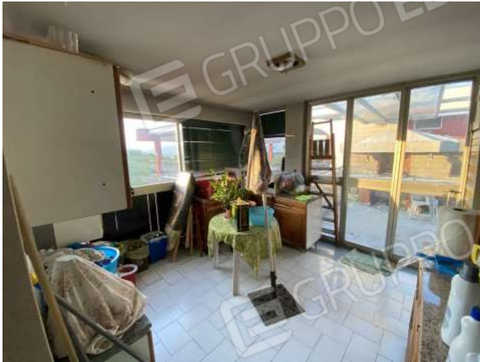
FOTO N. 9 VERANDA