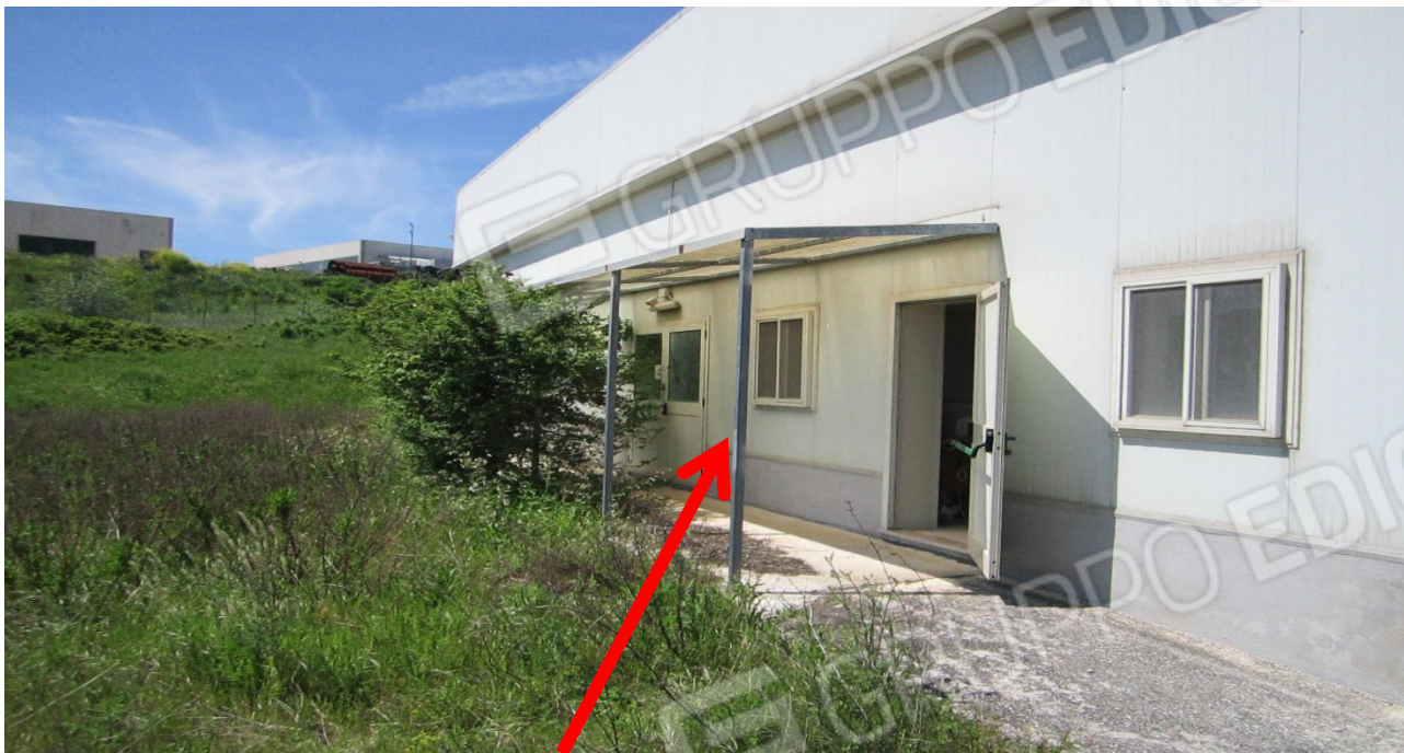
Tettoia realizzata in profilati in ferro e copertura in plexiglas in assenza di autorizzazione