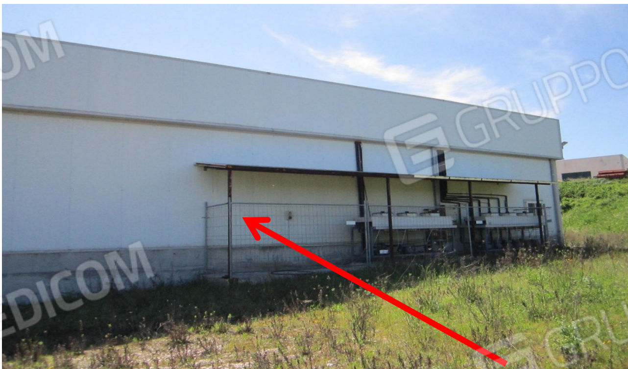
Tettoia realizzata in profilati in ferro e copertura in lamiera per ricovero Compressori in assenza di autorizzazione