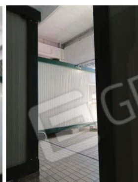
foto da 55 a 58: (ex sala lavorazione ora adibita ad attività di logistica) ....