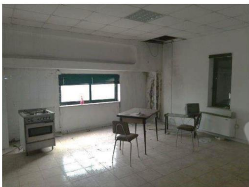
foto 35: ...Sala guardiania al 27.10.2022