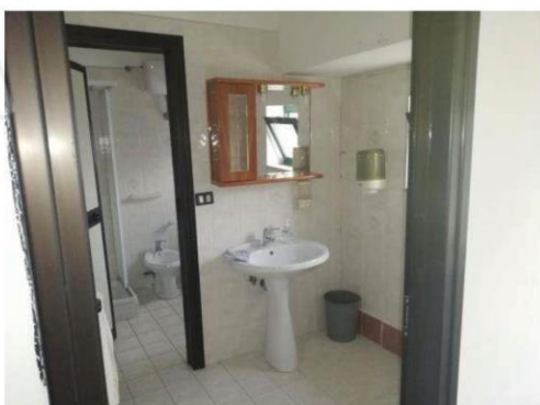
foto 37: ...Sala guardiania al 27.10.2022