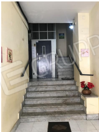
Androne. Veduta dal portone verso le scale e l'ascensore