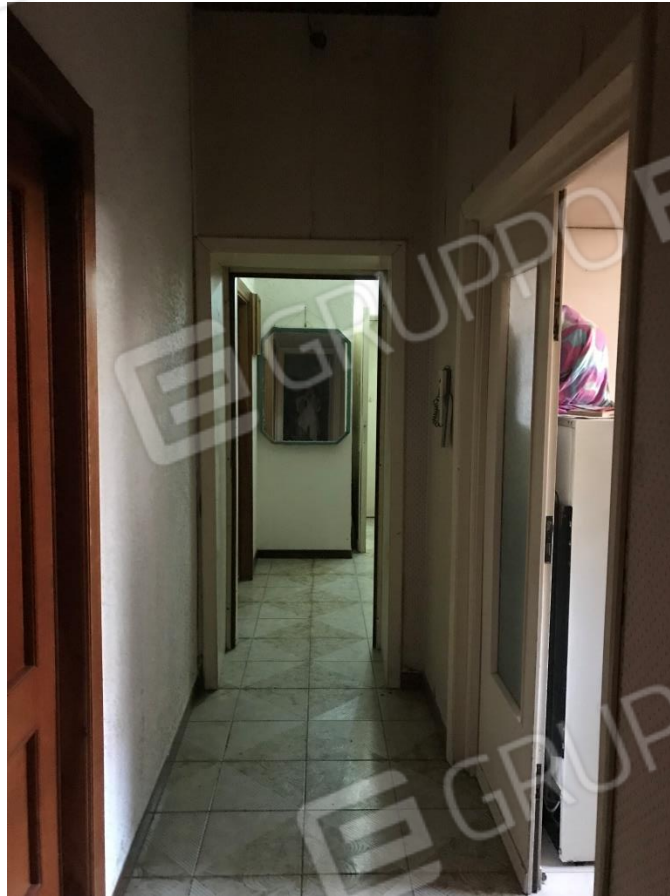
Disimpegno 1. Veduta verso l'ingresso