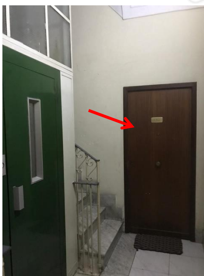
Si evidenzia la porta d'ingresso dell'immobile staggito