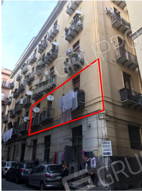
Prospetto principale su via Niutta. Si evidenzia l'immobile staggito