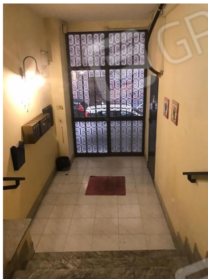
Portone su via Niutta. Veduta dalle scale verso l'androne