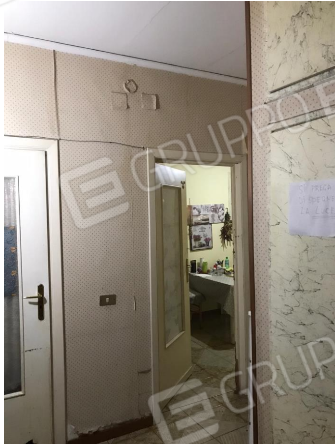
Stanza 5. Veduta dal disimpegno 2