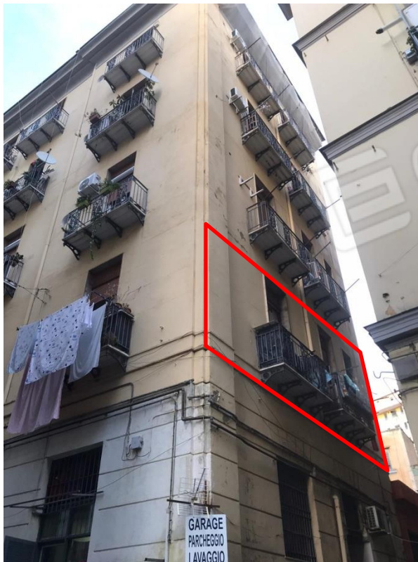
Prospetto sul Vico Palazzo Due Porte. Si evidenzia l'immobile staggito