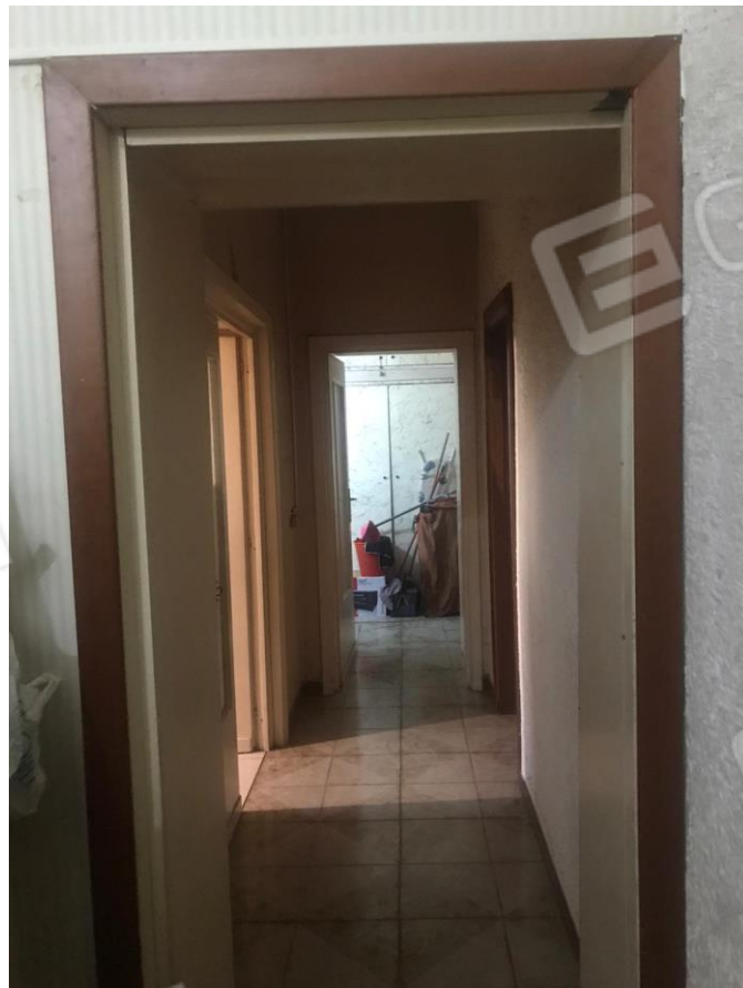
Disimpegno 1. Veduta dall'ingresso