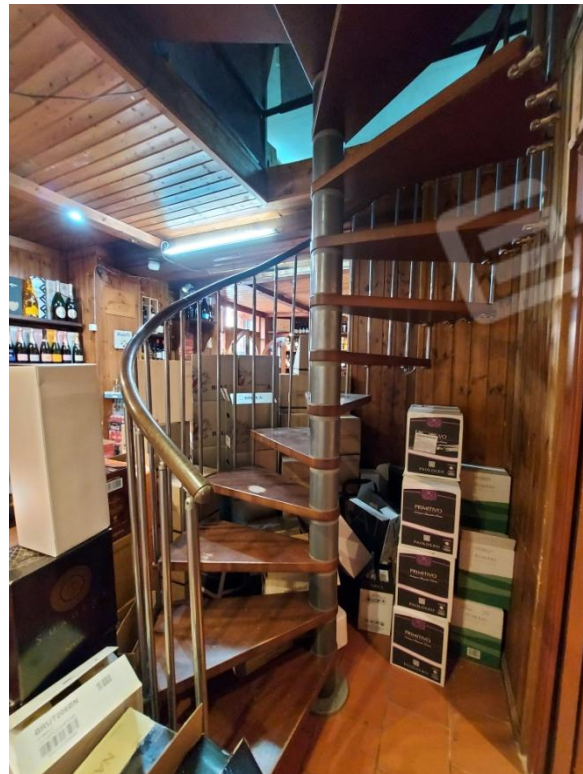
Scala che conduce al soppalco