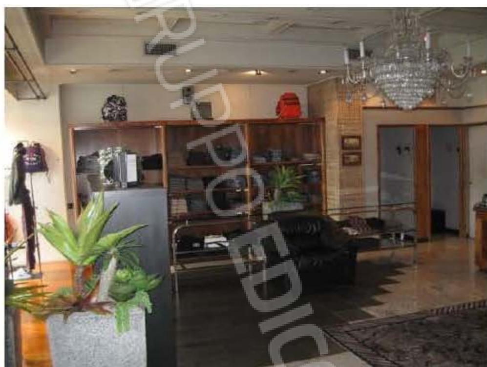
viste interne del bene pignorato verso l'ingresso di Via Riviera di Chiaia