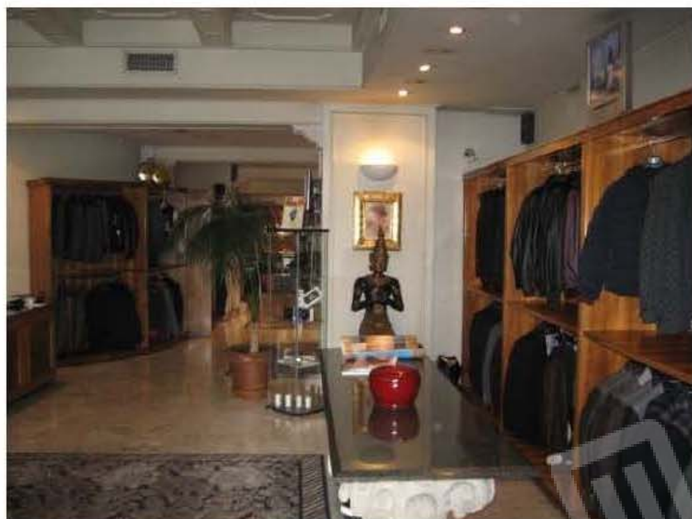
viste interne del bene pignorato entrando da Via Riviera di Chiaia