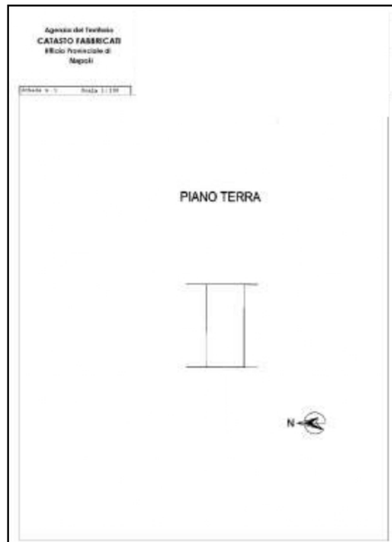
Planimetria catastale posto auto