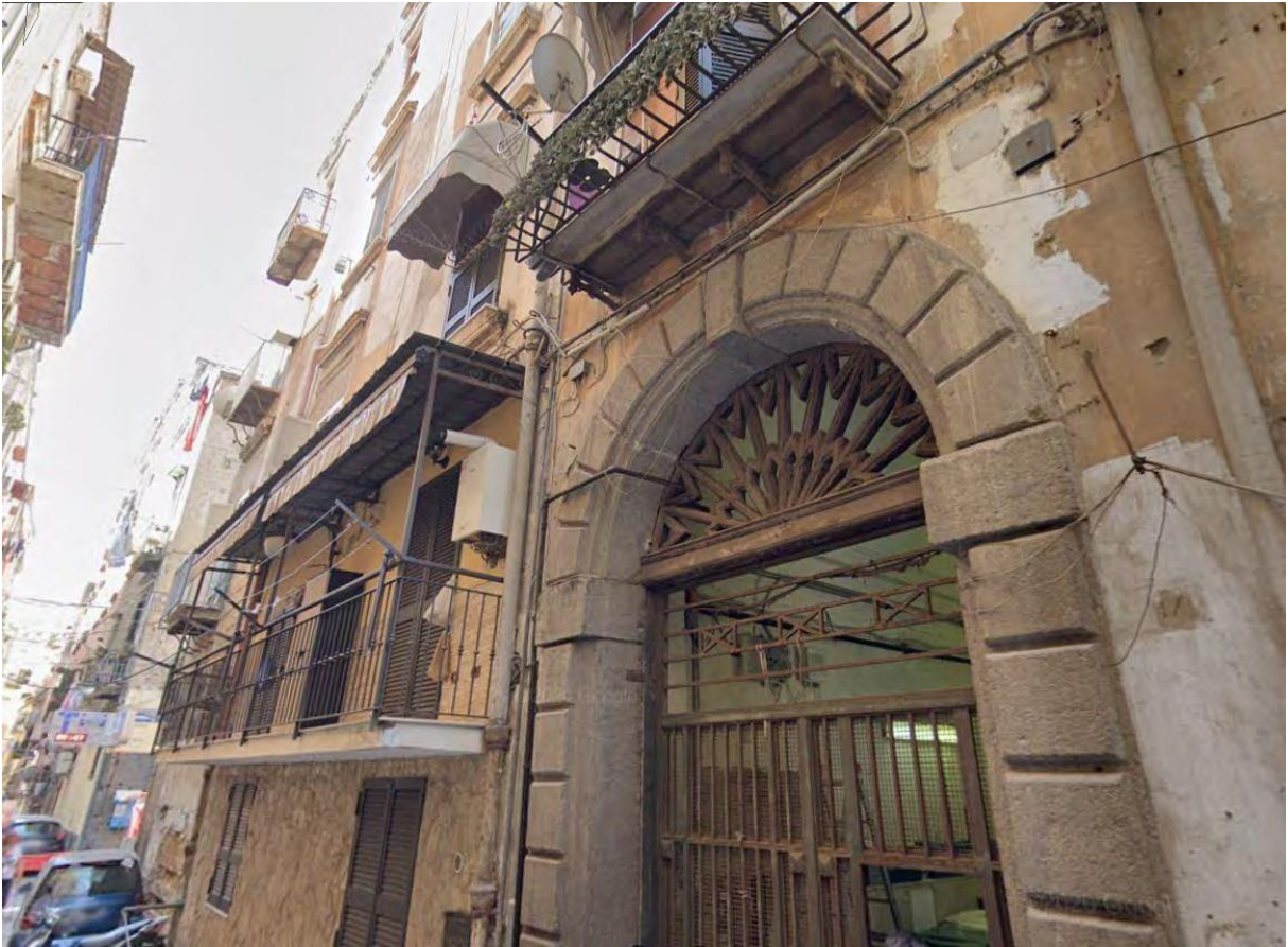
Accesso da vico Lungo Trinità degli Spagnoli n. 47