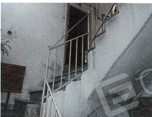
PORTA DI CAPOSCALA