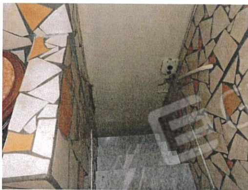
RAMPA DI ACCESSO