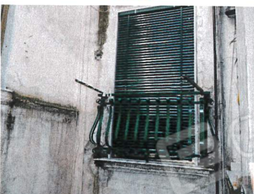
AFFACCIO CAMERA SU CORTILE