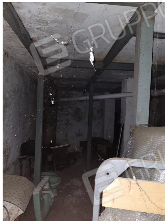
Vista locale deposito interrato