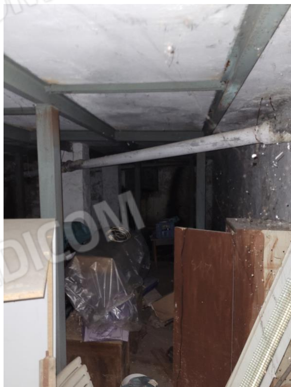
Vista locale deposito interrato