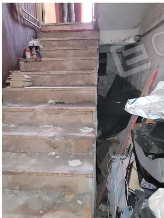
Vista ingresso del cespite