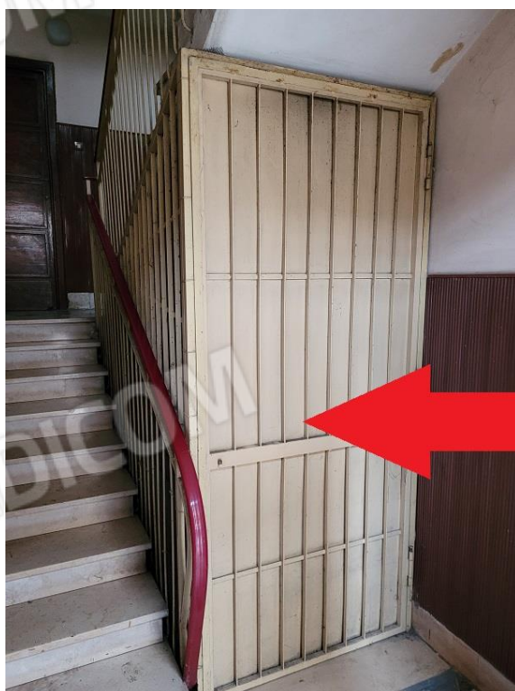
Vista cancello di ingresso allo stabile