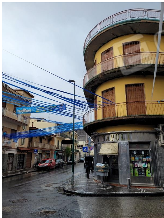
Vista da Via Vittorio Veneto