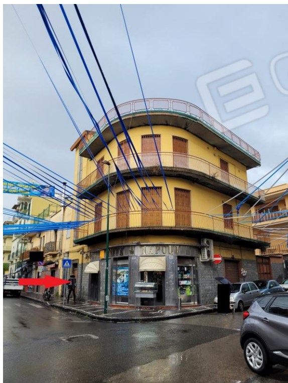
Individuazione vano di accesso allo stabile