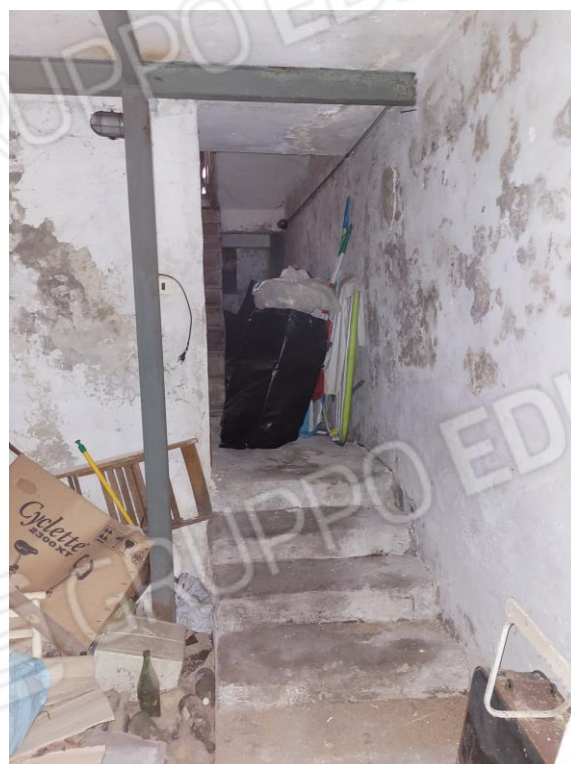
Vista locale deposito interrato