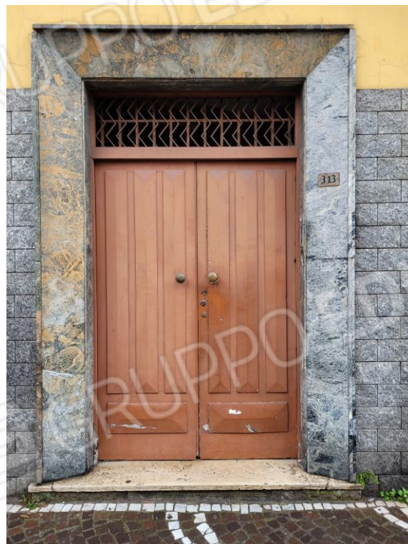
Vista portone di ingresso allo stabile