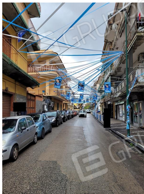
Vista 1° traversa di Via Vittorio Veneto