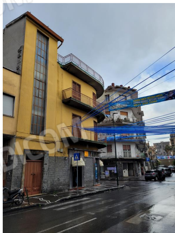
Vista immobile da Via Vittorio Veneto