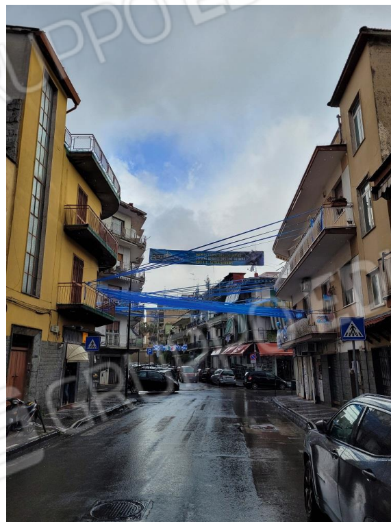
Vista di Via Vittorio Veneto